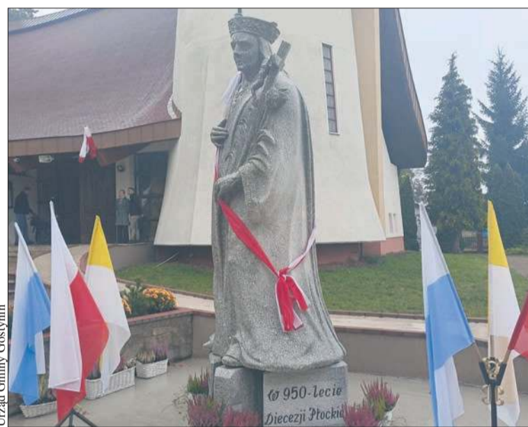
Figura św. Kazimierza przed kościołem w Lucieniu

Uczniowie z LO Kościuszki w Gostyninie odwiedzili Płock