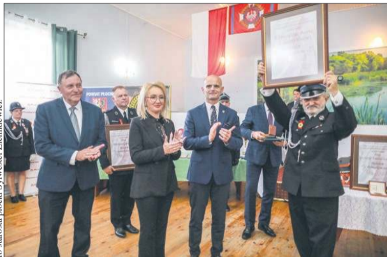
Jednostka w Zdziarze Wielkim została odznaczona Medalem Pamiątkowym „Pro Masovia”

To było wyjątkowe wydarzenie nie tylko dla strażaków, ale i dla lokalnej społeczności. Wszak nie codziennie obchodzi się tak piękny i uroczysty jubileusz, który był okazją nie tylko do wspomnień i wspólnego świętowania, ale także refleksji nad tym, jak ogromną rolę odgrywają jednostki OSP w życiu społeczeństwa. Był to też czas pamięci i docenienia wszystkich tych, którzy na przestrzeni wieku budowali i rozwijali jednostkę