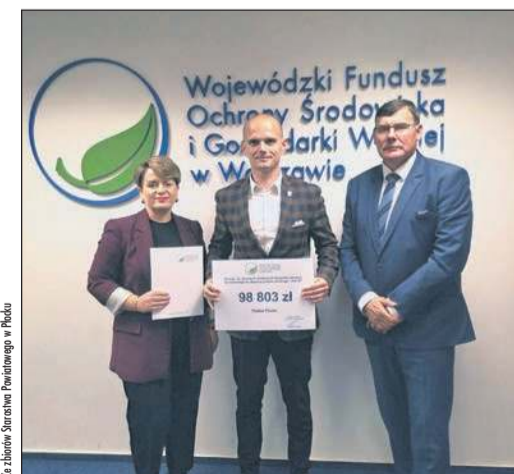
Powiat Płocki właśnie pozyskał środki na działania proekologiczne