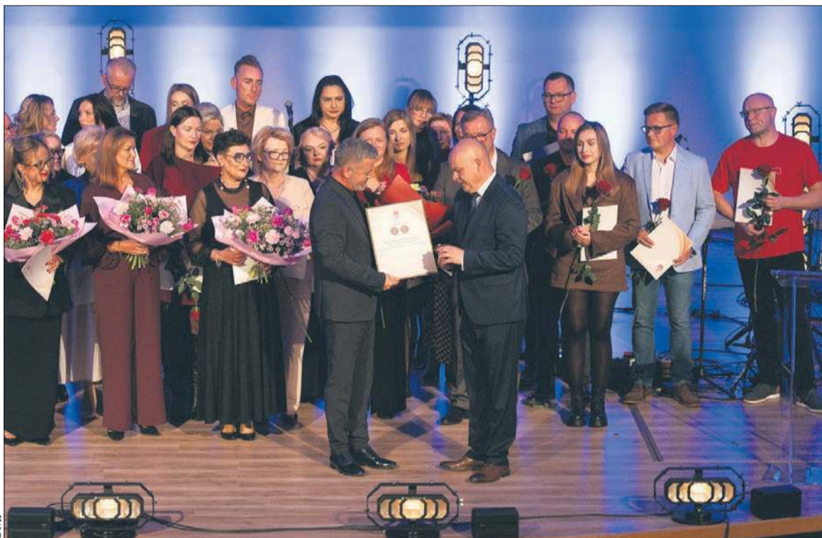
Podczas jubileuszowej gali pracownicy POKiS zostali uhonorowani odznaczeniami i medalami przyznanymi przez Ministerstwo Kultury i Dziedzictwa Narodowego, prezydenta Płocka, marszałka województwa mazowieckiego