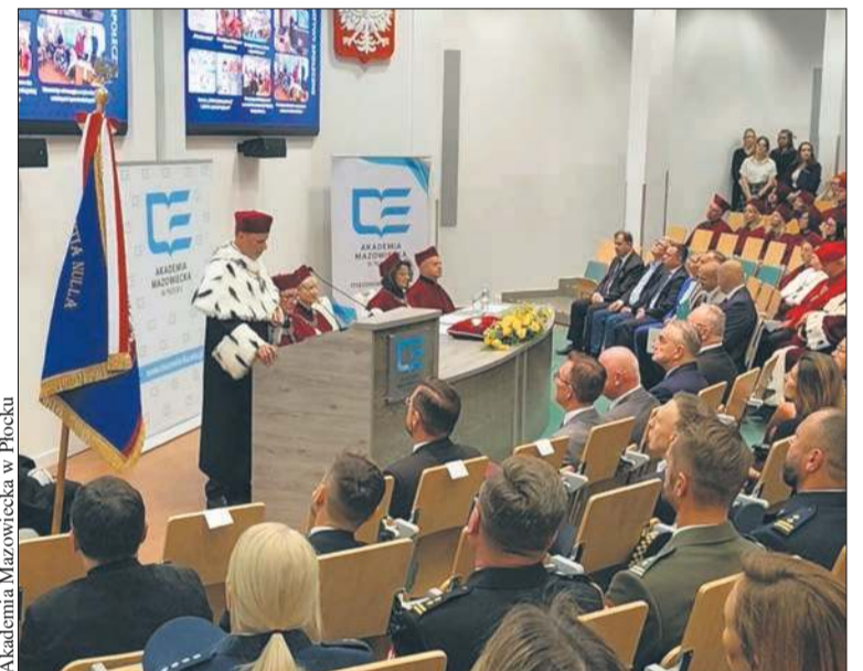
Akademia Mazowiecka w Płocku

W nowym roku akademickim na I roku studiów naukę rozpoczęło 811 studentów. Łącznie w Akademii Mazowieckiej kształcą się 2043 osób