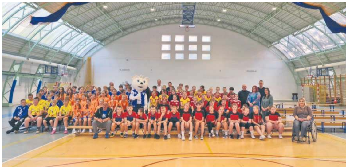
W turnieju udział wzięło 100 uczniów szkół podstawowych z terenu Powiatu Płockiego

W hali sportowej w Wyszogrodzie odbył się III Turniej Powiatowej Akademii Piłki Ręcznej. W rozgrywkach udział wzięło 100 uczniów szkół podstawowych z terenu Powiatu Płockiego, uczestników Akademii.