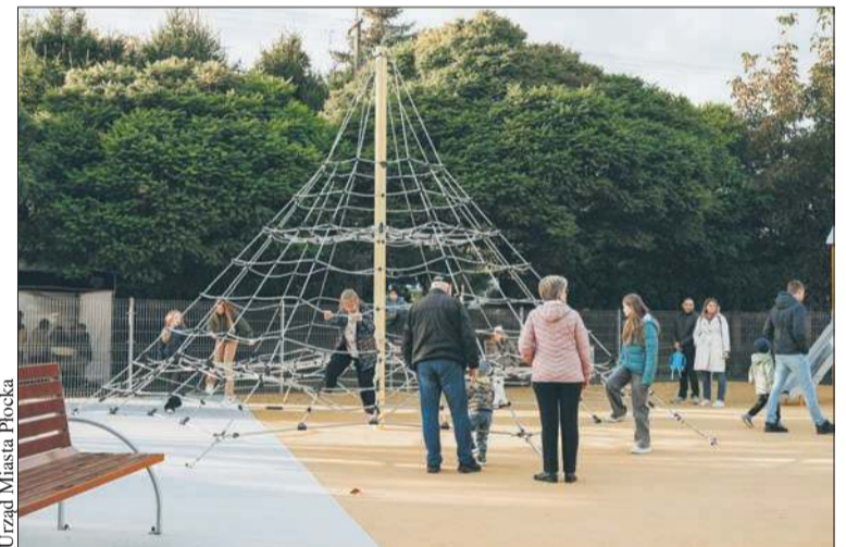
Nowy plac zabaw przy ulicy Parkowej w Górach

W przypadku projektów osiedlowych zastosowano dwie listy: procentową – opartą na stosunku liczby głosów do liczby mieszkańców danego osiedla oraz rankingową – opartą na bezwzględnej liczbie głosów. Warunkiem realizacji było zdobycie co najmniej 50 głosów. Na każdą z list przeznaczono po 2 326 050 zł (łącznie 4 652 100 zł). Do realizacji zakwali-