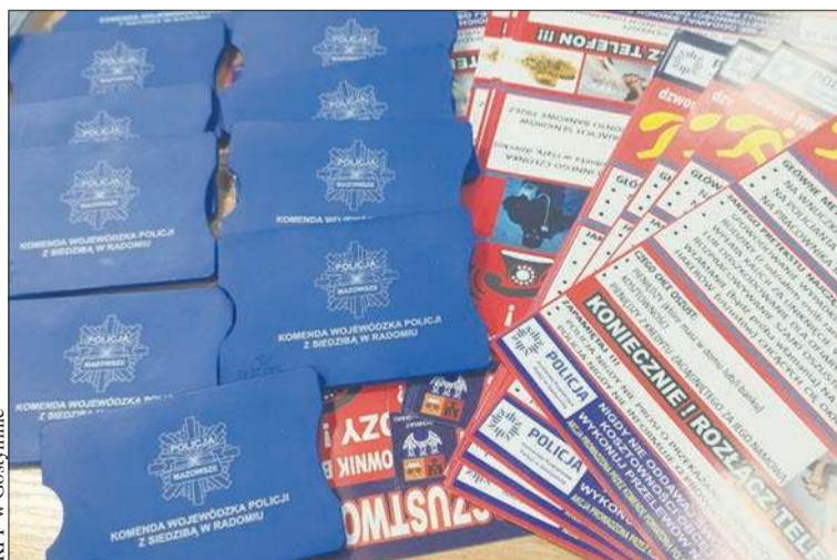
W ramach akcji do seniorów trafiły m.in. materiały informacyjne