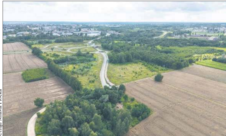
Urząd Miasta Płocka