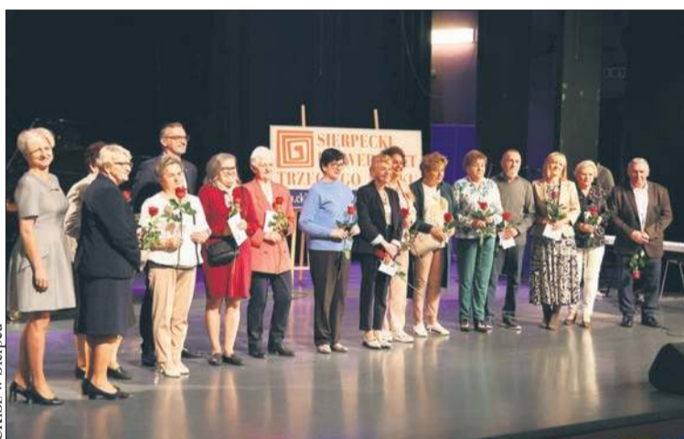
CKiSz w Sierpcu

Inauguracja nowego roku akademickiego była okazją do podkreślenia wielkiego znaczenia Uniwersytetów Trzeciego Wieku zarówno w aspekcie edukacyjnym, jak i integracyjnym,