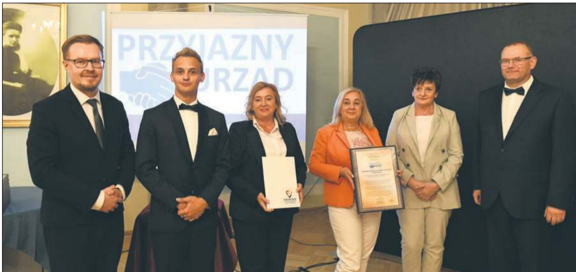
Gminny Ośrodek Pomocy Społecznej w Mochowie podczas X jubileuszowej edycji Ogólnopolskiego Konkursu o Znak Jakości „Przyjazny Urząd” został w dniu 22 września 2025 roku uhonorowany Certyfikatem „Przyjazny Urząd 2025” nadanym przez Europejskie Centrum Badań Nad Jakością