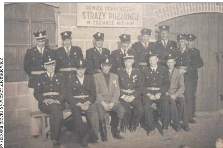
Najstarsza fotografia ochotników będąca w posiadaniu OSP w Zdziarze Wielkim