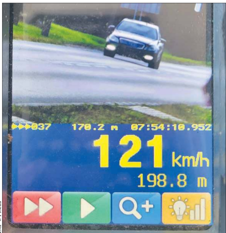
Policjanci z płockiej grupy SPEED zatrzymali 25-latkę, który w obszarze zabudowanym jechał ponad 120 km/h.

Gmina – Miasto Płock uzyskała dofinansowanie ze środków Unii Europejskiej na realizację projektu pn. „Budowa ulicy Przemysłowej – II etap obwodnicy północno-zachodniej miasta Płocka” w ramach programu Fundusze Europejskie dla Mazowsza 2021-2027, Priorytet IV – Fundusze Europejskie dla lepiej połączonego i dostępnego Mazowsza, Działanie 4.1 – Transport regionalny i lokalny, Typ projektów – Budowa i przebudowa dróg powiatowych i gminnych (jac)