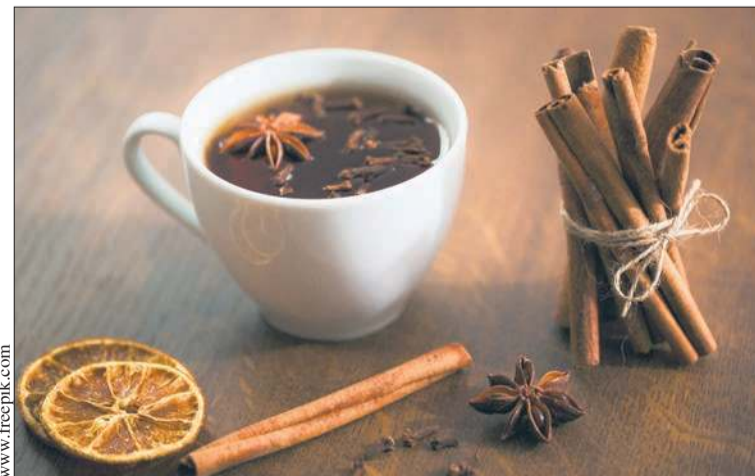
Rozgrzewająca herbata z przyprawami korzennymi i pomarańczą wprowadzi w dobry nastrój