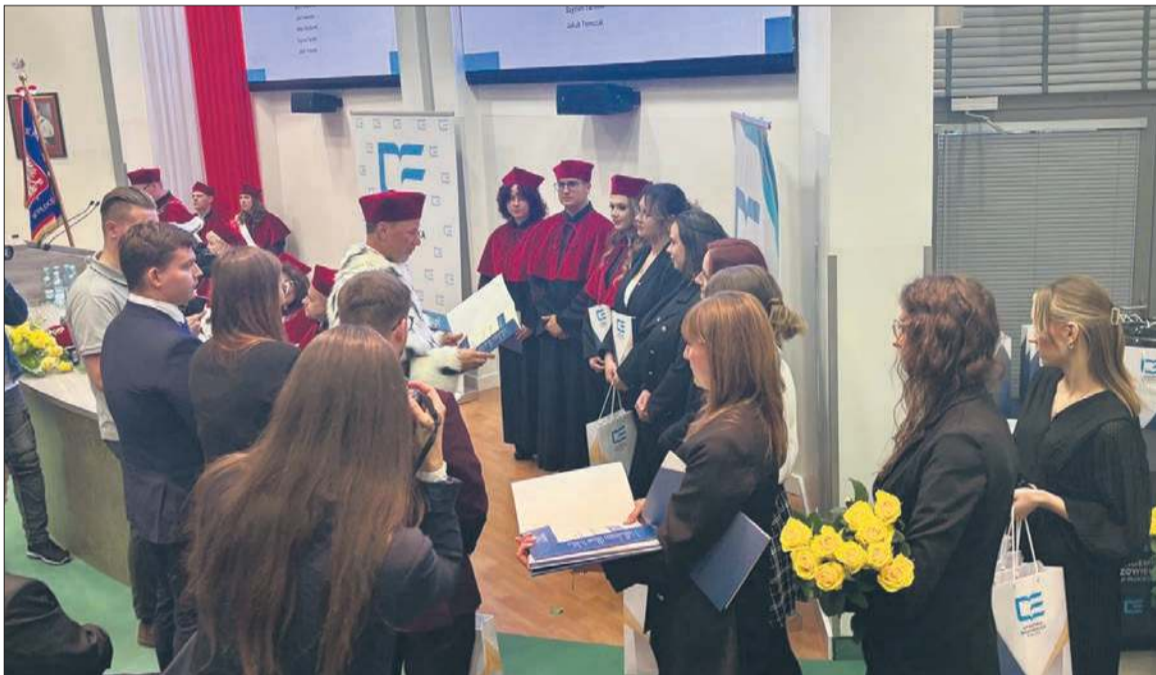
Akademia Mazowiecka w Płocku

W nowym roku akademickim na I roku studiów naukę rozpoczęło 811 studentów. Łącznie w Akademii Mazowieckiej kształcą się 2043 osób