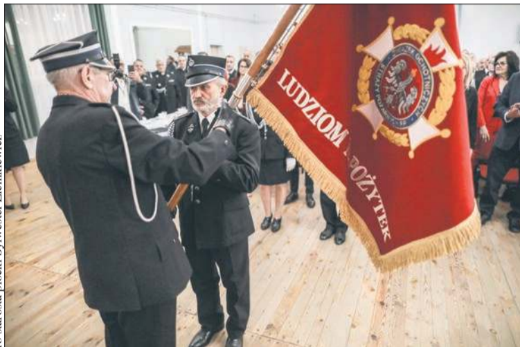
Uroczyste przekazanie nowego sztandaru