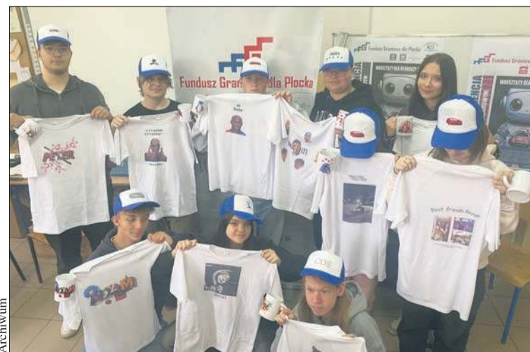
Podczas warsztatów uczestnicy wykonali m.in. nadruki na tekstyliach