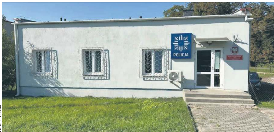
KMP w Płocku