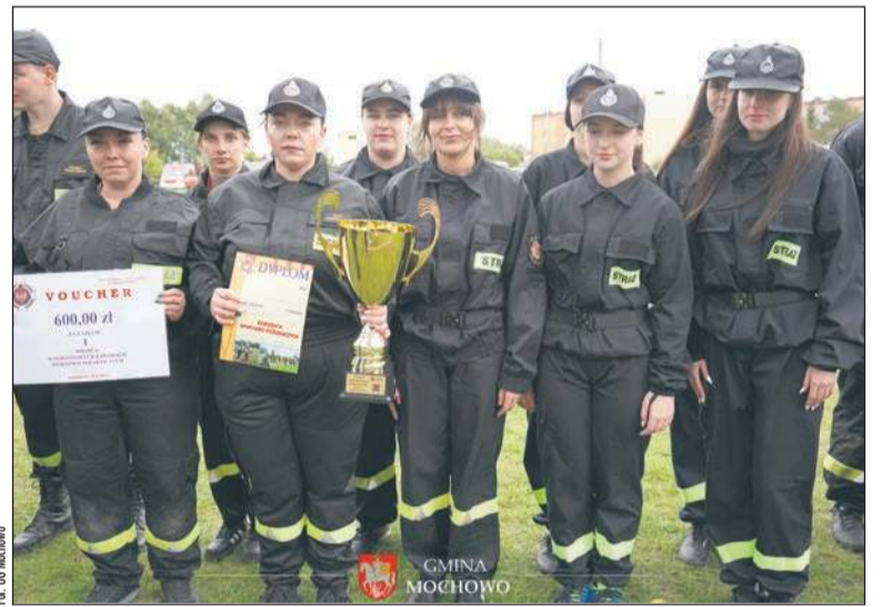
Drużyna kobieca OSP Zglenice Duże zajęła I miejsce w Powiatowych Zawodach Ochotniczych Straży Pożarnych powiatu sierpeckiego

Materiał przygotowany we współpracy z Gminą Mochowo