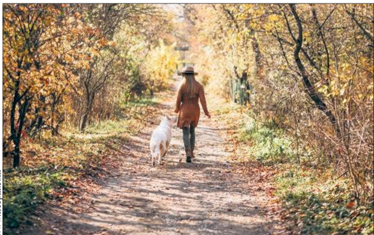
Spacer w jesienny dzień pomoże wzmocnić odporność i pozytywnie wpłynie na naszą psychikę