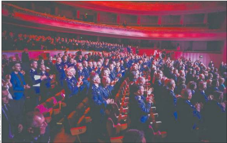
Na gali „ORLEN na straży” w Teatrze Wielkim zebrali się strażacy z całej Polski