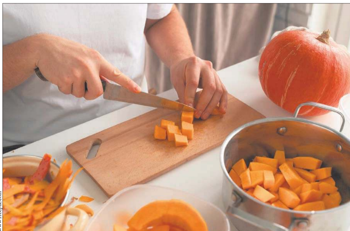
Sezon na dynię to doskonała pora na kulinarne eksperymenty

Nie bez znaczenia jest fakt, że jesień sprzyja zwolnieniu tempa. Długie wieczory są idealne, by zadbać o higienę snu i regularny odpoczynek. To czas, kiedy można ustabilizować rytm dnia, kłaść się wcześniej i regenerować siły.