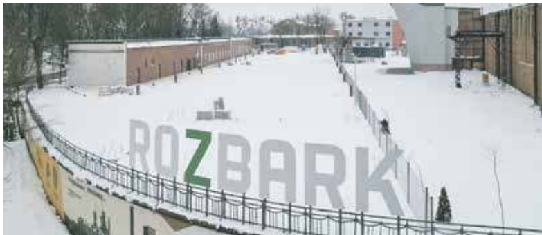
Remont budynku dawnej łaźni (w tle po lewej) to kolejny etap rewitalizacji pokopalnianych terenów

Prezes Skarpy, Dobromir Bujak mówi: - Odbudowa budynku dawnej kopalnianej łaźni, to jeden z czterech realizowanych projektów przez KS Skarpę Bytom na terenach dawnej kopalni Rozbark - mówi Dobromir Bujak, prezes Skarpy Bytom. - Obiekt będzie przeznaczony na cele kulturalne, gastronomiczne oraz gospodarcze, ale będzie spełniał także funkcje społeczne. Tym samym jego powstanie