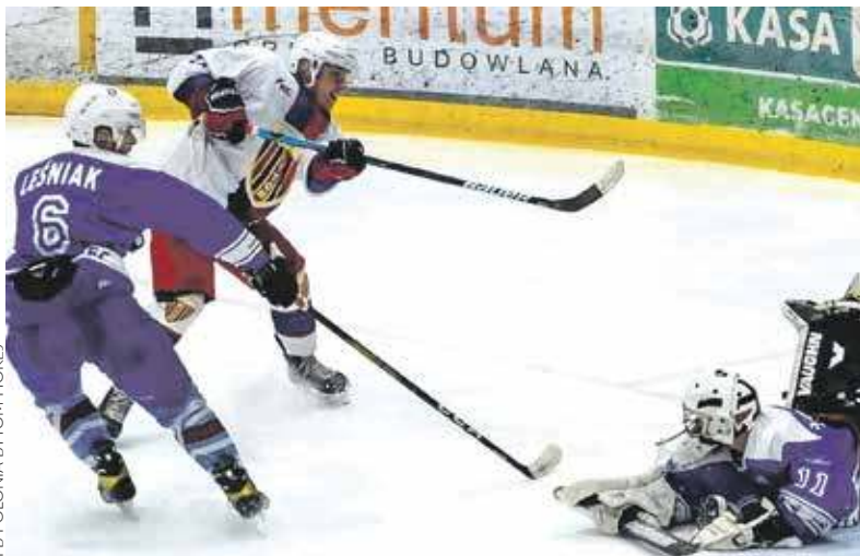
Hokeiści Polonii Bytom sezon zasadniczy mają już za sobą. Teraz czas na play-off

Hokeiści bytomskiej Polonii zakończyli sezon zasadniczy i szykują się do rywalizacji w play-off. Hokeistki także, ale gros z nich najpierw w dalekiej Japonii razem z polską kadrą powalczą o prawo gry na igrzyskach olimpijskich.