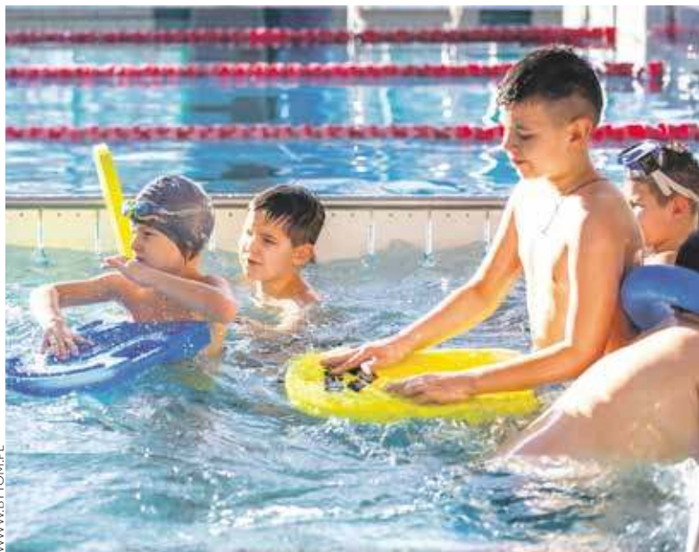
Przedшкоłaki i uczniowie będą mogli codziennie podczas ferii skorzystać z darmowej godziny w pływalni krytej

Oprócz tego, bardzo atrakcyjną ofertę półkolonii ma także Klub Relaks Bytomskiej Spółdzielni Mieszkaniowej. Podczas dwóch turnusów (17-21 lutego i 24-28 lutego) dzieci i młodzież spędzą czas przy grach planszowych, wezmą udział w warsztatach oraz wyjadą do kina i do aquaparku, a także sali zabaw.