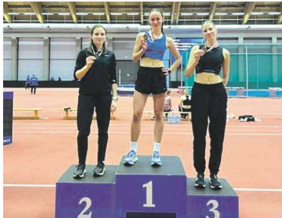
Bytomianie często stawali w Ostrawie na podium