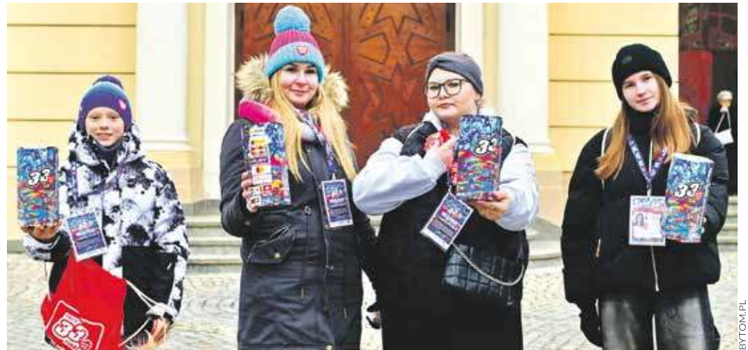
Datki do puszek WOŚP zbierało u nas ponad dwustu wolontariuszy

Z kolei na placu Sobieskiego, na który specjalnie zwieziono masy śniegu i ustawiono tam