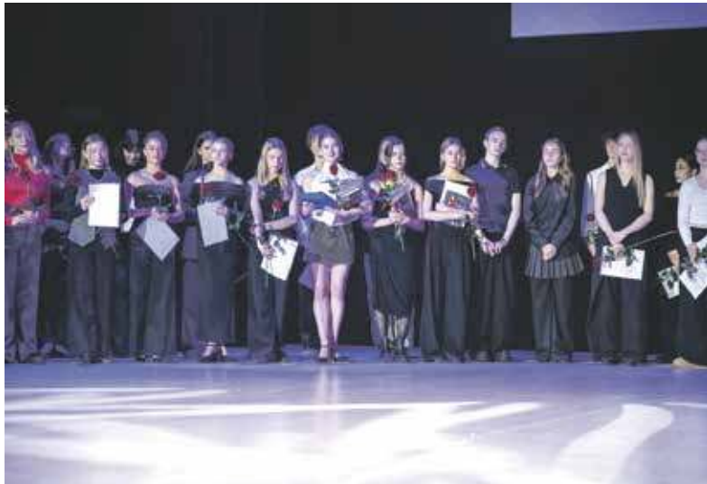
Laureaci na scenie Beceku

PRZEZ CZTERY DNI BYTOM BYŁ STOLICĄ MŁODEJ CHOREOGRAFII. SWOJE PRACE ZAPREZENTOWAŁO 127 MŁODYCH ADEPTÓW SZTUKI TAŃCA.