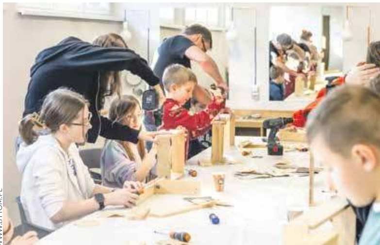
W Bytomskim Centrum Kultury nie zabraknie warsztatów zarówno dla dzieci, jak i młodzieży

W tych samych terminach i godzinach dwie odsłony półkolonii zaplanowano też w Młodzieżowym Domu Kultury nr 1 przy Powstańców Warszawskich 12. W programie są warsztaty plastyczne, teatralne, muzyczne i sportowe. Nie zabraknie też wyjść i wycieczek.