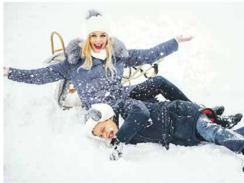
Jak śniyg w końcu śleci, to nuy siedźcie w doma, ino ciście zaroz na plac

Downi bez zima uciechy na placu mielimy mocka. Szło sie ciepać kulkami, lepić bałwana, a jak śniyg sie zrobił taki barzi mokry, to nawet rychtuwać srogie igło, ftoe w konskach przeczimało potym aze do wiosny. Do tego sanki. Robiylmy na górcie wyścigi, abo zawody, fto dali zajedzie na tych sankach - nojlepi gowom na dół. I jesce bitwy: jechało sie na sankach choby Ben Hur we rydwanie i paczało, jak innych co tyz jechali ściepnoć. Nuy ma co godać: tak do końca bezpieczne to