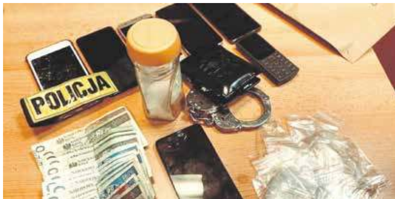
W mieszkaniu znaleziono między innymi narkotyki

Mundurowi pojawili się tam realizując czynności operacyjne i po to, by sprawdzić, czy jak wynika ze zdobytych