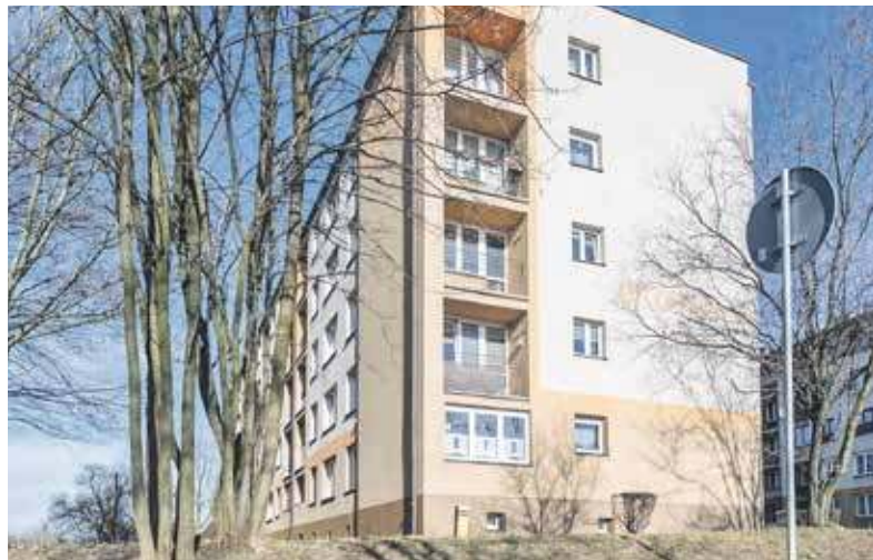
Łagiewnickie budynki będą ogrzewane dzięki OZE

PEC może mówić o sporym sukcesie, bo chętnych do zdobycia wsparcia było w naszym województwie dużo. Ostatecznie dofinansowanie otrzymały 74 projekty o łącznej wartości prawie 165 mln zł. W przypadku każdego z nich chodzi o budowę infrastruktury służącej do produkcji i magazynowania energii z odnawialnych źródeł na budynkach użyteczności publicznej.