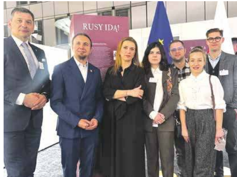
Wernisaż wystawy zgromadził wiele ważnych osób