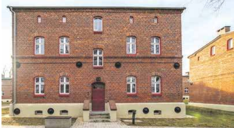
Stare familoki po remoncie wyglądają imponująco. Czy chciałbyś się w nich osiedlić?

Pierwsi lokatorzy już na osiedlu zamieszkali, teraz przyszedł czas na kolejnych. - Do tej pory mieszkania na terenie Kolonii Zgorzelec były zasie-