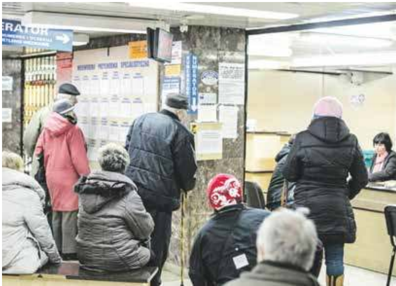
Grypa atakuje, w poradniach tłok