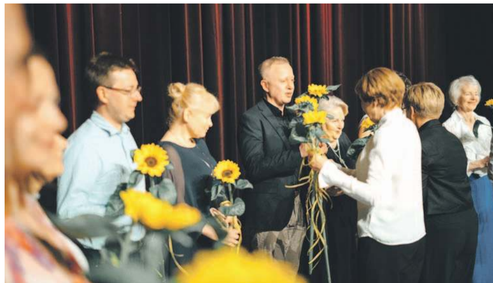
Seniorzy dziękowali instruktorom