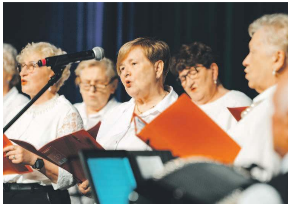
Był też popis umiejętności wokalnych