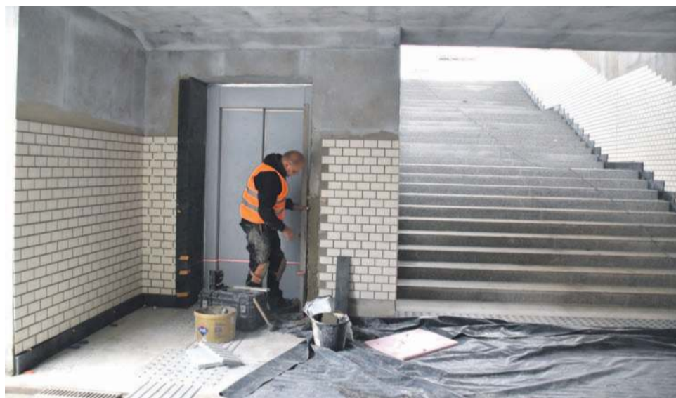
Wyjścia na perony i windy już są. Trwa wykańczanie

jednak wątpliwości, że drogę dojazdową dla samochodów i chodniki uda się zrealizować zgodnie z założeniami, chociaż - jak dodaje burmistrz - to najtrudniejsza budowa, którą do tej pory realizował. Nie ze względów technicznych, a formalno-prawnych.