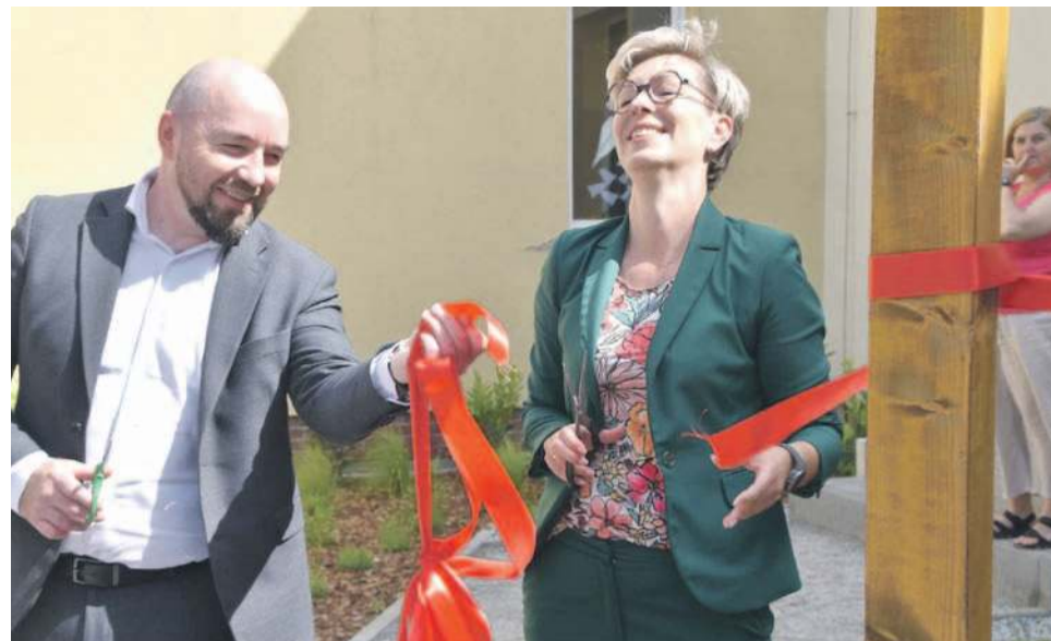
Symboliczną wstęgę, rozwiniętą wokół pergoli, przecinali przedstawiciele wszystkich instytucji, firm czy środowisk zaangażowanych w minkowski projekt