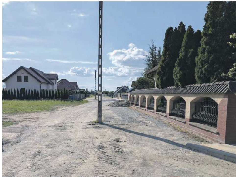
Bystrzyca, ulica Słoneczna. I co teraz?