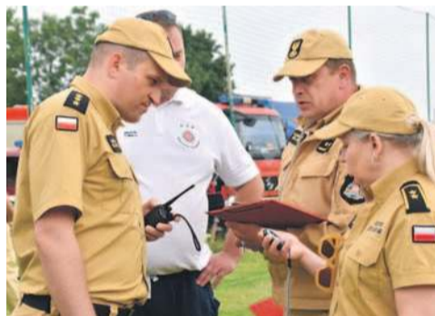
Nad prawidłowym przebiegiem zawodów czuwali zawodowi strażacy z PSP w Oławie