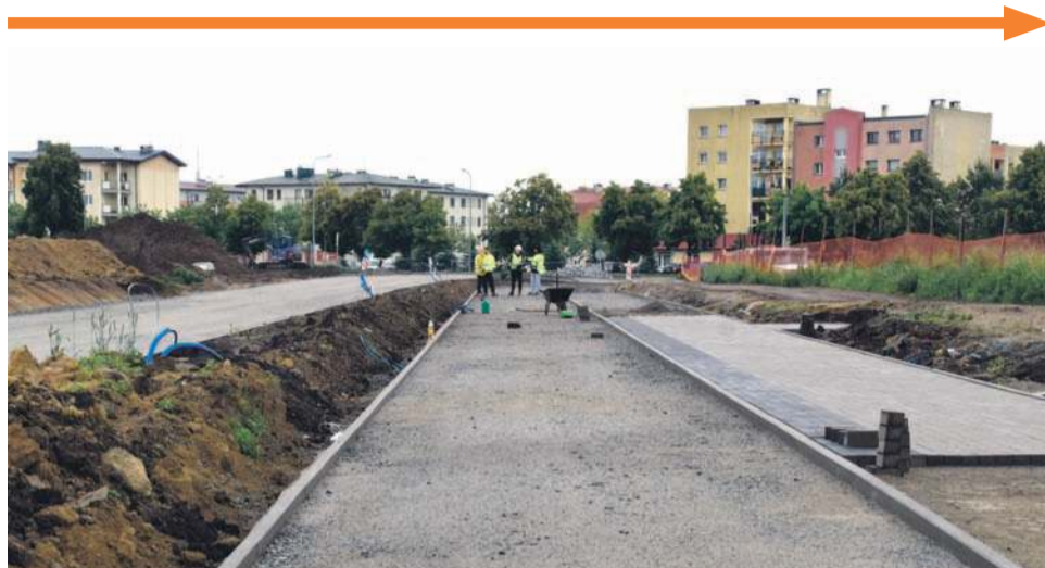
Trwają intensywne prace przy budowie drogi dojazdowej i chodnika do stacji Oława Zachodnia. Inwestor i wykonawca zapewniają, że będą gotowe przed odjazdem pierwszego pociągu