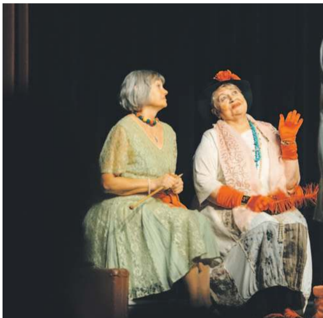
Wystąpiła grupa teatralna

TEKST I FOT.: KAMIL TYSA ktyasa@gazeta.olawa.pl