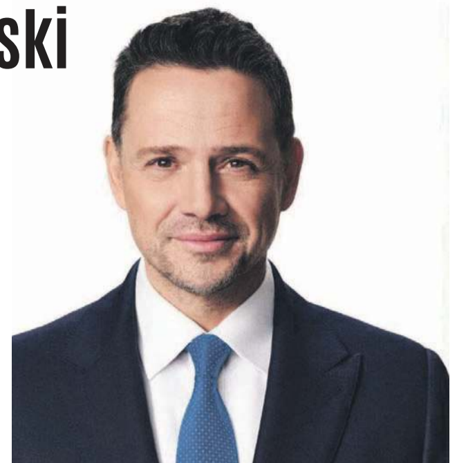
Rafał Trzaskowski w powiecie oławskim wygrał z Karolem Nawrockim o 263 głosy

1. KAROL NAWROCKI 33,12% 2. RAFAŁ TRZASKOWSKI 23,19% 3. SŁAWOMIR MENTZEN 20,41% 4. GRZEGORZ BRAUN 6,98% 5. SZYMON HOŁOWNIA 4,40% 6. MAGDALENA BIEJAT 4,40% 7. MAREK WOCH 2,90%