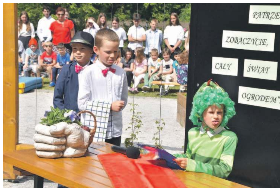
Uroczystość uświetniły występy uczniów