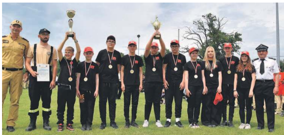
W kategorii chłopców najlepszy wynik w powiecie wywalczyło OSP z Siecieborowic