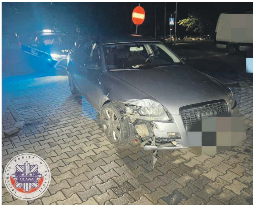
Kierowca audi uderzył w latarnię drogową i próbował uciec z miejsca zdarzenia