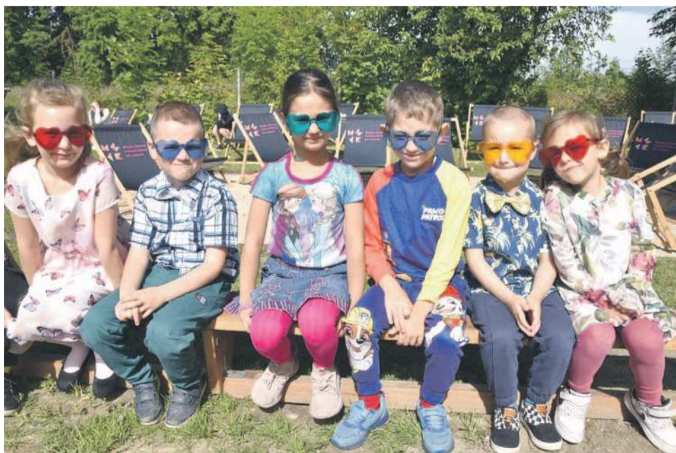
To dla nich