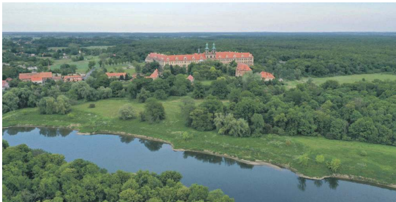
Gmina Wołów zajęła trzecie miejsce w tegorocznej edycji konkursu „Piękna Wieś Dolnośląska”