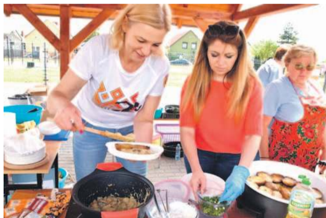
A po biegu - kresowa kuchnia