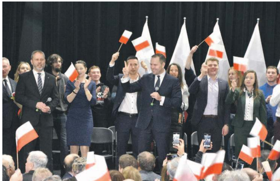
Karol Nawrocki podczas spotkania w Oławie na początku kampanii wyborczej

W Oławie Karol Nawrocki osiągnął najlepszy wynik w komisji nr 4, która mieściła się w Klubie „Parnas”. Zagłosowało tam na niego 48,94% wyborców. Aż 64,57% głosów Rafał Trzaskowski zdobył w komisji nr 14 w Powiatowym Centrum Edukacyjno-Rehabilitacyjnym przy ul. Iwaszkiewicza, co było jego najlepszym oławskim wynikiem.