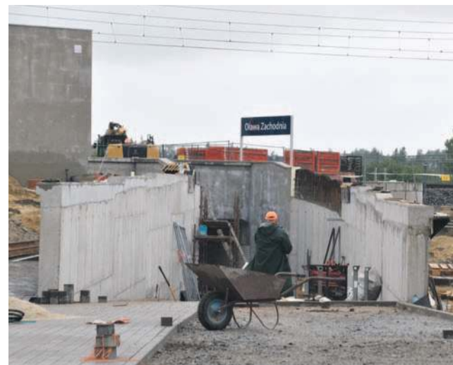
Nie zakończyły się jeszcze prace przy budowie samego przystanku (na fot. wejście do tunelu od strony os. Sobieskiego)

Miasto zobowiązało się też zapewnić dojazd i dojście do przystanku od strony osiedla Nowy Otok. Obecnie jest to możliwe poprzez łącznik z kostki brukowej od ulicy Błękitnej. Lada dzień ma być natomiast ogłoszony przetarg na wykonawcę, który zmoder-