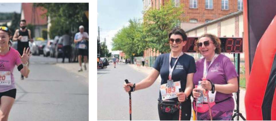
Kijkarze też dali radę