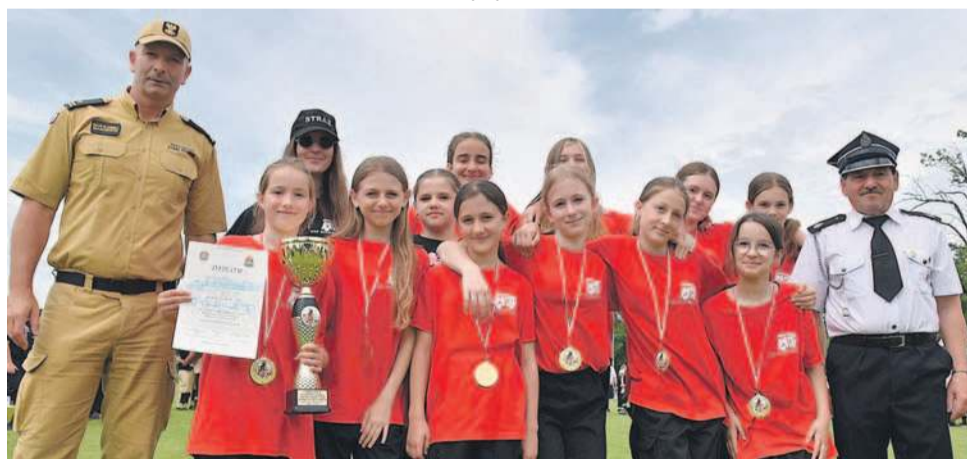
Drużyna z OSP w Minkowicach Oławskich jest najlepsza w powiecie