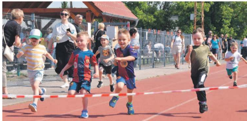
O medale równie zaciekle walczyli też młodzi biegacze