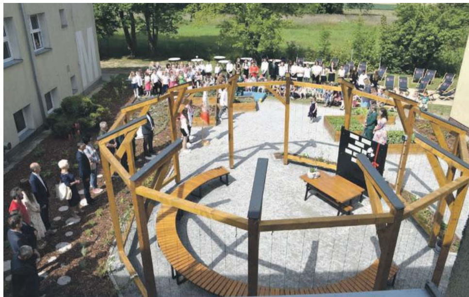
Z szarego kawałka pod szkołą mamy teraz ciekawie zainscenizowaną klasę na świeżym powietrzu