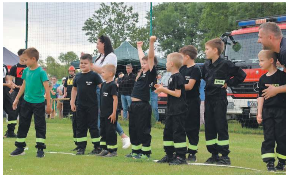
W tegorocznych zawodach wystartowały też dzieci i radości było co niemiara. Na fot. drużyna chłopięca z Niemila

TEKST I FOT.: KAMIL TYSA ktysa@gazeta.olawa.pl