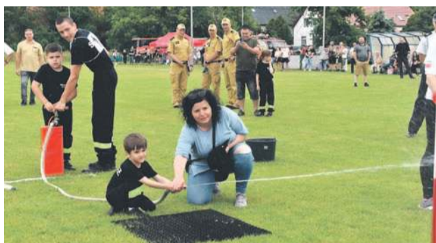
Najmłodszym czasem musieli pomóc opiekunowie