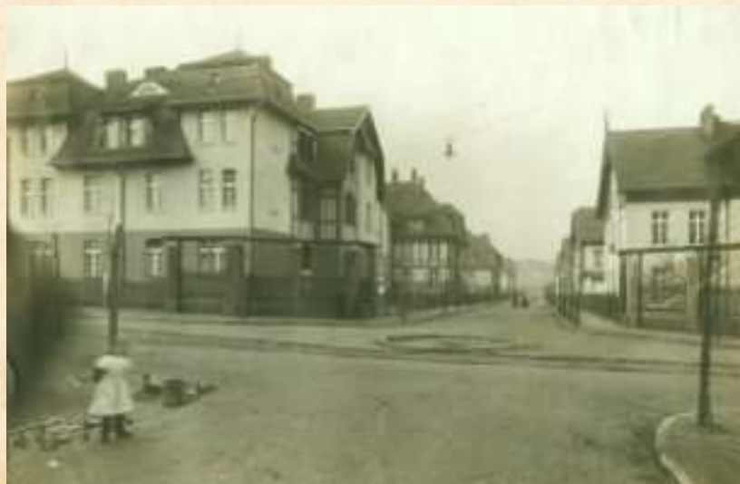
► Fragment części robotniczej osiedla patronackiego huty Donnersmarck. Obecna ul. Krakusa – widok ze skrzyżowania z ul. K. Piechy w kierunku zachodnim.