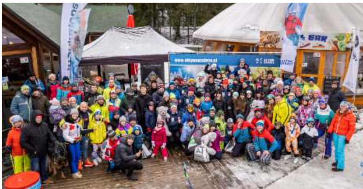
► W zawodach wzięło udział 150 osób

O puchar prezydenta Zabrze walczyli uczestnicy zawodów, jakie 5 marca rozegrane zostały w Ośrodku Narciarskim Żłoty Groń w Istebnej. Emocji nie brakowało.