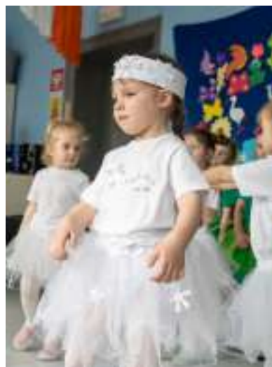
▶ ...i jego mali wychowankowie