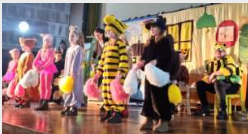
► Przygotowana przez dzieci inscenizacja bajek Janoscha