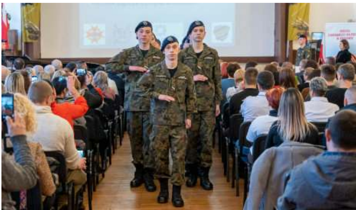
► Klasy mundurowe działają w Zespole Szkół Ekonomiczno-Usługowych w Zabrzu od 2015 r. Fot. UM Zabrze

Uroczyste ślubowanie złożyli w marcu uczniowie klas mundurowych Zespołu Szkół Ekonomiczno-Usługowych. Dla młodych ludzi dostępne są tu specjalizacje technik ekonomista o profilu policyjnym oraz technik logistyk o profilu wojskowym.