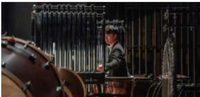
► Na scenie pojawił się bogaty zestaw instrumentów

Orkiestra Symfoniczna Koreańskiego Narodowego Uniwersytetu