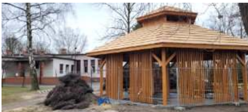
► Tężnia powstająca przy Dzielnicowym Ośrodku Kultury w Kończycach

Takich inwestycji jeszcze nie realizowaliśmy w naszym mieście. Intensywnie pracowaliśmy, aby pozyskać środki z funduszy norweskich. Wierzę, że mieszkańcy będą mogli już niedługo cieszyć się efektem naszej wspólnej pracy - mówi prezydent Zabrze Małgorzata Mańka-Szulik. - W Zabrze, poza strategicznymi inwestycjami, takimi jak przedłużenie alei Korfantego, budowa centrów przesiadkowych czy przygotowanie i wypełnienie specjalnej strefy ekonomicznej, realizujemy oczekiwane przez mieszkańców zadania dedykowane rekreacji, właśnie takie jak tężnie solankowe czy dwa przygotowywane