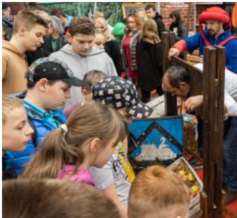
► Miastem partnerskim tegorocznych targów będzie Ogrodzieniec