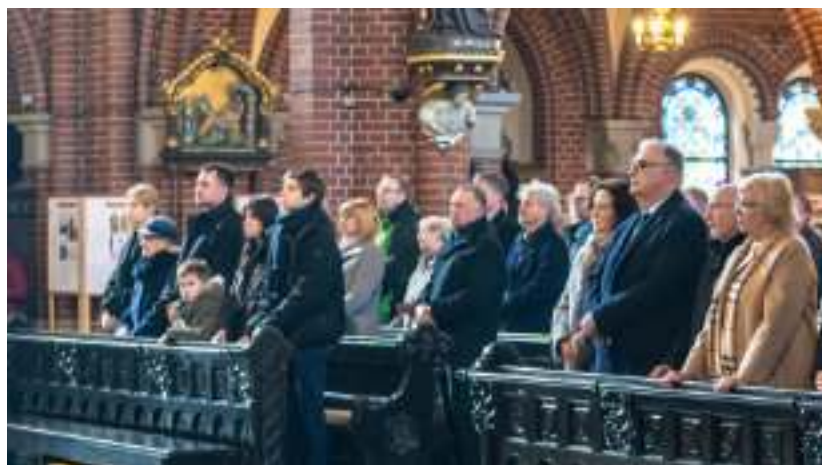
► 19 marca minął rok od śmierci prof. Mariana Zembali

- Pamiętam profesora Mariana Zembalę jako dyrektora, który obok zajmowania się strategicznymi pro-