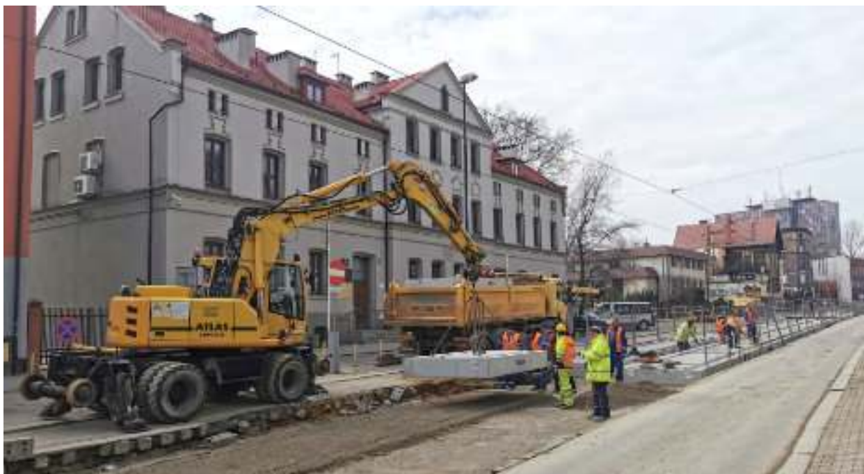
► Wymiana torowiska tramwajowego wzdłuż ul. Wolności

dynczego). – To niezwykle oczekiwana przez mieszkańców inwestycja, choć trudna do realizacji. Pomimo tego, że będziemy musieli zmierzyć się z czasowymi utrudnieniami, to jestem przekonana, że wszyscy czekaliśmy na ten remont. Modernizacja umożliwi ruch tramwajów niskopodłogowych, co ułatwi korzystanie z komunikacji seniorom i osobom z niepełnosprawnościami. W znaczącym stopniu poprawi także bezpieczeństwo i komfort kierowców – podkreśla prezydent Zabrza Małgorzata Mańka-Szulik. GOR