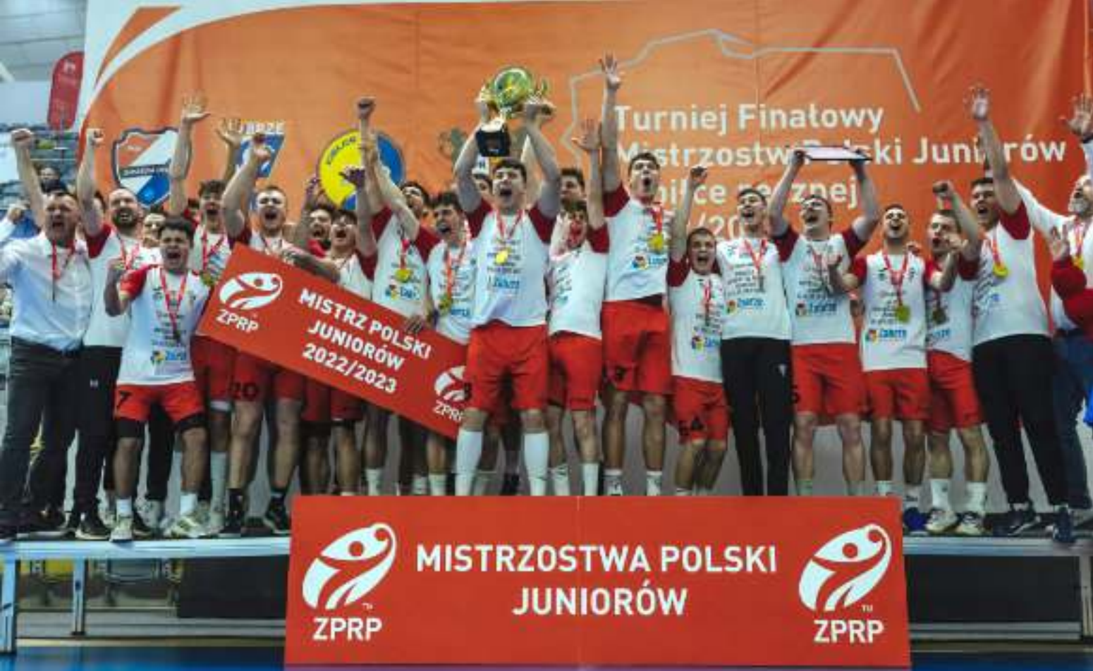
► Zwycięska ekipa z Zabrza