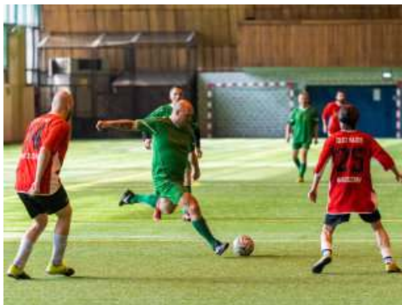
► Dedykowany prof. Marianowi Zembali turniej piłkarski w hali MOSiR

cieli II Liceum Ogólnokształcącego w Zabrzu, które w marcu obchodziło ósmą rocznicę podpisania umowy patronackiej między szkołą a Fundacją Śląskiego Centrum Chorób Serca. Była to okazja do podsumowania działań młodzieży na rzecz pacjentów Śląskiego Centrum Chorób Serca i podopiecznych Fundacji w ramach wolontariatu. GOR