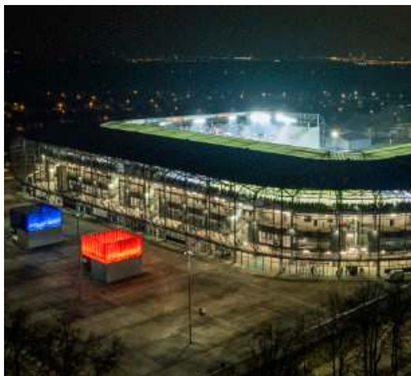
► Arena Zabrze po zmroku

32 tysiące osób ma docelowo pomieścić obiekt