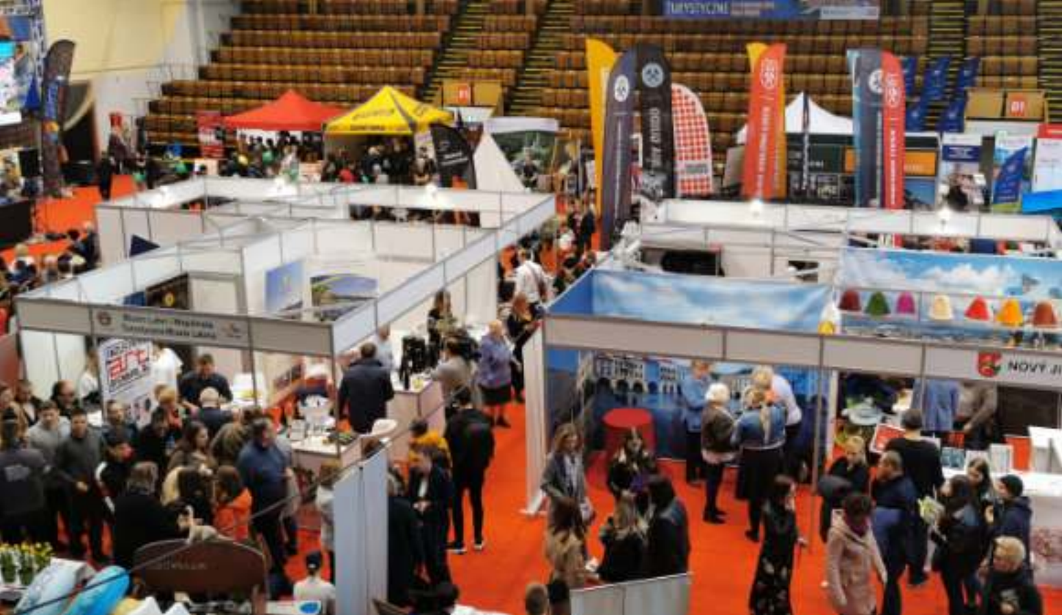
► Zabrzańskie targi co roku cieszą się ogromnym zainteresowaniem zwiedzających