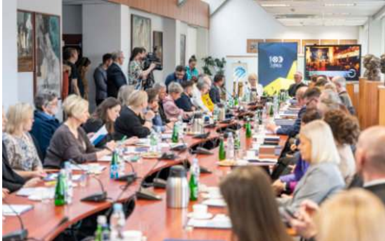
► O tegorocznej edycji MŚR rozmawiali uczestnicy spotkania zorganizowanego w Bibliotece Śląskiej