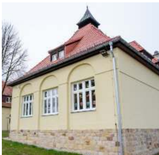
▶ Przedszkole nr 39