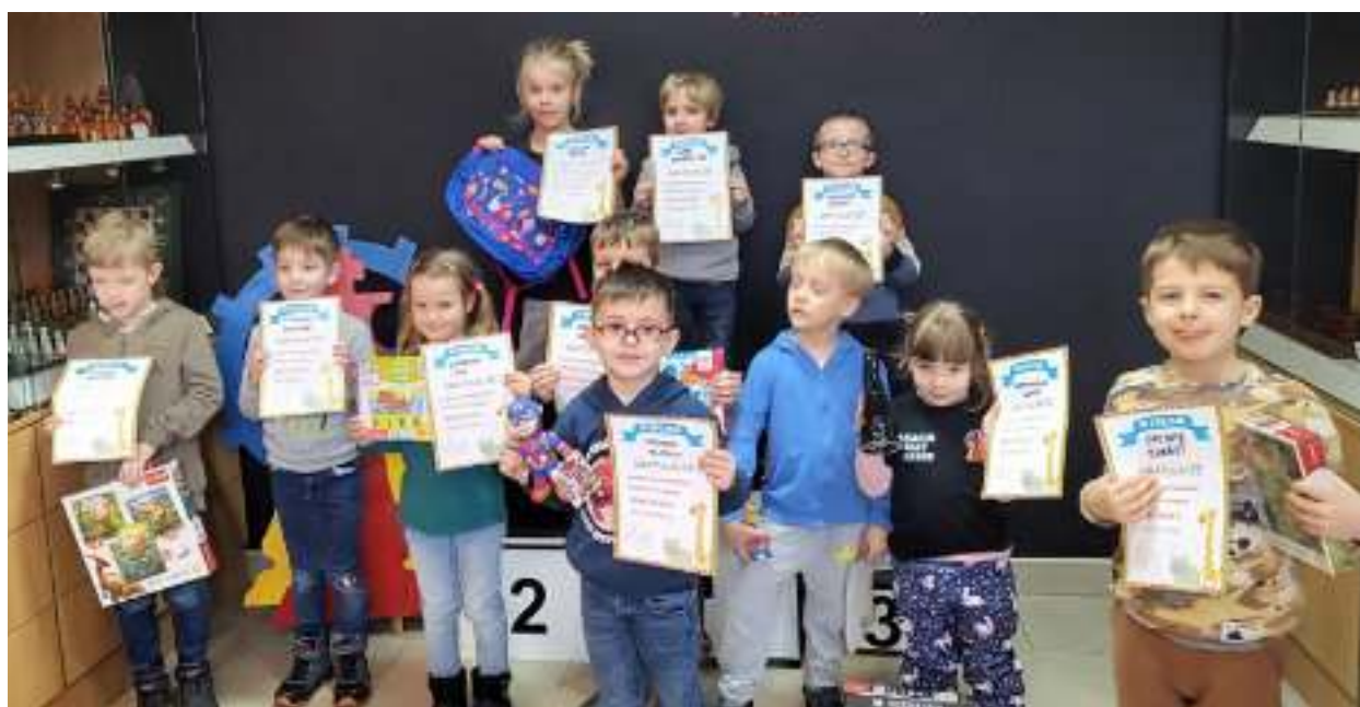
► W Zabrzu nie brakuje małych miłośników szachów