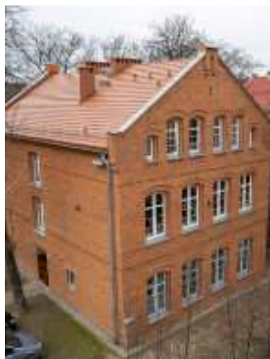
▶ Przedszkole nr 7...

styczny związany z powitaniem wiosny, który zaprezentowany został przez przedszkolaki. GOR