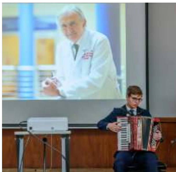
► Przygotowany przez uczniów II LO program artystyczny