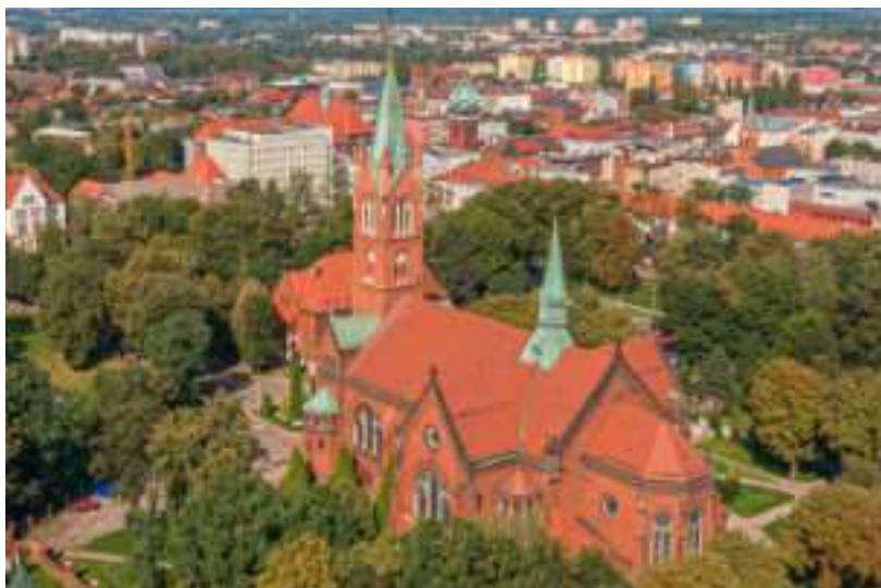
► Kościół św. Anny

Radni przyjęli również „Program opieki nad zwierzętami bezdomnymi oraz zapobiegania bezdomności zwierząt na terenie Miasta Zabrze na rok 2023”. Zdecydowali także o podziale środków z Państwowego Funduszu Rehabilitacji Osób Niepełnosprawnych w 2023 r.