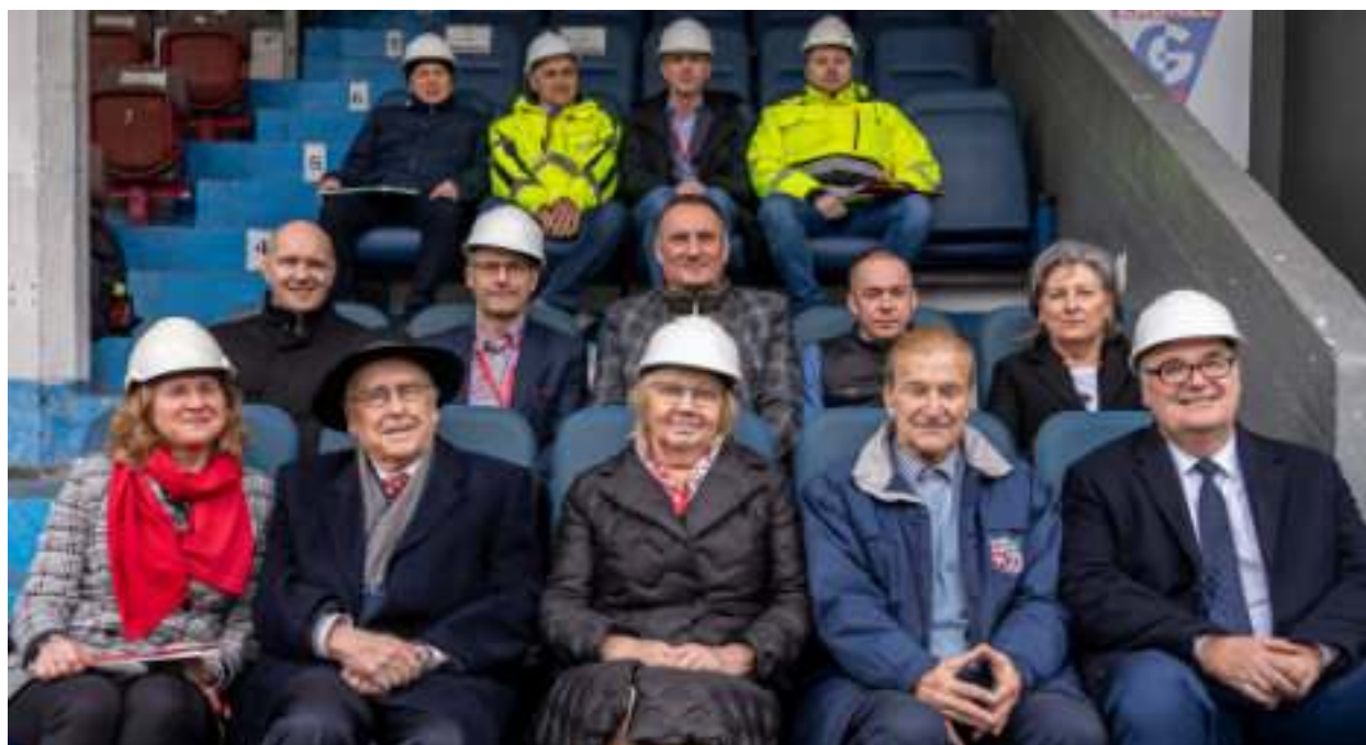
► Oficjalne przekazanie placu budowy wykonawcy