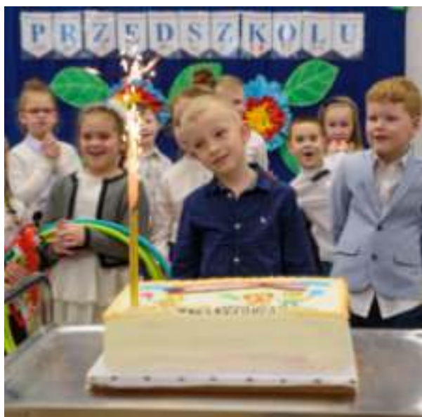
▶ Zadowolone z efektów remontu przedszkolaki