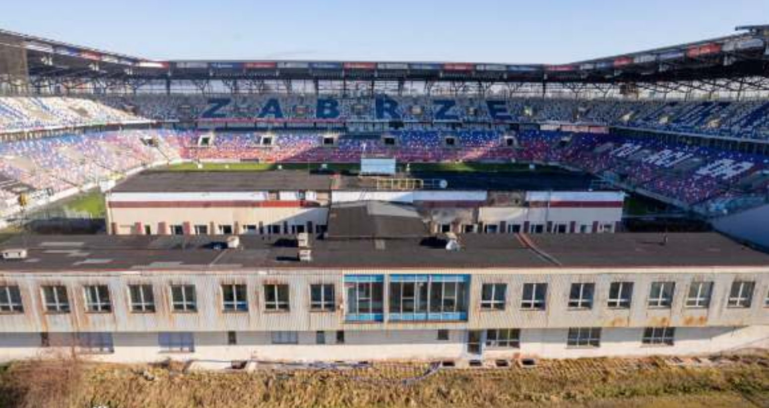
► Stara trybuna i budynek klubowy Górnik Zabrze