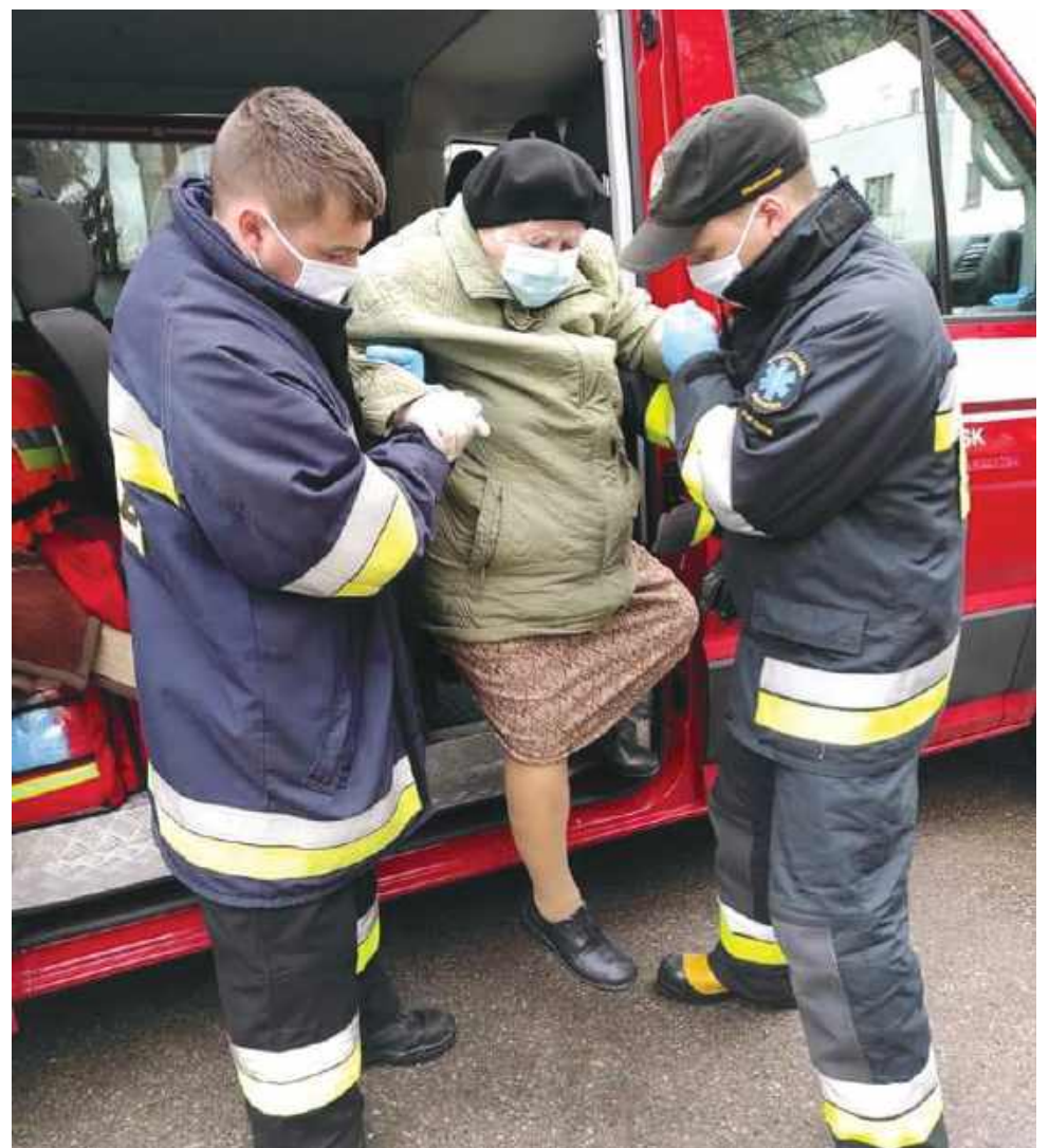
Strażacy ratują i pomagają. Nie tylko w pandemii.

Prokuratura Okręgowa w Ostrołęce po raz kolejny zwraca się z apelem o zachowanie szczególnej ostrożności w przypadku nawiązania kontaktów za pośrednictwem Internetu. Nigdy nie mamy pewności, kogo poznajemy i kto znajduje się „z drugiej strony”. Nie znamy też zamiarów ani intencji osób poznanych w Internecie. Przekazujemy im informacje o nas, mówimy o naszych osiągnięciach i porażkach. Często są to osoby, które grają na naszych uczuciach i emocjach. Małymi krokami zdobywają nasze zaufanie, a potem wykorzystują naszą lekkomyślność i wiarę w ludzi. Nie można bezgranicznie zaufać osobie, którą poznaliśmy „on line”.