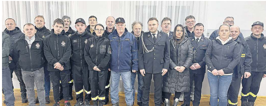
Po wyborach w zarządzie OSP Wojnow...

Podczas zebrania drużyny i druhowie omawiali realizowane działania ratowniczo-gaśnicze, przedsięwzięcia szkoleniowe oraz inicjatywy społeczne podejmowane na rzecz lokalnej społeczności. Nie zabrakło podziękowań dla strażaków za ich zaangażowanie, dyspozycyjność i gotowość do niesienia pomocy o każdej porze dnia i nocy. Skarbnicy OSP zaprezentowali sprawozdania finansowe, a komisje rewizyjne wniosły o udzielenie absolutorium.