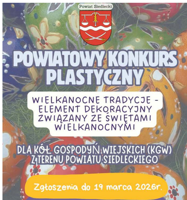
Powiatowy Konkurs dla KGW pt. „Wielkanocne Tradycje”.

Organizatorzy stawiają na prostą, dobrze znaną z lekcji plastyki technikę wyklejanek i wydzieranek oraz wyraźnie