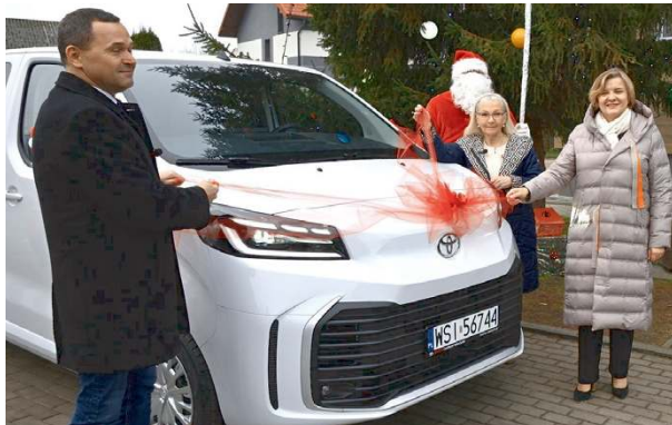
Nowy mikrobus to nie tylko wygoda, ale i oszczędność.

Od lutego dowóz dzieci do Ośrodka Szkolno-Wychowawczego w Stoku Lackim odbywa się nowym, własnym mikrobusem. Decyzja ta przyniesie nie tylko wygodę, ale i oszczędności dla budżetu.