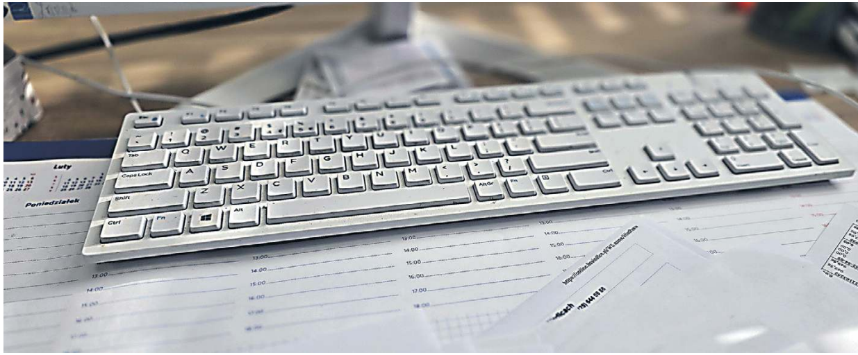
Oświadczenia majątkowe muszą składać osoby zajmujące funkcje publiczne.

Nasz Czytelnik zwrócił uwagę na aktywność radnego w mediach społecznościowych. – Wstawia zdjęcia i filmiki z dalekich wyjazdów zagranicznych. Chwali się majątkiem: domem z basenem czy samochodami – opowiada pan Roman. I dodaje, że to pchnęło go do zrobienia kolejnego kroku: wszedł na stronę urzędu gminy i odszukał