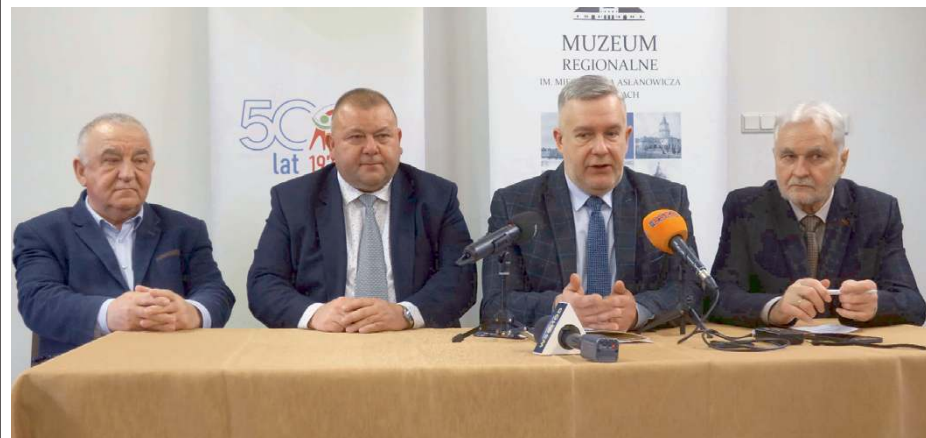
Organizatorzy wystawy zachęcają do dzielenia się pamiątkami.