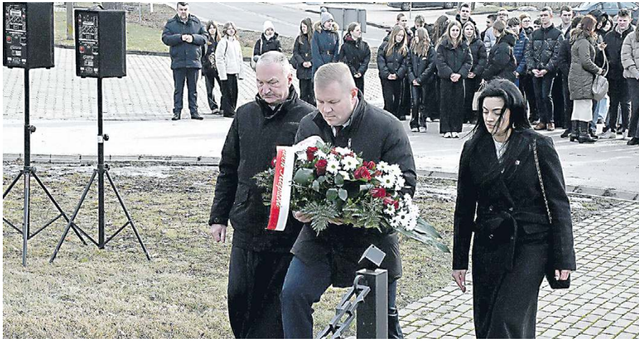
To wydarzenie pokazało, jak ważna jest pamięć i wspólne oddawanie hołdu bohaterom.

Uroczystości rozpoczęły się przed Urzędem Gminy, gdzie zgromadziły się poczty sztandarowe, uczniowie, druhowie OSP, samorządowcy oraz mieszkańcy. To właśnie stamtąd uczestnicy w uroczystym przemarszu udali się pod pomnik Żołnierzy Wyklętych w Wodyniach - miejsce, które stanowi symbol lokalnej pamięci.