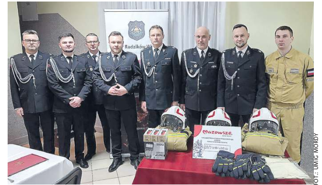
...i Radzikowie Wielkim.

Podczas wszystkich zebrania podkreślano kluczową rolę Ochotniczych Straży Pożarnych w systemie bezpieczeństwa gminy Mordy, powiatu siedleckiego oraz regionu wschodniego Mazowsza. Zwrócono uwagę nie tylko na ich znaczenie w działaniach ratowniczych, ale również na aktywność społeczną i integracyjną. Wskazano także na istotne wsparcie przekazywane jednostkom przez Zarząd Woj-