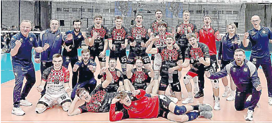
Siedlczanie w czwartej odsłonie wrócili do swojej siatkówki – agresywnej zagrywki.

W momencie sezonu, w którym margines błędów praktycznie nie istnieje, siatkarze KPS Siedlce zagrali dojrzałe i bez kompleksów. W wyjazdowym meczu 25. kolejki PLS 1. Ligi pokonali MCKiS Jaworzno 3:1 i po raz drugi w rundzie zasadniczej udowodnili, że potrafią znaleźć sposób na tego rywala.