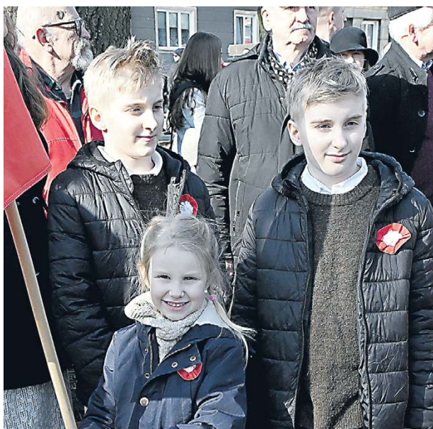
Pamięć o Żołnierzach Wyklętych jest elementem historii Polski

Msza w kościele garnizonowym, uroczyste podniesienie flagi, hymn, apel pamięci, salwa honorowa i złożenie kwiatów – tak w Siedlcach uczczono Narodowy Dzień Pamięci Żołnierzy Wyklętych.