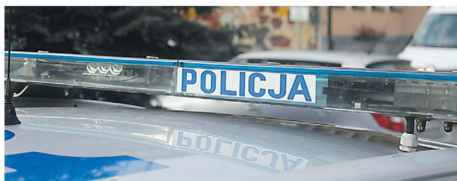
Wykrywalność przestępstw, choć nadal wysoka, spadła lekko.

Największy niepokój budzą dane dotyczące mienia i prywatności. Liczba kradzieży zwiększyła się nieznacznie z 34 do 37 przypadków. Prawdziwy dzwonek alarmowy to jednak włamanie. Ich liczba prawie podwoiła się: z 8 przypadków w 2024 r. do 19 w 2025 r. – Nie należy myśleć o tym wyłącznie