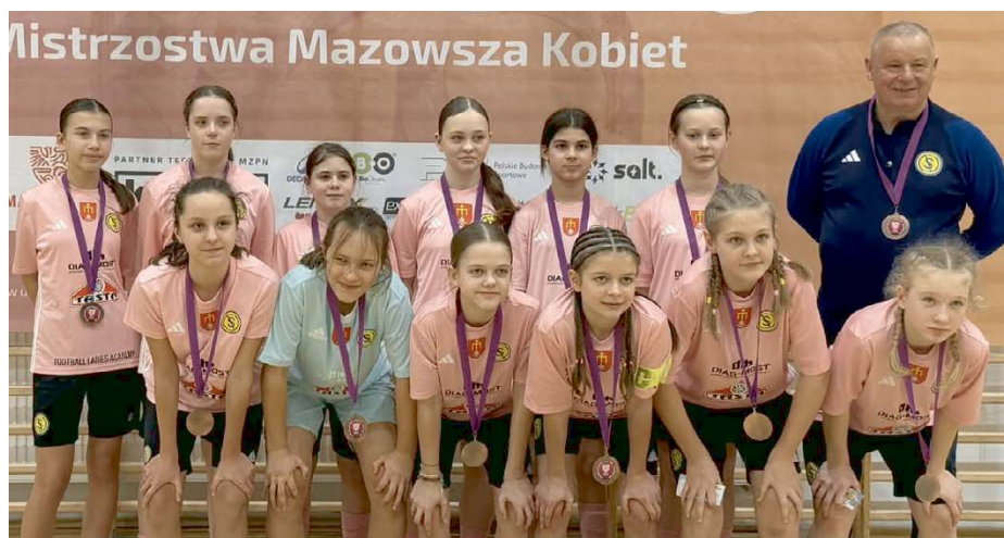
Brązowy medal w gronie najlepszych drużyn Mazowsza to wynik, który mówi sam za siebie.