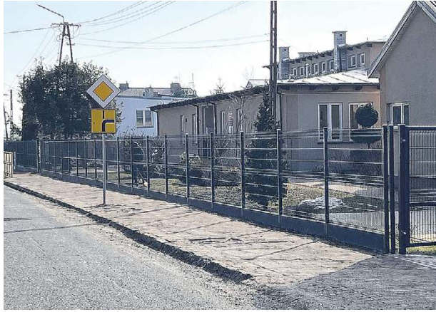
W ubiegłym roku wymieniono ogrodzenia szkoły w Krześlinie

Nie jest to pierwsze działanie w tym miejscu. W ubiegłym roku zrealizowano inwestycję polegającą na wymianie ogrodzenia szkoły. Był to kolejny krok w stronę poprawy bezpieczeń-