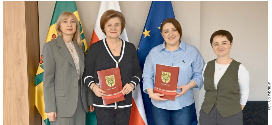
Gmina podpisała umowę na realizację projektu dla seniorów.