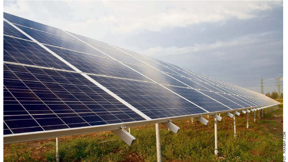
Spółdzielnia energetyczna to szansa na niższe rachunki i energetyczną niezależność.

Projekt nie stoi w miejscu. Od 23 stycznia 2026 r. w Krajowym Ośrodku Wsparcia Rolnictwa zarejestrowanych jest 3 człon-