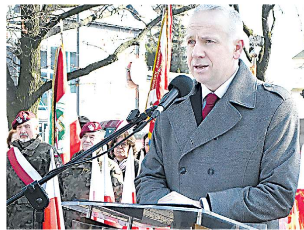
Prezydent Hapunowicz mówił, że patriotyzm to nie tylko słowa.

Na miejscu uroczystości odbyła się ceremonia uroczystego podniesienia flagi państwowej. Wraz z jej wciągnięciem na maszt odegrano hymn narodowy. Ten moment miał szczególne znaczenie. Obecność asysty wojskowej i dźwięki orkiestry podkreśliły państwowy charakter obchodów i przypomniały, że pamięć o Żołnierzach Wyklętych