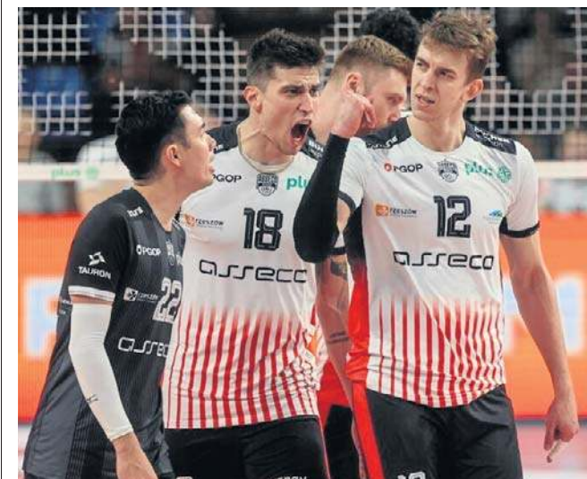
Rzeszowianie walczą o jak najlepsze miejsce przed fazą play-off, dlatego nie odpuszczają w niedzielę Ślepskowi

Zapowiada się bardzo ciekawe spotkanie, w którym każdy wynik jest możliwy, a kibice liczą na świetne widowisko. Początek meczu w niedzielę o 18. Transmisja na kanale YouTube Fogo Futsal Ekstraklasa. ©©