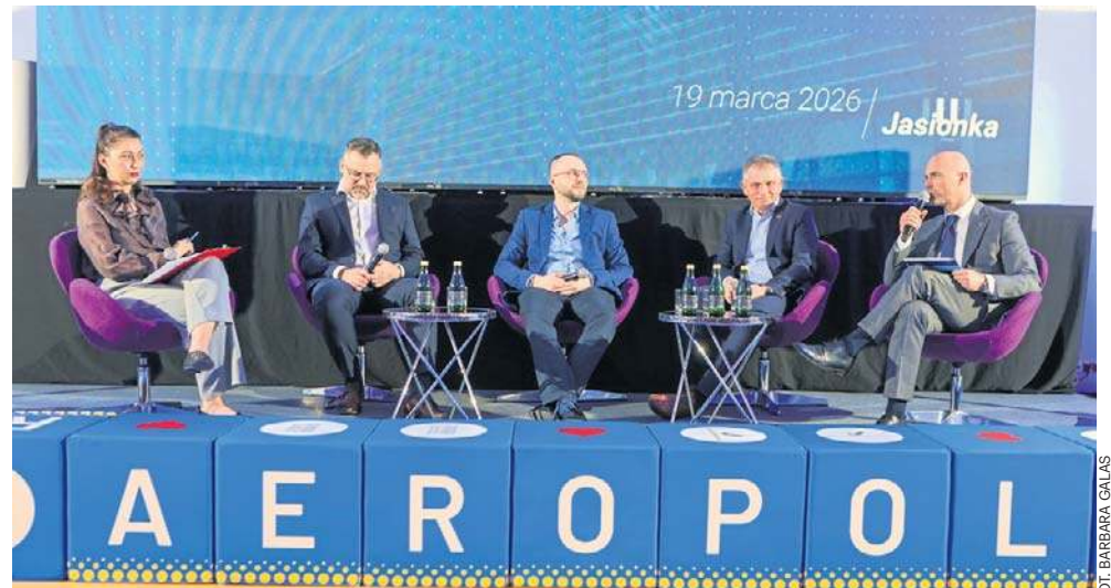
Na rzeszowskim lotnisku korzysta nie tylko region - podkreślano wczoraj w Jasionce