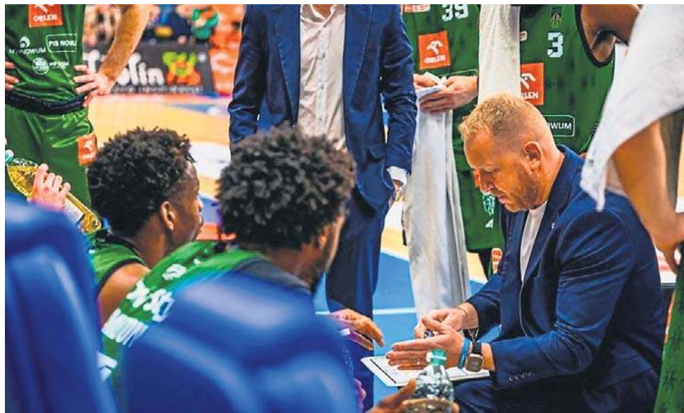
TYMOTEUZ AKSLAR / MIASTO SZKŁA KROŚNO

Na zapleczu ekstraklasy rozegrana zostanie 29. kolejka, w której wolne ma tym razem Solvera Sokół Łańcut, wicelider tabeli. OP Team Energię Polską Resovię czeka wyjazd do Opola, gdzie zmierzy się z tamtejszą Politechniką. U siebie „Bieszczadzkie Wilki” postawiły na swoich i po emocyjnym meczu wygrały 73:71.