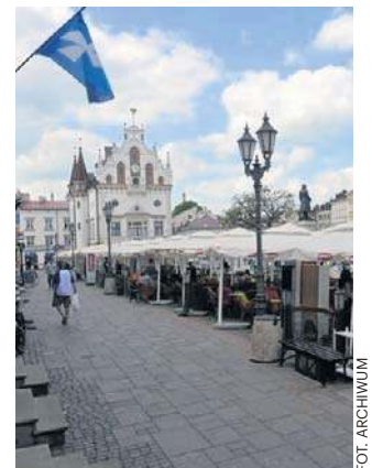
Ogródków na Ryнку będzie w tym roku 33

Ogródki restauracyjne mogą stać także na ulicach: 3 Maja, Matejki, Grunwaldzkiej czy Kościuszki. Tam nie ma przetargu. Restauratorzy zawierają umowę z rzeszowskim MATiP-em na zajęcie pasa drogowego. ©©