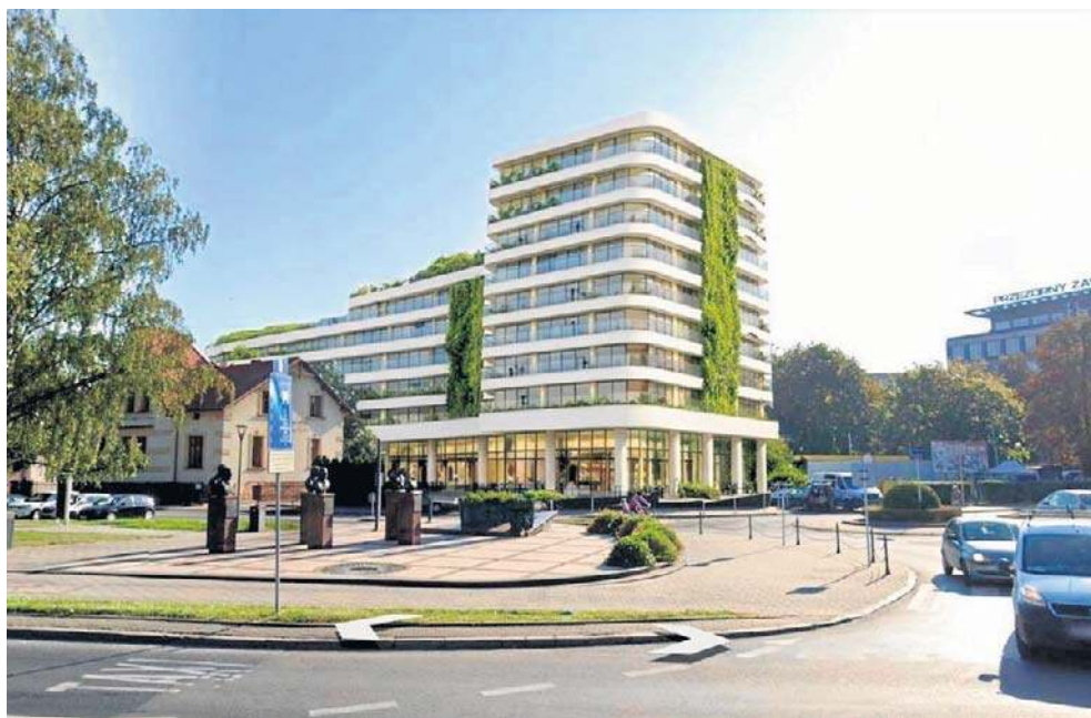
Wizualizacja roboczej hipotezy gabarytów zabudowy „Balcerka” w Rzeszowie