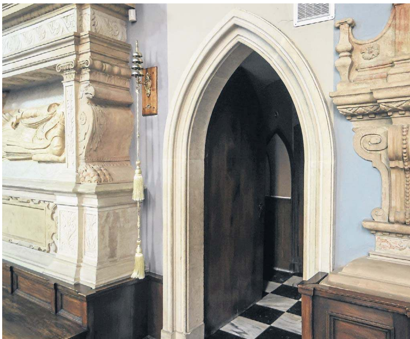
W prezbiterium kościoła farnego, który został odbudowany po pożarze z 1427 roku, zachował się gotycki portal

Rzeczywiście, w Rzeszowie bardzo mało zachowało się średniowiecznych obiektów. Dlatego że Rzeszów przeszedł