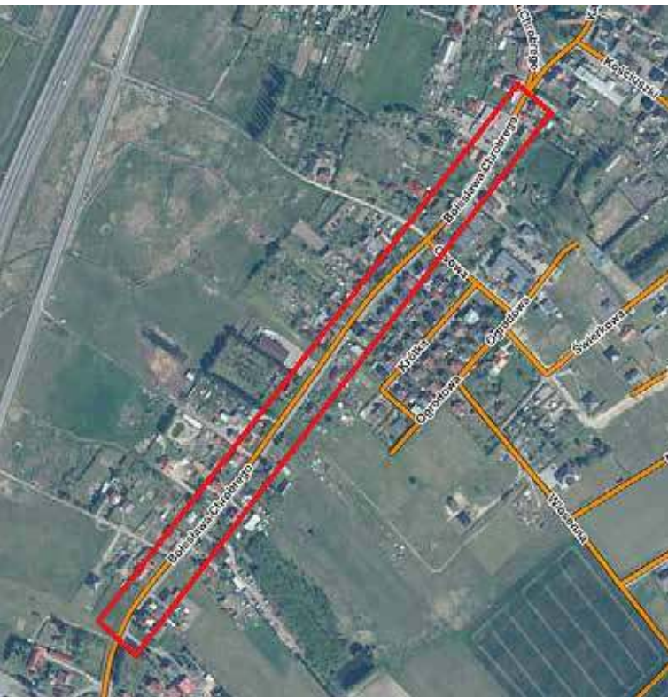
Obszar prac