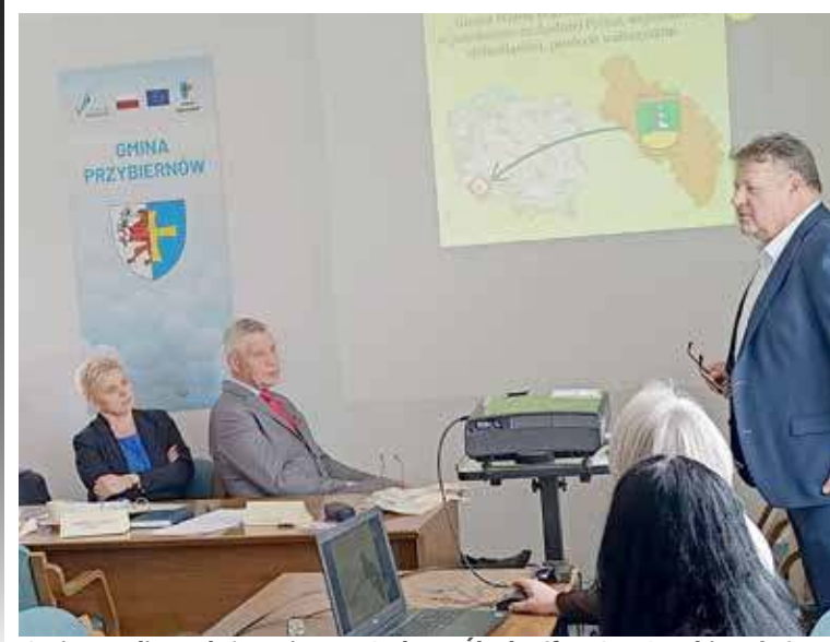
Gmina Walim położona jest na Dolnym Śląsku