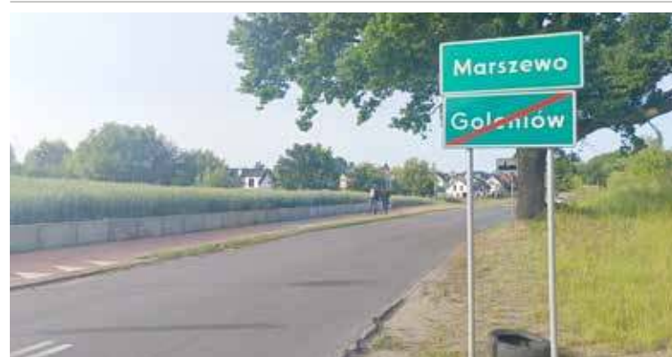
Drogę w Marszewie czeka rozbudowa

Pod koniec maja została zawarta umowa na rozbudowę drogi w Marszewie. Zakres tej inwestycji obejmuje prace na prawie dwóch kilometrach drogi. Będą tam wybudowane chodniki, ścieżka pieszo-rowerowa, zatoki autobusowe i nie tylko.