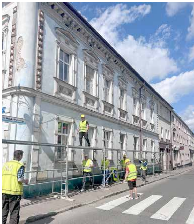
Remontowana jest kolejna zabytkowa kamienica