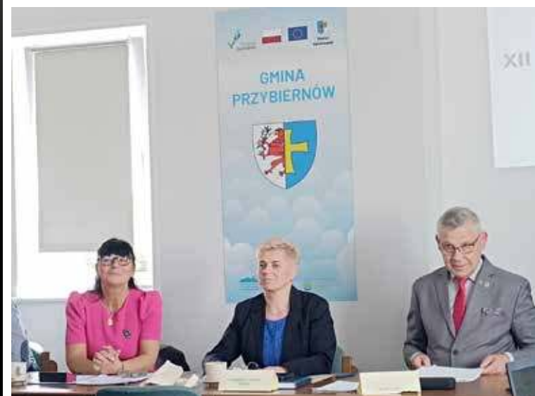
Uchwała została podjęta

Pod koniec maja została podjęta uchwała w sprawie zawarcia umowy partnerskiej z Gminą Walim położona na Dolnym Śląsku. Współpraca dotyczyć będzie realizacji projektów z dziedziny kultury, sportu, edukacji i turystyki.