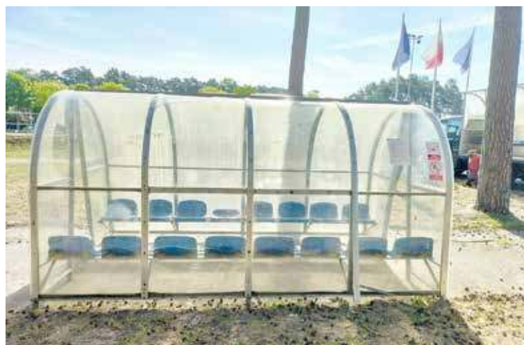
Jedna ze wspomnianych wiat