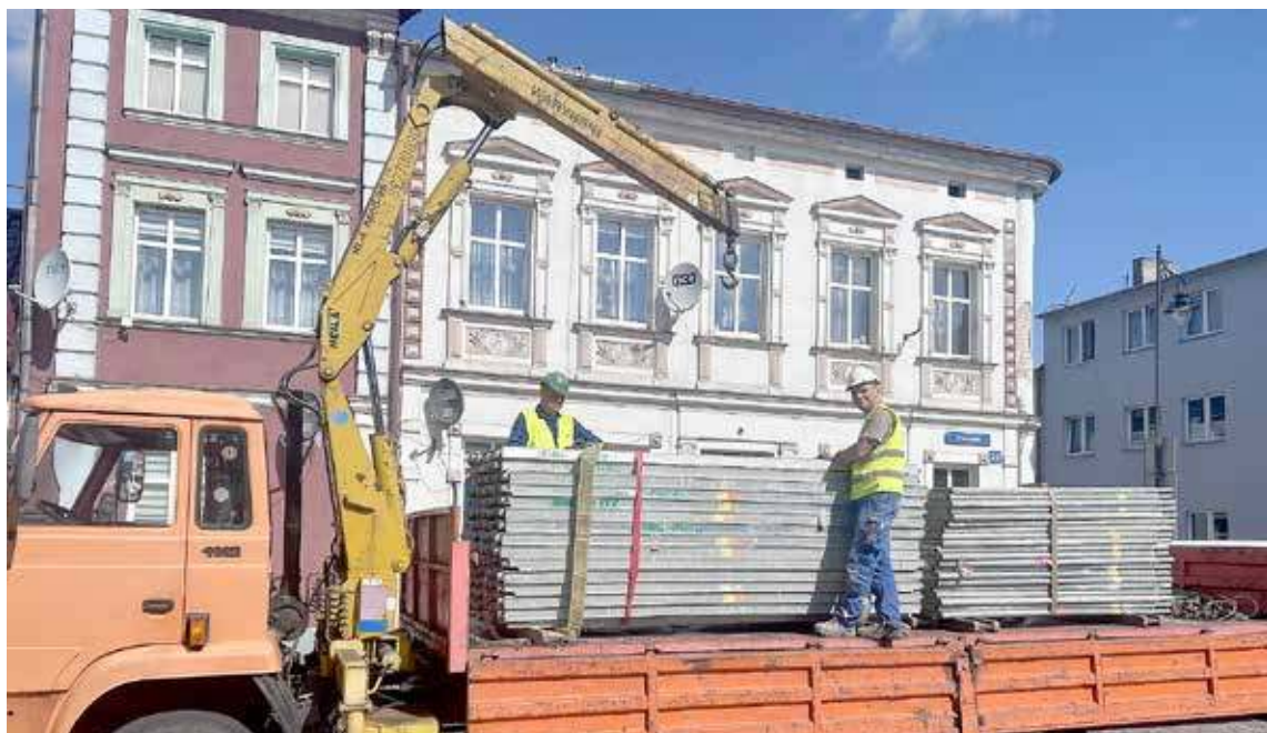
Prace polegają na remoncie elewacji