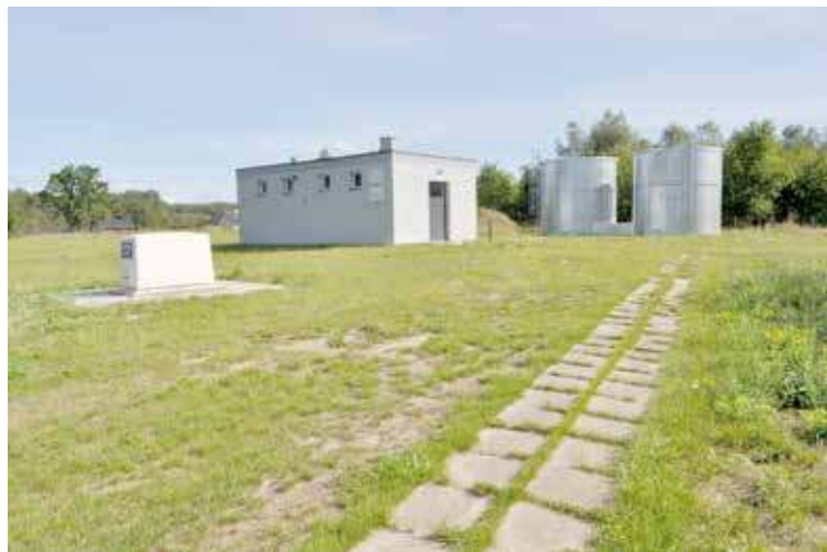
Inwestycje poprawią sytuację wodną w Gminie