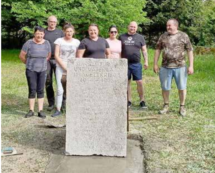
Wykonawcy projektu

Płyta pomnika poległych w trakcie I Wojny Światowej mieszkańców Maciejewa (do roku 1945 zwanego Matzdrorf) przez lata leżała pod ścianą kościoła służąc jako odpływ dla wody z rynny. Została ona wyciągnięta z tego niegodnego miejsca, oczyszczona oraz przygotowana do postawienia w miejscu, w którym znajdowała się ona pierwotnie. W miejsce gdzie ów pomnik leżał mieszkańcy Maciejewa, postępując zgodnie z zaleceniami konserwatora zabytków, ułożyli betonowe odpływy wody. Podobne odpływy zostaną również