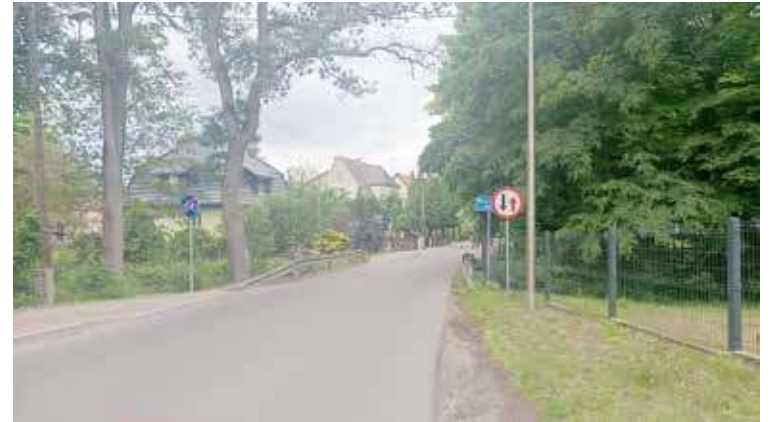
Zarośla zmniejszają widoczność