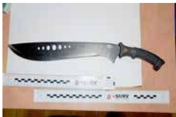
Przy podejrzanym znaleziono maczetę

Jak się okazało nie był to pierwszy raz. Jednak wcześniejszych gróźb pokrzywdzony nie zgłaszał Policji i w tym przypadku agresja ze strony napastnika eskalowała. Kierowanie gróźb karalnych wobec kogokolwiek, jeżeli wzbudzają one obawę ich spełnienia, jest przestępstwem określonym w art. 190§1 Kk.