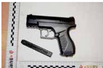
Przedmiotem przypominającym broń palną był w istocie pistolet-atrapa na kulki

Wszystkie czynności prowadzone były pod nadzorem Prokuratury Rejonowej w Goleniowie, na jej wniosek Sąd Rejonowy w Goleniowie zastosował wobec podejrzanego środek zapobiegawczy w postaci tymczasowego aresztowania na okres trzech miesięcy. Za popełnione przestępstwo grozi mu kara pozbawienia wolności do lat trzech.