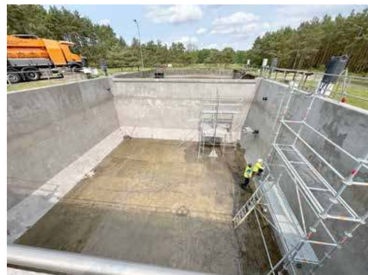
Trwają prace związane z modernizacją oczyszczalni