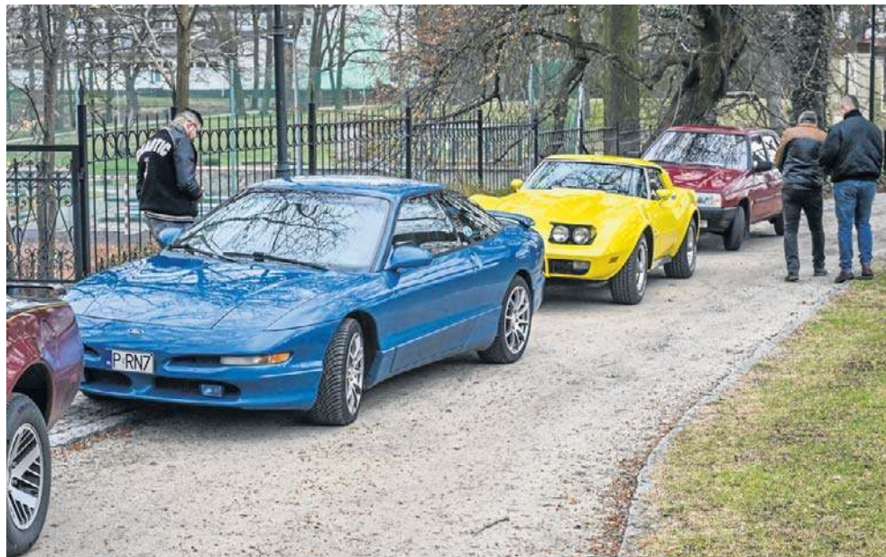
Klasyczna Marzanna to impreza, która odbywa się od 2021 roku