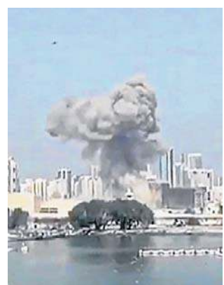
Wojna na Bliskim Wschodzie rozpoczęła się 28 lutego

W niedzielę nad ranem izraelska armia przekazała oficjalnie, że w walkach w południowym Libanie zginął jeden z jej żołnierzy. To już piąty woj-