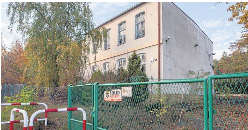
Fundacja chce zmodernizować budynek w ciągu 3 lat

Dodano, że całkowity koszt modernizacji to ok. 10 mln zł, więc prowadzone są równolegle