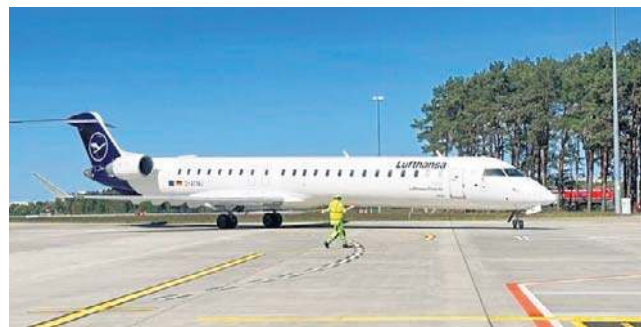
W sezonie letnim dojdzie szóste połączenie do Frankfurtu

Istotne zmiany wprowadziły również Polskie Linie Lotnicze LOT. Od 29 marca wszystkie rejsy na trasie Bydgoszcz - Warszawa będą realizowane w najbardziej pożądanym przez biznes i turystów systemie: wylot 6 dni w tygodniu (z wyjątkiem niedziel) z Bydgoszczy rano (5.35, na miejscu 6.30) i powrót wieczorem (wylot ze stolicy 22.55, przyloc 23.45). Taka formuła po-