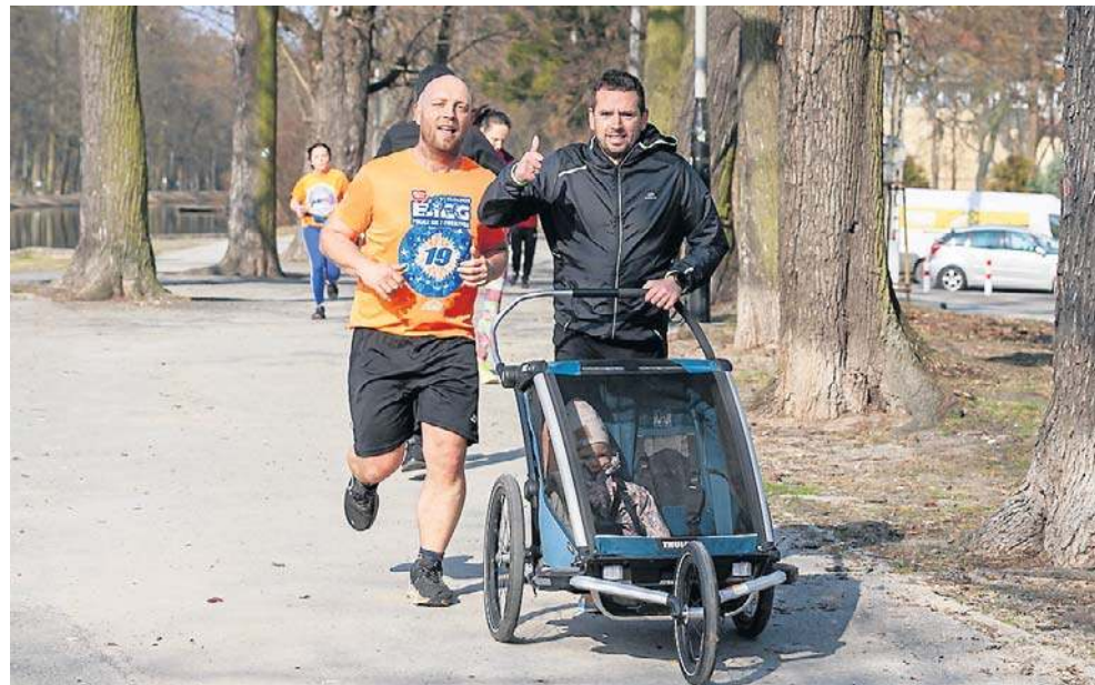
Parkrun Bydgoszcz - 28 marca 2026