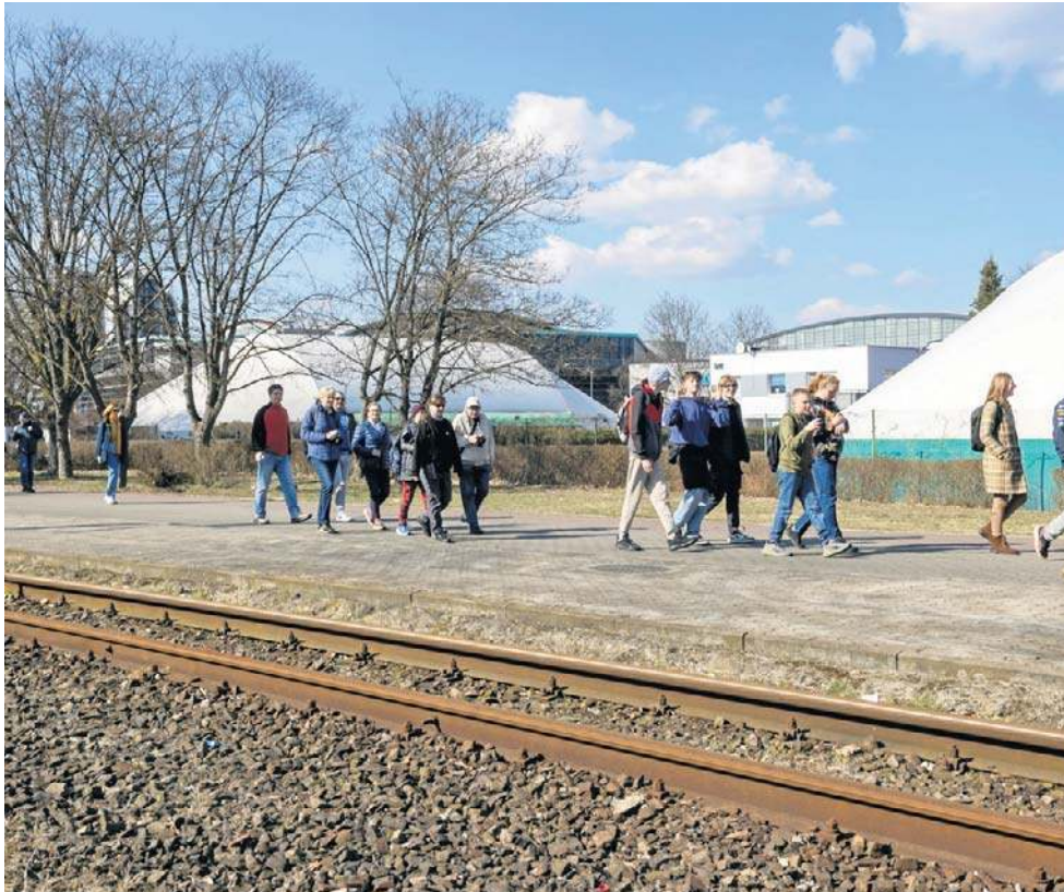
W 8. rocznicę zamknięcia torowiska na Babiej Wsi społecznicy zorganizowali spacer

Inwestorowi zostało 9 miesięcy - PINB prowadzi postępowanie w zakresie Babiej Wsi.