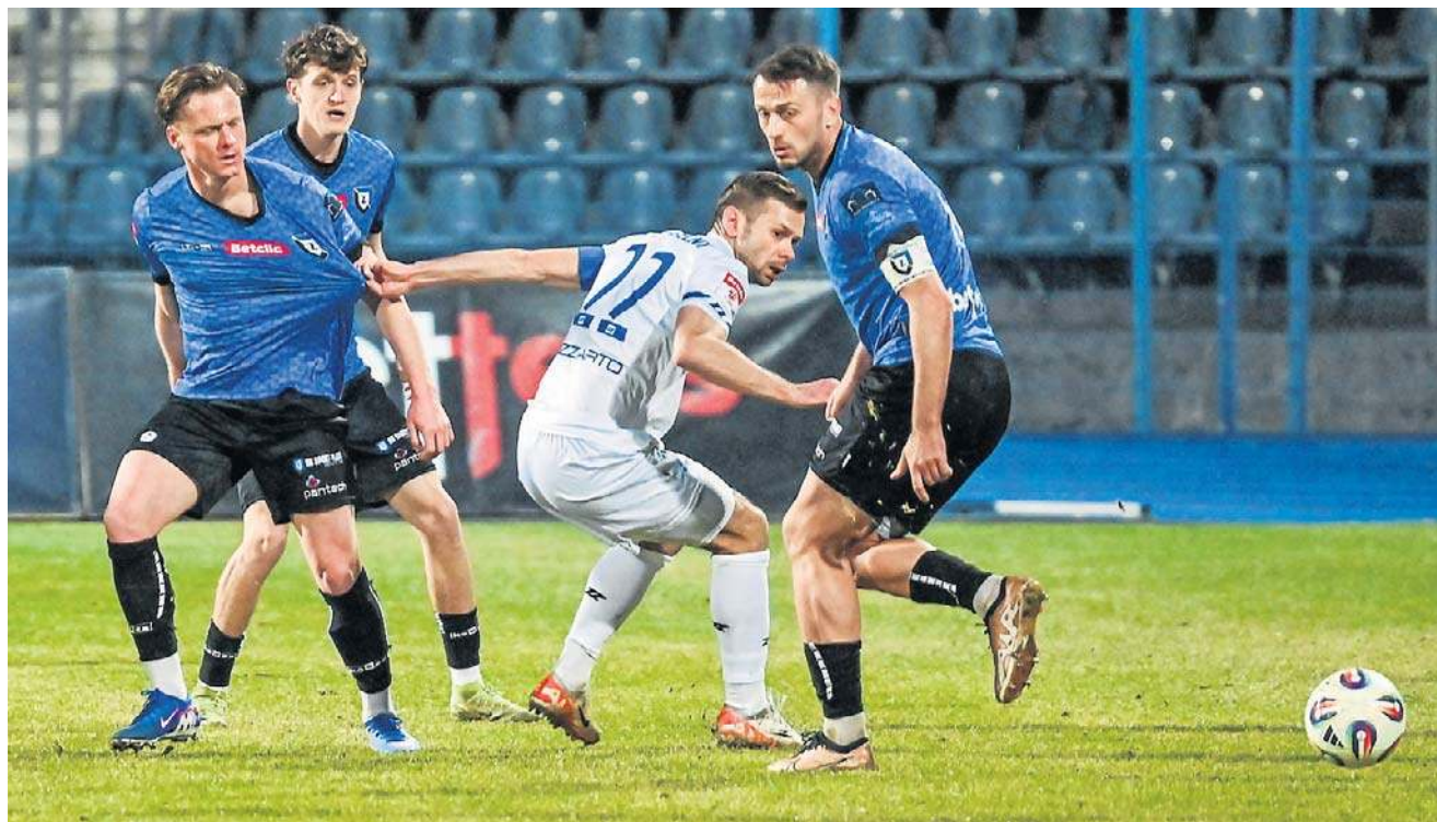
Piłkarze Zawiszy musieli się mocno natrudzić, by wygrać z Unią. Dzięki temu zwycięstwu zostali liderem

Dariusz Knopik dariusz.knopik@polskapress.pl