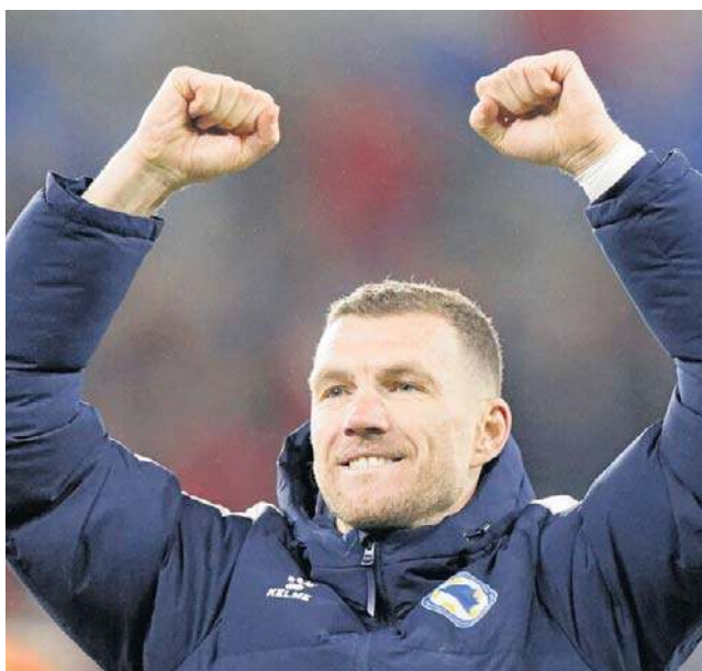
Edin Dzeko wciąż odczuwa niedosyt związany z grą w barwach narodowych. Marzy o dużym turnieju