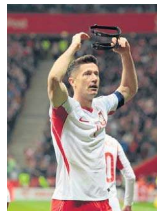
Robert Lewandowski wierzy w awans na MŚ