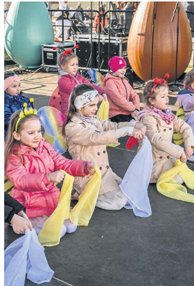
Tradycją jarmarku są występy artystyczne