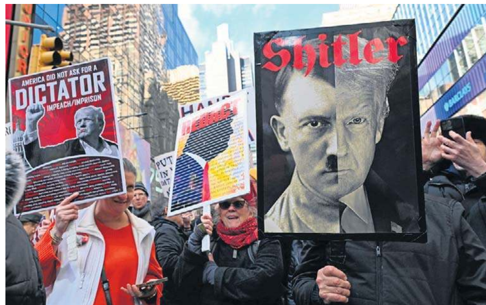
Przeciwnicy Trumpa wyszli na ulice m.in. Nowego Jorku (na zdjęciu), Chicago i Houston. Ale demonstracje odbywały się także w wielu mniejszych miejscowościach

Tak jak w przypadku poprzednich manifestacji w ra-