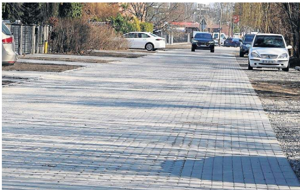
Nowe kryteria utwardzania dróg gruntowych dotyczą inwestycji w latach 2027-2030

W ramach programu utwardzono 150 odcinków ulic - 25% wszystkich. Pozostało ich 445. Osiedlem o największej długości publicznych dróg lokalnych z nawierzchnią gruntową w od-