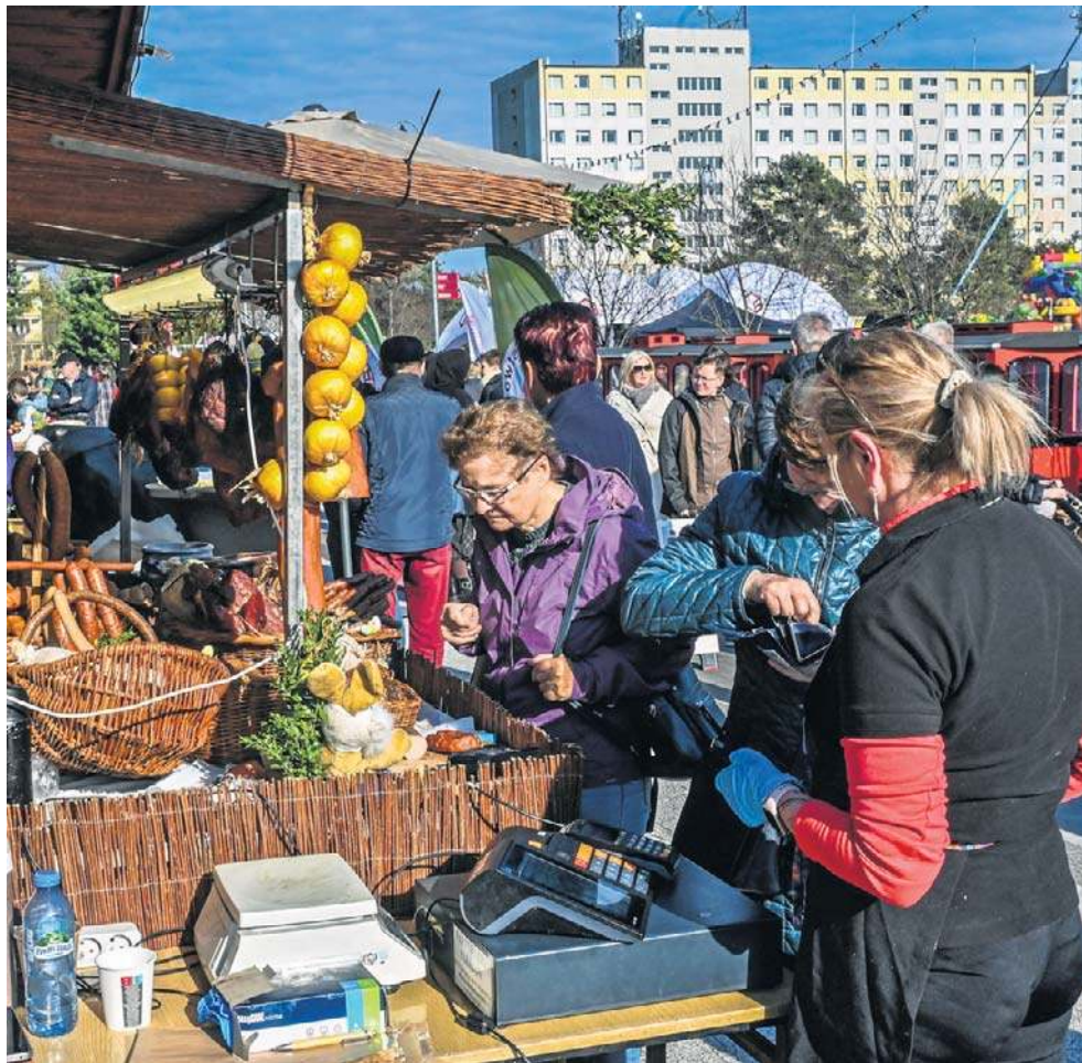
Wielkie otwarcie jarmarku nastąpiło w piątek o godz. 15.

Kolejny weekend aktywnie rozpoczęli miłośnicy biegania, stali uczestnicy ParkRunu.