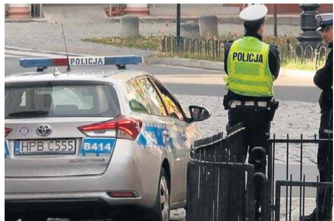
Policja, to nie tylko wystawianie mandatów, to ściganie sprawców morderstw, porwań czy zykłych oszustw gospodarczych. Oplaca się zaciągając do tej służby?