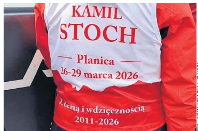
Mimo słabszej dyspozycji, nasz skoczek starał się cieszyć każdą chwilą. Był w centrum uwagi - mediów i kibiców