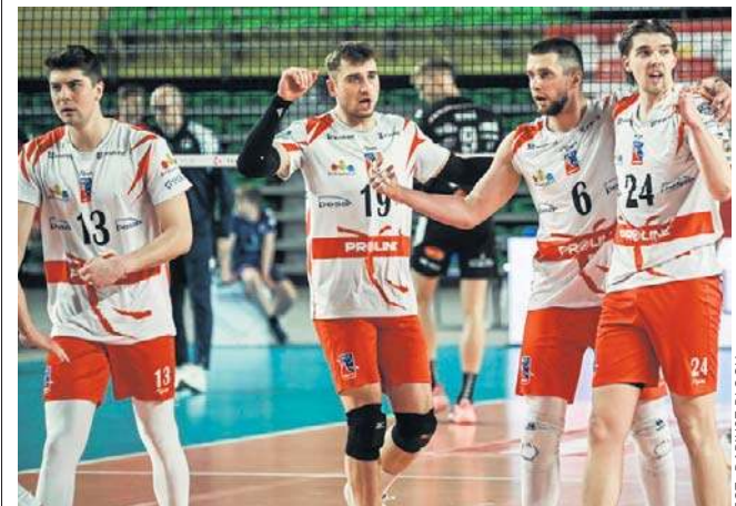
Siatkarze BKS Bydgoszcz mają powody do zadowolenia. Pokonali KPS Siedlce i utrzymali się w PLS 1. Lidze