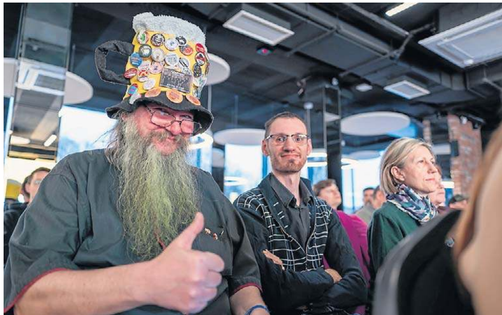
Miłośnicy piwa nie zawiedli i stawili się na spotkaniu o historii bydgoskiego browarnictwa