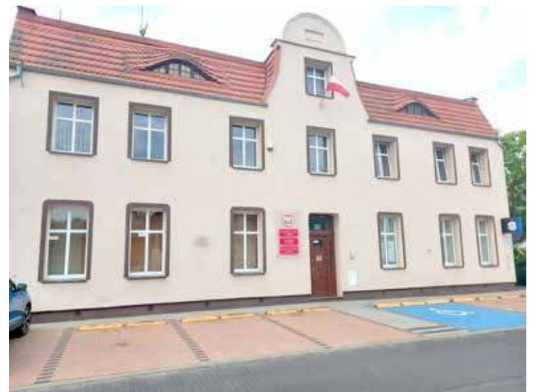
Urząd Miasta i Gminy w Stepnicy