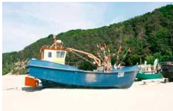
Międzyzdroje to również ostoja rybacka

Z reguły, szczególnie w porze letniej, oblegane przez wypoczywających ludzi. Co oczywiście tylko świadczy o ich atrakcyjności. Gdyby takie nie były, ludzie by nie przyjeżdżali. Linia plażowa w tej gminie zajmuje około szesnaście kilometrów długości. Same plaże, czyste i piaszczyste, potrafią sięgać nawet do stu metrów szerokości. Są więc idealne do spacerów oraz wypoczynku. Nic więc dziwnego, że często się o tym miejscu mówi jako o Perle Bałtyku albo Bursz-