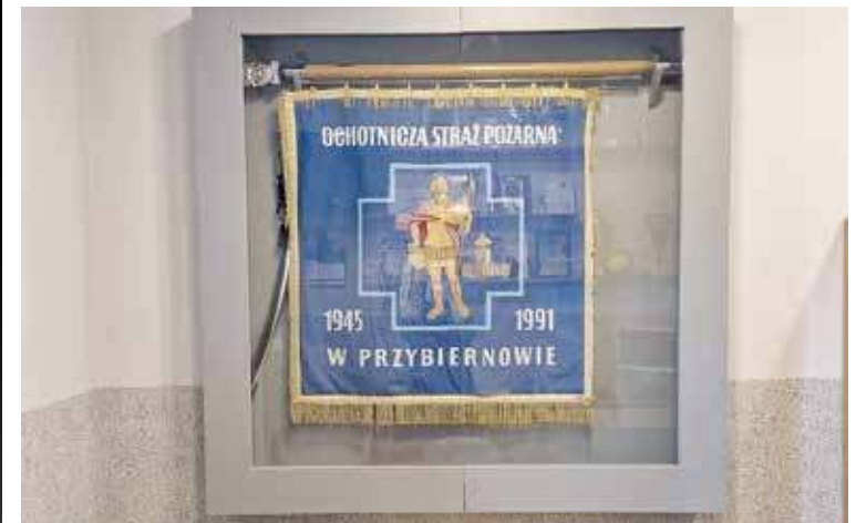
Nowa gablotka na sztandar