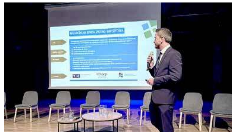
Pruszone zostały tematy ważne dla biznesu