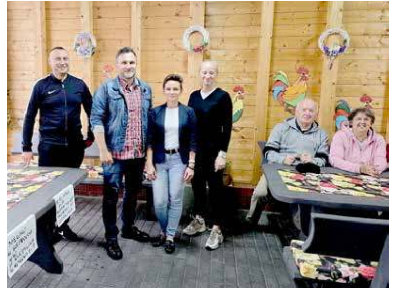
Nowy radny zasilł Radę Sołecką