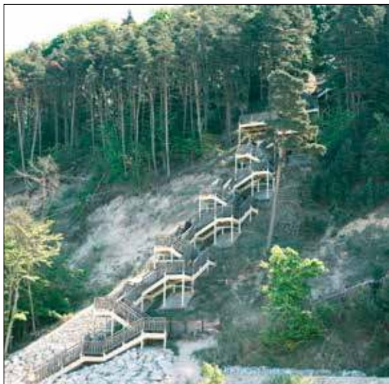
Klify są wizytówką Międzyzdrojów