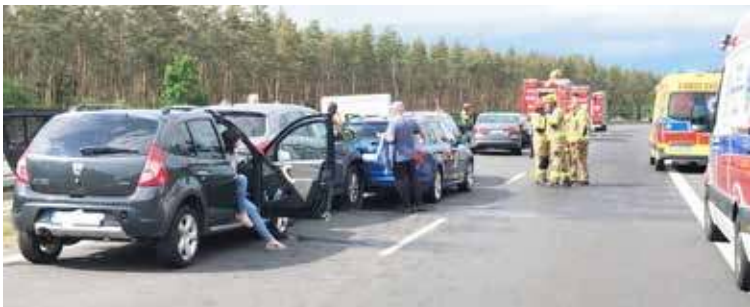
W zdarzeniu uczestniczyło sześć samochodów osobowych