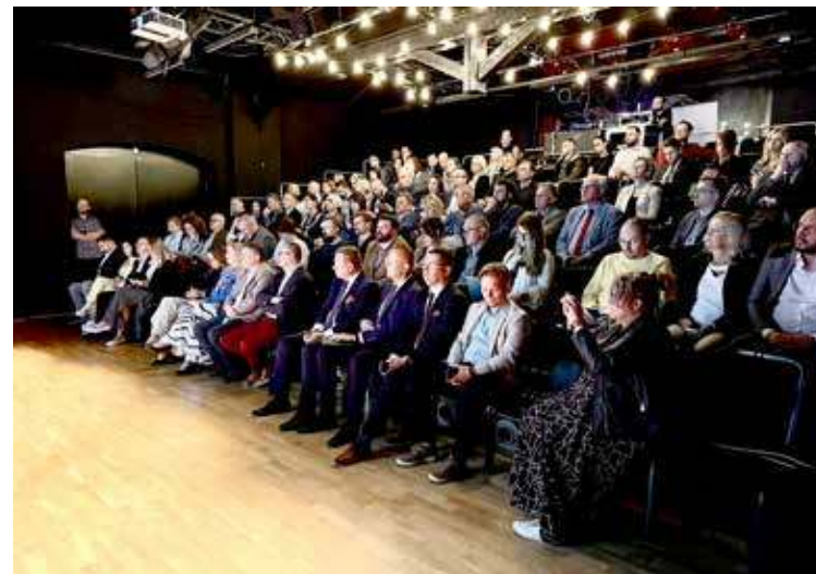
W forum udział wzięła ponad setka osób