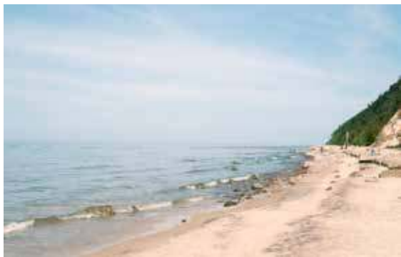
Plaża umożliwia długie spacery wzdłuż morza

pobyt stał się inspiracją do napisania książki, która do tej pory nie straciła na aktualności.”