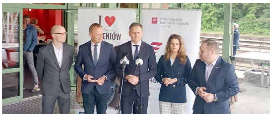
Przed właściwym forum odbyła się krótka konferencja prasowa

przedstawiciele okolicznych gmin oraz radni.