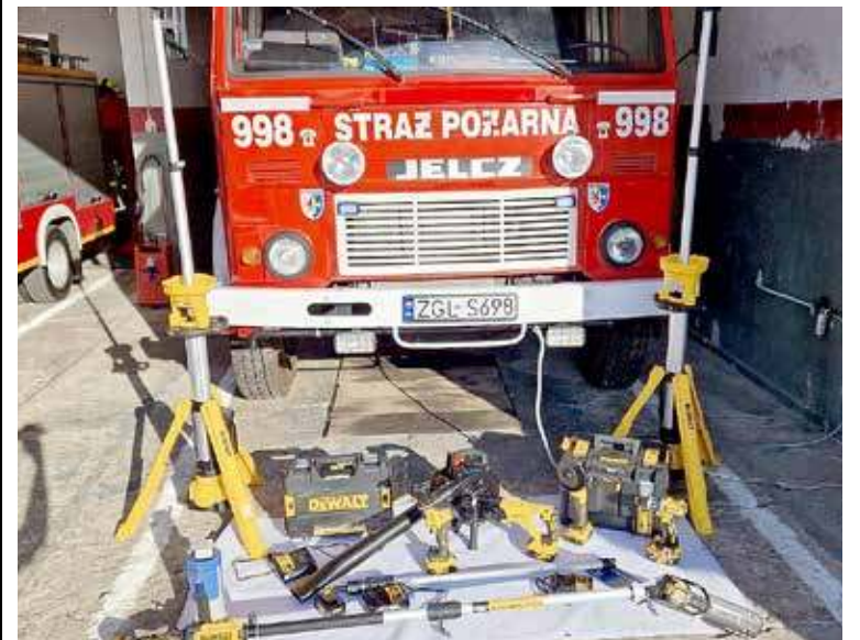
Do jednostki OSP trafił nowy sprzęt