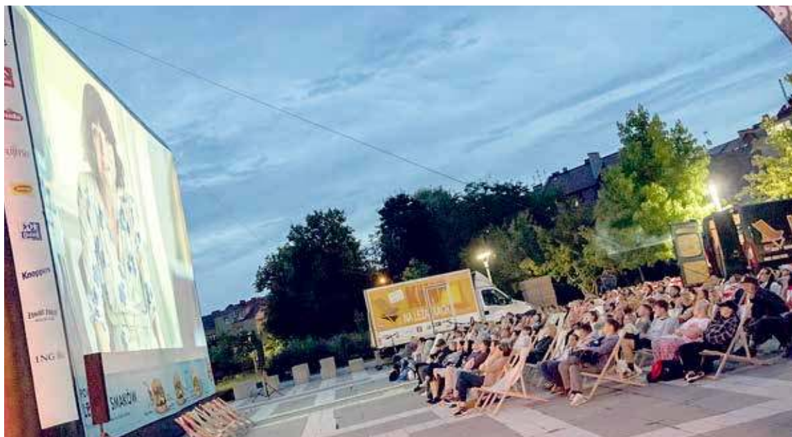
Kino na leżakach zawsze przyciąga wiele osób.

Zaplanowano seans filmu „Sezony”. Jest to polska komedia o miłości. Rola egocentrycznego aktora gra w nim Łukasz Simlat.