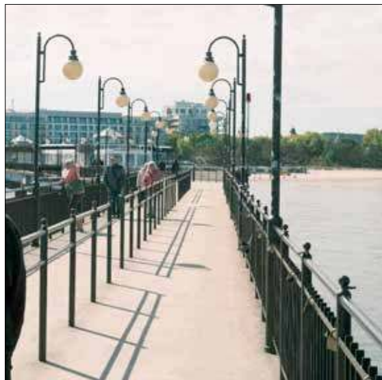
Słynne molo jest idealnym miejscem do spacerów

ówczesnych turystów. Przez ten czas oczywiście wiele się zmieniło, jednak urok Międzyzdrojów pozostał. Jednym z głównych atutów tej gminy są oczywiście plaże.