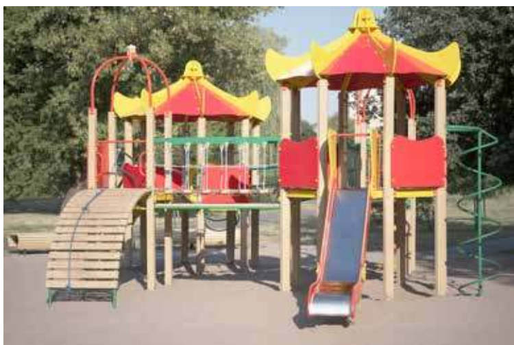
Popularnym projektem jest doposażenie placów zabaw (zdjęcie poglądowe)

Drugim sołectwem jest sołectwo Moracz. Tam zostanie