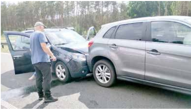
Poszkodowane zostały trzy osoby

W sobotę doszło do zdarzenia drogowego na trasie S3. Udział w nim brało aż sześć samochodów osobowych, które najechały na siebie. Trzy osoby zostały poszkodowane, jedna zaś została przetransportowana do szpitala.