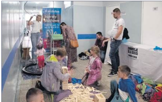
■ Dla odwiedzających przygotowano liczne stoiska tematyczne, a także kąci zabaw dla dzieci