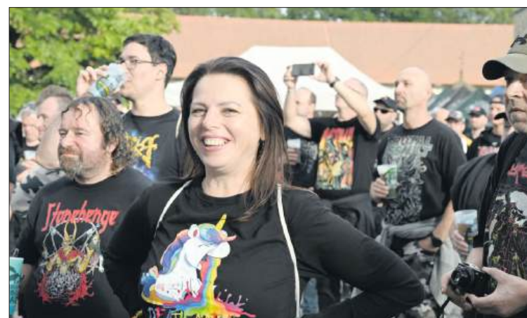
■ Podczas festiwalu nie zabrakło dobrej zabawy

Jedzenia i picia było pod dostatkiem, włącznie z opcjami wegetariańskimi i wegańskimi. Piwo i napoje sprzedawano w kubkach wielokrotnego użytku, co nadawało całej imprezie ekologicznego charakteru. Ceny bardzo przyzwoite, a