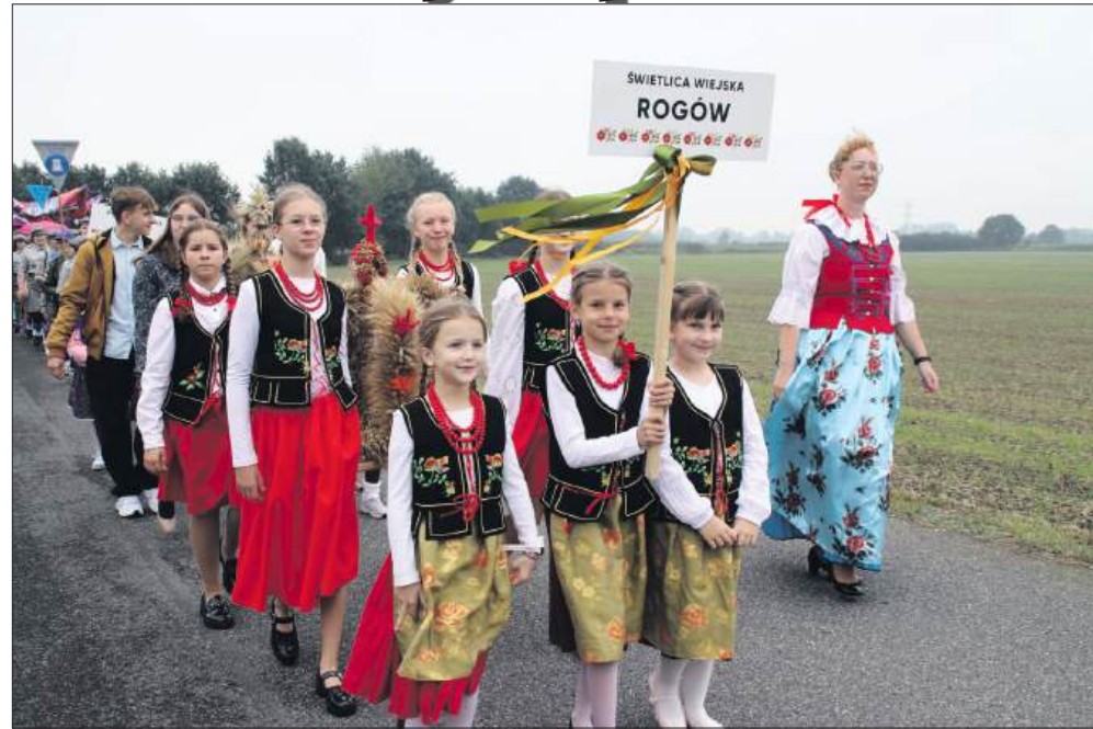
■ W korowodzie każde sołectwo miało swoją reprezentację