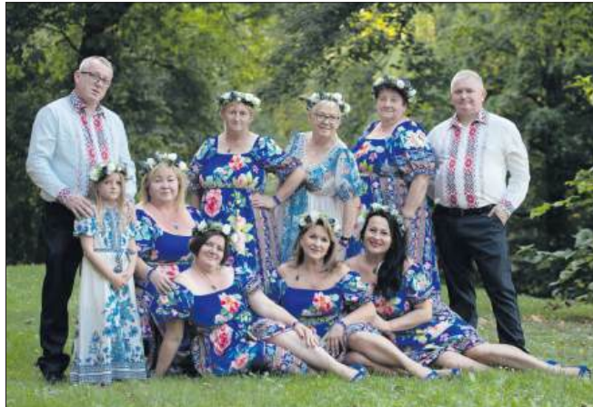
■ Rok sukcesów KGW Buków – wyróżnienia, rekord i nowe projekty

– Tak, udział w finale był dla naszego koła niezwykle inspirującym i wartościowym doświadczeniem. Przede wszystkim nawiązaliśmy nowe kontakty z innymi kołami z różnych regionów Polski, co pozwoliło nam wymienić się doświadczeniami, pomysłami na działania lokalne oraz sposobami radzenia sobie z wyzwaniami organizacyjnymi. Spotkania