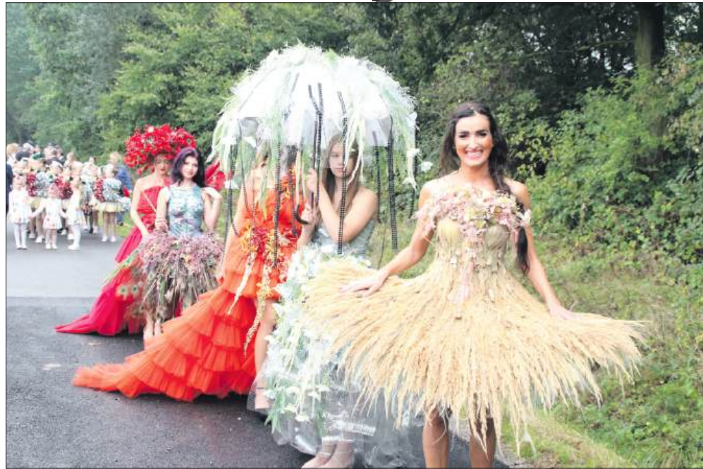
■ Dożynkowy korowód otwierały modelki w nietuzinkowych kreacjach