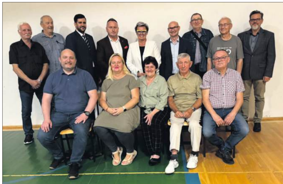
■ Nowa rada dzielnicy Trzy Wzgórza