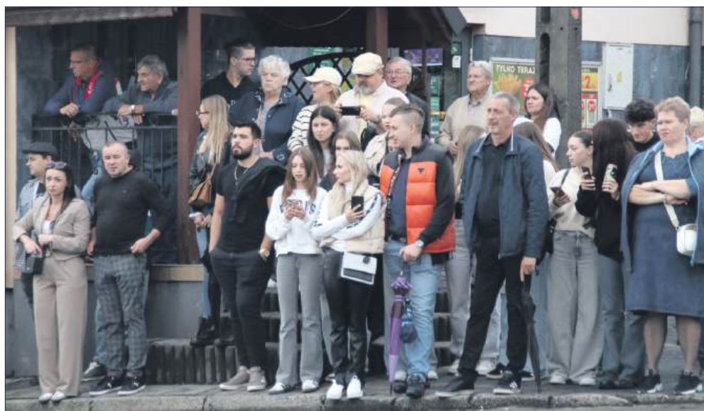
■ Mieszkańcy tłumnie ustawili się na trasie przejazdu korowodu, aby oglądać barwną paradę