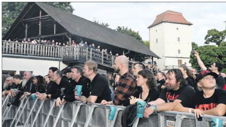
■ Muzyka w otoczeniu zamkowych murów dała ciekawe wrażenia

do Ostrawy. Wychodzi o wiele taniej, bo zapłaciłem dwadzieścia trzy korony. Ale uwaga, do pociągów pośpiesznych obowiązkowo trzeba mieć miejscówkę. Kupicie ją w kasie za 35–50 koron, w zależności od obłożenia konkretnego składu. Jeśli wsiądziecie bez niej, konduktor ma prawo was wysadzić na najbliższej stacji albo wlepić dopłatę w wysokości 500 koron. Lepiej więc załatwić to od razu przy kasie i mieć spokój.