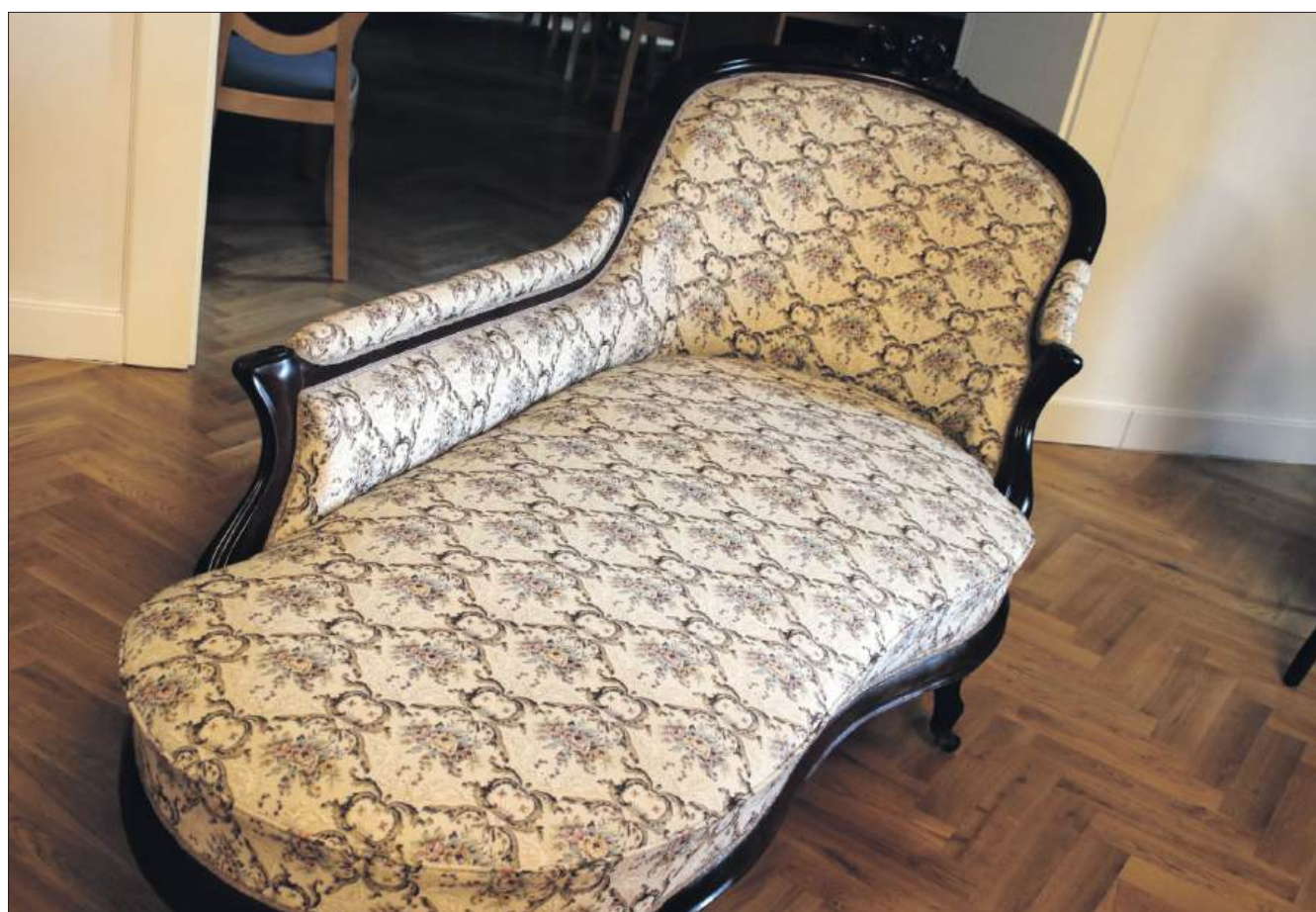
■ W skład zakupionego zestawu wszedł szezlong oraz stół z sześcioma krzesłami

(ska), materiał na podstawie komunikatu Muzeum w Wodzisławiu Śląskim