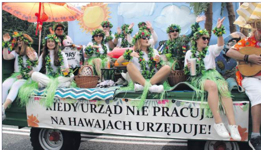
■ Woz dożynekowy został przygotowany z wyjątkową kreatywnością