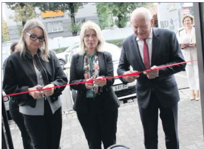
■ Nowy punkt będzie miejscem doradztwa oraz możliwości uzyskania pomocy w ramach konkursów na środki zewnętrzne dla firm.

WODZISŁAW ŚL. Przy ul. Kubsza 28 otwarty został nowy punkt konsultacyjny dla przedsiębiorców, w którym można otrzymać informacje i pomoc w zakresie pozyskania środków unijnych dla firm. Uroczyste otwarcie punktu odbyło się w czwartek 11 września.