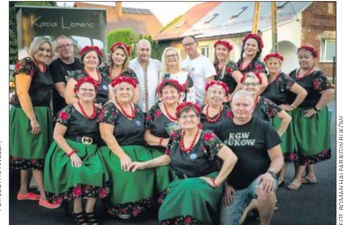
■ W sierpniu w Bukowie odbyło się ciekawe wydarzenie – Matka Zielna

– Tak, będziemy składać wnioski również w przyszłym roku. Naszym priorytetem jest zakup do-