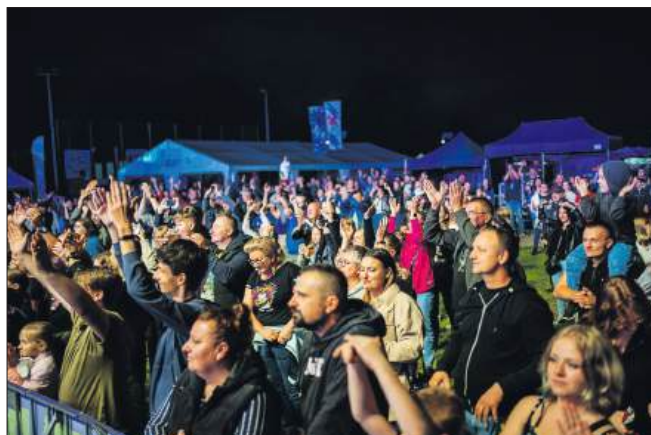
■ Podczas piątkowych koncertów publiczność dopisała