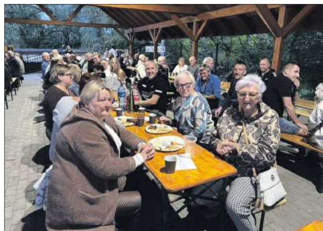
■ Mieszkańcy dzielnicy Wilchwy mieli okazję bawić się na biesiadzie już po raz 5.