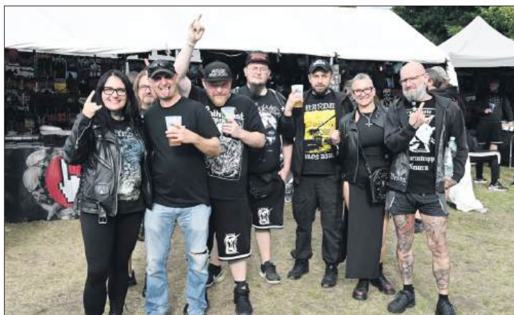
■ Fani ciężkiego brzmienia przyjechali do Ostrawy z Polski i Moraw

Dojazd na festiwal zajął mi siedemdziesiąt minut, z dwiema przesiadkami. Kosztował mnie szesnaście złotych. Jedynie kilka uwag technicznych dla tych, którzy wybiorą się tą trasą. Koleje Śląskie nie oferują biletów elektronicznych do Bohumina. Można je kupić tylko w kasie albo u konduktora. Płatność gotówką i kartą, więc luz. Lepiej kupić bilet do Bohumina, a tam dokupić przejazd