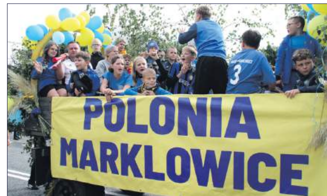
■ Przedstawiciele klubu Polonia Markłowice na swoim wozie dożynekowym