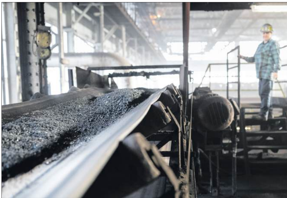
■ Transport mialu na osadzarki w zakładzie przerobczym, zdjęcie ilustracyjne

W sierpniu JSW chwaliła efekty Planu Strategicznej Transformacji. W praktyce oznacza to większą dyscyplinę wydatków i mniejsze nakłady inwestycyjne. Spółka zidentyfikowała 1,857 mld zł efektów, z czego 1,509 mld zł to redukcja inwestycji. Do tego 328 mln zł oszczędności w zakupach (ponad 91% rocznego planu). Równoległe przyspieszają roboty pod ziemią: w