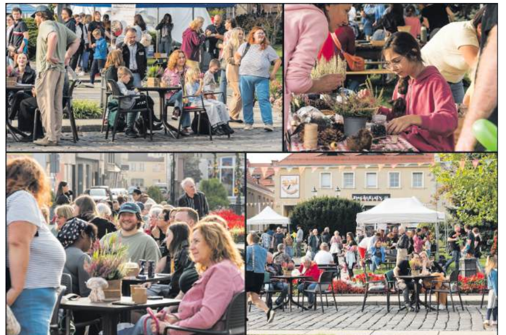
■ Mieszkańcy i goście mogli wziąć udział w warsztatach, degustacjach i wspólnej potańcówce pod gołym niebem.