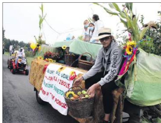
■ Nie zabrakło humorystycznych akcentów