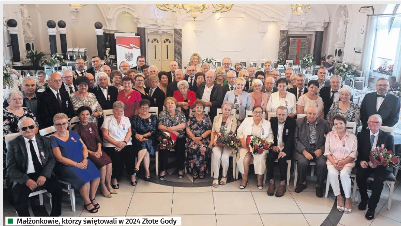
■ Małżonkowie, którzy świętowali w 2024 Złote Gody

Pamiętkowe zdjęcia małżonków, którzy obchodzili Diamentowe i Żelazne Gody zamieścimy w kolejnym numerze Nowin Wodzisławskich