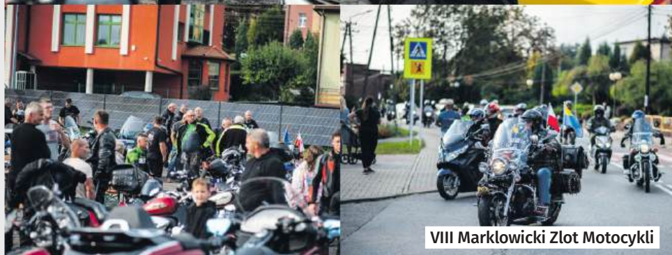
VIII Markłowicki Złot Motocykli

Ryk silników, zapach benzyny i motocyklowa pasja – tak wyglądał VIII Markłowicki Złot Motocykli, który przyciągnął fanów jednośladów z całego regionu. Wydarzenie odbyło się w sobotę 13 września, w przeddzień dożynek gminnych.