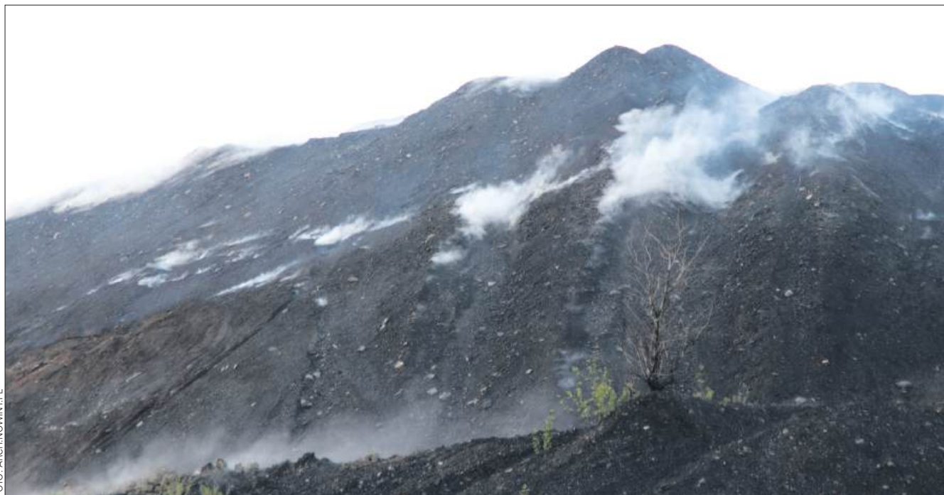
■ Praca na hałdzie potrwa 6 lat.

Po jego zakończeniu przewidziano ponowne kształtowanie bryły zwałowiska. Proces ten obejmie wykorzystanie wystudzonego materiału zmieszanego z materiałem inertnym, czyli obojętnym i niepalnym. W rezultacie hałda zostanie nieznacznie obniżona, zbocza uzyskają łagodniejsze nachylenie, a dodatkowo powstaną niewielkie półki, które poprawią warunki hydrologiczne zarówno samego obiektu, jak i jego otoczenia. W ramach prac zamontowane zostaną również rurki kontrolne,