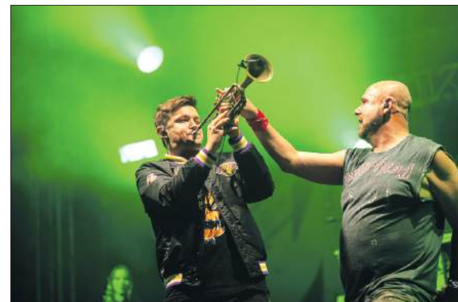
■ Gwiazdą wieczoru był zespół Łydka Grubasa