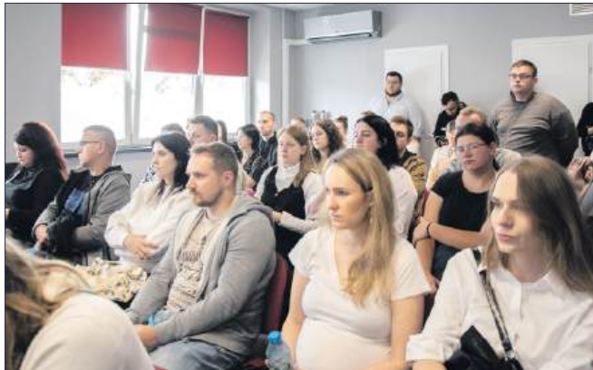
■ Dzień otwarty cieszył się ogromnym zainteresowaniem przyszłych rodziców