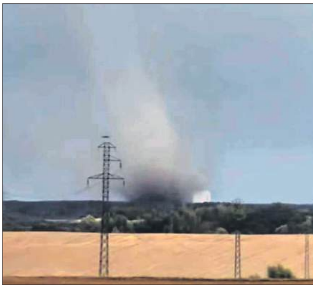
■ Dynamiczny przebieg zdarzeń w pogodzie odnotowano w poniedziałkowe popołudnie w naszym regionie.

Jednak najbardziej spektakularne i niebezpieczne zjawisko odnotowano w Markłowicach, gdzie powstała trąba powietrzna. Powietrzny wir utworzył się nad polami i łąkami, został zarejestrowany na nagraniu, które opublikowali Polscy Łowcy Burz.