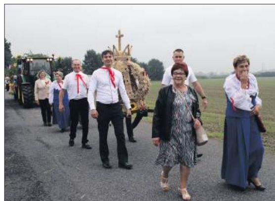
■ Każde sołectwo przygotowało koronę dożynkową