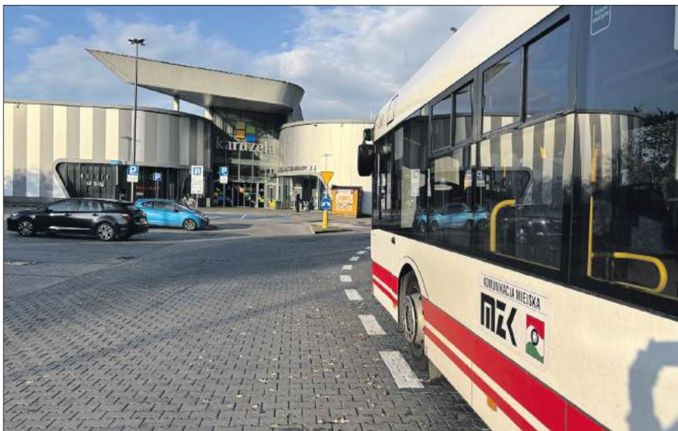
■ Ulgi od 1 października stracą m.in. mieszkańcy Wodzisławia Śląskiego

W przypadku Wodzisławia Śląskiego brakująca kwota to rocznie ok. 4,3 mln zł, w przypadku Rybnika 2,5 mln zł. Również Żory nie pokrywają w całości kosztów komunikacji MZK na swoim terenie. W tym przypadku mówimy o kwocie ok. 500 tys. zł rocznie. Władze Wodzisławia nie płacą, ale i publicznie mówią o chętnym wykorzystaniu funduszy innych samorządów. – Skoro nie płacimy i mamy ko-