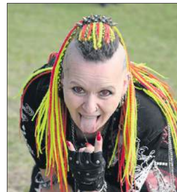
■ Wśród publiczności nie zabrakło barwnych postaci

przy stoiskach można było znaleźć wszystko: płyty, koszulki, naszywki, gadżety.