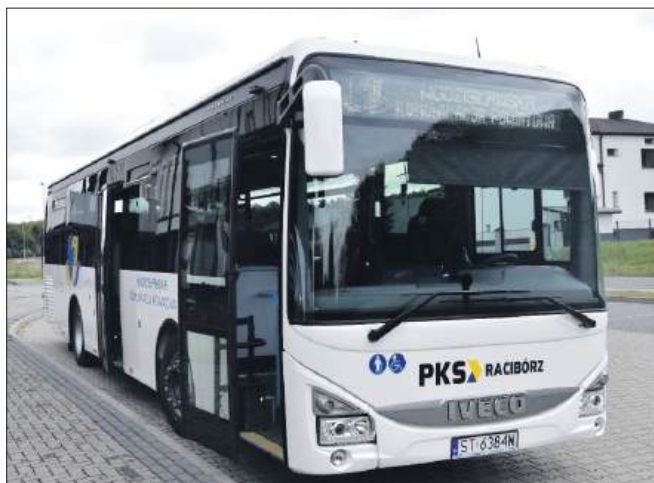
■ Autobus Wodziszławskiej Komunikacji Powiatowej