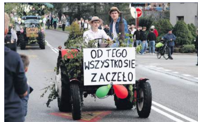
■ W korowodzie nie zabrakło licznych traktorów, mniejszych i większych.