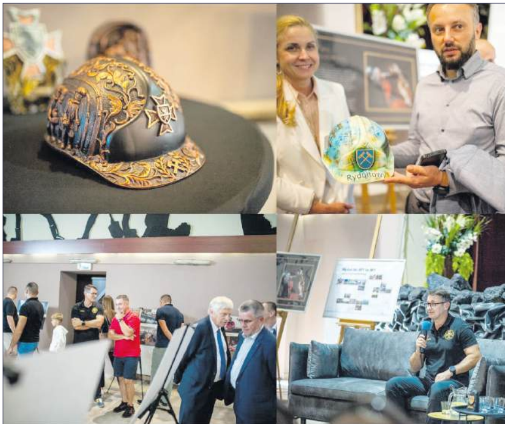
■ Połączenie sztuki i ciężkiej pracy górników oraz ratowników – to można było obejrzeć i usłyszeć w „Domu Orkiestry”

W mrocznych korytarzach kopalni każdy dzień to walka – o bezpieczeństwo, o życie, o powrót na powierzchnię. Tę rzeczywistość przybliżyły fotografie, które otworzyły uczestnikom drzwi do świata zwykle ukrytego przed oczami innych. Obrazy pełne napięcia z ćwiczeń ratowniczych i emocji z akcji ratunkowych