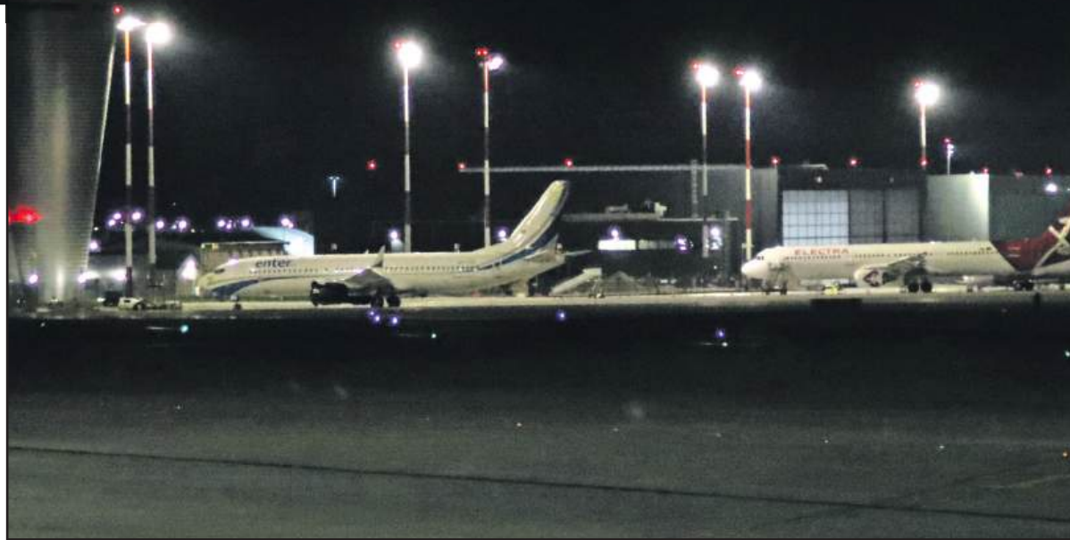
■ W lipcu i sierpniu śląskie lotnisko obsłużyło prawie 1,94 mln pasażerów.

- Za nami najlepsze wakacje kalendarzowe w historii Katowice Airport. W trakcie dwóch wakacyjnych miesięcy obsłużyliśmy prawie 1,94 mln pasażerów, w tym około 1,2 mln w segmencie ruchu czarterowego. Sezon letni jeszcze się nie kończy, a ruch we wrześniu nadal jest na bardzo wysokim poziomie. W tym miesiącu spodziewamy się około 880 tys.