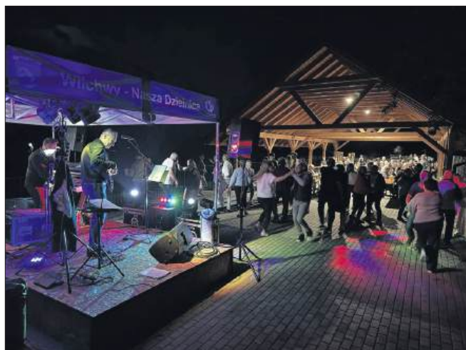
■ Do zabawy podczas biesiady zaprosił zespół Vizard