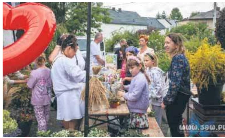
Tworzenie lasu w słoiku – to dopiero frajda