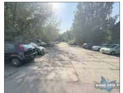
Parking na przeciwko Klubu Relax

Zakończenie prac na pierwszym fragmencie ulicy Szczakowskiej planowane jest na początek listopada. Do skończenia fir-