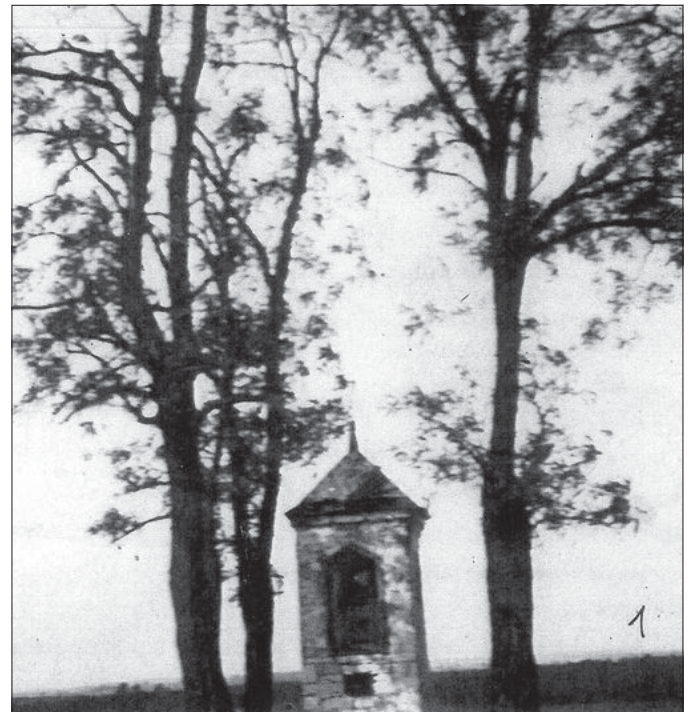
Stara kapliczka na Długoszyńcu przy ulicy J. Długosza – dawniej latarnia umarłych – tu tutaj ukryte miało być żydowskie złoto – ul. Długosza

Warto posłużyć się tutaj przykładem niewielkiej kapliczki, która stoi do dziś przy ulicy Jana Długosza. Wciśnięta jest w posesję rodziny Lisów, a wiąże się to z faktem, że trzeba ją było nieco przemieścić w kierunku północnym w związku z przebudową drogi, która miała miejsce ponad dwie dekady temu. Tak więc uczyniono; rozebrano starą – ale co ciekawe, wewnątrz niej odkryto mniejszą kapliczkę, zbudowaną z tzw. cegły austriackiej. Kapliczka ta miała formę „słupa” ze stromym, czterospadowym daszkiem, a w jego obrębie znajdowały się charakterystyczne wnęki. Wiele wskazuje na to, że w przeszłości obiekt ten był tzw. „latarnią umarłych”, czyli w pewnym sensie punktem orientacyjnym. We wnękach takich zwyczaj palono kaganki, a płomyk widoczny był z daleka. Jest wszak równie prawdopodobne, że „latarnia” ta postawiona została tutaj nie tylko z przyczyn orientacyjnych, ale być może była symboliczną, a może i realną mogiłą, wskazującą na ewentualne miejsce pochówku usytuowane gdzieś w pobliżu. Kilka razy zetknąłem się bowiem z ustnym przekazem, że całkiem niedaleko, w obrębie tzw. Moniska chowano ludzi zmarłych na cholera. Ale czy to prawda? Rzecz raczej nierozstrzygalna.