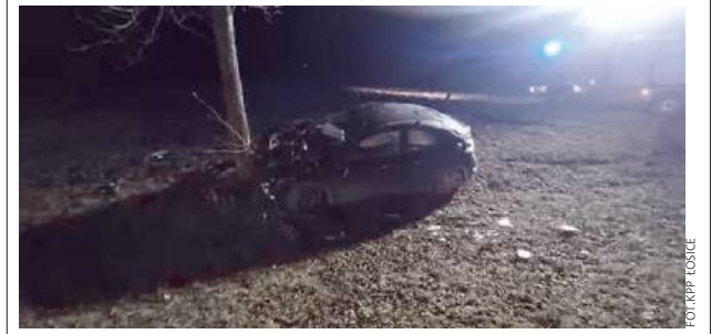
Mężczyzna złamał dożywotni zakaz prowadzenia pojazdów.

W sobotę, 30 listopada, około godz. 21:00, oficer dyżurny łosickiej policji otrzymał zgłoszenie o wypadku drogowym, do którego doszło na trasie Stara Kornica – Łosice, w miejscowości Rudka. Na miejsce natychmiast udał się patrol ruchu drogowego. Z ustaleń funkcjonariuszy wynika, że kierujący hondą, 43-letni mężczyzna, z nieustalonych przyczyn stracił panowanie nad pojazdem, w wyniku czego uderzył w przydrożne drzewo. W wyniku wypadku zarówno kierowca, jak i pasażerka zostali przewiezieni do szpitala. Policjanci ustalili, że mężczyzna złamał dożywotni zakaz prowadzenia pojazdów, który został nałożony przez sąd. Dodatkowo samochód, którym jechał, nie posiadał aktualnych badań technicznych. Za popełnione przestępstwa odpowie przed sądem. To zdarzenie stanowi przykład skrajnej nieodpowiedzialności na drogach. Kierowca, ignorując sądowy zakaz, narażał siebie i innych uczestników ruchu drogowego na poważne niebezpieczeństwo. RED.