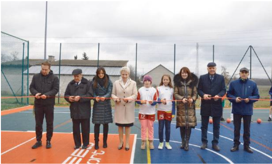
Symboliczne przecięcie wstęgi jest wspaniałym początkiem dla tego miejsca

Przy udziale dzieci i młodzieży nastąpiło otwarcie zmodernizowanego boiska wielofunkcyjnego w Repkach, które zre-