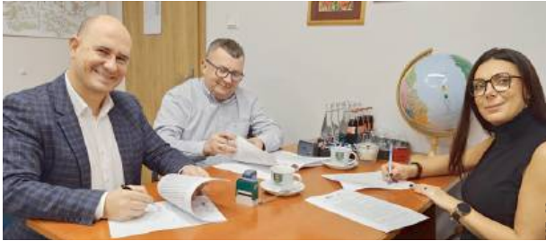
Umowy podpisano w Urzędzie Gminy Garwolin

Mowa o drogach w gminie Garwolin, które dzięki zaplanowanej inwestycji będą lepiej widoczne. Jak poinformował Urząd Gminy Garwolin umowy na modernizację oświetlenia zostały podpisane.