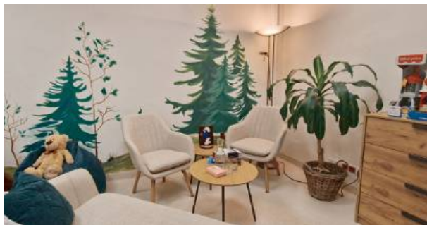
Koszt projektu wyniósł 5 tys. złotych.

W Miejskim Ośrodku Pomocy Rodzinie w Siedlcach powstał pokój terapeutyczny, stworzony z myślą o osobach w kryzysie, a w szczególności dzieciach i młodzieży.