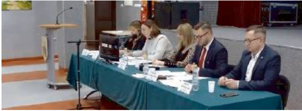
Radni uchwaliли niższe stawki podatków od nieruchomości.

Na ostatniej sesji Rady Miejskiej w Mordach, która odbyła się 29 listopada, zapadły decyzje, które mają duże znaczenie dla lokalnej społeczności. Obniżenie podatków, wstępne lokalizacje nowych przystanków komunikacyjnych oraz inwestycje, które zrealizują kluczowe projekty, były głównymi punktami obrad.