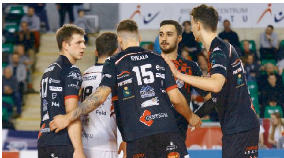
Kibice nie mogli narzekać na brak intensywnych i zaciętych wymian.

W pierwszym secie po wyrównanym początku (7:7) gospodarze z Bydgoszczy zaczęli dominować. Prowadzili 12:8 i 14:11, ale Siedlce nie poddały się i w końcówce przejęły inicjatywę, pewnie wygrywając. Najwięcej punktów dla gości zdo-