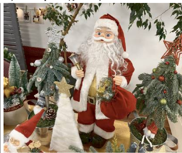
Wydarzenie wprowadziło mieszkańców w istic świąteczny klimat.

W dniach 29-30 listopada park handlowy Arche w Siedlcach zamienił się w przestrzeń pełną świątecznych inspiracji i ciepłej atmosfery. To właśnie tutaj odbyła się 27. edycja targów rękodzieła artystycznego, które od lat cieszą się niegasnącą popularnością. Wydarzenie, wpisane już w tradycję miasta, wprowadziło mieszkańców w wyjątkowy klimat Bożego Narodzenia, łącząc aurę świątecznej radości z promocją lokalnej twórczości.