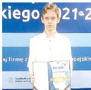
Gala wręczenia nagród i wyróżnień odbyła się w siedzibie Lubelskiej Agencji Wspierania Przedsiębiorczości.

Zadanie konkursowe polegało na stworzeniu pracy plastycznej w formacie A3, której tema-