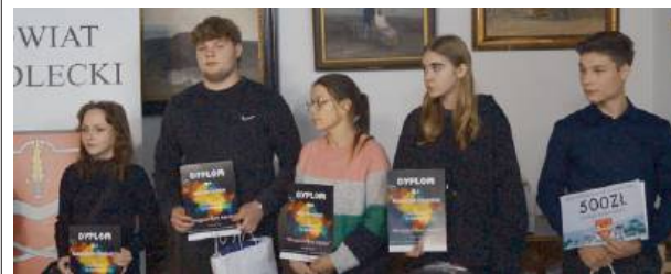
Konkurs miał na celu uwiecznienie na zdjęciach przyjaźni.

W Domu Pracy Twórczej Reymontówka odbyła się uroczystość wręczenia nagród w konkursie fotograficznym „Przyjaźń bez barier”, organizowanym przez Stowarzyszenie na Rzecz Osób z Zespołem Downa „Zawsze Razem”. Nadesłane prace ukazały piękno przyjaźni, która nie zna granic, oraz przypomniły, jak ważne jest budowanie relacji opartych na szacunku i akceptacji, niezależnie od wszelkich różnic.