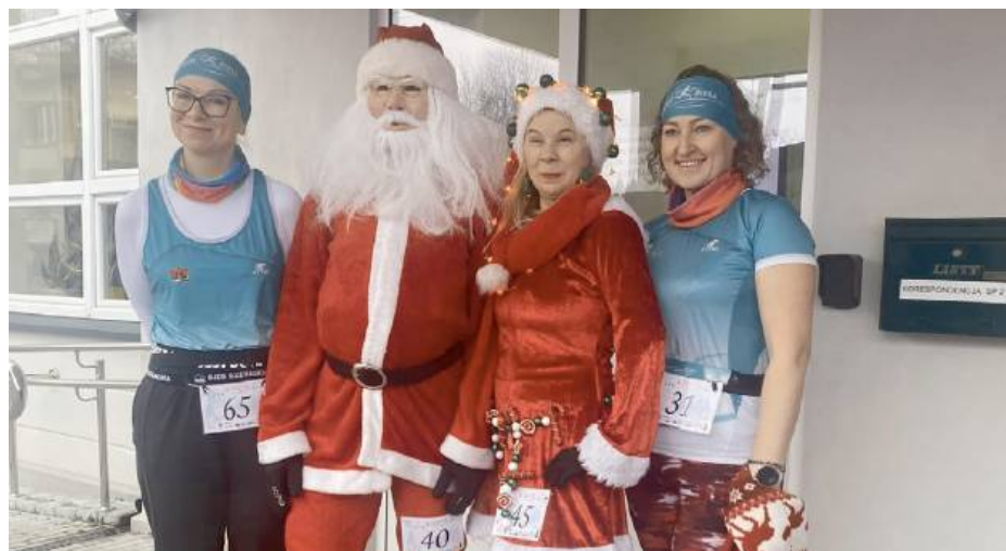
Niepowtarzalny klimat biegu stworzyli sami uczestnicy.