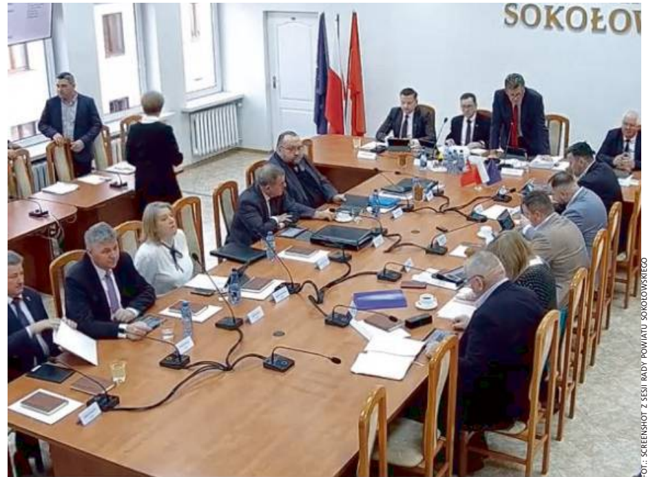
Plan naprawczy to kolejne podejście do uzdrowienia sokołowskiego szpitala.

Program naprawczy zakłada szereg działań rozłożonych na lata 2025–2026. Wśród nich znajdują się reorganizacja oddziałów szpitalnych, wprowadzenie ściślejszego nadzoru nad stolarzami okiennymi. Ale w dokumencie znalazły się też punkty, które wywołują szczególne kontrowersje – m.in. planowane zwolnienia pielęgniarek. „Jeśli powiat chce w ten sposób rato-