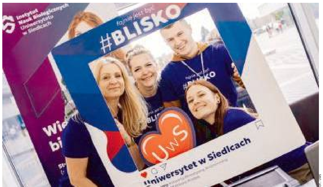
Tego dnia Uniwersytet tętnił życiem.

Już zapraszamy na kolejne Dni Otwarte za rok, ale zapewniamy, że Uniwersytet w Siedlcach ma zawsze szeroko otwarte drzwi dla wszystkich mieszkańców miasta, a pracownicy chętnie dzielą się efektami swoich badań. Do zobaczenia na Uniwersytecie.