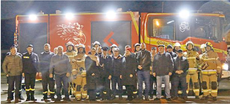
Pojazd jest wart ponad 2,3 miliony złotych, cechuje go bogate wyposażenie i sprzęt najwyższej klasy.

- Samochód ten ma, jak na nasze potrzeby, idealne wyposażenie. Najbardziej cieszy nas to, że teraz będziemy mieli w tym pojeździe dużo więcej