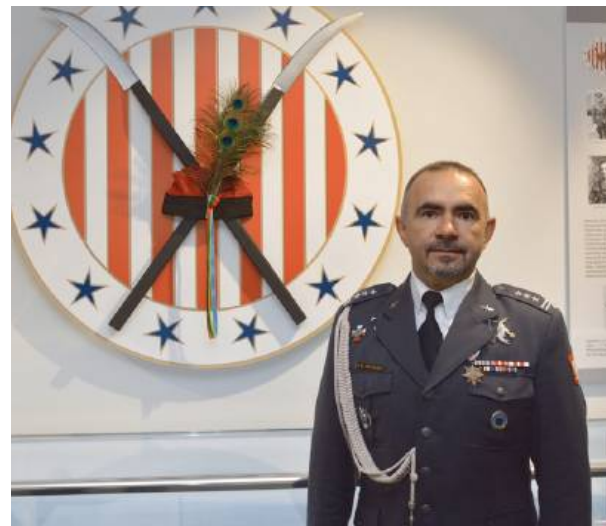
FOT. FB - 23. BAZA LOTNICTWA TAKTYCZNEGO W MIŃSKU MAZOWIECKIM

Najważniejszym momentem ceremonii było przekazanie Sztandaru 23. BLT, symbolizują