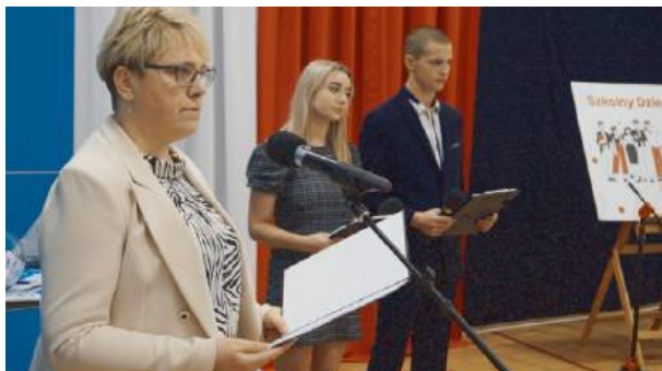
Kolejowe BCU ma powstać już wiosną przyszłego roku.

W Zespole Szkół Ponadpodstawowych nr 6 im. gen. Józefa Bema w Siedlcach już po raz dziewiąty odbył się Szkolny Dzień Kolejarza.