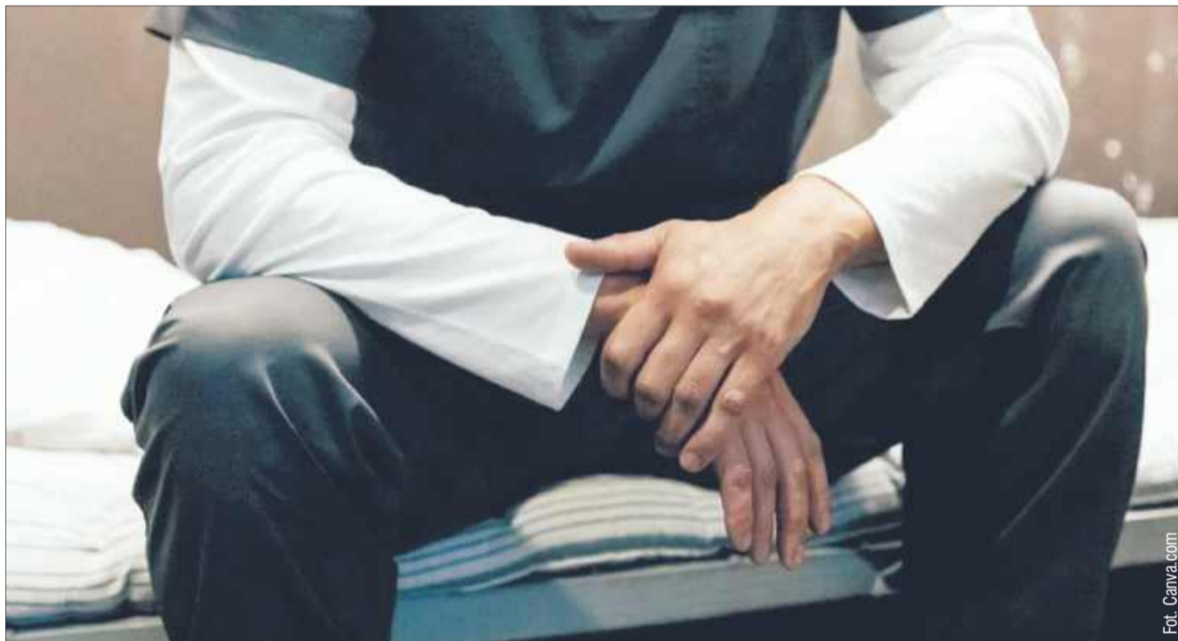
Obywatelskie ujęcie pedofila. 34-latek trafił do aresztu.

Sprawa wyszła na jaw dzięki czujności ojca nastolatki oraz interwencji tzw. łowców pedofilów. To oni doprowadzili do obywatelskiego ujęcia podejrzanego, a następnie przekazali go