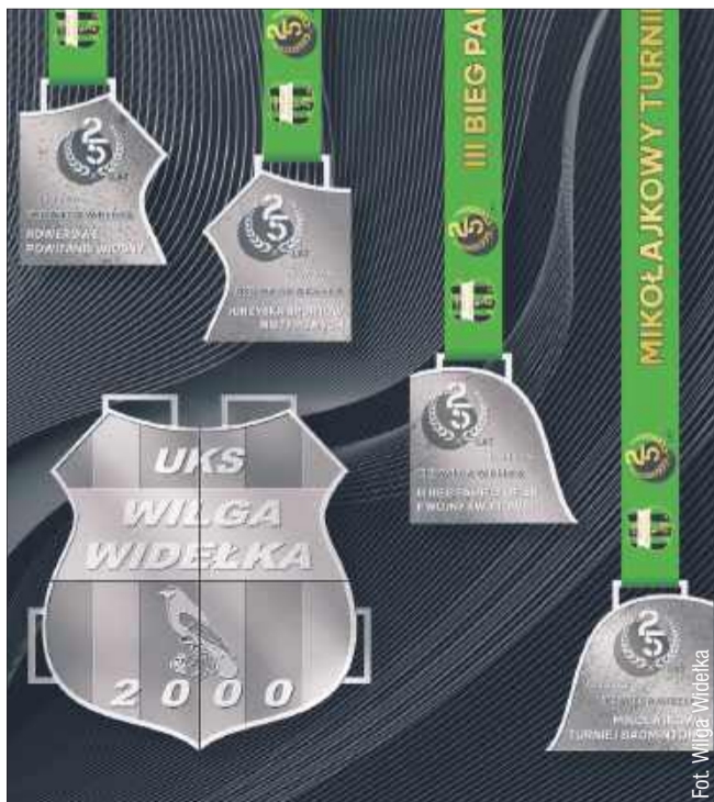
Tak wyglądają jubileuszowe medale.

informacji na temat planowanych wydarzeń w najbliższych tygodniach i miesiącach. kz