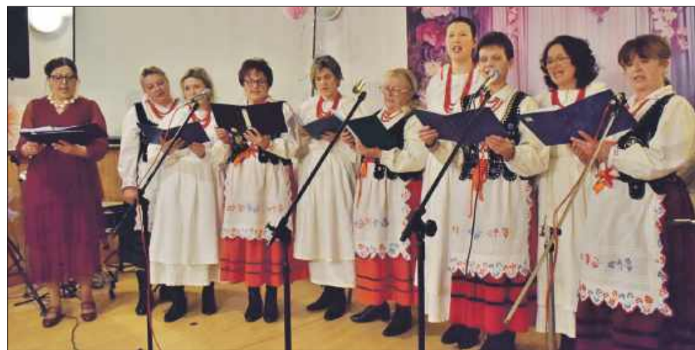
Panie z KGW zaśpiewały dla zgromadzonych gości.