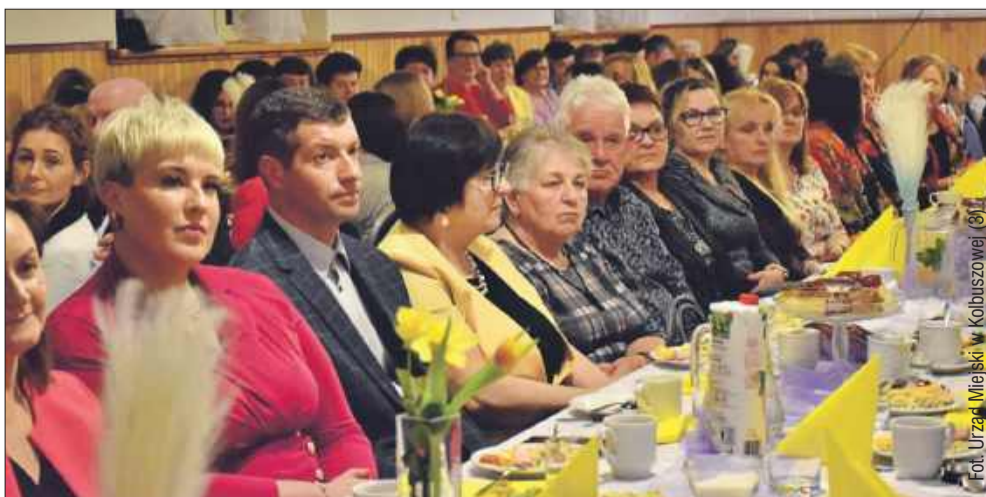
Sala w domu ludowym pękła w szwach.

Obchody Dnia Kobiet w Widelce były doskonałą okazją do wspólnej zabawy, integracji i uhonorowania osób zasłużonych dla lokalnej społeczności. Wydarzenie na długo pozostanie w pamięci uczestników, którzy chętnie wzięli udział w świętowaniu i wspólnych rozmowach. kz