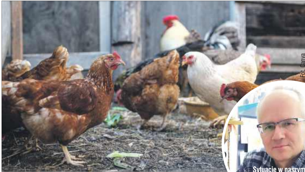
Choć w powiecie kolbuszowskim sytuacja jest spokojna, w sąsiednim powiecie mieleckim wykryto dwa ogniska rzekomego pomoru drobiu.

Po potwierdzeniu zakażeń laboratorium wdrożono natychmiastowe procedury likwidacyjne.