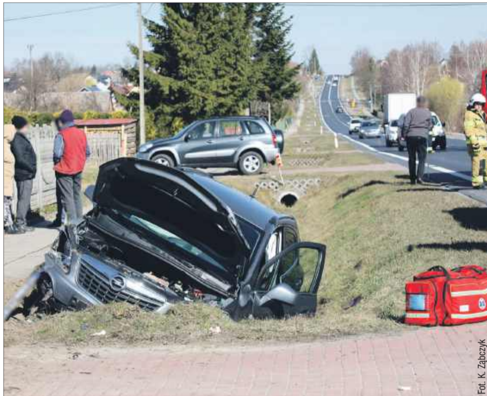
Opel po zderzeniu wylądował w rowie.