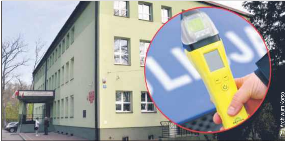
Nauczyciel pracujący w szkole w Weryni po raz kolejny przyszedł do pracy, będąc pod wpływem alkoholu.

14 maja 2024 r. w godzinach południowych policjanci otrzymali zgłoszenie dotyczące wykonywania czynności zawodowych w stanie nietrzeźwości przez nauczyciela weryńskiej placówki. Chodzi o nauczyciela przedmiotu zawodowego, który w szkole w Weryni pracuje od ponad 10