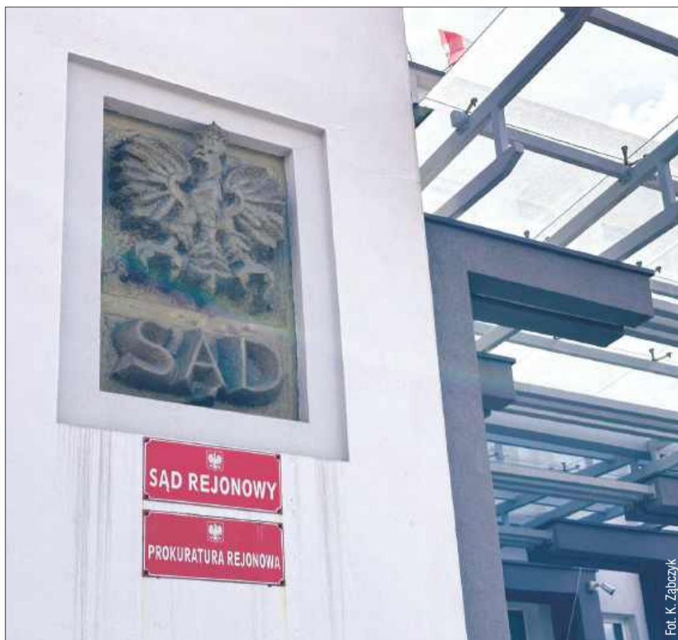
Sąd Okręgowy w Tarnobrzegu utrzymał w mocy decyzję Sądu Rejonowego w Kolbuszowej. Co to oznacza w praktyce?