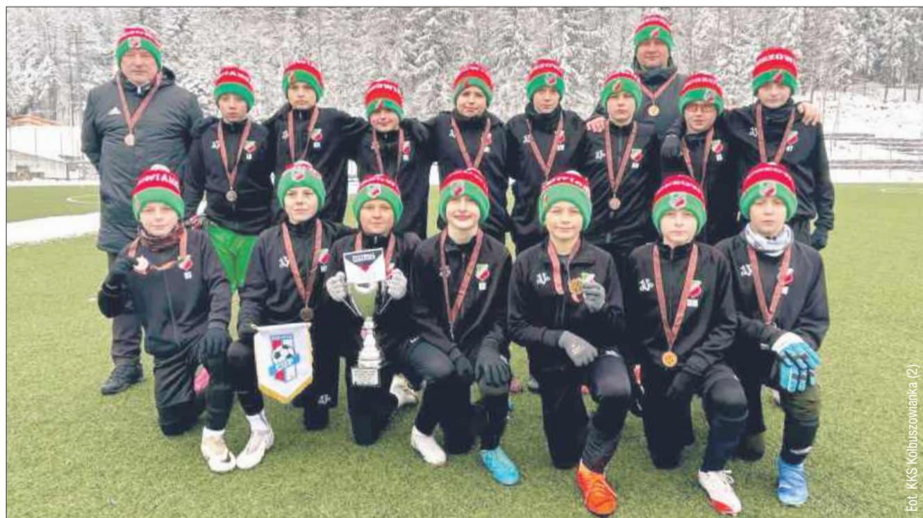
Młoda reprezentacja Kolbuszowianki wywalczyła w Zakopanem trzecie miejsce.