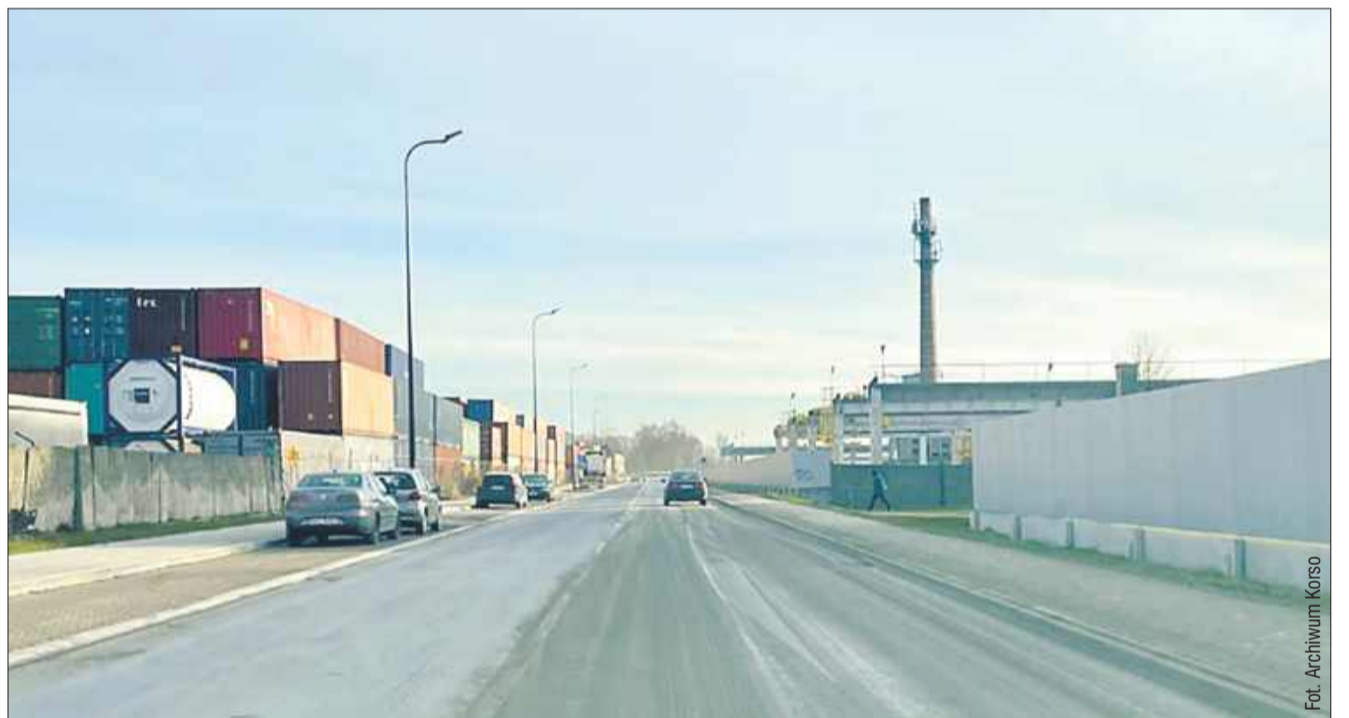
Tumany kurzu albo błoto na ulicy, z takim problemem często borykają się użytkownicy drogi przy ul. ks. Ruczki w pobliżu terminalu przeładunkowego.

Firma PCC Intermodal S.A. wskazuje, że operacje przeładunkowe są związane z koniecznością wykonywania manewrów kolejowych, co może skutkować okresowym zamknięciem przejazdu kolejowego na ul. Sokołowskiej. - Podjęto działania mające na celu ograniczenie ich uciążliwości dla mieszkańców - za-