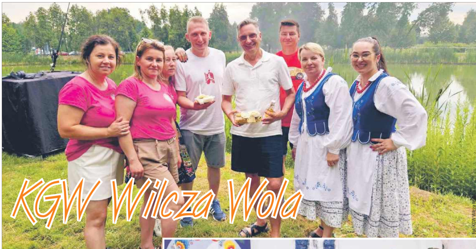
Koło Gospodyń Wiejskich w Wilczej Woli to młody i zgrany zespół pełen werwy.

Koło Gospodyń Wiejskich „WILCZANIE” w Wilczej Woli powstało 15 lutego 2021 roku. Liczy od samego początku 41 członków.