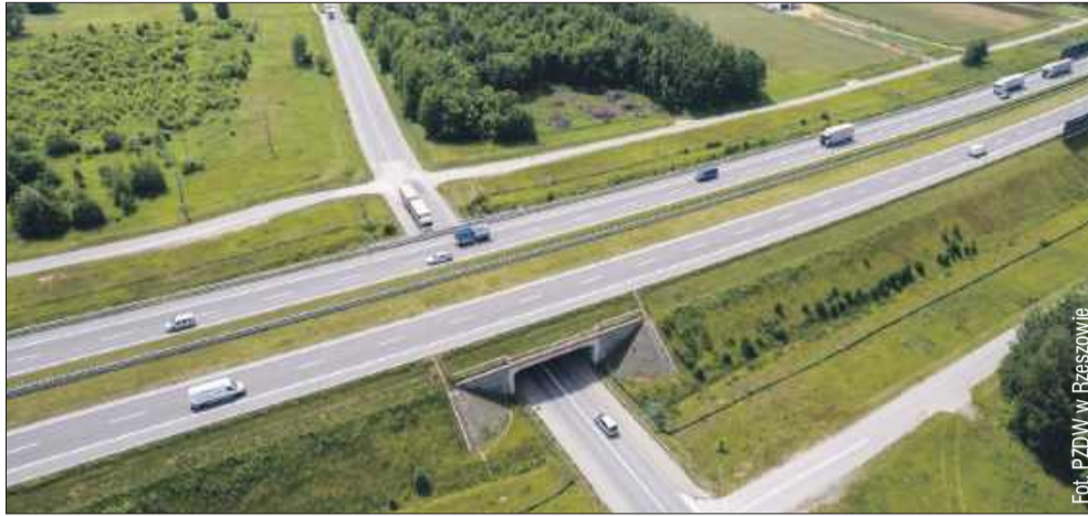
9 ofert wpłynęło na budowę nowego węzła na autostradzie A4 w Ostrowie k. Ropczyc

– Realizujemy odważne inwestycje, takie jak budowa nowych mostów, obwodnic czy węzłów drogowych. Konsekwentnie dbamy o rozwój gospodarczy Podkarpacia poprzez rozbudowę infrastruktury drogowej – podkreśla marszałek województwa Władysław Ortyl.