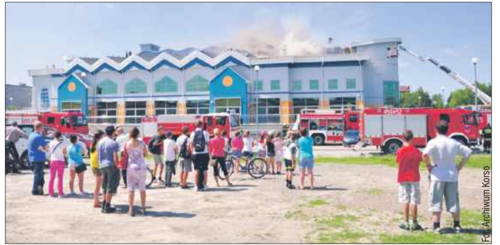
Przypomnijmy, że do największego pożaru w powiecie kolbuszowskim w ciągu ostatnich 10 lat doszło 19 czerwca 2013 roku w samym sercu Kolbuszowej przy ul. Jana Pawła II. Mowa o pożarze dachu krytej pływalni „Fregata”.

Koszty napraw i bieżących wydatków w 2024 roku wyniosły ponad 400 tys. zł. W 2025 roku planowane są kolejne prace remontowe, m.in. modernizacja dachu, odnowienie szatni i remont łazienek. Szczególną uwagę trzeba zwrócić na przestarzałą saunę, która może stanowić za-