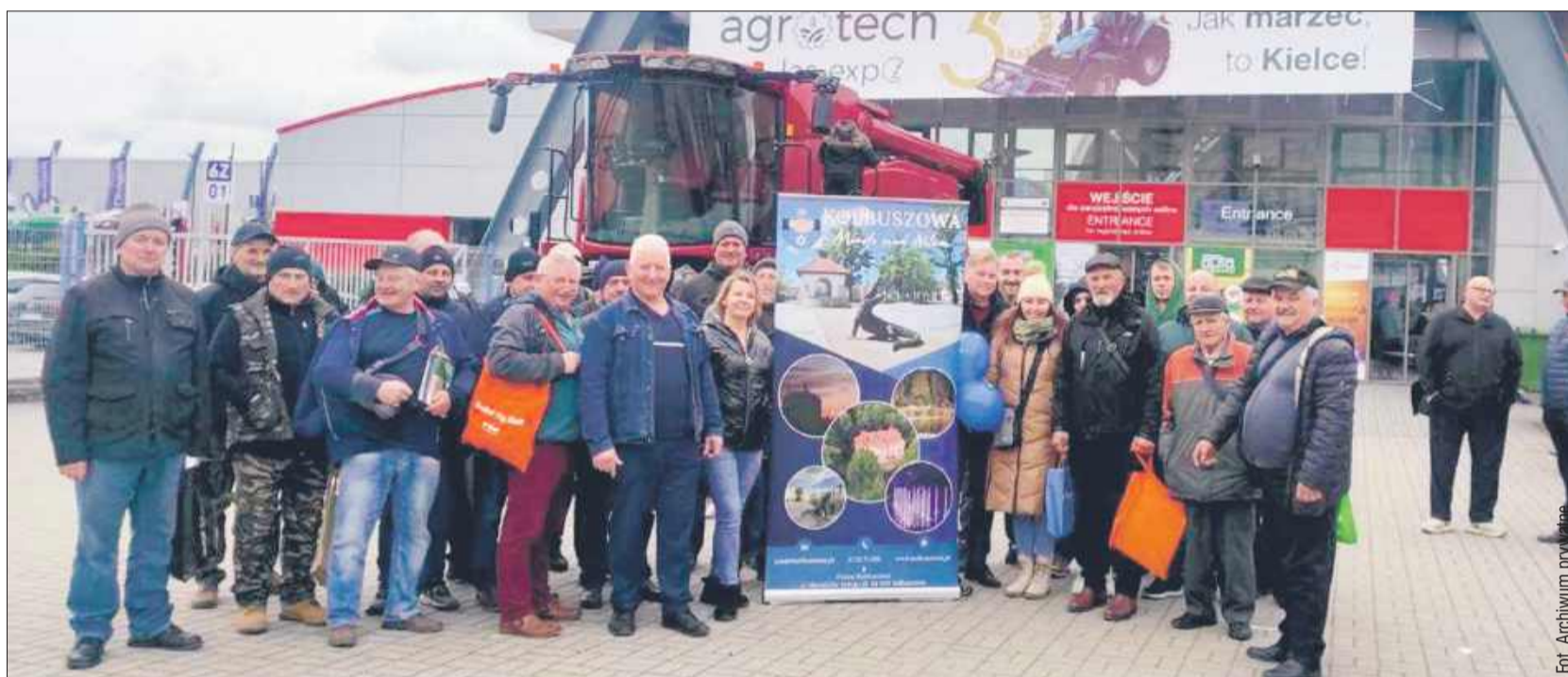
Kilkudziesięciu rolników z powiatu kolbuszowskiego wzięło udział w tegorocznych targach.

Wyjazd rolników z powiatu kolbuszowskiego wsparli finansowo m.in. burmistrz Kolbuszowej, mieszalnia pasz z Kolbuszowej oraz izby rolnicze, co umożliwiło uczestnictwo rolnikom z naszego regionu w tym prestiżowym wydarzeniu. Bartosz Posluszny