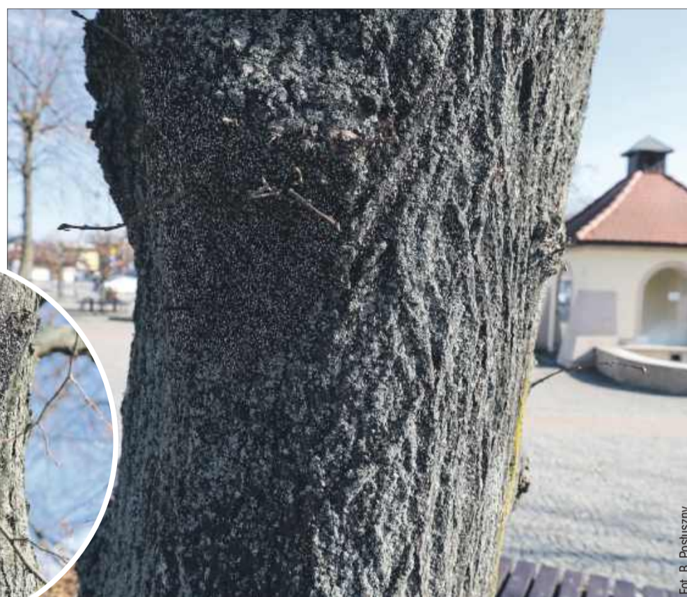
Drzewa na kolbuszowskim rynku zaczęła toczyć dziwna choroba. Co to takiego?