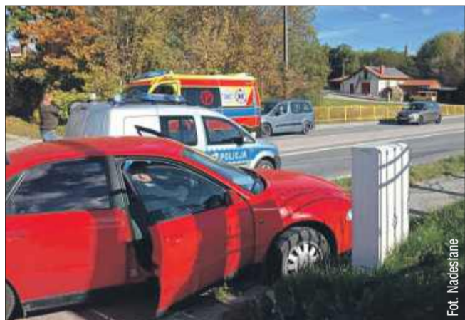
Do zdarzenia doszło 23 października ubiegłego roku.