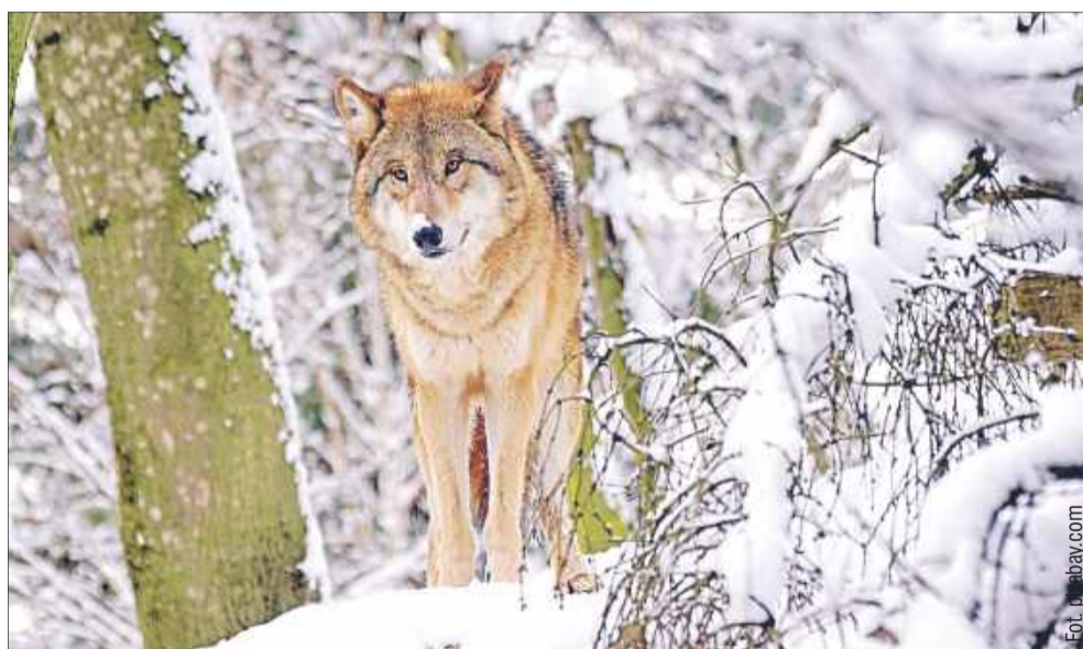
Podczas pracy w lesie w pobliżu Smolnika, pracownik leśny znalazł się w niecodziennej i potencjalnie groźnej sytuacji.

ale czwarty, szczerząc kły i jeżąc sierść na karku, zaczął podchodzić do wystraszonego piechura. Ten, nie mając innego wyjścia, wdrapał się na drzewo i stamtąd usiłował wzywać pomocy. W końcu udało mu się dodzwonić do kolegi, który po dłuższym czasie zdołał dotrzeć na miejsce