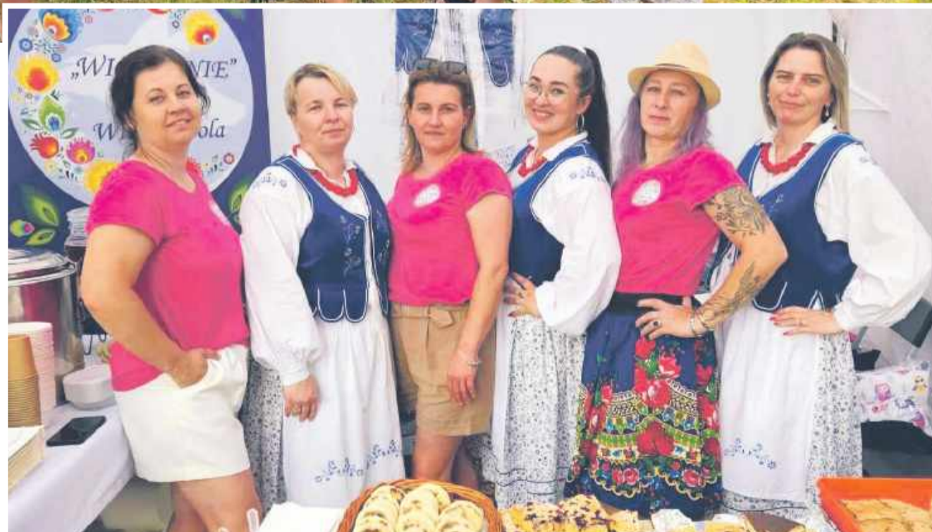
Koło w Wilczej Woli możemy spotkać na wielu wydarzeniach kulturalnych, podczas których przedstawiają i częstują swoimi pysznymi wyrobami.

Najmłodszym mieszkańcom naszego regionu staramy się zapewnić aktywne spędzanie czasu wolnego na wakacjach i feriach poprzez organizowanie półkolonii wakacyjnych i zimowych, balów karnawałowych i różnego rodzaju warsztatów kulinarnych. W 2024 r. udało się nam uzyskać grant