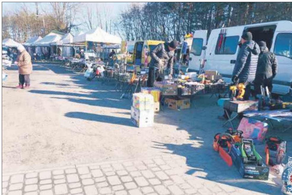
We wtorek, 18 marca, targ w dalszym ciągu odbywał się przy stadionie, przy ul. Wolskiej w Kolbuszowej.

Sprzedaż małej ilości produktów, takich jak warzywa, owoce, kwiaty, jajka, prowadzona z ręki, kosza, wiadra czy skrzynki wynosi 5 zł dziennie. Natomiast sprzedaż ze stoiska lub namiotu to również 5 zł za metr kwadratowy dziennie,