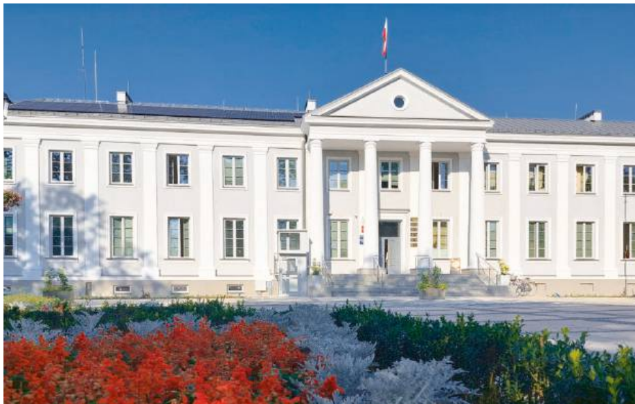
Pierwsze inauguracyjne spotkanie odbędzie się 12 września.

Wysłuchując się w głos młodzi, która bardzo wyraźnie mówiła o tym, że we współczesnym świecie jedną z ich potrzeb w zakresie wsparcia są kontakty i relacje z rodzicami, a także biorąc pod uwagę, że jednym z najważniejszych czynników składających się na odporność psychiczną jest rodzina, wystartowaliśmy z kampanią, której celem jest szeroko rozumiane wsparcie rodzin. Chwilę przed herbatką ruszyło emocjonalne kino plenerowe, na które mieszkańcy chętnie i tłumnie odpowiedzieli. Liczymy na to, że ten element kampanii będzie cieszył się zainteresowaniem. Herbatka w Urzędzie