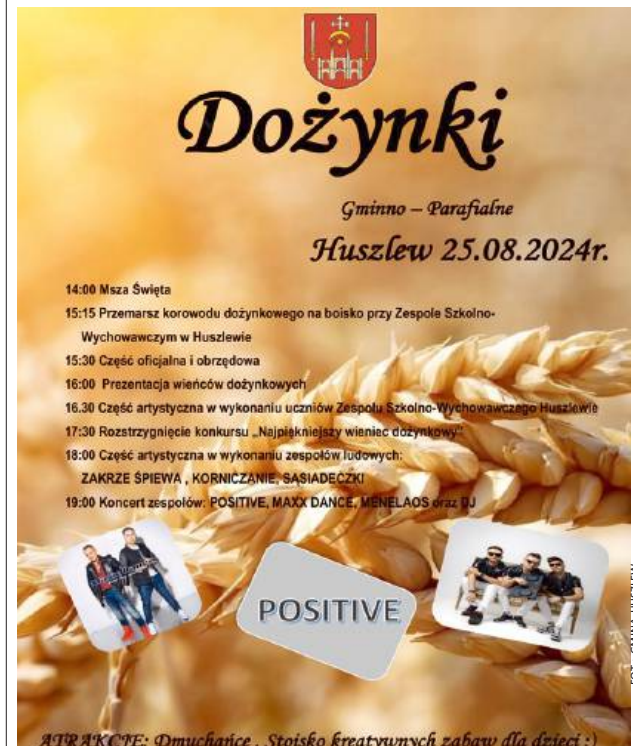
Znajdą się także atrakcje i zabawy dla dzieci.

25 sierpnia odbędą się Dożynki Gminno-Parafialne w Huszlewie. Program wydarzenia zapowiada się obiecująco. Szczególnie ciekawie przedstawia się część artystyczna w wykonaniu zespołów ludowych oraz zaproszonych na tę okazję przedstawicieli muzyki tanecznej.