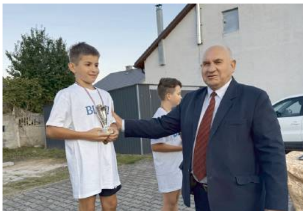
Wręczenie statuetki najlepszemu uczestnikowi

Po zakończeniu wydarzenia na wszystkich uczestników czekało kino plenerowe, które ze względu na pogodę przeniesiono do świetlicy wiejskiej. RED