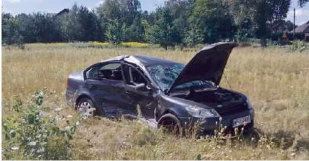
Obaj kierowcy trafili do szpitala.

Kierujący pojazdem Skoda wyjeżdżając z drogi podporządkowanej nie ustąpił pierwszeństwa przejazdu kierującemu mercedesem doprowadzając do zderzenia pojazdów na ul. Osiedlowej. W wyniku zdarzenia obaj kierowcy z obrażeniami ciała zostali przewiezieni do szpitala. Uczestnicy wypadku byli trzeźwi.