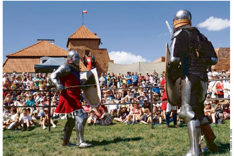
Podczas Turnieju w szranki staje kwiat rycerstwa polskiego.