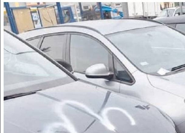
Sprawę bada siedlecka policja.

W nocy z 8 na 9 sierpnia na parking przy ul. Partyzantów w Siedlcach doszło do szokującego aktu wandalizmu. Nieznani sprawcy uszkodzili tam ponad 20 aut. Sprawę bada siedlecka policja.