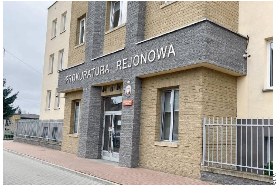
Prokuratura postawiła wobec matki dziecka zarzuty znęcania się nad osobą nieporadną.

Na ten moment przyczyny ostatecznej jeszcze nie ma. Dziecko już od urodzenia cierpiało na wiele schorzeń, m.in. padaczkę i było objęte specjalistycznym leczeniem. W chwili obecnej czynności wyjaśniające trwają. Prokuratura postawiła wobec matki dziecka zarzuty znęcania się nad osobą nieporadną ze względu na stan zdrowia oraz nieumyślne spowodowanie zgonu - poinformował nas Adrian Wysokiński, zastępca prokuratora rejonowego w Siedlcach.