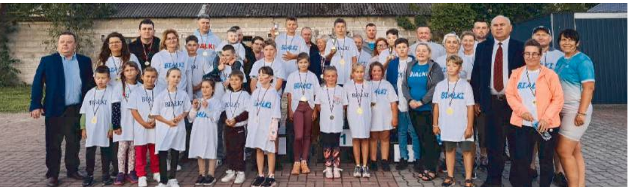
Wszyscy uczestnicy na pamiątkowym zdjęciu biegu w Białkach