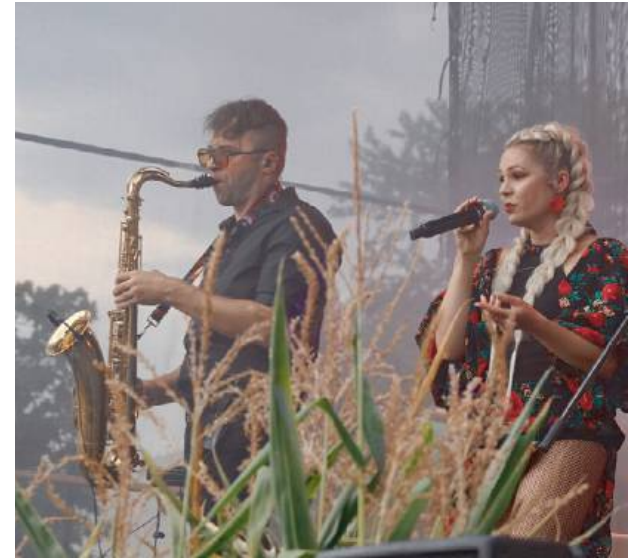
Świetna muzyka dodała zabawie odpowiedniego tempa