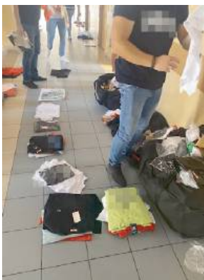
Handlarz usłyszał 11 zarzutów.

Mężczyzna został zatrzymany, a towar zabezpieczony. Funkcjonariusze łącznie zabezpieczyli 321 elementy odzieży, a były to min. koszulki, bluzy i spodenki sportowe. Mężczyzna usłyszał 11 zarzutów. Grozi mu do 2 lat pozbawienia wolności.