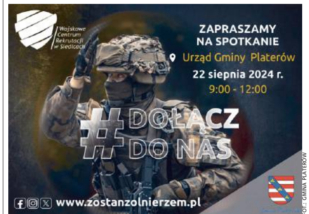
Szczegóły na stronie internetowej WCR.

Wojskowe Centrum Rekrutacji w Siedlcach zaprasza 22 sierpnia wszystkich chętnych na spotkanie z rekruterami. Przedstawiciele WCR zaprezentują różne formy służby wojskowej, takie jak Dobrowolna Zasadnicza Służba Wojskowa, Zawodowa Służba Wojskowa, Terytorialna Służba Wojskowa i Aktywna Rezerwa. Rekruterzy WCR przedstawią wymagania, zasady rekrutacji, a także opowiedzą o możliwościach, jakie stwarza Wojsko Polskie. Odpowiedzą również na pytania dotyczące służby. Spotkanie odbędzie się w godz. 9.00-12.00 w Urzędzie Gminy Platerów.