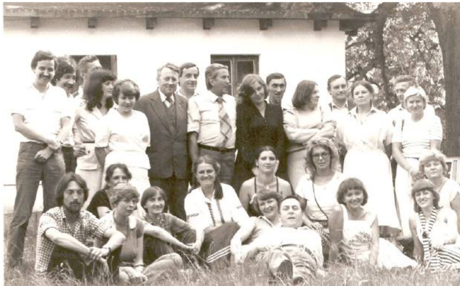
„Kadra Kultury w Chlewiskach”