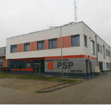
Komenda Powiatowa PSP w Węgrowie