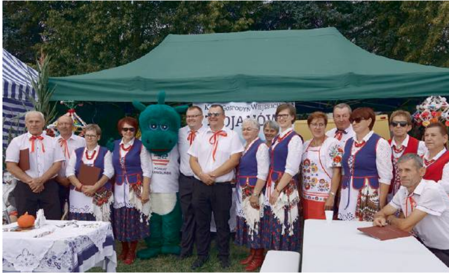
Kultura, tradycja, kulinarnia i przede wszystkim dobra zabawa

Tego dnia nie zabrakło muzyki ludowej w wykonaniu gospodyń z KGW i zespołów śpiewających. Na scenie ze swoimi re-