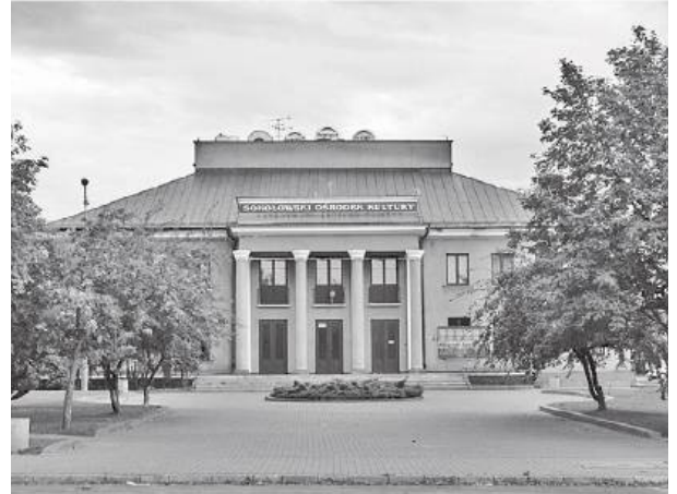
eAlbum: Sokołów Podlaski 2006

W tym gronie pan Józef był najbardziej biegłym w mowie i piśmie. Na Ukrainie uzyskał tzw. małą maturę, jemu przypadło więc opracowanie wniosków i ich obronę w czasie różnych narad i konsultacji. Był skutecznym zarówno na początku boju o dom kultury, jak i później, gdy trzeba było bronić się przed jego