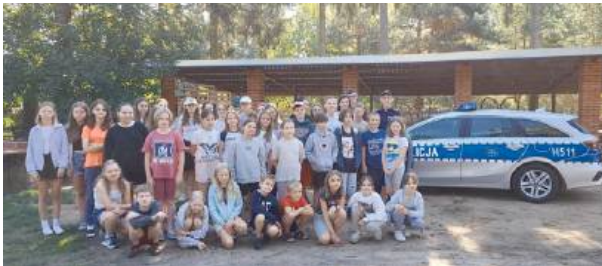
Głównym celem działań jest podniesienie poziomu bezpieczeństwa.

Każdego lata łosiccy policjanci wraz z pracownikami Sanepid-u kontrolują zgłoszone obozy