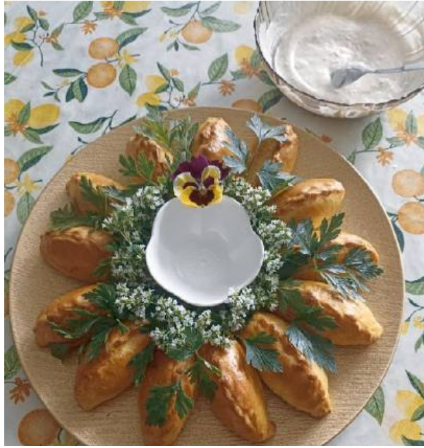
Pierogi prezentowały się wymięnicie.