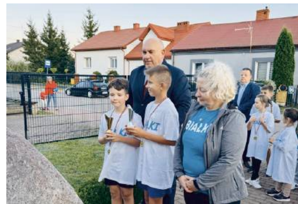
Nie tylko sport, ale i pamięć