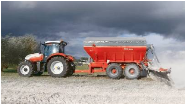
To kolejne w ostatnim czasie zdarzenie podczas prac polowych.

Według wstępnych ustaleń, ojciec dziecka przy pomocy cią-