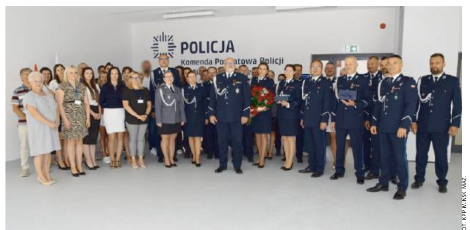
Uroczystości miały miejsce w sali konferencyjnej Komendy Powiatowej Policji w Mińsku Mazowieckim.

Jednocześnie decyzją Komendanta Stołecznego Policji in-