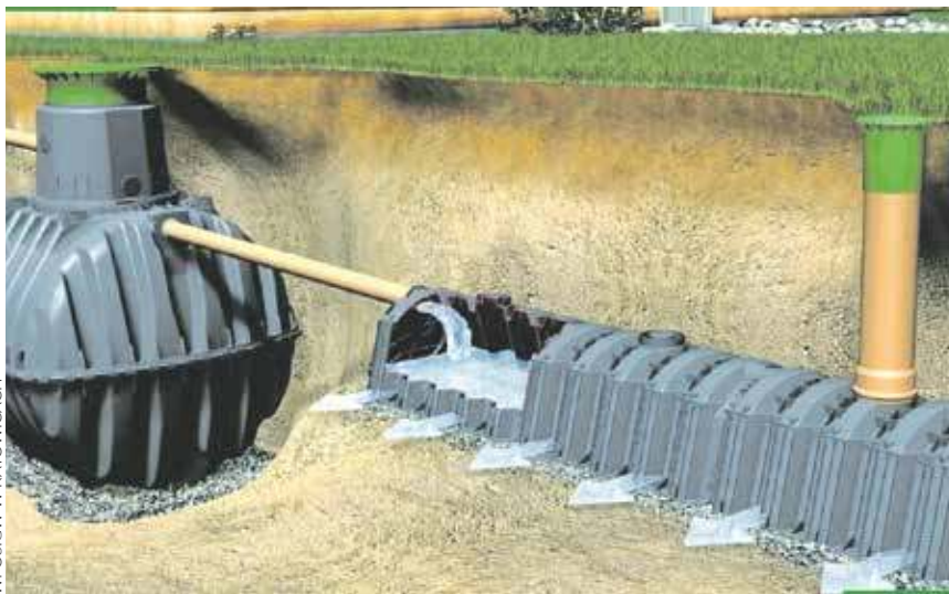
WFOŚiGW W KATOWICACH

KATOWICKI ODDZIAŁ WOJEWÓDZKIEGO FUNDUSZU OCHRONY ŚRODOWISKA I GOSPODARKI WODNEJ ROZPOCZYNA NABÓR WNIOSKÓW NA DOFINANSOWANIE PRZEDSIĘWZIĘĆ W RAMACH PROGRAMU „PRZYDOMOWA OCZYSZCZALNIA LUB PODŁĄCZENIE DO KANALIZACJI”.