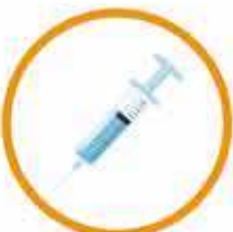
ODPADY PO INIEKCJACH