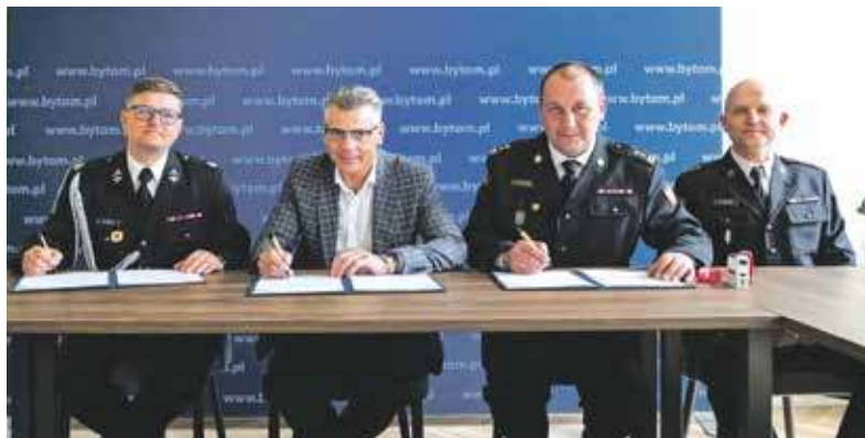
Umowę włączającą do systemu OSP w Suchej Górze zawarto w bytomskim Urzędzie Miejskim

Przypomnijmy, że elementem systemu od roku 2017 jest OSP w Górnikach. Jednostka suchogórska zostanie jego częścią na pięć lat. Po tym czasie zostanie poddana ponownej weryfikacji. ■