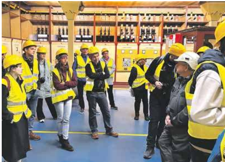
Dla miłośników postindustrialu gratką była możliwość zwiedzania zabytkowej siłowni w Koksowni Bytom