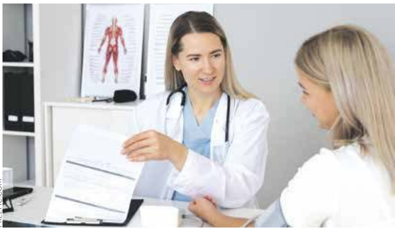
Pacjent sam może wybrać placówkę, w której będzie leczony