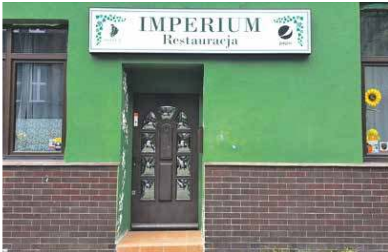
O tym lokalu było ostatnio bardzo głośno. Ale bynajmniej nie z dobrego powodu