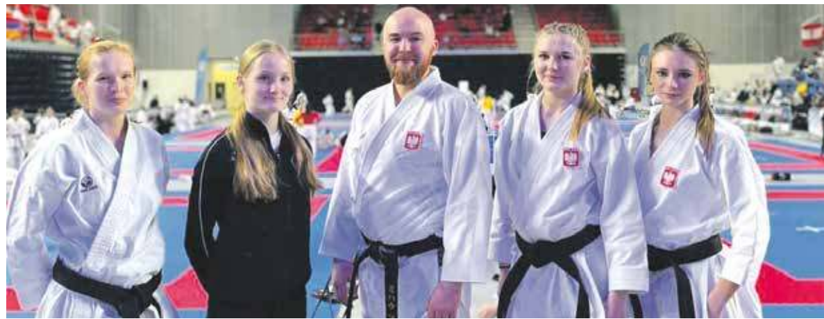
Bytomscy karatecy znowu pokazali moc

PULAWY. ONI NIGDY NIE ZAWODZĄ. Z DZIEWIĘCIOMA MEDALAMI WRÓCILI Z MISTRZOSTW ŚWIATA W KARATE FUDOKAN ZAWODNICZY MUKS IPPON BYTOM. AŻ PIĘĆ Z NICH BYŁO KOLORU ŻŁOTEGO.