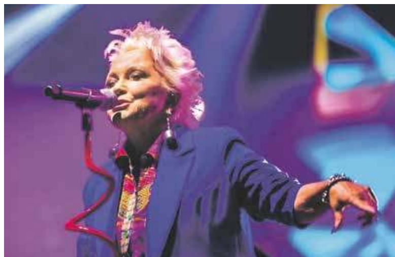
Małgorzata Ostrowska, czyli ogień na scenie

Obdarzona niesamowitym, elektryzującym głosem i wielkim temperamentem piosenkarka jest wszakże uznawana za jedną z najlepszych polskich wokalistek rockowych. W latach