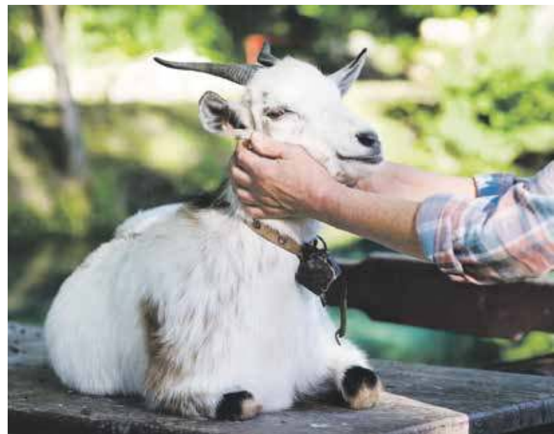
Kaj ta ciga włazia?

Kompotu niy robi sie tyz ze kokota, ale taki rosół ze nudlami juz jak nojbarzi. A jak łon wonio i smakuje! Kokot to kogut. Kura niy mo ekstra ślonskiego miana i u nos tyz godo sie na nia kura. A jak juz my som przy kokocie, to wciepna wom taki wierszyk: Kaj to idziesz kokocie? Na zolyty do ciecie. Co tam niesies pod parzom? Gorzołeczka mularzom. Mularze sie topiły i kokota zabiły (Dokąd idziesz kogucie? Na randkę do ciece. Co tam niesiesz po pachę? Wódkę dla murarzy. Murarze się opili i koguta zabili). Ja, jo wiy - synsu można sam niy ma żodnego, ale sie aby tymuje.