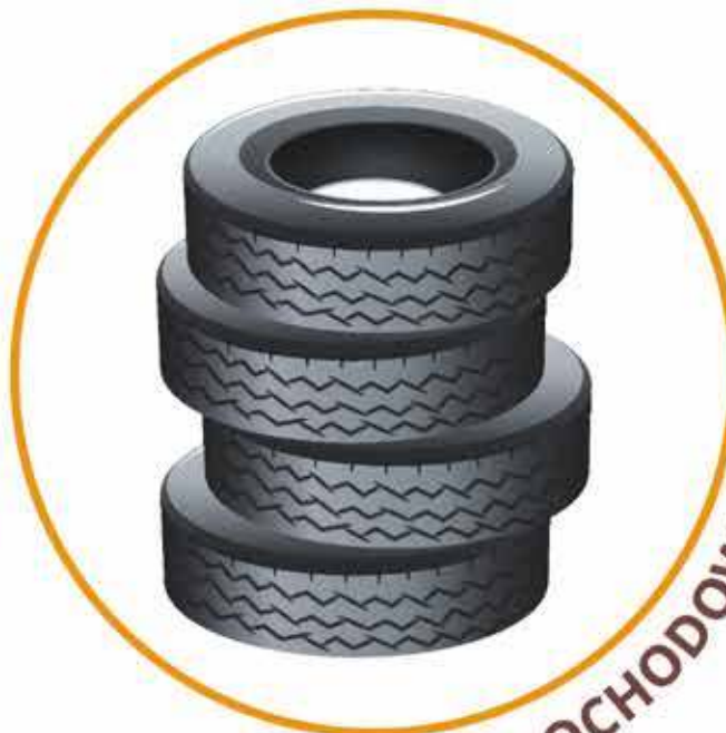
OPONY SAMOCHODOWE OSOBOWE