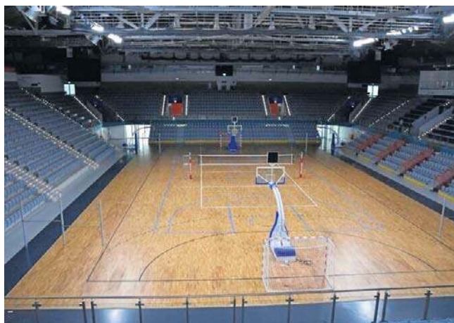
W ostatnich latach był problem z wypełnieniem kalendarza tarnowskiej hali. Przez wiele dni obiekt świecił pustkami

- Koszt Areny to około dwa do trzech milionów złotych. Natomiast w tamtym roku przychody z Areny były na poziomie około miliona złotych - mówił