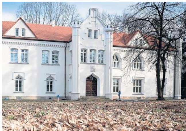
Pałac Dąbskich w Wojniczu czeka na kolejne etapy modernizacji, która przywróci mu XIX-wieczny blask

Odnowiony pałac Dąbskich pełnić ma funkcje reprezentacyjne, z pałacem słuźbów, a również przenieść ma się do niego Gminny Ośrodek Kultury.