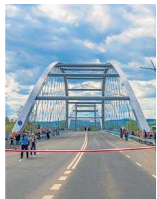
Radny domaga się instalacji tablic informacyjnych

Choć mieszkańcy powszechnie używają nazwy zwyczajowej, przeprawa formalnie nosi imię Józefa Piłsudskiego. Brak widocznego znaku