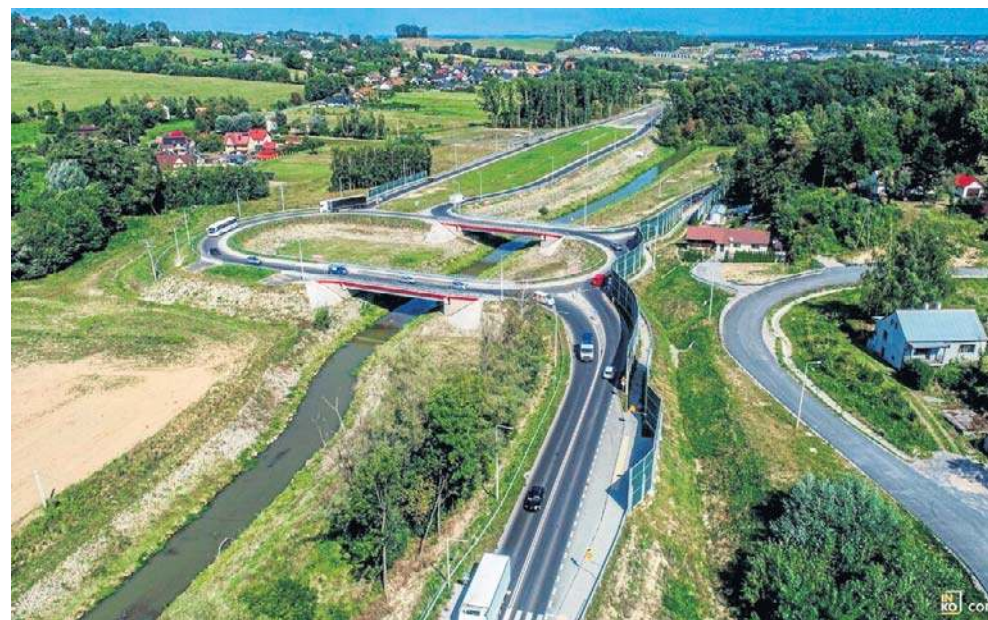
Budowa Sądeczanki ma ogromne znaczenie dla całej Sądeczyny. Nowa trasa poprawi bezpieczeństwo jazdy i otworzy region na nowe możliwości

Środkowy fragment Sądeczanki w wielu miejscach będzie przebiegał w pobliżu obecnej DK75, częściowo wykorzystując jej istniejący przebieg. To rozwią-