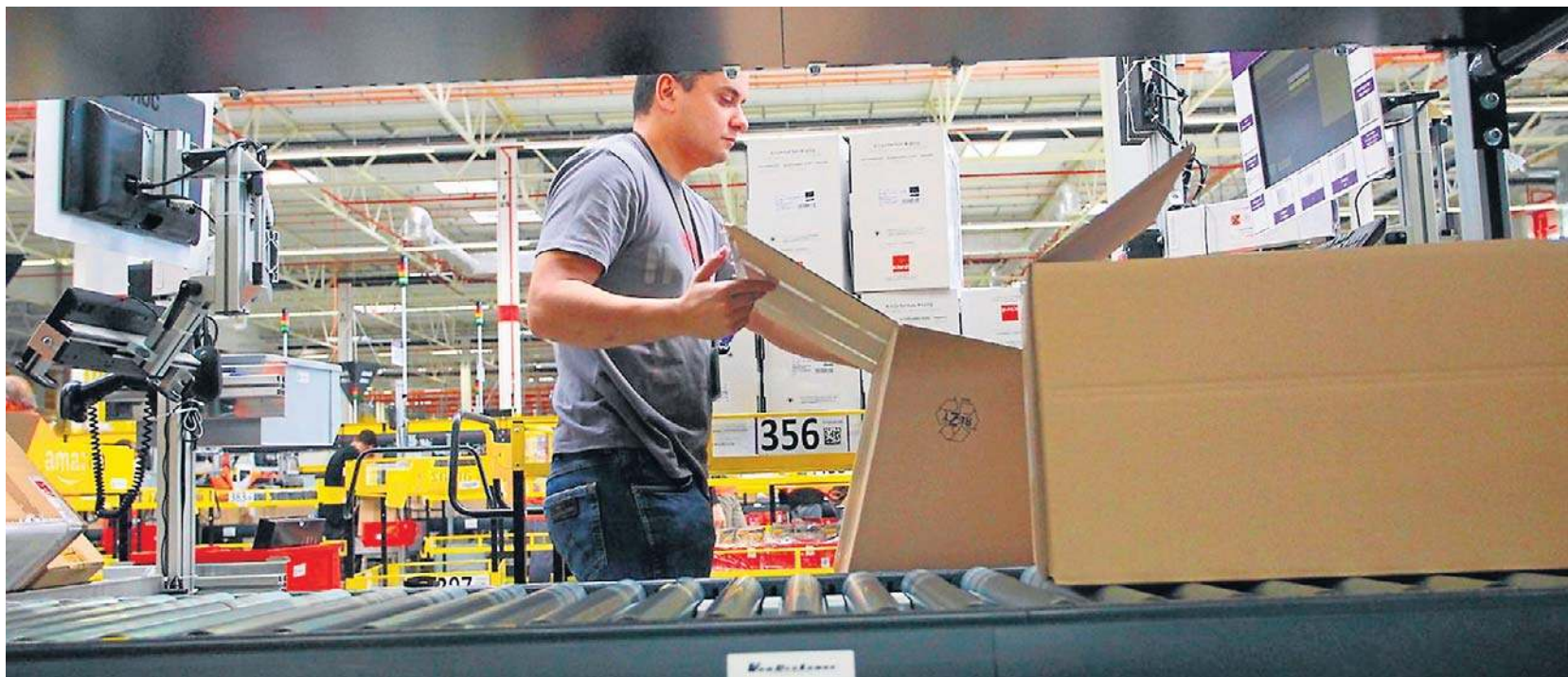
Reforma PIP oznacza duże zmiany na całym polskim rynku pracy

W obowiązującym stanie prawnym inspektor, stwierdzając, że dana osoba wykonuje pracę w warunkach właściwych dla stosunku pracy, mógł jedynie wystąpić do sądu z odpowiednim powództwem