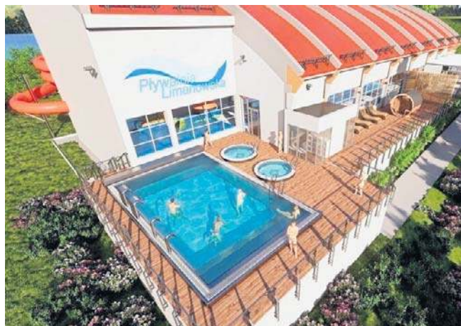
Limanowska pływalnia zyskuje strefę zewnętrzną i nowy potencjał

Limanowska pływalnia już dziś oferuje znacznie więcej niż tylko baseny. Na miejscu dostępna jest strefa saun, kręgielnia, squash oraz bilard. ©