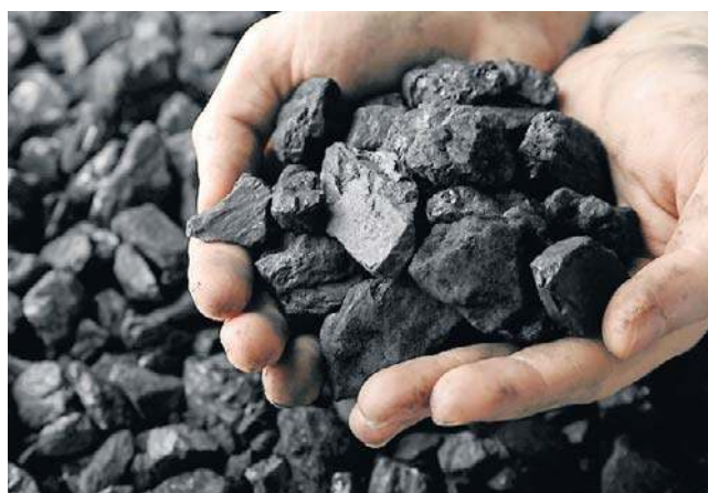
Wszystkie opowieści o tzw. polskim węglu trzeba wziąć w nawias, bo dziś nie ma już dostępnego i taniego węgla

Gdybyśmy mieli dalej iść w tak wysokie ceny, jak w ostatniej aukcji, to nie warto tego robić. Cena offshore zbliża się do ceny elektrowni jądrowej. Jeśli mam porównać te dwie technologie, to wybiorę źródło dyspozycyjne, a nie źródło,