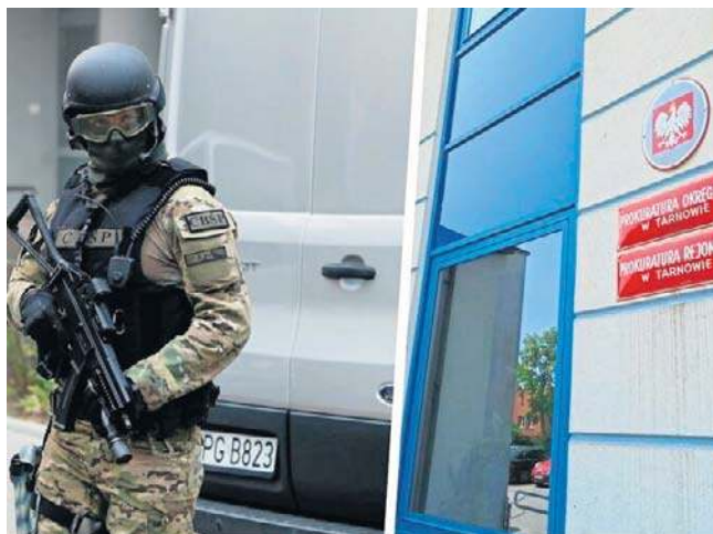
Prokuratura wspólnie z funkcjonariuszami CBŚP zatrzymała diler narkotyków. Grozi mu do 12 lat więzienia

Decyzją Sądu Rejonowego w Tarnowie 38-latek najbliższe 3 miesiące spędzi w tymczasowym areszcie. Grozi mu do 12 lat więzienia. ©