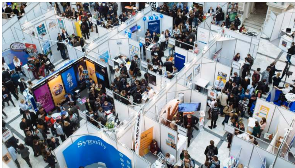
W Targach udział weźmie około 50 wystawców.