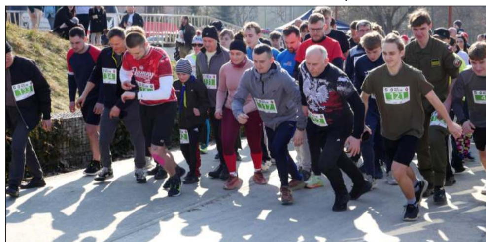
Bieg Wilczym Tropem... czas zacząć!

Na Górcy Cyranowskiej dostępne były stanowiska informacyjno-promocyjne jednostek i stowarzyszeń patriotycznych, a chętni mogli oddać krew w mobilnym punkcie krwiodawstwa.