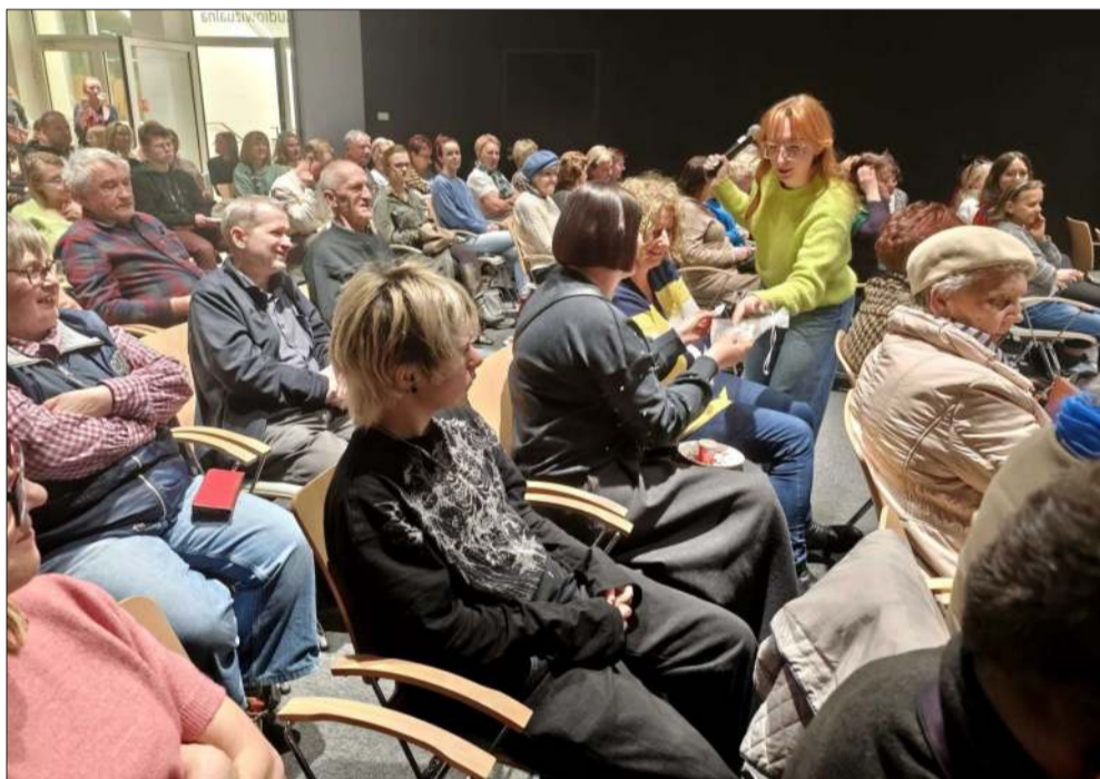
Obecni wzięli udział w loterii z nagrodami

Spotkanie zgromadziło wielu mieszkańców - sala była wypełniona po brzegi, a atmosfera niezwykle serdeczna. Na zakończenie nie zabrakło pytań z publiczności. Uczestnicy chcieli wiedzieć m.in. ile kosztowała podróż, czy prelegentka przywiozła dużo pamiątek i - pół żartem, pół serio - kto z mielczan jako następny odwiedzi Kraj Kwitnącej Wiśni. gj