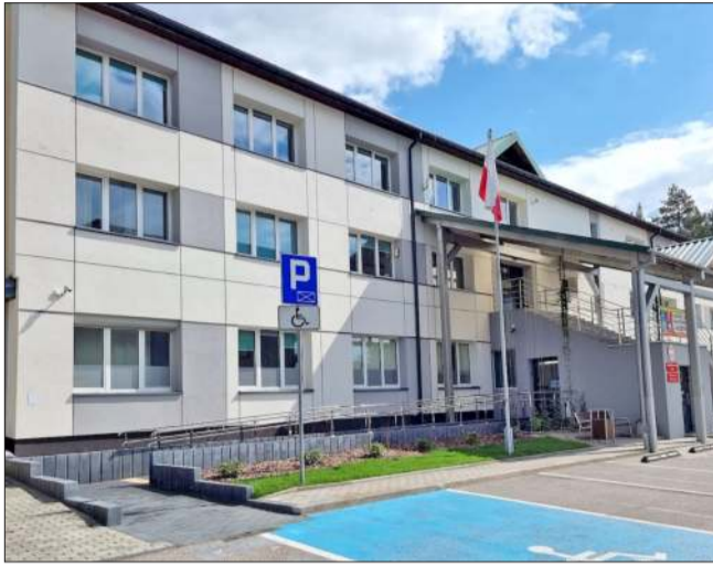
Budynek mieleckiego PUP-u

Projekt zakłada szeroki wachlarz działań, takich jak pośrednictwo pracy, poradnictwo zawodowe, organizację staży, refundację kosztów wyposażenia stanowisk pracy oraz dofinansowanie podjęcia działalności gospodarczej. Z programu skorzystają osoby o szczególnie trudnej sytuacji na rynku pracy, do których ustawa zalicza m.in. kobiety, osoby do 30 roku życia, trwale bezrobotne, starsze i niepełnosprawne. Głównym rezultatem projektu będzie podjęcie zatrudnienia, w tym samozatrudnienia, przez co najmniej 165 osób, które zarejestrowane są jako osoby bezrobotne w PUP w Mielcu. Aby wziąć udział w programie należy być osobą