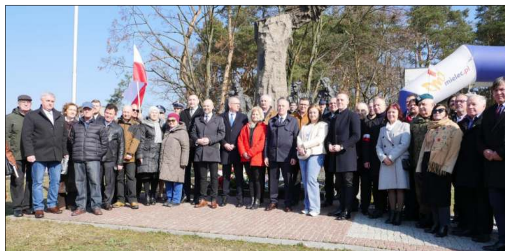
Zgromadzeni na Górcy Cyranowskiej zapozowali do pamiątkowego zdjęcia.