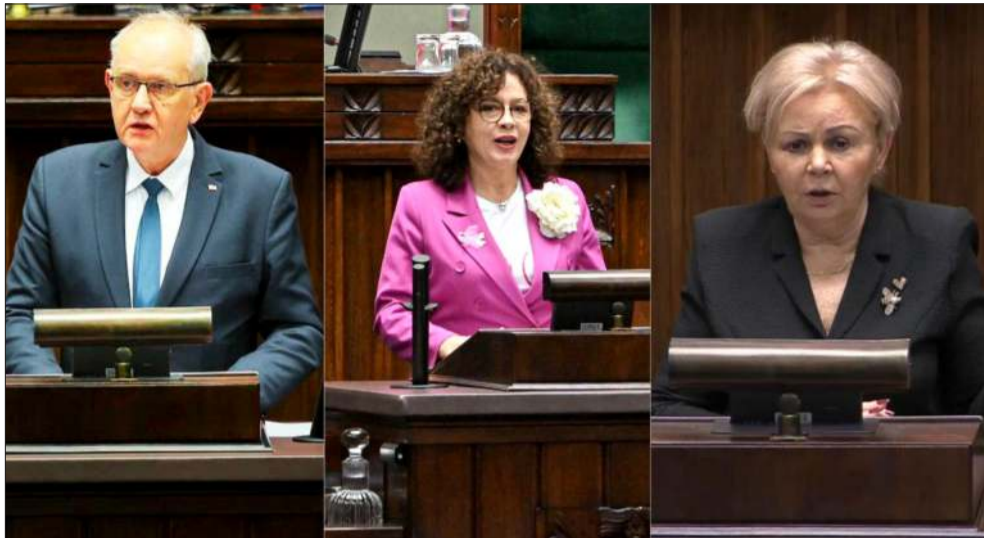
Mieleccy posłowie o SAFE.

Wskazała również na konkretne liczby: „W 2024 r. zawarto kontrakt na 24 mld zł, a obecnie z programu SAFE dodatkowe