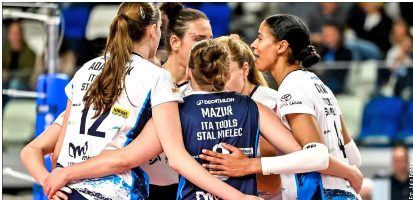
Mielczanki pewnie uporały się z beniaminkiem.