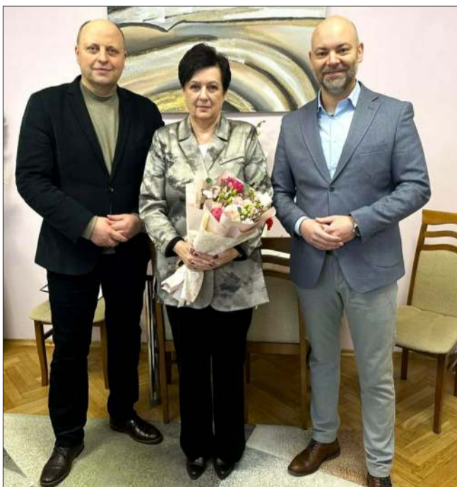
Podziękowania, gratulacje i nowy rozdział. Dyrektorka SP nr 2 na emeryturze

Obie strony będą realizować zobowiązania wynikające z umowy. Ich wspólnym celem będzie wzmocnienie odporności regionu. Pracownicy szpitala wezmą udział w specjalistycznych szkoleniach z zakresu medycyny pola walki, prowadzonych przez ekspertów wojskowych. Ma to podnieść ich kompetencje oraz nauczyć schematów i procedur działania w sytuacjach zagrożenia. Współpraca obejmuje także wsparcie w procesach kwalifikacji wojskowej, orzecznictwie wojskowo-lekarskim oraz rozwój infrastruktury szpitala, szczególnie w obszarze cyfry-