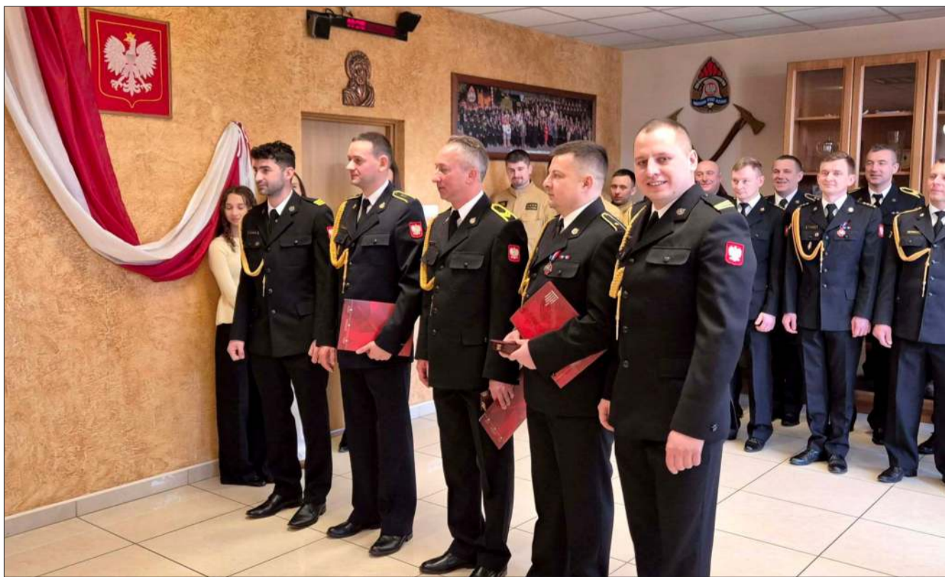
Za nimi lata ofiarnej służby dla powiatu.