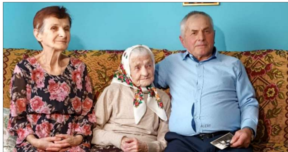
Wyjątkowy jubileusz we Frysztaku. Zdjęcie z 2025 r.