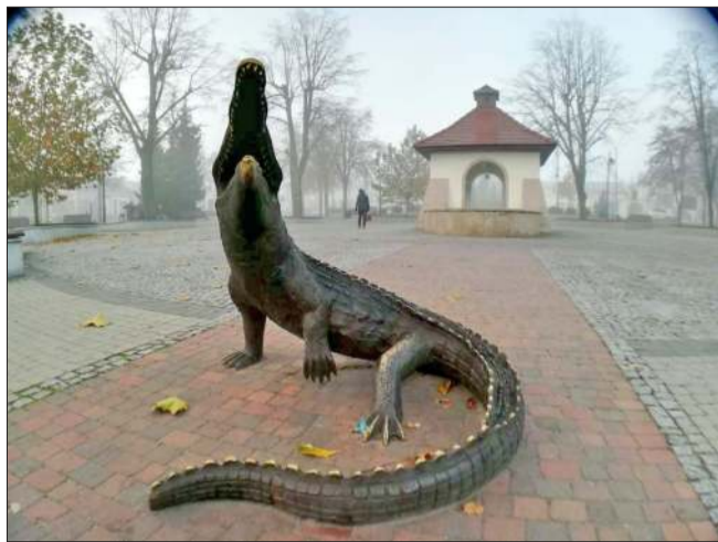
Popularne krokodyle w Kolbuszowej.

Moda na miejskie szlaki figuerek opanowuje nasz region. Po ogromnym sukcesie tarnowskich maszkaronów, na podobny krok decydują się sąsiednie gminy. Już niedługo w Lisiej Górze będziemy tropić sympatyczne liski, a w pobliskim Żabnie – żaby. Warto jednak pamiętać, że blisko Mielca taki szlak już istnieje – mowa o słynnych krokodylach z Kolbuszowej.