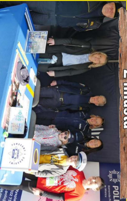
Nie ma to jak pamiątkowe zdjęcie w doborowym towarzystwie!