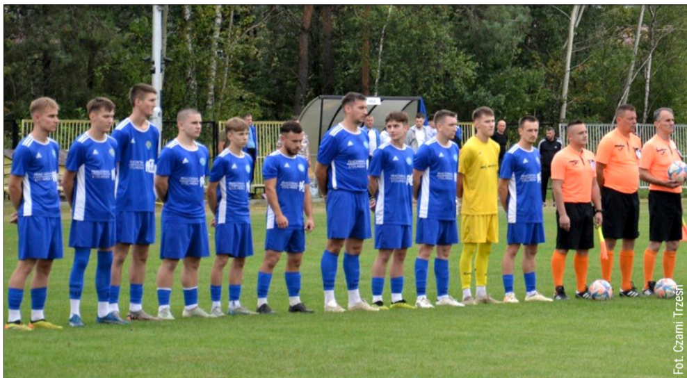
Piłkarze Atutu rozgrywają sparingi przed rundą wiosenną.