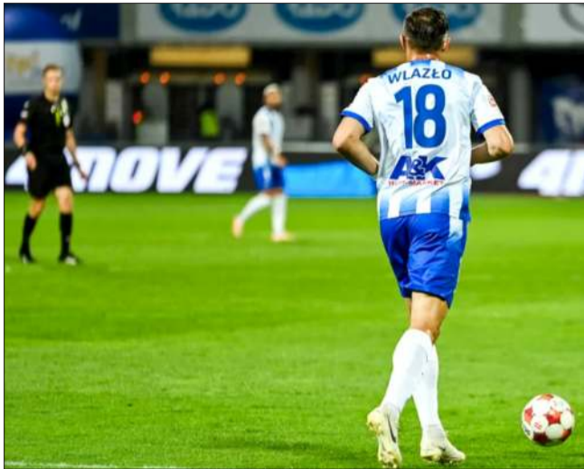
Biało-niebiescy awansowali na 16. miejsce w tabeli.