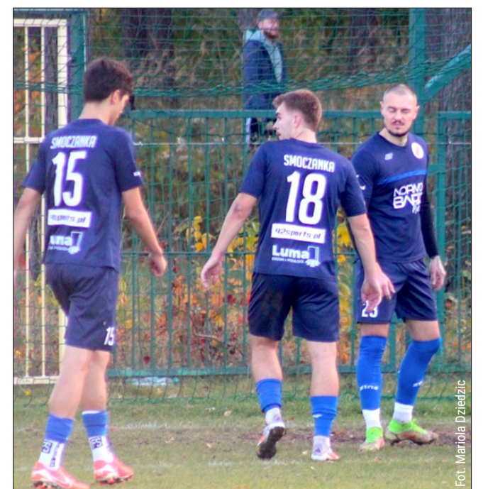
Smoczanka rozpoczęła sparingi przed rundą wiosenną.

KS Nowa Jastrzębka-Żukowice - Smoczanka Mielec 1:1