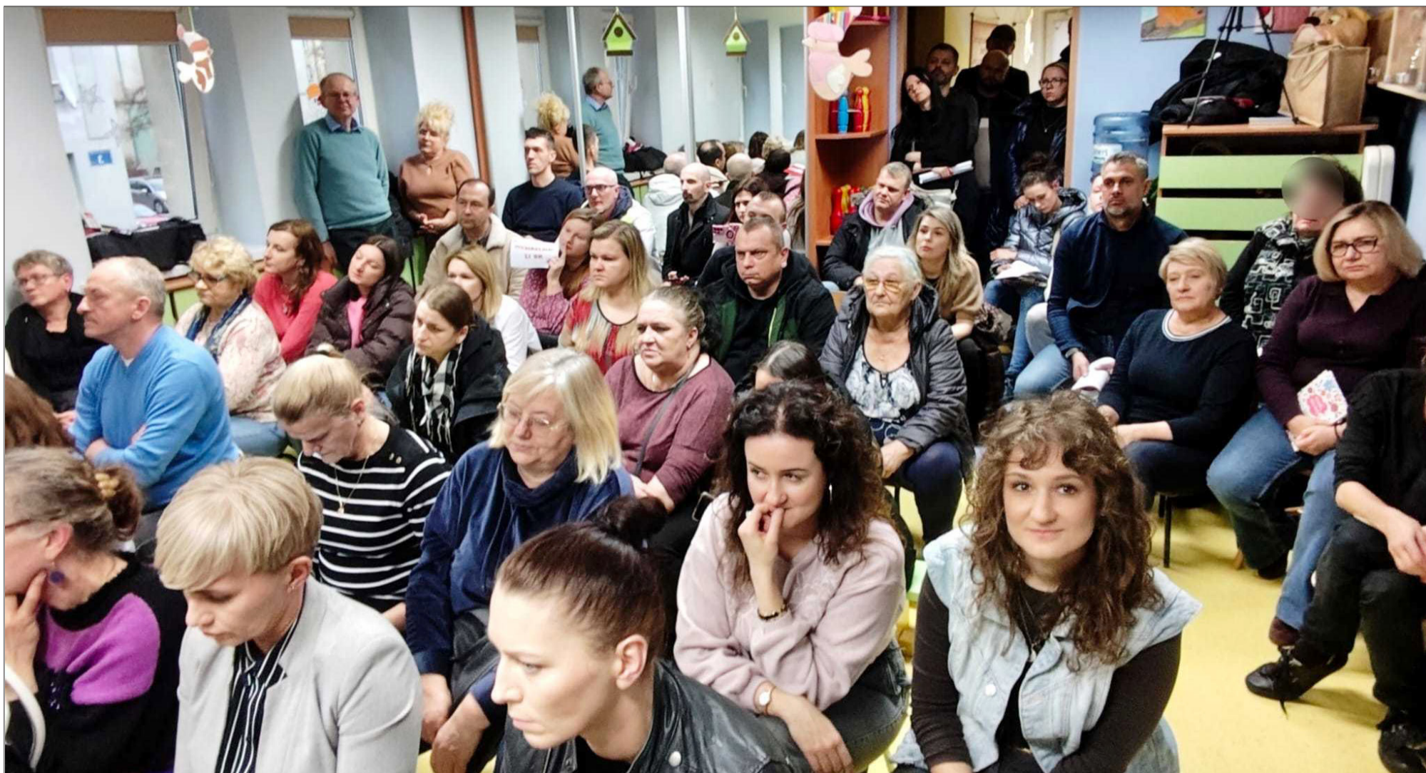
Sala wypełniła się rodzicami i pracownikami placówki