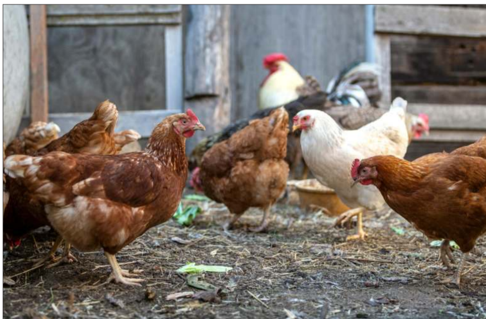
Koniec z wypuszczaniem drobiu na podwórka..