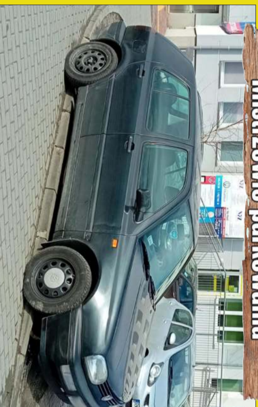
Tu parkował ktoś z wyobraźnią.