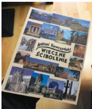
Książka opublikowana przez Wydawnictwo TiO. Do nabycia w księgarni „U Leszka” - Legionowo, Stefana Batorego 10

Zadaję sobie pytanie, czy w czasach Iwana Groźnego przyłączyłbym się do żadnego