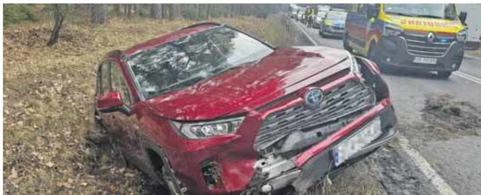
W zdarzeniu poszkodowane zostały trzy kobiety