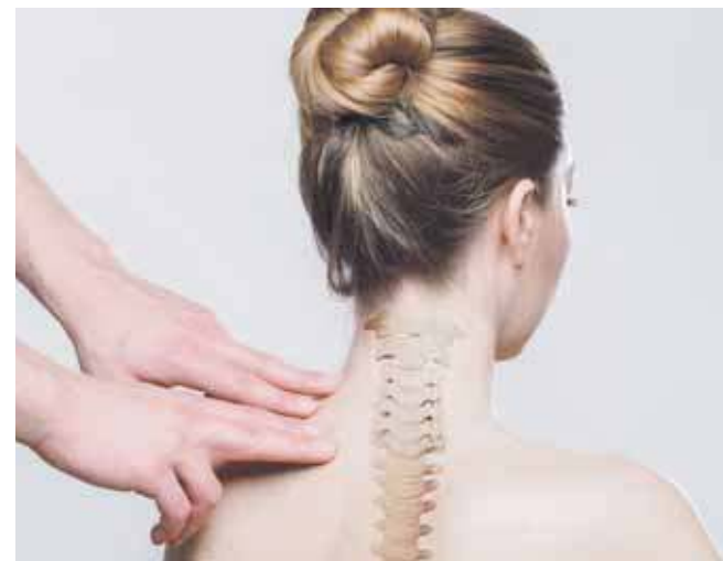
W programie są m.in. warsztaty zdrowy kręgosłup