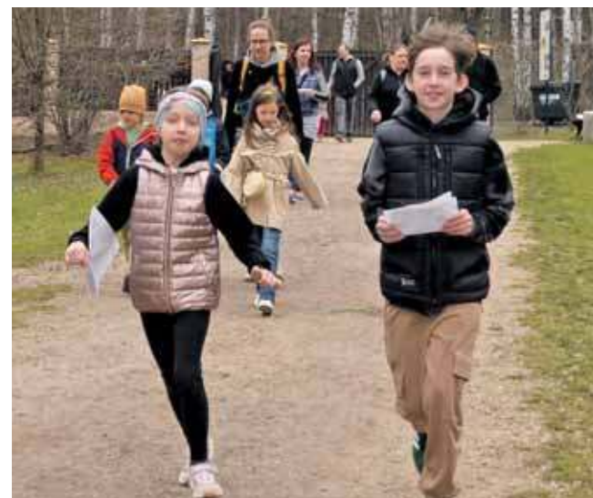
Trzy, dwa, jeden... Start gry terenowej

Śląski Ogród Botaniczny każdy mógł znaleźć dla siebie coś ciekawego. Na przyszłość polecamy też punkt gastrono-