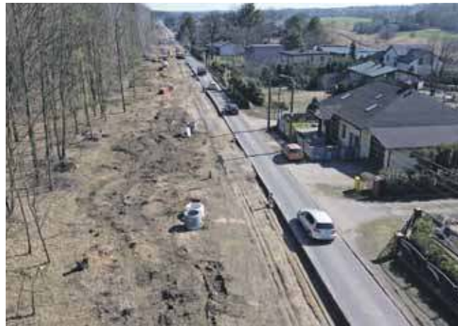
Przebudowa będzie kosztować ponad 14,6 mln zł

Postępuje przebudowa ul. Grzybowej w Tarnowskich Górach. Prace będą w sumie prowadzone na odcinku ponad 3 km, mają potrwać do września przyszłego roku.