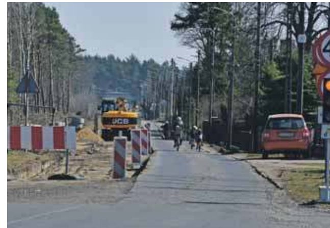
Prace potrwać do końca września przyszłego roku

Dodatkowo, na wysokości ulicy Wincentego Pola wprowadzono ruch wahadłowy. Kolejna zmiana w organizacji ruchu nastąpiła 11 marca – ruch wahadłowy został wprowadzony również na ulicy Grzybowej, na odcinku od ulicy Wodnej do posesji nr 150.