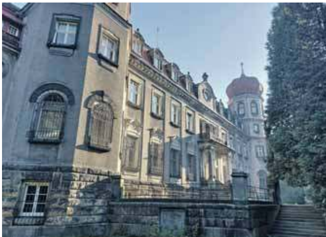
Kiedy dwa lata temu negocjowano warunki sprzedaży pałacu, Nadleśnictwo Brynek szacowało, że tylko na najniezbędniejsze inwestycje potrzeba 6 mln zł

Jak mówi starosta, gdyby powiat otrzymywał czynsz, byłyby pieniądze na inwestowanie w Brynek. – Kiedy w 2007 roku przekazaliśmy w użyczenie nieruchomość, kompleks był w stanie przyzwoitym. Mi-