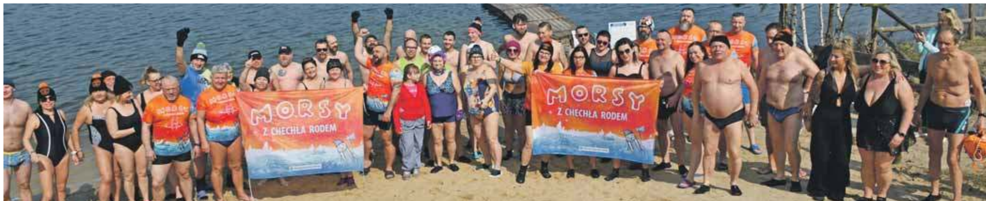
Wspólne zdjęcie na zakończenie sezonu. Więcej fotografii na gwarek.com.pl