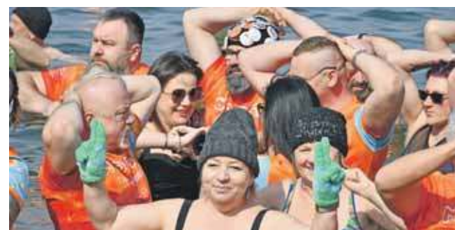
Ostatnia zimowa kąpiel w zalewie

Jak twierdzą amatorzy zimowych kąpiei, morsować można przez cały rok – wystarczy tylko odpowiednie miejsce i odrobina kreatywności. W mediach społecznościowych grupa dostała już propozycję przeniesienia się na pewien czas do Sztolni Czarnego Pstrąga. (EKA)