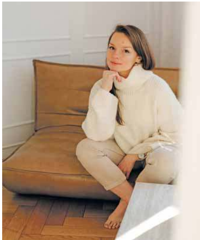
Teraz czas biegnie szybciej, ale zawsze ma w pamięci ten, kiedy była „tylko” mamą. Wie, że potrafi żyć wolniej, spokojniej

Później były jeszcze studia podyplomowe w Madrycie – z medycyny estetycznej i regeneracyjnej. To właśnie ta druga ją fascynuje i na nią postawi w swoim gabinecie. – Nie chcę nikogo „poprawiać”, tak żeby wyglądał jak „ideał” lansowany w mediach społecznościowych. Zależy mi na tym, żeby pa-