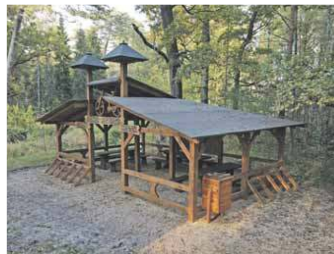
Tradycyjnie uczestnicy będą mieli okazję przejechać trasę łączącą cztery stacje rowerowe, m.in. Garbaty Mostek