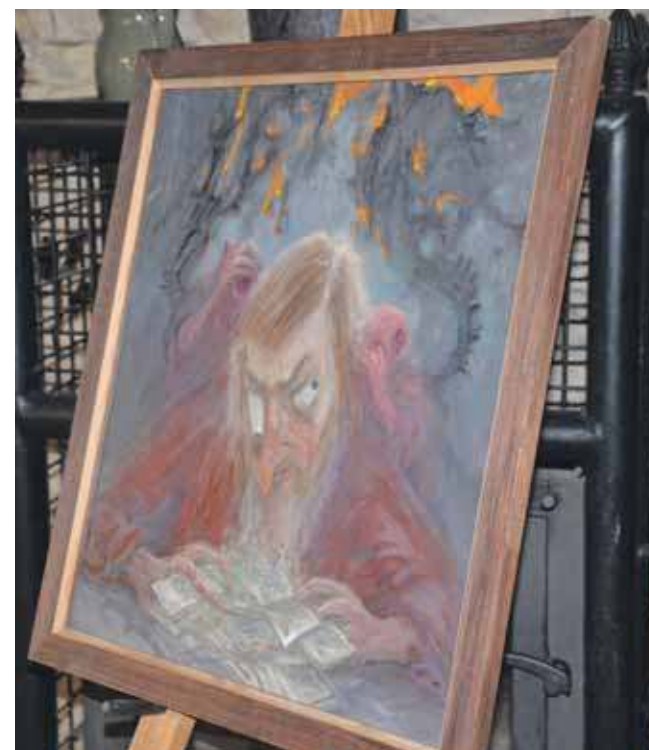
Obrazy tarnogórzanina dają do myślenia

do rejestru zabytków został wpisany w 1968 r. Już wtedy był w kiepskim stanie, a z czasem jeszcze podupadł.