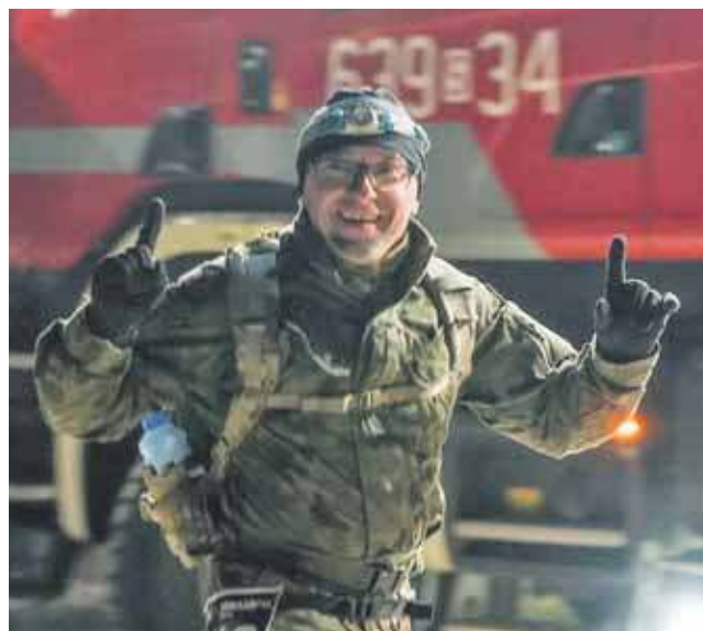
Pierwsze 20 kilometrów biegacze pokonują w mundurze polowym i z plecakiem o wadze 10 kg