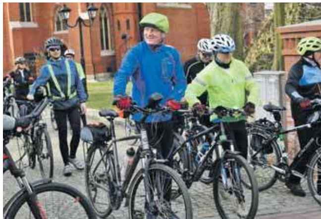
Tak było rok temu w parafii pw. św. Wojciecha w Radzionkowie

Trasa liczy około 31 km, każda stacja drogi krzyżowej jest w innej parafii – w Świerkłańcu, Kozłowej Górze, Piekarach Śląskich, Rojcy, na osiedlu Witor i Na Wzgórzu w Bytomiu. Czternasta stacja będzie w kościele pw. św. Wojciecha w Radzionkowie.