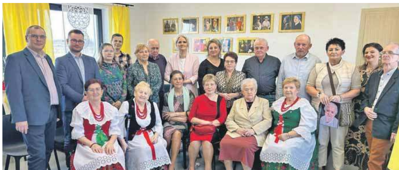
Gniazdo działa już dwa lata i organizuje zajęcia dla seniorów

Fundacja informuje też o ciekawej inicjatywie jeszcze z końca ubiegłego roku. W Ożarówicach mieszkanie treningowe przekształcono we wspomagane i zamieszkałe w nim seniorki. To swego