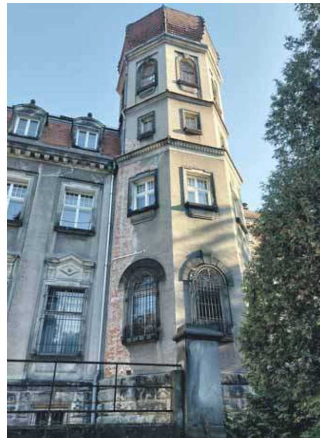
Pałac wymaga remontu

pałacu, Nadleśnictwo Brynek szacowało, że tylko na najniezbędniejsze inwestycje potrzeba 6 mln zł.