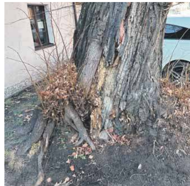
Badanie tomografem sonicznym pokazało, że oba pnie są w bardzo złym stanie i stwarzają duże ryzyko przewrócenia