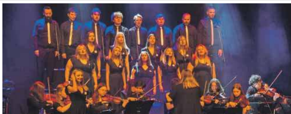
Wiosenny koncert chóru Dafne i orkiestry Symfonix pod batutą Oliwii Bentkowskiej przeniósł publiczność w świat największych przebojów musicalowych i filmowych. Koncert odbył się 23 marca w Tarnogórskim Centrum Kultury. (EKA)