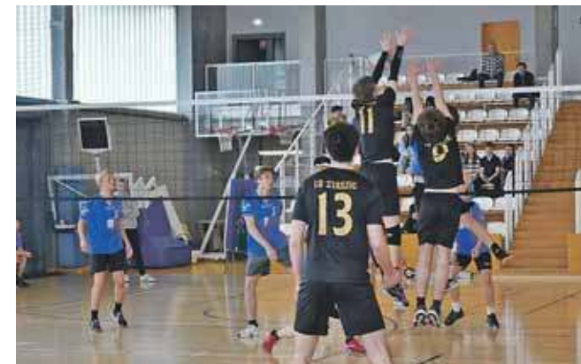
Staszic tym razem poza pierwszą trójką