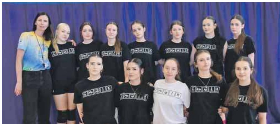
„Srebrna” reprezentacja Chemika

Wśród chłopców wygrał Zespół Szkół im. prof. J. Groszkowskiego z Zabrze, a Staszic zakończył turniej na czwartym miejscu. Już sam