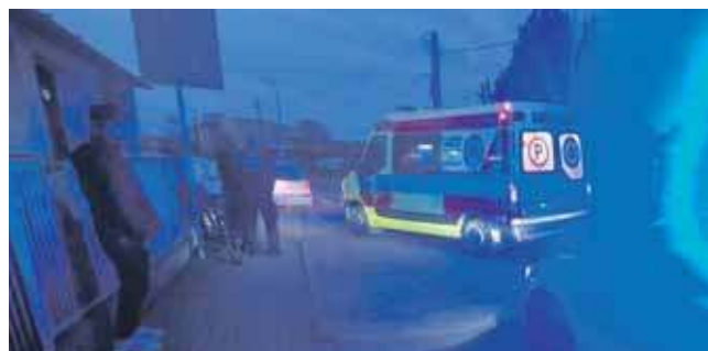
Jak ustalili policjanci z Kalet oraz funkcjonariusze tarnogórskiej drogówki, 61-letni kierowca volkswagena, mieszkaniec Kalet, nie ustąpił pierwszeństwa 21-letniej rowerzystce jadącej ulicą 1 Maja

To kolejny przypadek na lokalnych drogach, który mógł skończyć się tragicznie. (MIR)