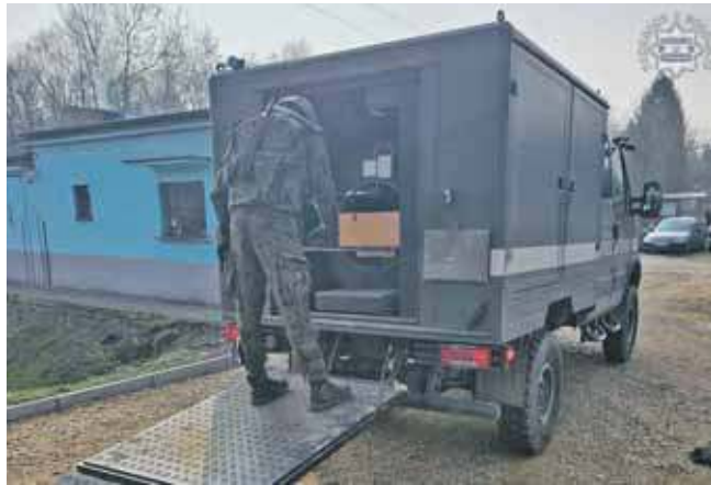
Na miejscu zjawili się saperzy z Gliwic, którzy zabrali granat na poligon

We wtorek, 25 marca, po godzinie 13 dyżurny tarnogórskiej komendy odebrał zgłoszenie o podejrzany przedmiocie, który znaleźli pracownicy jednej z firm przy ulicy Dworcowej w Przechlebiu. Na miejscu zjawili się policjanci ze Zbrostawic, a także policjany pirotechnik, który rozpoznał przedmiot, jako niekompletny granat moździerzowy pochodzący z czasów wojennych.