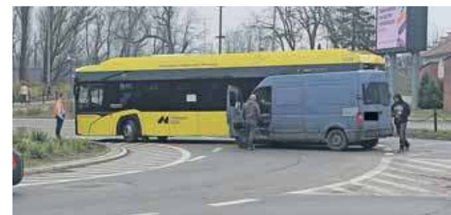
Jak ustaliła policja, kolizję spowodował kierowca autobusu