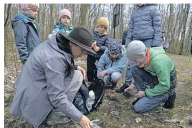
Na wyprawie małych geologów

Jak zwykle na wydarzeniach organizowanych przez