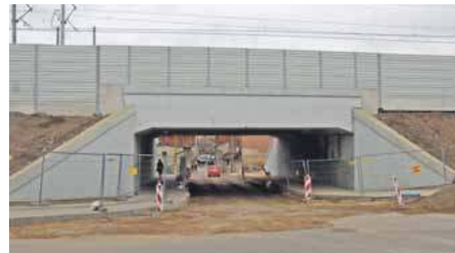
Przejazd pod wiaduktem zostanie zamknięty w czwartek

Przejazd po wiaduktem na ul. Zejera będzie