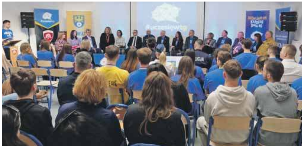
W targach biorą udział przede wszystkim szkoły prowadzone przez powiat

W tym roku zrobiono jednak pewne wyjątki. Na targach promowały się dwie szkoły ministerialne: Zespół