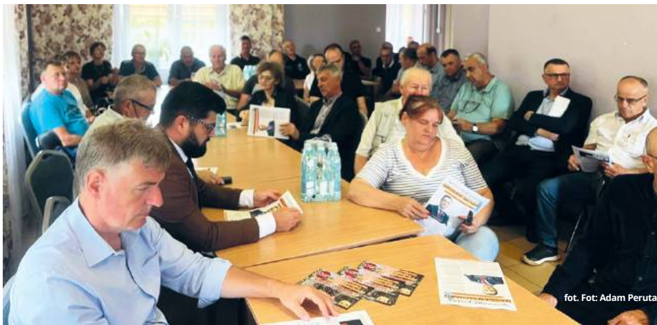
fol. Fot: Adam Peruta

W niedzielę, 20 lipca, w świetlicy wiejskiej w Bytyniu odbyło się otwarte spotkanie poświęcone planom utworzenia Sobiborskiego Parku Narodowego. W wydarzeniu wzięło udział około 50 osób, w tym mieszkańcy, przedstawiciele samorządu, społecznicy i zaproszeni goście. Uczestnicy spotkania wyrazili zdecydowany sprzeciw wobec planowanej formy ochrony przyrody, postulując przeprowadzenie referendum w tej sprawie oraz deklarując gotowość do dalszego monitorowania sytuacji.