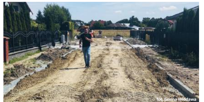
fol. Gmina Włodawa

● GM. WŁODAWA Rozpoczęła się budowa dróg gminnych w miejscowościach Suszno, Szuminka i Różanka. Projekt, którego całkowita wartość wynosi ponad 7 mln zł, uzyskał znaczące dofinansowanie w wysokości prawie 6 mln 900 tys. zł z Rządowego Funduszu Polski Ład. Zakończenie inwestycji planowane jest na październik 2026 roku.