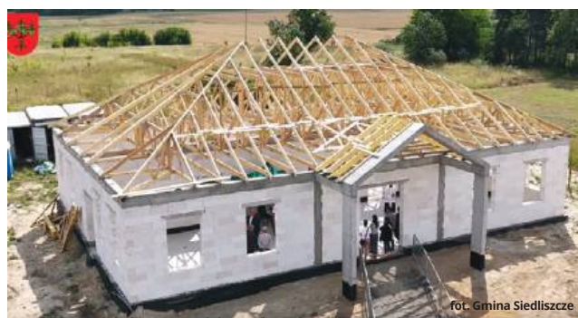
Budowa obiektu przebiega bardzo sprawnie

- Nowy żłobek zapewni opiekę najmłodszym mieszkańcom gminy, tworząc nowoczesne, bezpieczne i przyjazne środowisko dla dzieci. Inwestycja jest realizowana ze środków samo-