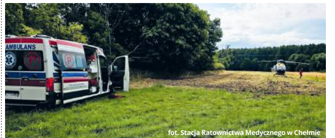
fol. Stacja Ratownictwa Medycznego w Chełmie

Ze względu na stan małego pacjenta, na miejsce wezwano również śmigłowiec Lotniczego Pogotowia Ratunkowego. Po udzieleniu pierwszej pomocy dziecko zostało przekazane załodze LPR i przetransportowane do szpitala.