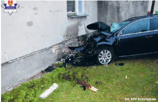
fol. KPP Krasnystaw

Nietrzeźwy młody kierowca z Krasnegostawu w sobotnią noc podróż zakończył na ścianie domu w Siennicy Nadolnej. Volkswagena, którym jechał, najpierw staranował znak drogowy, a następnie uderzył w budynek, uszkadzając jedną ze ścian. Ranny 23-latek trafił do szpitala.