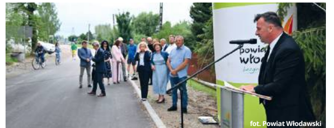
fol. Powiat Włodawski

● GM. WŁODAWA W piątek (19 lipca) oficjalnie oddano do użytku wyremontowaną ulicę Orzechowej w Susznie. Inwestycja, realizowana na odcinku niemal kilometra drogi powiatowej, została sfinansowana ze środków Programu Rozwoju Północno-Wschodnich Obszarów Przygranicznych oraz z wkładu własnego samorządów.