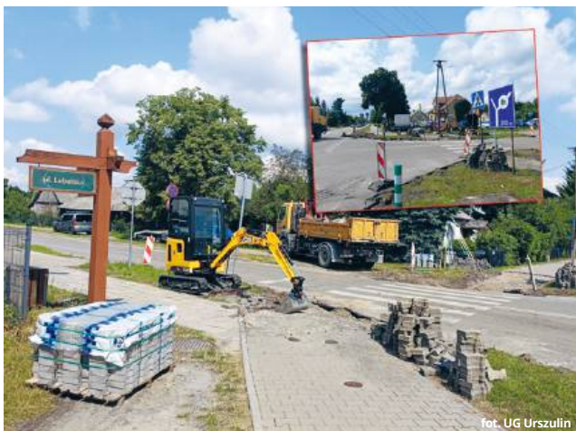
Skrzyżowanie ul. Lubelskiej i Szkolnej w Urszulinie od lat było źródłem wielu kolizji i wypadków

Jak podkreśla, decyzja o rozpoczęciu robót zapadła