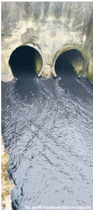
Brunatna substancja została zaobserwowana przez radnego 11 lipca

- Zauważyłem, że młode ryby wyskakują z wody, aby nabrać powietrza. Część ławicy była już niestety martwa. Do wody wpływała podejrzana substancja. Rura, którą spuszczano tę substancję, stanowi część infrastruktury oczyszczalni ścieków w Bielawinie. Otworzyliśmy jaz na Uherce i już następnego dnia kontaktowały się z nami władze gminy Ruda-Huta, alarmując, że ręką płyną martwe ryby. Wtedy nie mieliśmy już wątpliwości, że naprawdę dzieje się coś bar-