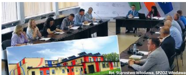
fol. Starostwo Włodawa, SPZOZ Włodawa

Powołanie komisji konkursowej do przeprowadzenia postępowania na stanowisko dyrektora Samodzielnego Publicznego Zespołu Opieki Zdrowotnej we Włodawie było najważniejszym punktem sesji Rady Powiatu we Włodawie, która została zwołana 14 lipca w trybie nadzwyczajnym.