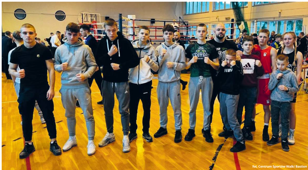
fol. Centrum Sportów Walki Bastion