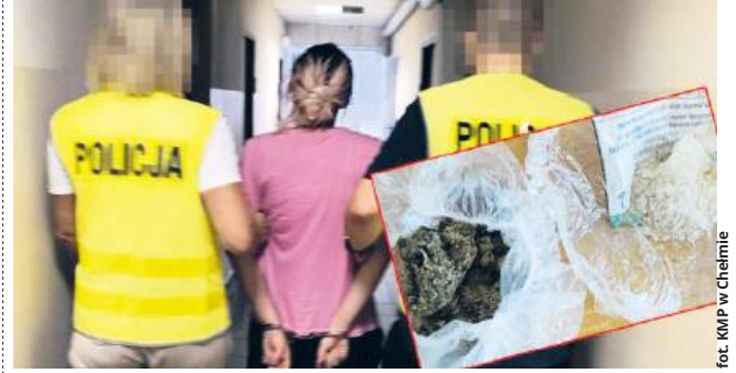
fol. KMP w Chełmie

● POW. CHEŁMSKI Za posiadanie marihuany i mefdronu odpowie 18-letnia mieszkanka powiatu chełmskiego. Policjanci z wydziału kryminalnego zatrzymali młodą kobietę po tym, jak w jej miejscu zamieszkania zabezpieczyli znaczne ilości narkotyków. Decyzją prokuratora została objęta policyjnym dozorem.