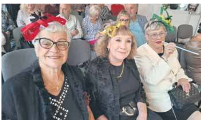
Panie z klubu To i Owo niczym z Moulin Rouge