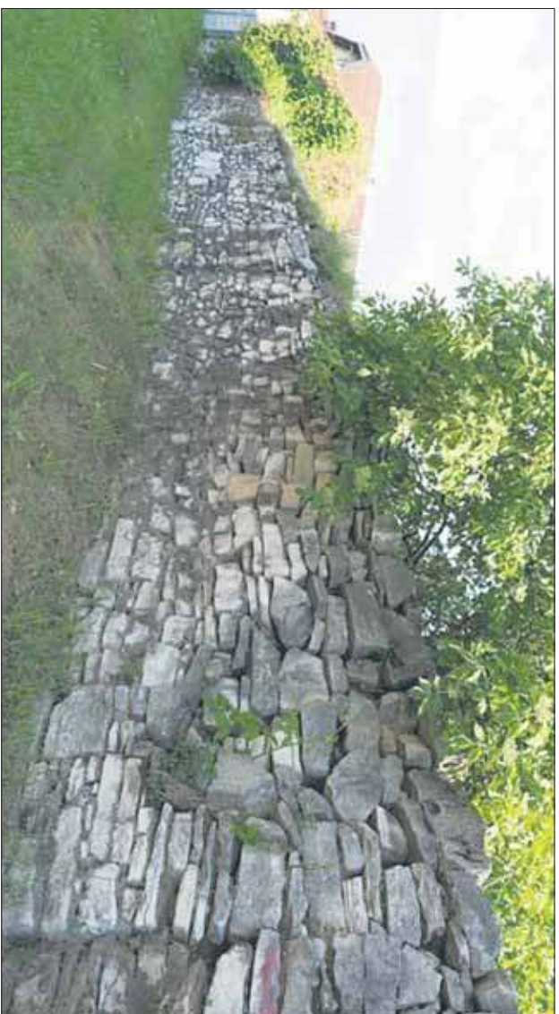
Fragment dzwiewiętnastowiecznego muru dworskiego (tzw. zamku) w Długoszyne. Stan obecny