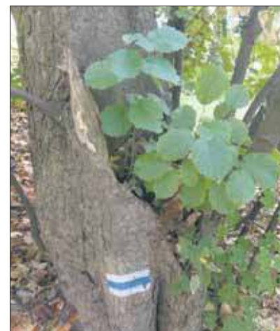
Pustka w jaworze

Po tej stronie ulicy wyrastają jeszcze klon zwyczajny, kasztanowiec zwyczajny oraz dwa jawory. Ten, który rośnie pomiędzy byłym kinem a pocztą, ma spełniającą się w roli doniczki dla leszczyny