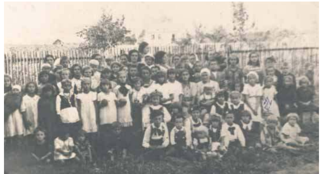
Długoszyńskie dzieci w obrębie Palianowszczyzny, lata 40. XX wieku (ze zbiorów prywatnych)

ścią teje rodziny. Niewątpliwie rodzina ta była zamożna, posiadając tak duży majątek. Większość takowego została jednak podobno „przełana”, jak to wspominają niektórzy przez co poniektórych przedstawicieli rodu. Sprzedany został przez ową rodzinę także młyn, zakupiony w trakcie I wojny światowej przez rodzinę Musiałów. Rodzina Palianów ta ma też jednak i pozytywny wkład w historię Długoszyńca. Jeden z jej przedstawicieli miał