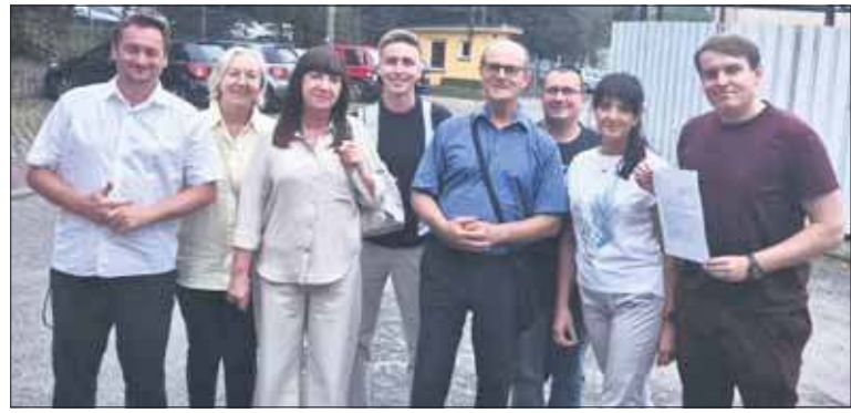
Radni Klubu Koalicji Obywatelskiej z Jaworzna

Również z niżej demograficznym mierzy się Sosnowiec, który obecnie liczy około 190 tysięcy mieszkańców, a jeszcze w latach 80. miał ich około 250 tysięcy. Aby walczyć o nowych mieszkańców, miasto Zagłębia Dąbrowskiego zaczyna wdrażać rozwiązania, które mają zachęcić młode osoby do osiedlania się i zakładania rodzin.