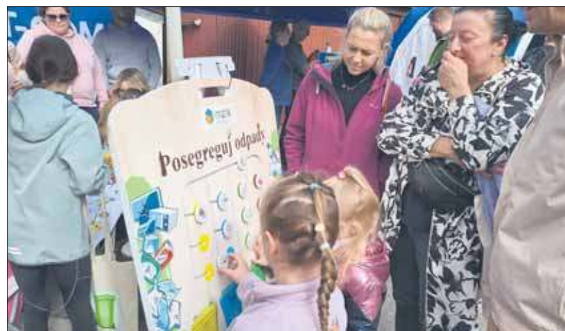
Ekologiczne konkursy zainteresowały i dużych, i małych

Zbierają się mieszkańcy, dzieci się mogą pobawić, przyjemna atmosfera, na dokładkę ekologia, czyli to, co w tych czasach jest