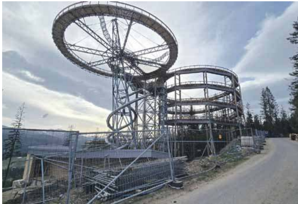
Tak inwestycja wyglądała kilka tygodni temu.

Ścieżka widokowa Sky Walk Serce Poronina to trasa długości 854 metrów z platformami widokowymi na wysokości 47 metrów. Obiekt budowany jest ze stali, szkła oraz drewna. Wśród atrakcji - ekstremalny, podwieszany plac zabaw, trasa lokalnych ciekawostek i legend, dwie trasy spacerowe, dwie zjeżdżalnie, 81 metrów kwadratowych sieci i tuneli. Do tego dwie platformy widokowe oraz dwa szklane tarasy. Całość z lotu ptaka ma kształt serca, które symbolizuje miłość do przyrody i do ludzi. Inwestor, który ma na swym koncie szereg tego typu realizacji na terenie całej Europy, to czeska firma Taros Nova. Koszt inwestycji szacowany jest na około 60 milionów złotych. rav