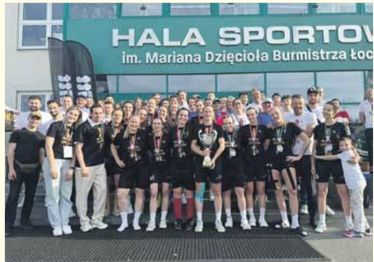
Unihokeistki NKP Podhala Nowy Targ zdobyły srebrne medale.