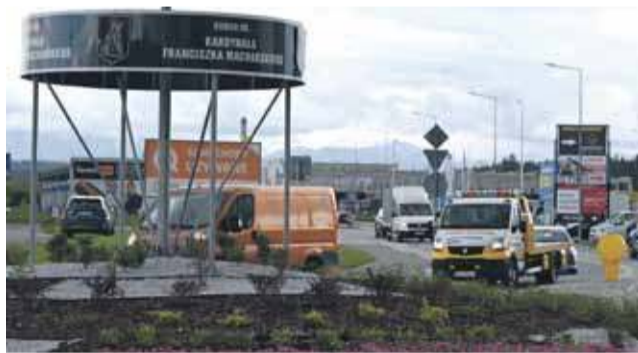
Napis o patronie widać z każdej strony wjazdu na rondo.

Kard. Macharski chętnie przyjeżdżał do Nowego Targu nie tylko do parafii, ale także na wszelkie uroczystości, np. wziął udział w odsłonięciu pamiątkowego obelisku, który upamiętnia pielgrzymkę Jana Pawła do stolicy Podhala. „Obejmował patronat w licznych konkursach oraz wystawach. Z rąk