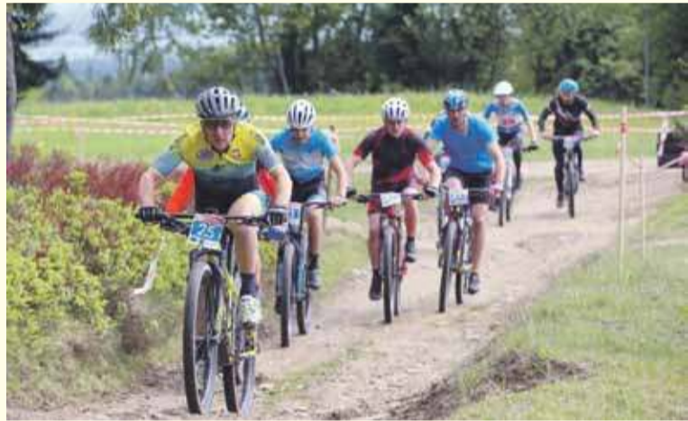
Zawody zgromadziły rekordową liczbę zawodników i zawodniczek.