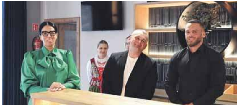
Czy najemcy doczekają się zgody wójta na sprzedaż alkoholu?

- Wiemy dobrze, że nadużywanie alkoholu niszczy relacje międzyludzkie i niszczy często rodziny. Alkohol pity bez umiaru przyczynia się do wielu ludzkich dramatów. Stąd w jakimś sensie rozumiem, tych którzy sprzeciwiają się sprzedaży trunków w pobliżu sanktuariów. Z drugiej strony nie ma co udawać, że alkohol nie jest dla ludzi.