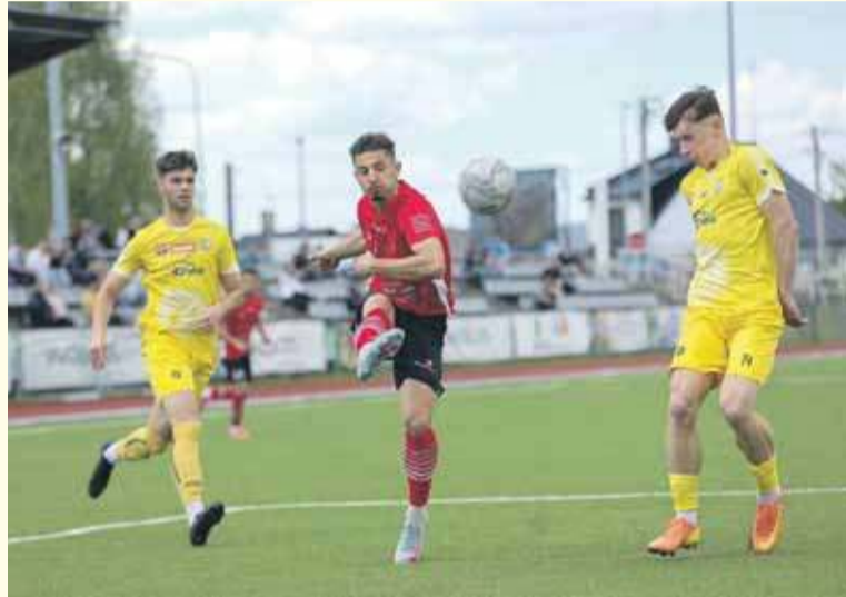
NKP Podhale Nowy Targ zdobyło komplet punktów.