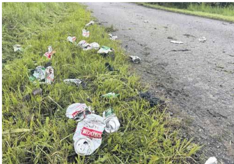
Zabawa była przednia...