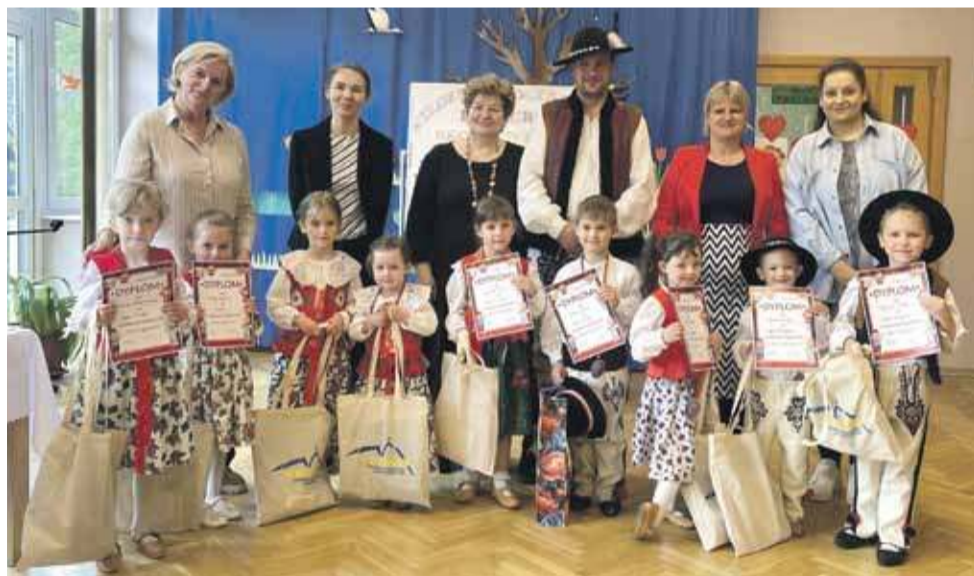
Najlepsi nagrodzeni wraz z organizatorami, opiekunami i rodzicami.