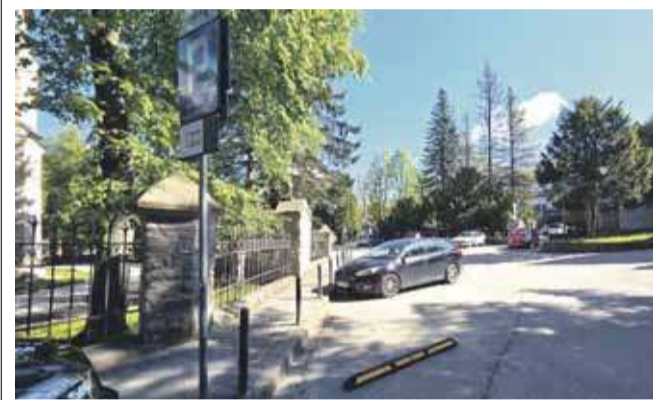
Gmina rości sobie prawa do parkingu obok Sanktuarium na Krupówkach.

Burmistrz Zakopanego ma majątek wart ponad 3,1 mln zł i jest najzamożniejszym z władarzy Podhala. Gospodarz Szczawnicy goni go z portfelem mniejszym o zaledwie milion złotych. Pozostali burmistrzowie - z Nowego Targu, Rabki-Zdroju i Czarnego Dunajca - także przekraczają próg miliona. Inwestują w akcje, kryptowaluty i nieruchomości. Analizujemy oświadczenia majątkowe naszej władzy. czytaj str. 9