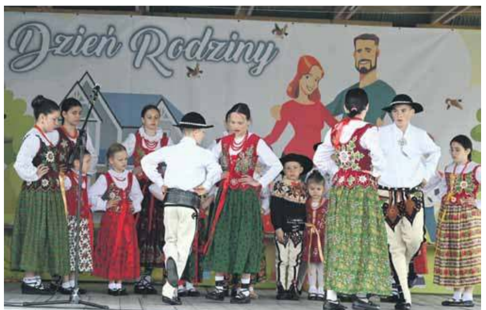
Na scenie plenerowej zaprezentował się m.in. zespół „Tatry” z Ratułowa.

Uczestnicy wydarzenia mogli też sprawdzić swoje umiejętności sprawnościowe, biorąc udział w różnych konkur-