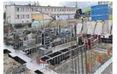
Sala ma służyć nie tylko uczniom, ale również mieszkańcom Cyrhli.