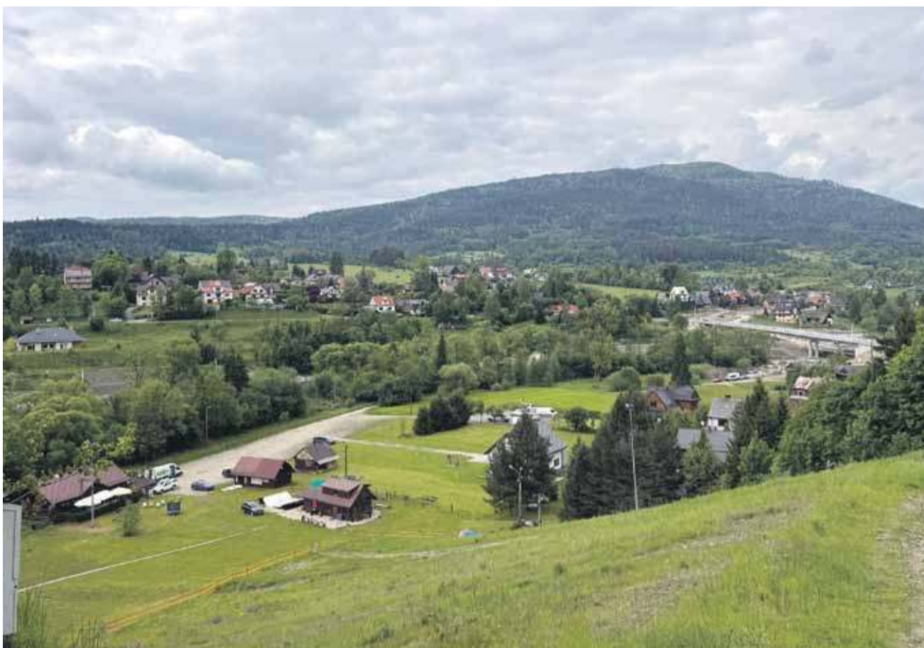
Zaryte - ta dzielnica Rabki w 2015 roku znalazła się poza „aglomeracją”.