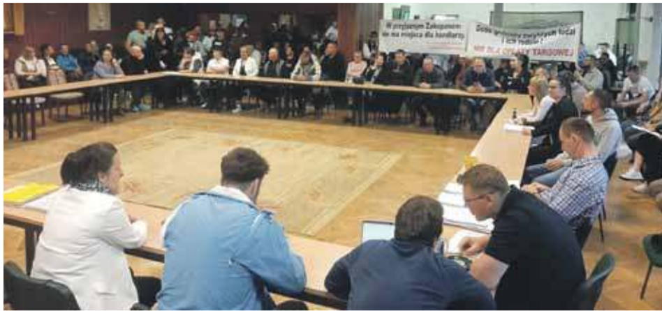
W środę protestujący kupcy pojawili się w Urzędzie Miasta.

Jak twierdzą 4 złote za metr kwadratowy proponowane przez burmistrza za dzień handlowy oznacza opłatę 1460 zł za rok. Tymczasem podatek od nieruchomości wynosi tylko 25,6 zł za metr za rok, czyli 0,07 zł dzien-