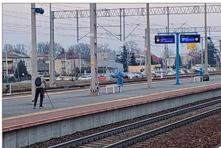
W Dębicy nie brakuje pasjonatów fotografujących składy kolejowe.

Prawdziwe problemy mogą się zacząć jednak, gdy będziemy chcieli wejść na teren kolejowy poza peronami,