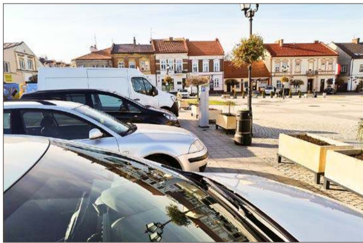
Strefa płatnego parkowania działa na Rynku w Pilźnie od 2020 roku.