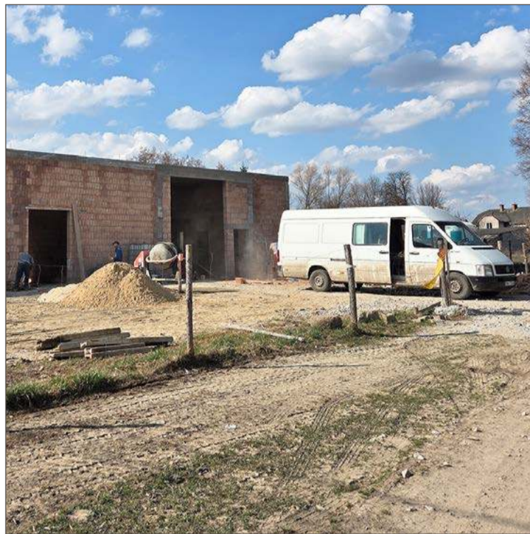
W Mokrem prace przy budowie trwają od ubiegłego roku.

Tutaj swoją siedzibę znajdzie jednostka OSP. Obecnie druhowie korzystają z remizy, która czas