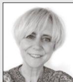
majba@ol.com.pl tel. 14 670 27 87

Nasi dziennikarze czekają na Twoje zgłoszenie