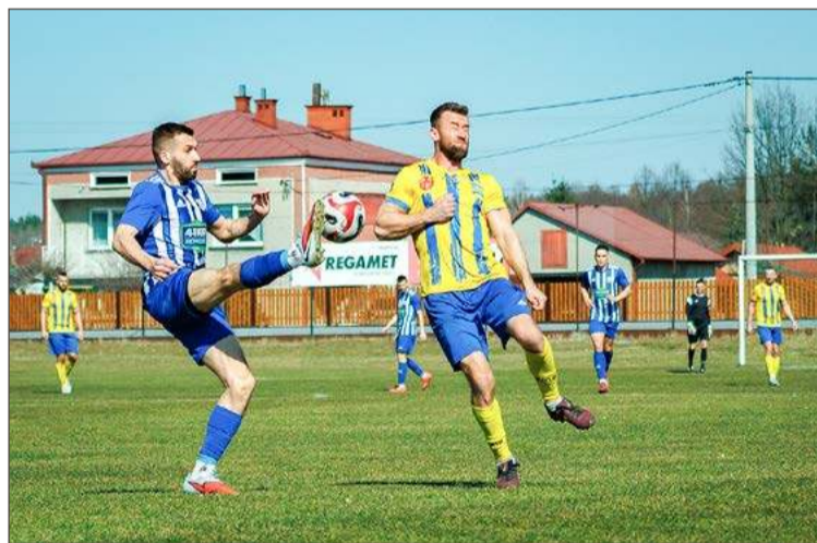
W derbach powiatu Kamieniarz lepszy od Chemika.