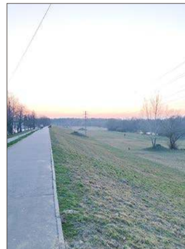
W najbliższą sobotę wały nad Wisłoką tętnić będą życiem.

Wiosenny piknik na wałach będzie pierwszą w tym sezonie, ale nieostatnią imprezą plenerową planowaną w mieście. Już wiadomo, że w harmonogramie wydarzeń znajdą się śniadania w parku Sokoła przy Śnieżce. Pierwsze takie odbyło się jesienią ubiegłego roku i zgromadziło sporą grupę Dębiczan, zainteresowanych taką formą spędzenia wolnego czasu. Dokładne daty nie są jeszcze znane, ale można przypuszczać, że inauguracyjny piknik śniadaniowy zorganizowany zostanie nie wcześniej niż w połowie maja.