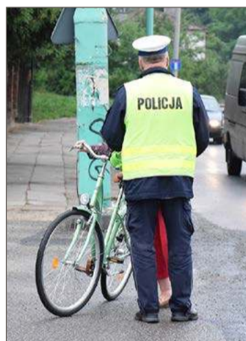
Nietrzeźwi rowerzyści wpadają regularnie. Fot. ilustracyjne.

Niedługo potem, o godz. 15:40, również w Brzeźnicy wpadł kolejny mieszkaniec gminy Dębica, który zdecydował się na przejażdżkę rowerem, choć powinien wtedy wybrać spacer. Okazał się nim 70-latek. On również został poddany badaniu alkomatem.