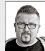
ratuszniak@ol.com.pl tel. 14 670 27 80