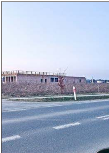
Prace przy budowie rozpoczęły się jesienią tamtego roku.