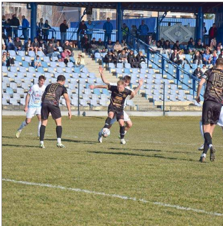
Do pobicia piłkarza Legionu doszło po meczu z Igloopolem.