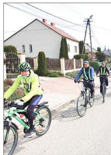
Uczestnicy RDK przejadą również przez Górę Motyczną.

Trasa liczy 26 km. Prowadzi przez: Żyraków, Zawierzbie, Straszęcin, Grabiny, Głowaczową, Wolę Wielką, Górę Motyczną, Żyraków.