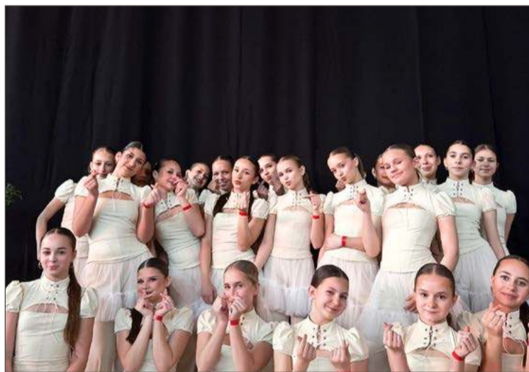
Tancerki z Soul Dance na turnieju Royal Cup nie miały sobie równych.