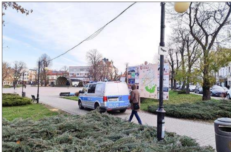
Funkcjonariusze częściej bywają teraz na Rynku.

Kobieta twierdzi, że może nie zwracałaby szczególnej uwagi na pijące towarzystwo, gdyby nie robili tego na oczach dzieci, a przede wszystkim normalnie się zachowywali. Tymczasem na porządku dziennym są przekleństwa i spanie na ławkach, a czasem nawet burdy i załatwianie potrzeb w miejscach publicznych.