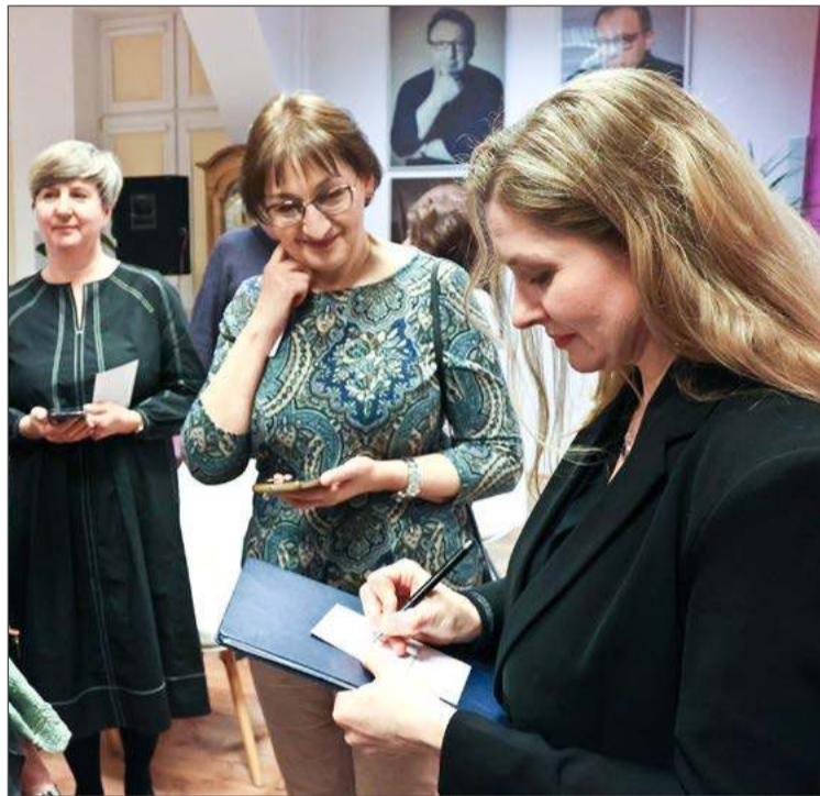
Spotkanie z aktorką było okazją do zdobycia jej autografu.