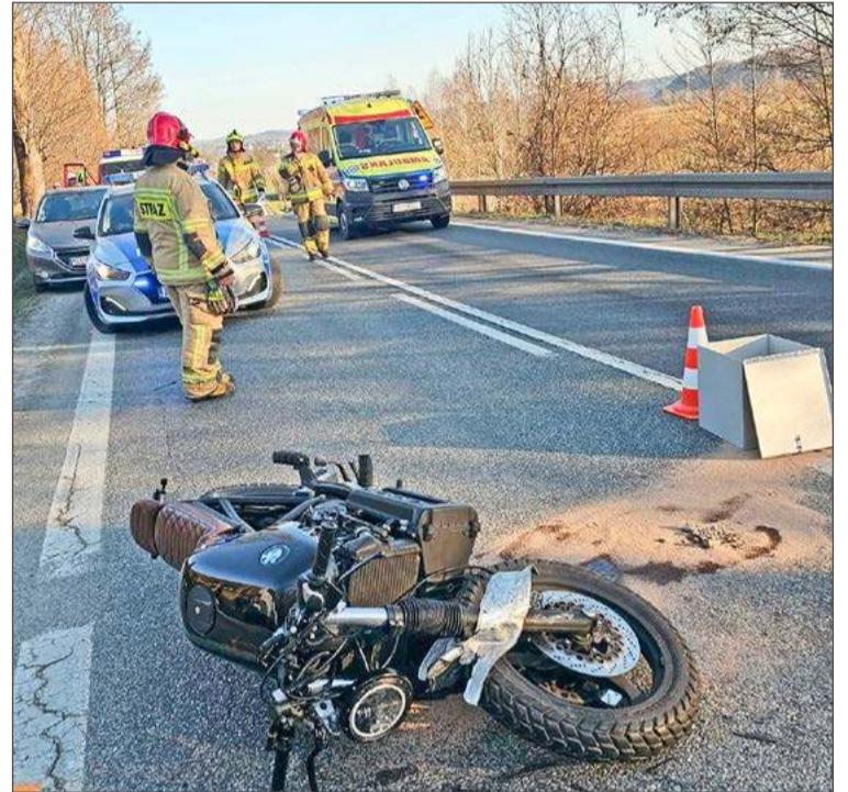
Do zdarzenia w Zawadce Brzostekiej doszło na Drodze Krajowej nr 73.