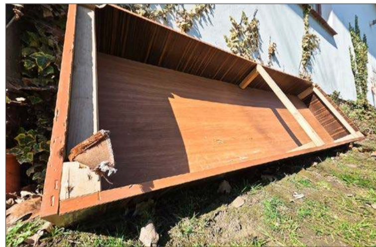
Oddać będzie można także zużyte meble.