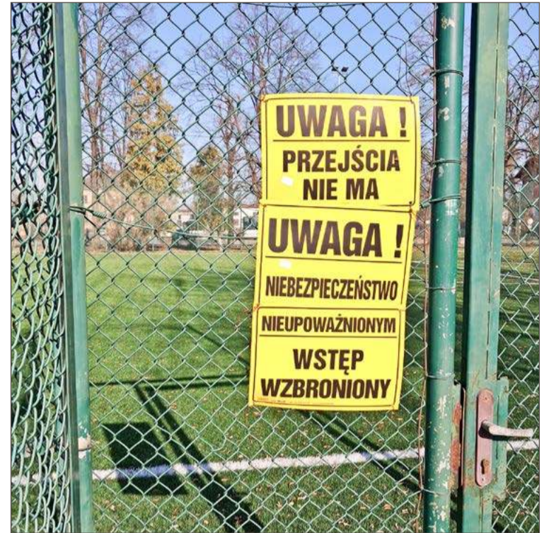
Niebawem na boisku znów pojawią się pracownicy firmy Grzeński.

W decyzji, jaką otrzymała Firma Oponiarska znalazły się również zapisy nakładające na inwestora obowiązek wykonania nasadzeń