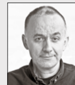
grajcar@ol.com.pl tel. 14 670 27 80