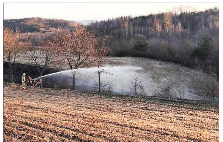
Pożary traw mogą zagrażać lasom.