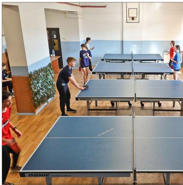
Organizatorzy turnieju każdego roku pamiętają o zmarłym trenerze.

W pierwszej zwyciężyły reprezentantki SP w Dęborzynie (Maziarka, Maguda), na drugim stopniu podium stanęły dziewczęta z SP w Dębowej (Zawiślak, Wal), a na trzecim znalazły się te z SP nr 3 w Jodłowej-Wisowej (Bułat, Kita). Kolejne lokaty wywalczyły zawodniczki z SP nr 1 w Jodłowej