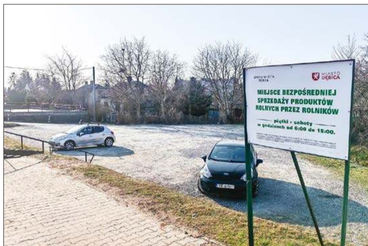
Przeznaczenie tego placu się nie zmieni, nadal będzie służył jako parking.

Delegacja handlujących na Rynku odwiedziła w ubiegłym tygodniu Ratusz. Ze spotkania kupcy wyszli z zapewnieniem, że parking, o którym mowa, będzie dla nich dostępny jak dotąd. A nowa organizacja miejsc i wjazdu pozwoli na to, by samochody mieściły się tam w tej samej liczbie. Nowy zjazd na parking jest już zaprojektowany, w kwietniu jego wykonaniem zajmie się Zakład Usług Miejskich.