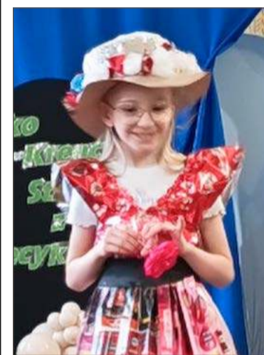
Takie kreacje można było podziwiać w SP w Grabinach.