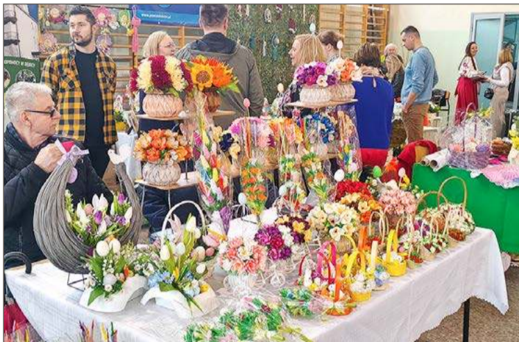
Od lat kiermasz powiatowy odbywa się w Zespole Szkół Ekonomicznych.

Tego samego dnia od godz. 10 do 18:00 na placu parkingowym koło bożnicy w Brzostku trwał będzie gminny kiermasz. W programie oprócz standardowych pozycji, występ kapeli folklorystycznej Brzosty. Zapisy chętnych do pokazania swojej twórczości jeszcze trwają i będą przyjmowane do 27 marca. Uczestnictwo jest darmowe.