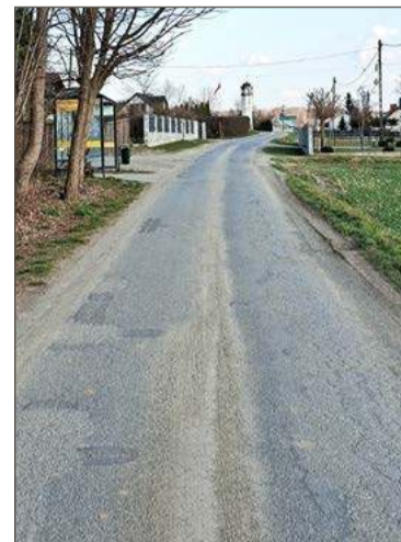
Ulica Stara Droga jest zniszczona i wymaga pilnych prac.

- Trasa przebiegać będzie głównie po starym śladzie - mówi wiceburmistrz Brzostku.