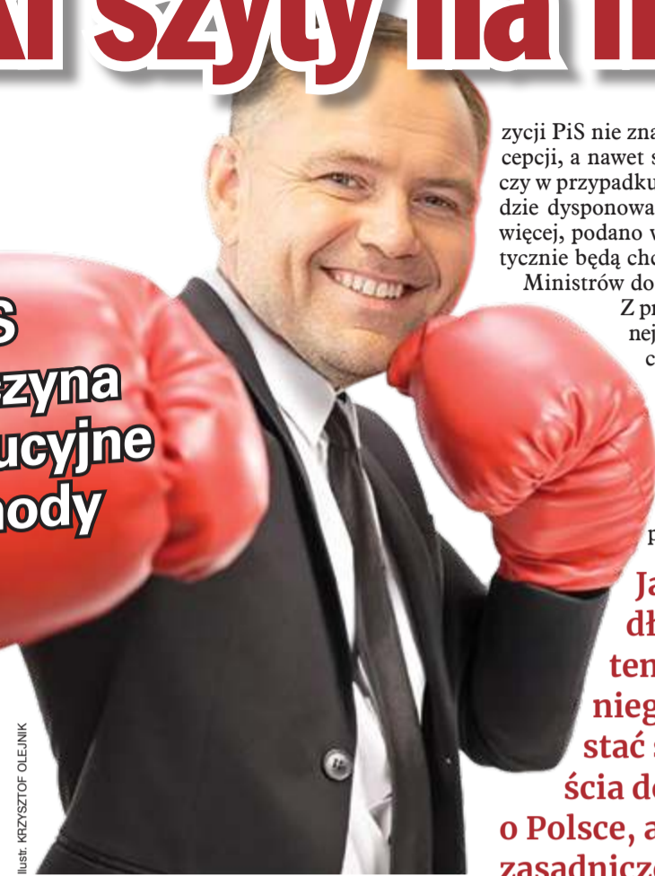
ILUSTRACJA: KRZYSZTOF OLEJNIK

Ministerstwo Zdrowia wśród pomysłów na pudrowanie trupa wyłożyło właśnie na stół kilka fantów, m.in. zamrożenie podwyżek wynagrodzeń