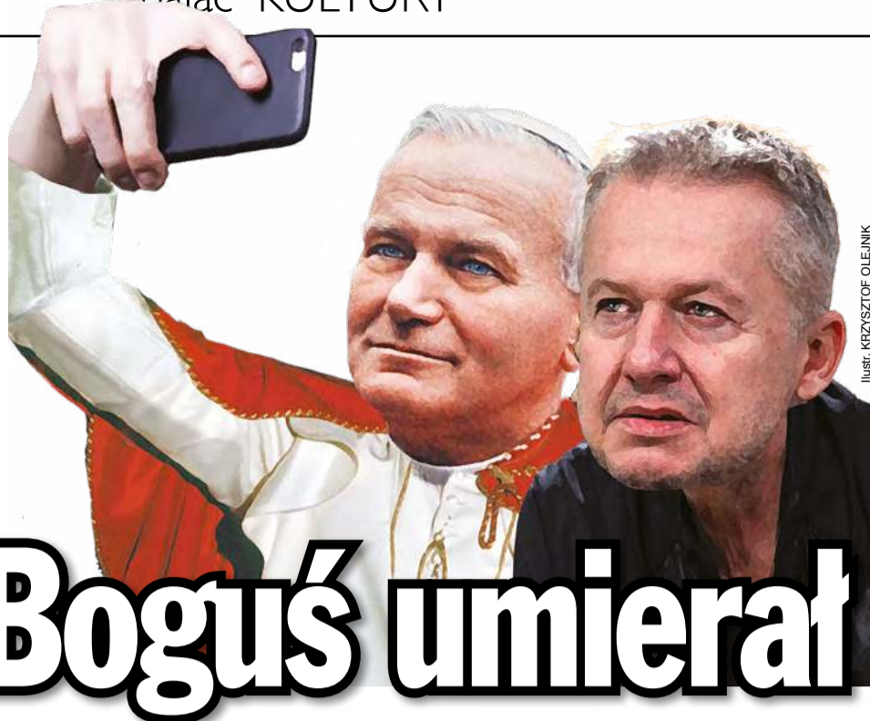
ILUSTRACJA KRZYSZTOF OLEJNIK

dzów. A robię filmy dla nich, nie jak moi koledzy i koleżanki dla samych siebie” – reklamował się Pasikowski.