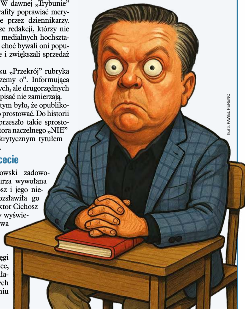
ILUSTR. PAMEL FERENC

„No właśnie. I to nie jest sprawiedliwe” – wtrącił Marek.