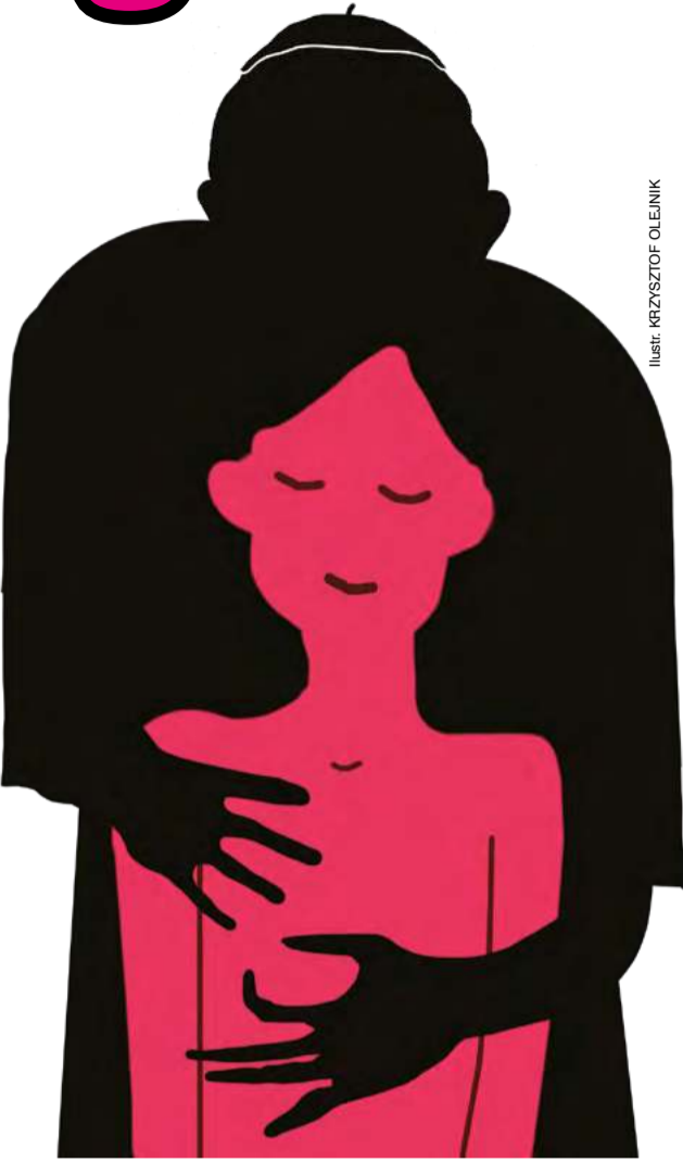
ILUSTRACJA: KRZYSZTOF OLENIK

Tymieniecka wraz z mężem zorganizowali polskiemu purpuratowi wykłady na znakomitych uczelniach