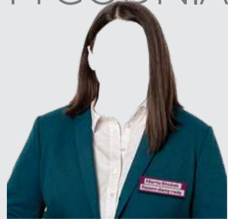
ILUSTRACJA: KRZYSZTOF OLEJNIK

8 listopada, piątek w nocy: posłowie Razem nie głosują w sprawie zatrzymania i ewentualnego tymczasowego aresztowania Zbigniewa Ziobry.