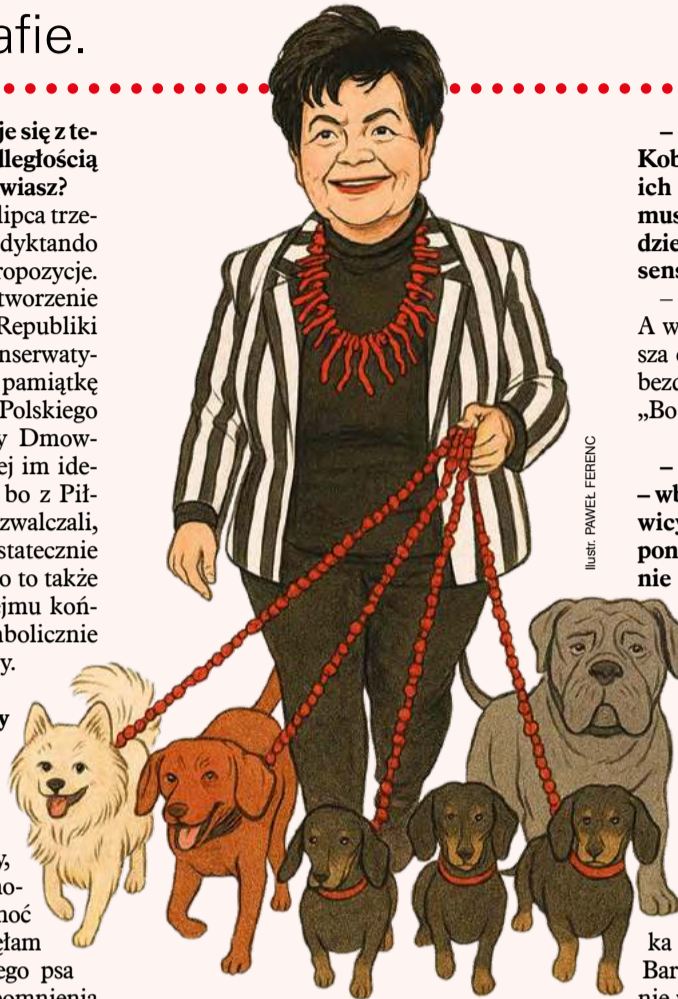
ILUSTR. PAWEŁ FERENC

– Już starczy, bo nas zamkną za propagowanie komunizmu. Wracam na bezpieczne wody: jest też drugi powód przeglądania fotografii – muszę wybrać kilkadziesiąt do mojej biografii. Nawet sobie nie wyobrażasz, jakie to trudne. Najgorsze są zbiorowe, bo zawsze ktoś ma albo zamknięte oczy, albo głupią minę, albo za dużo zmarszczek... Na pierwszy rzut oka wszystkie się podobają, a po chwili żadne.