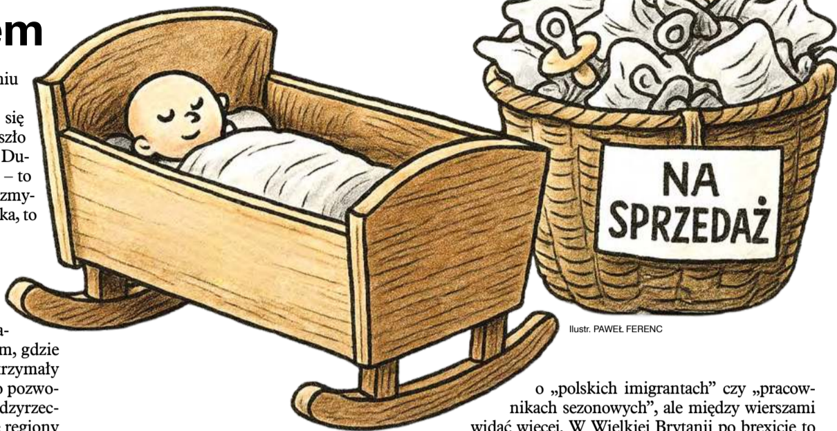
Ilustr. PAWEŁ FERENC

Konfederacja mówi o sile narodu, PiS o niepodległości, a Polska jakby ich nie słuchała. Zamiast maszerować w defiladzie, pakuje walizki. Dane CBOS z 2023 r. wskazują, że 25 proc. Polaków wstydzi się bycia Polakiem, a 20 proc. nie lubi własnych rodaków.