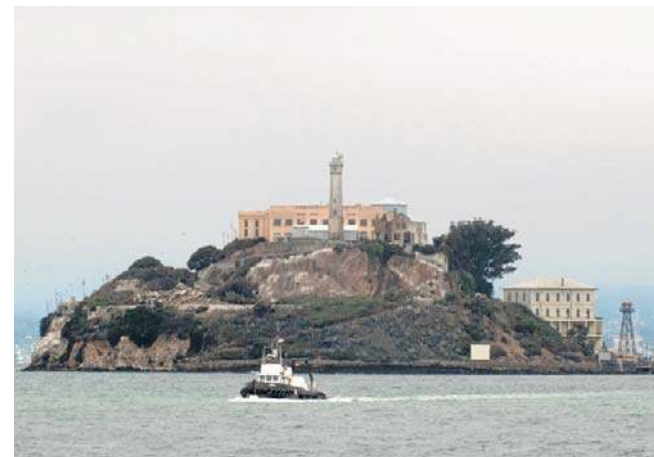
Słynne więzienie Alcatraz jest od wielu lat atrakcją turystyczną