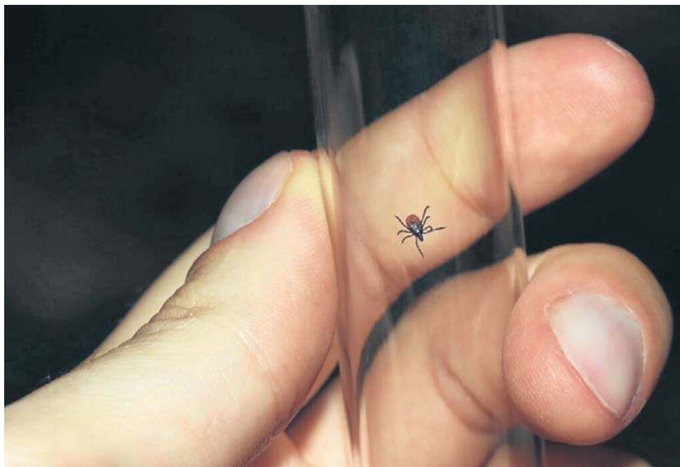
Biolog wyjaśnia, dlaczego warto zaprzyjaźnić się z czosnkiem, po jakie olejki eteryczne sięgnąć i co zamiast krótko przyciętego trawnika może naprawdę odstraszyć kleszcze

Wraz z ociepleniem klimatu sezon na kleszcze staje się coraz dłuższy, a zagrożenie