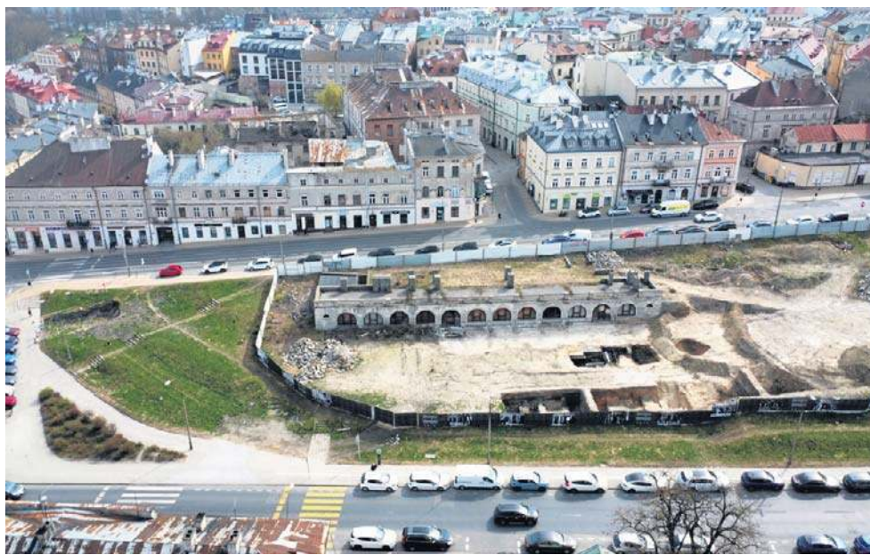
Jeszcze w kwietniu br. kontynuowane będą prace archeologiczne. W sierpniu 2025 r. odsłonięto tu pozostałości osady słowiańskiej

- To ewenement w Lublinie. Mamy zidentyfikowane na terenie miasta pozostałości osad