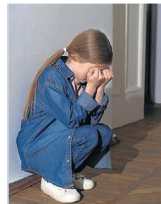
Dziewczynki mogą być nadmiernie grzeczne

- Rozpoznanie i zrozumienie własnych cech to nie tylko ulga, ale też szansa na życie w większej zgodzie ze sobą. Diagnoza nie zamyka, lecz otwiera na nowe możliwości, relacje i świadome dbanie o siebie - podsumowuje psychiatra Konrad Jurczakowski.