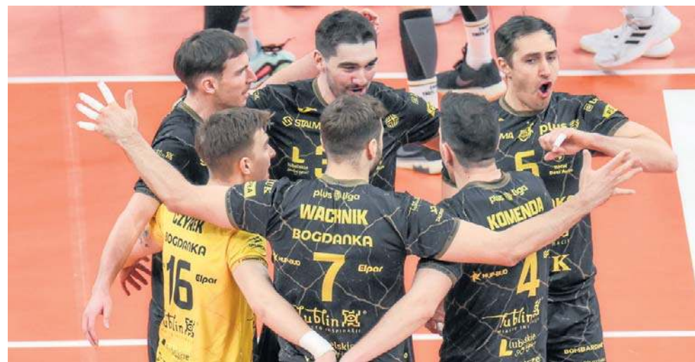
Siatkarze Bogdanki LUK Lublin nie mieli żadnych problemów, by zwyciężyć w Bałchatowie i przypieczętować awans do półfinału PlusLigi

W drugiej osłonie siatkarze z Bałchatowa wygrywali 7:4, ale kolejny as McCarthy'ego, dał pierwsze prowadzenie lubelskiemu zespołowi w tym secie