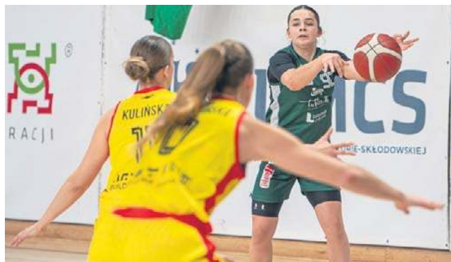
AZS prowadzi ze Śląz 2-0 w serii. W drugim półfinale Gorzów Wielkopolski wygrywa 2-0 z Poznaniem