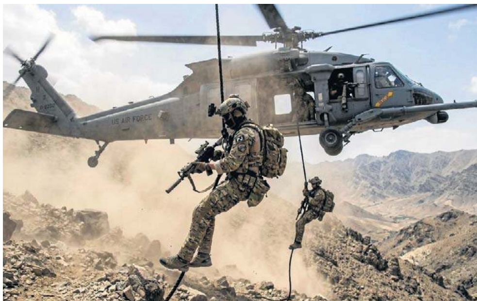
Amykańscy komandosi zabrali pilota z górzystego terenu w głębi wrogiego terytorium

Komunikat ten, niepotwierdzony dotąd przez władze USA i niemożliwy do zweryfikowania na obecnym etapie, pojawił się krótko po informacji irańskiej Gwardii Rewolucyjnej o zniszczeniu kilku „wrogich obiektów latających” podczas amerykańskiej misji ratunkowej.