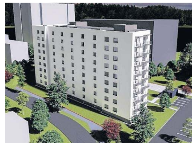
Budowa powinna ruszyć jeszcze w tym półroczu. Blok ma być gotowy do końca 2028 r.

Natomiast do końca sierpnia tego roku ma być gotowych 121 mieszkań w trzech blokach komunalnych przy ul. Królowej Bony na Felinie. W Wieloletnim Programie Gospodarowania Mieszkaniowym Zasobem Miasta Lublin na lata 2026-2030 zapisano, że w ciągu najbliższych pięciu lat powstanie 320 mieszkań.