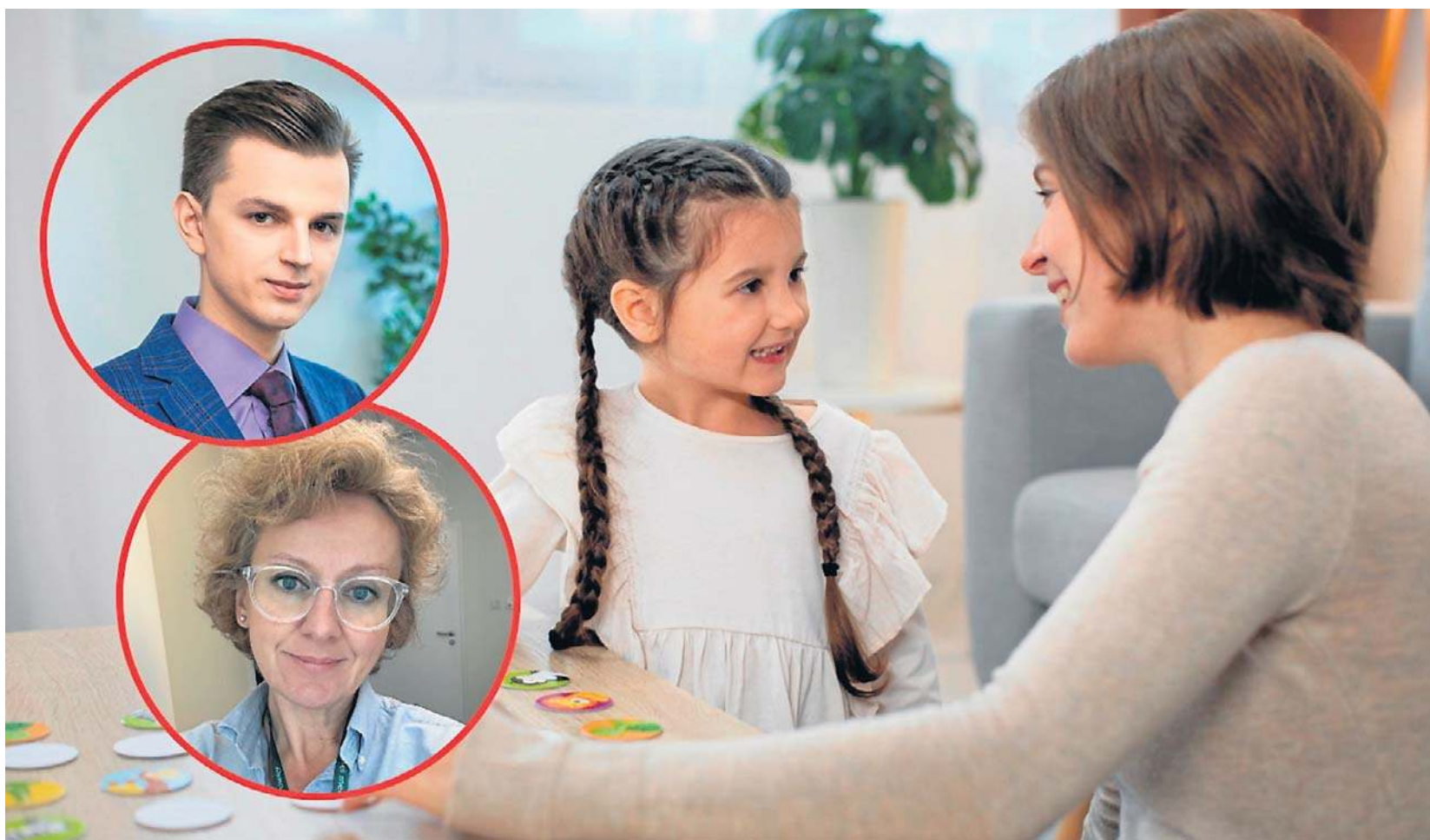
Eksperti podkreślają, że diagnoza autyzmu u kobiet bywa wyzwaniem

Jak podkreśla ekspert, zamiast wycofania dziewczynki mogą być nadmiernie grzeczne lub próbować zyskać akceptację,