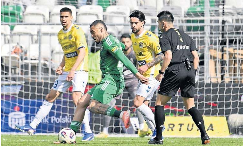
Motor (bilans:9-11-7) nie przegrał szóstego meczu z kolei

Motor rozkręcał się powoli. Inicjatywę miał wręcz rywal, ale gdy Lublinianie stworzyli sytu-