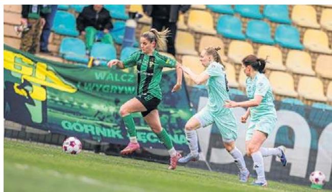
Górniczki (38 punktów) są 3. w ORLEN Ekstralidze, 2. jest Pogoń Szczecin (41), prowadzą Czarni Sosnowiec (43)