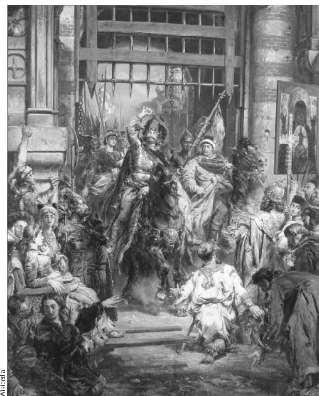
Chrobry w Kijowie. Jan Matejko

Jako drugą żonę Bolesław „wziął sobie Węgierkę”. Większość historyków identyfikuje ją jako córkę węgierskiego władcy Gejzy, ale teoria ta nie została powszechnie zaakceptowana. Urodziła syna, Bezpryma, ale Bolesław ją odrzucił. No, żeby jego...!