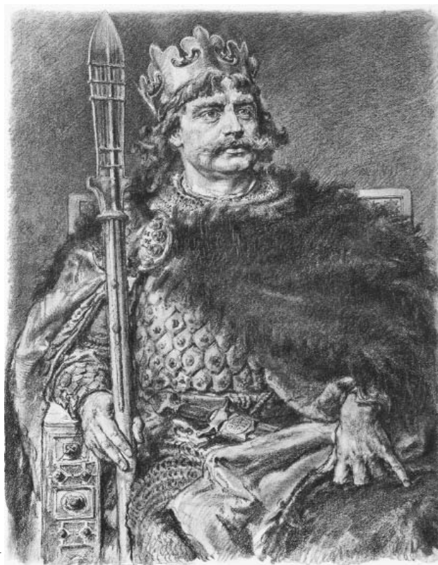
Bolesław I Chrobry. Rysunek Jana Matejki z cyklu Poczet królów i książąt polskich

Historia Polski jako potężnego, suwerennego kraju zaczęła się w roku 1000 w Gnieźnie. I to w Gnieźnie zostaje wzmocniona 18 kwietnia 1025 roku — wedle historyków oficjalnie tego dnia polska korona ostatecznie spoczywa na czole Bolesława. W 1025 roku, tuż po śmierci nowego cesarza niemieckiego Henryka II, Bolesław I Chrobry koronował się na króla i tym samym podniósł Polskę do rangi królestwa. Niestety, wkrótce sam zmarł, najprawdopodobniej z powodu choroby, a tron został przekazany jego synowi, Mieszkowi II Lambertowi. Na szczęście papież pozwolił mu zatrzymać koronę, dlatego Polska pozostała królestwem.