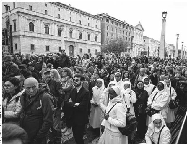
Wzdłuż trasy konduktu zgromadzili się setki tysięcy wiernych

Decyzja Ojca Świętego o wyborze bazyliki Matki Bożej Śnieżnej na miejsce swojego pochówku jest bezprecedensowa we współczesnej historii – ostatni papież spoczywał zwyczajowo w grotach