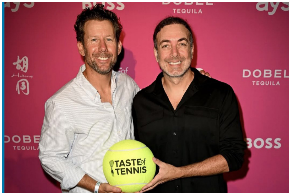
Wim Fissette (z lewej) i Nicolas Massu 17 marca na imprezie okolicznościowej podczas turnieju w Miami - jeszcze mieli pracę. Tydzień później obaj są już „wolni”...

Najważniejsze jest zdrowie i udało nam się je utrzymać. Czuję, że potrzebuję jeszcze trochę meczów, a przede wszystkim zwycięstw. Samo granie pomaga, ale to właśnie wygrywanie daje największy impuls. Mój poziom nie jest jeszcze zbyt równy, ale nie czuję, żebym był od tego