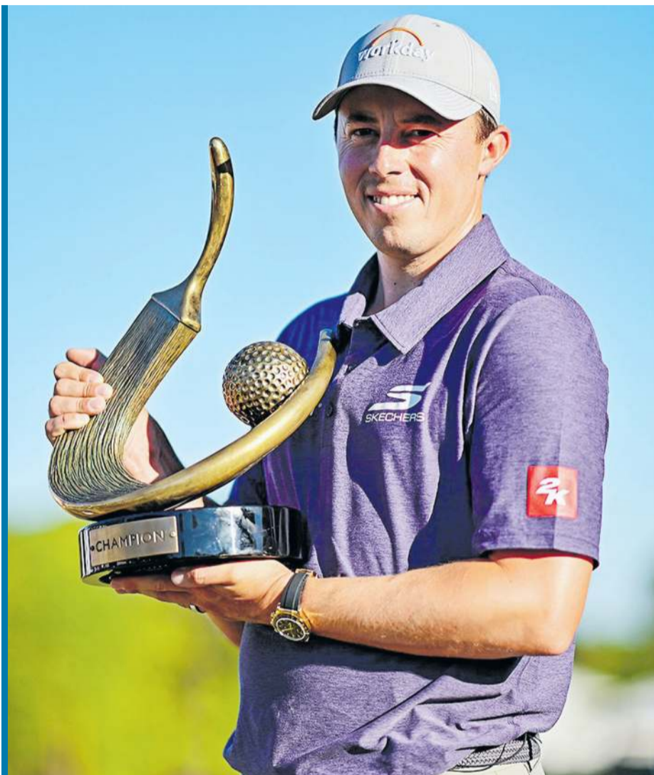
Matt Fitzpatrick z węzowym trofeum.

„Powiedziałem wczoraj mojemu psychologowi, że czuję się bardzo mocny w zajmowaniu miejsc 15-5. Czuję jednak, że nie dostaję się wystarczająco często do walki o miejsca 5-1. Jeśli zacznę to robić częściej, wierzę, że będę wygrywał więcej”.