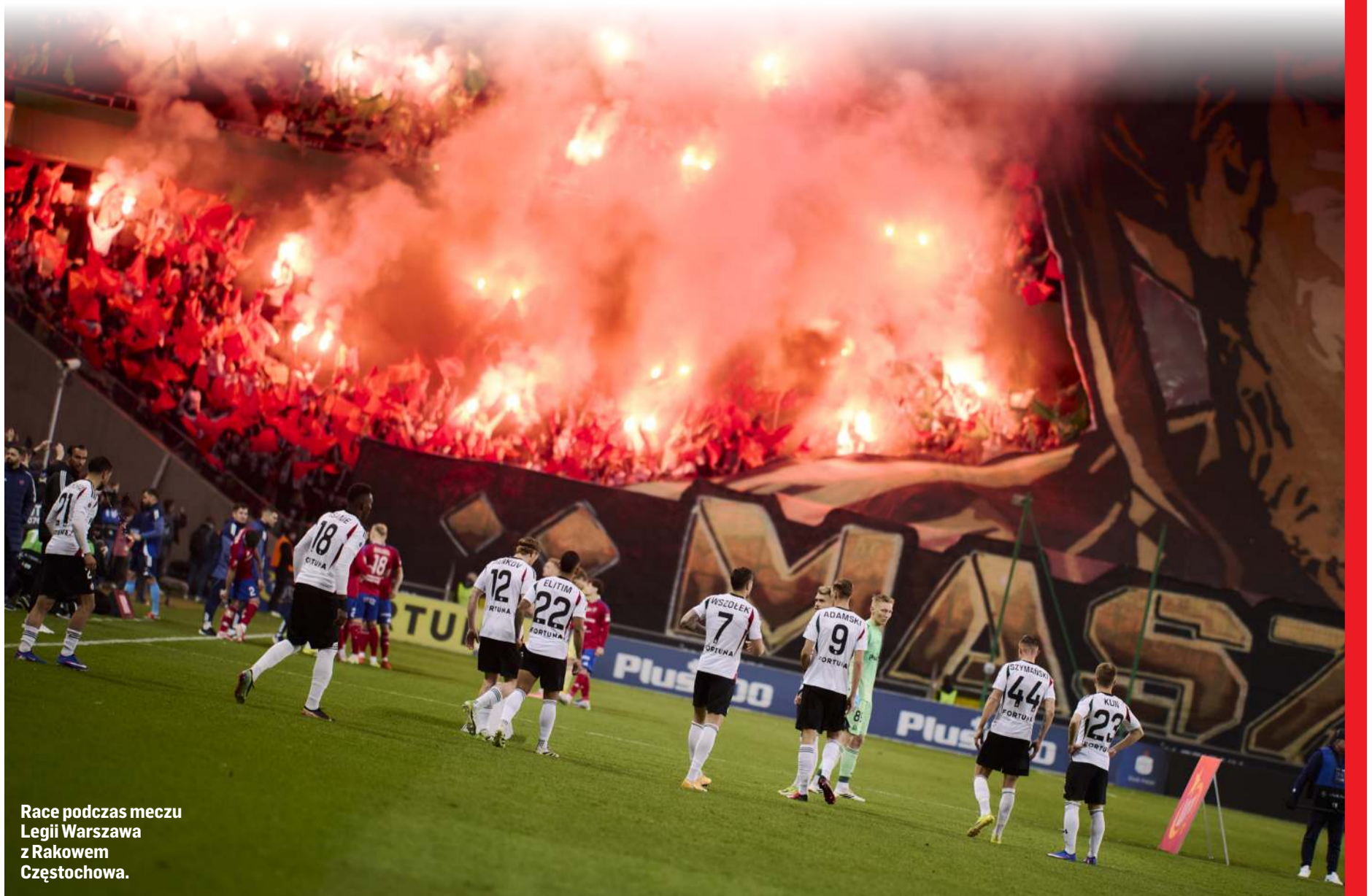
Race podczas meczu Legii Warszawa z Rakowem Częstochowa.

Ale dzięki temu piłkarze mają przecież dodatkową przerwę, mogą się skonsultować z trenerem, odsapnąć i „uzupełnić płyny”, kibice też mogą wyjść na siku. Ja nawet lubię, jak przez chwilę niczego nie widać. Pamiętam, gdy przed laty Olafur Eliasson wystawił w prestiżowej berlińskiej galerii Martin Gropius Bau... mgłę. Moja córeczka miała naówczas dziesięć lat i serdecznie nie cierpiała „chodzenia do muzeów”, ale na tej wystawie mgły bawiła się setnie. Wszelkie bezkrwawe formy sublimacji morderczych popędów i sposoby na rozładowanie morderczej atmosfery uważam za bezcenne. Kolorowe mgły na stadionie to forma eteryczna, łagodząca twarde kibolskie obyczaje.