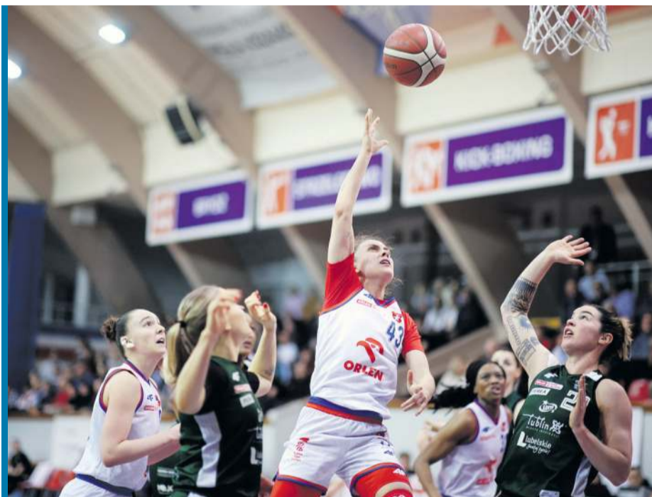
W Krakowie koniec sezonu. Wisła po raz trzeci przegrała z Akademiczkami z Lublina.

Po przerwie Zagłębie zaczęło serią 13:4 i jego