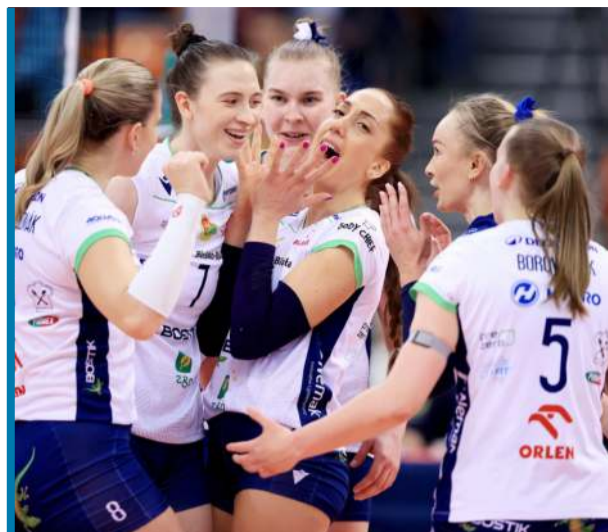
Bielszczanki po ostatniej piłce wreszcie mogły dać upust swoim emocjom.