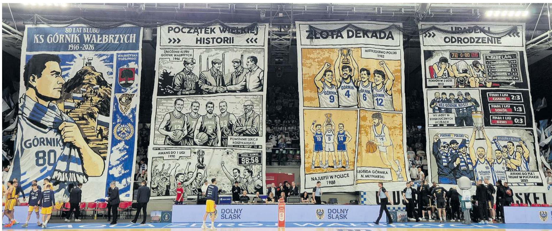
Dawno kibicowska oprawa na meczu koszykówki nie wzbudziła tylu słów uznania, co ta na ostatnim spotkaniu w Wałbrzychu. Kibice spod znaku Wałbrzyskiego Kota przegotowali ją przez ponad miesiąc. Zużyli 70 litrów farby, potrzebowali 280 metrów materiału. Powstał niezwykle komiks, który pokazuje największe sukcesy Górnika, który w tym roku obchodzi 80-lecie, oraz jego legendy, (p)