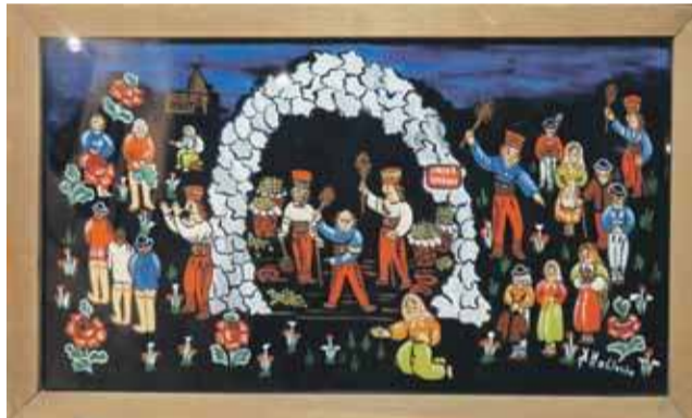
I te odnoszące się do współczesności, jak „Jaskinia zbójców”, czyli...Urząd Skarbowy

ganie liny” czy „Walka o orła” - przypomniła szefowa CKR.