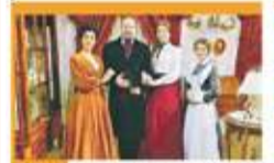
18:45 Akacja 38 - serial, 2018

05:30 M jak miłość - serial, 2022 06:20 Rodzina (nie od) święta - Jak mądrze chwalić dziecko, by go nie zepsuć - magazyn 06:50 Dla niesłyszących - Barwy szczęścia - serial obycz., 2025 07:30 Pytanie na śniadanie - w tym: Serwis Info i Pogoda Flesz 11:35 Słowa od serca 11:45 Dla niesłyszących - Okrasa lamie przepisy - magazyn kulinarny 12:15 Nabożeństwo Kościoła Ewangelicko-Reformowanego w Warszawie - relacja 13:15 Panna młoda - serial 14:05 Va Banque - teleturniej 14:35 Na sygnale - serial fabularny 15:05 La Promesa - pałac tajemnic - serial, Hiszp.