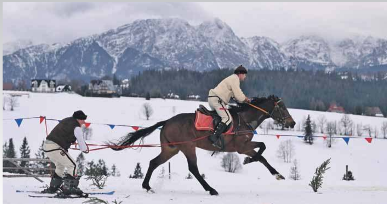
W niedzielę w Zębnie odbyła się Parada Gazdowska. Fotoreportaż - str. 4.