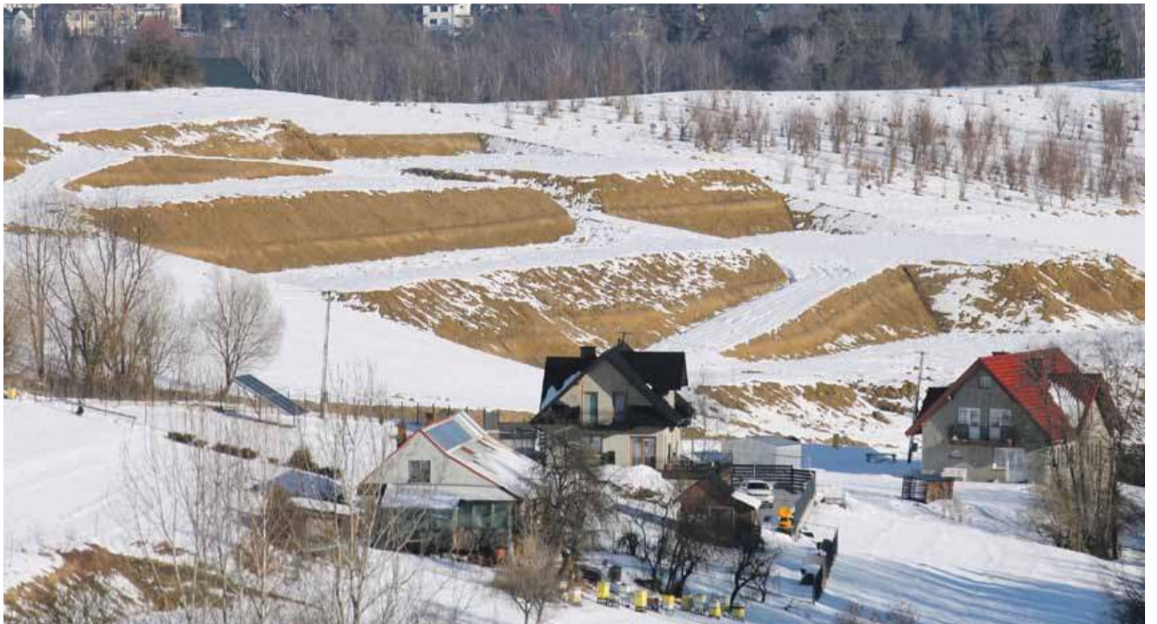
Nadzór Budowlany nie dopatrył się uchybień.

W korespondencji znalazła się sugestia, że działania inwestora naruszają prawo, a wręcz że są próbą „nielegalnego zawłaszczenia terenu”, który od wieków stanowi „zielone płuca Rabki”.