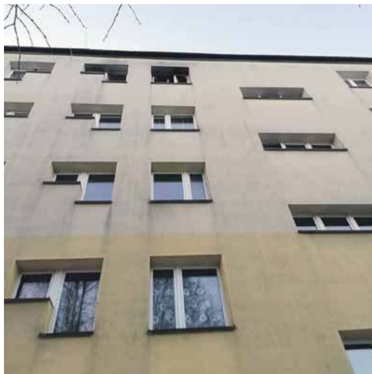
Do pożaru na czwartym piętrze bloku na Osiedlu Orkana w Rabce doszło we wtorek około piątej nad ranem.