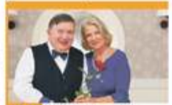
20:15 Na Wspólnej - obycz.

05:35 Uwaga! - program interwencyjny 05:50 Ukryta prawda - program obyczajowy 06:45 Kuchenne rewolucje - program kulinarno-rozrywkowy 07:45 Dzień Dobry TVN - magazyn poranny 11:25 Kuchenne rewolucje - program kulinarno-rozrywkowy 13:35 Ukryta prawda - program obyczajowy 16:50 Detektywi - program kryminalny. Zaginiona 16-letnia Ola. 19:00 Fakty 19:35 Sport 19:40 Kroniki Pucharu Świata w skokach narciarskich 19:45 Pogoda 19:55 Uwaga! - program interwencyjny 20:10 Doradca smaku - program kulinarny