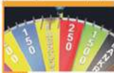
16:00 Kolo fortuny - teleturniej