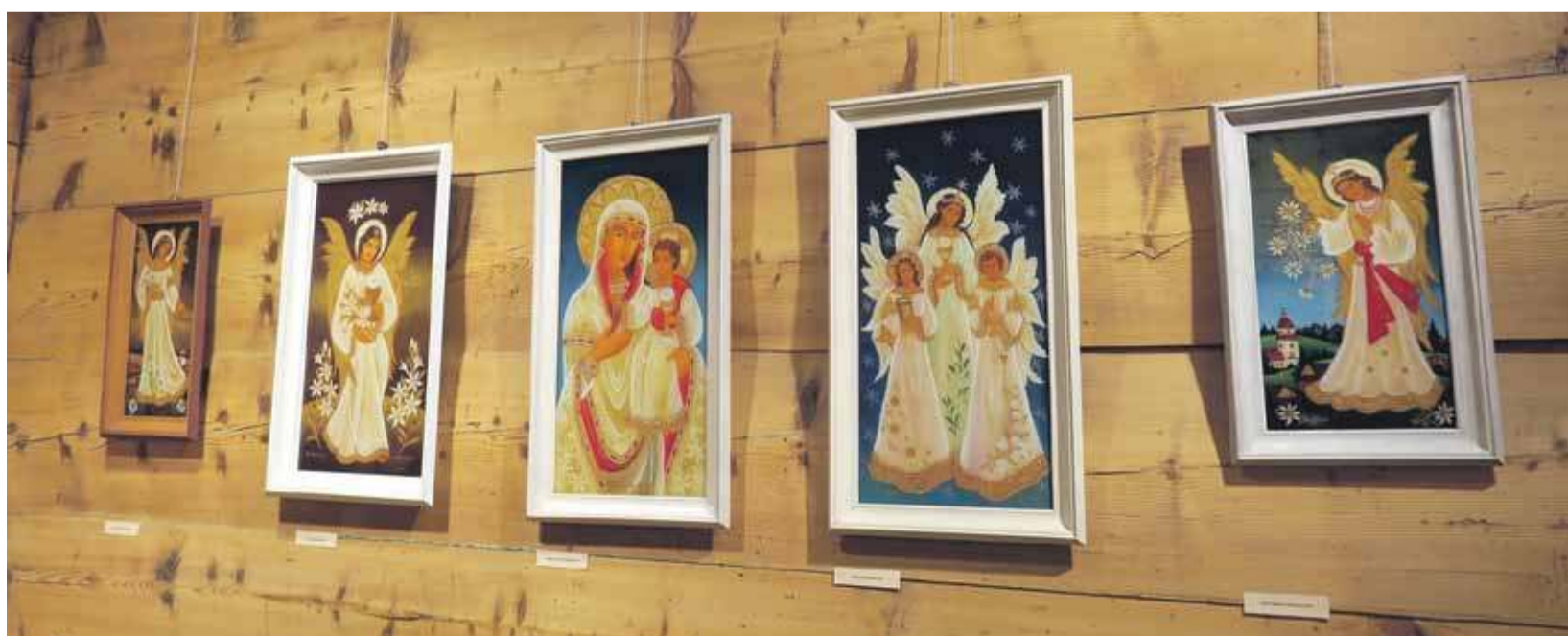
Madonny, anioły i święci dominują w twórczości artystki