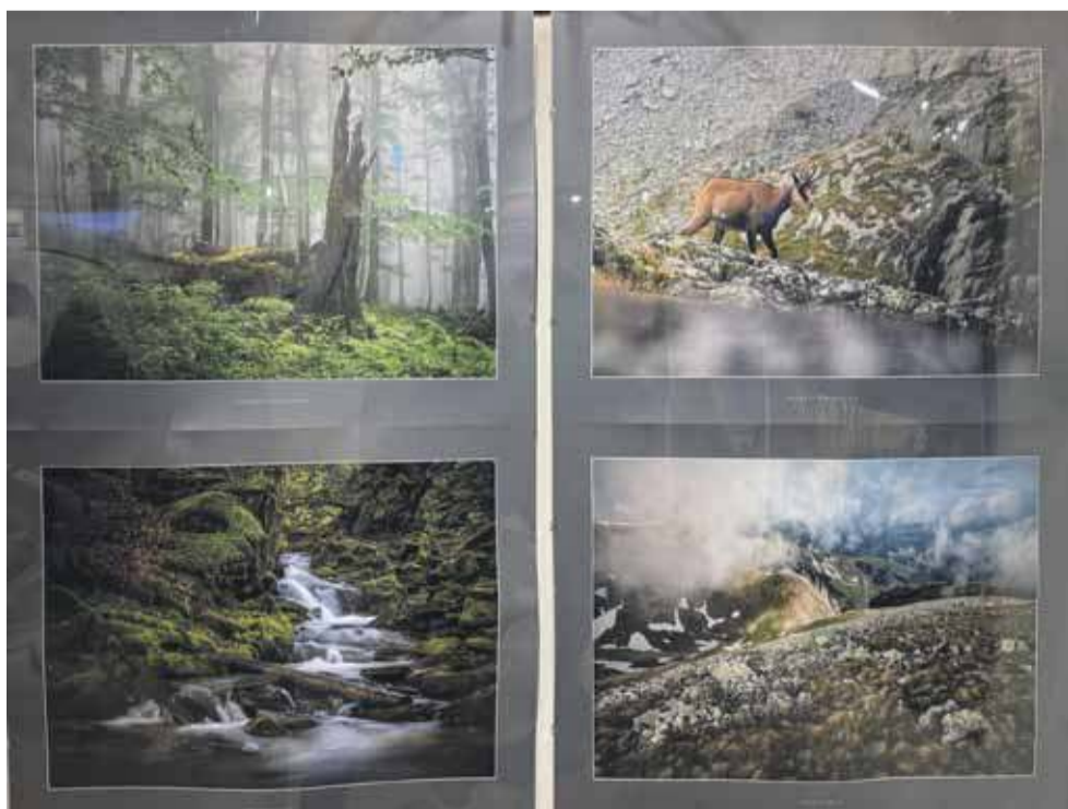
„Barwy świata przyrody 2025” – ekspozycję kilkudziesięciu zapierających dech w piersiach ujęć przyrodniczych stworzyli członkowie Okręgu Krakowskiego Związku Polskich Fotografów Przyrody (ZPPF).