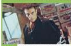
21:55 Za ciosem - akcja, USA, Hongkong, Aruba, 1998

06:00 Nash Bridges - serial krym. Nash i Joe zmuszeni są chronić Mickeya Trippa, kontrowersyjnego didżeja, któremu grozi niebezpieczeństwo. 08:00 Kobra - oddział specjalny - serial kryminalny 10:00 Nie igraj z aniołem - serial obyczajowy 11:55 Wspaniałe stulecie - serial kostiumowy 13:50 Lombard. Życie pod zastaw - paradokument fabularny 15:50 Ranczo - serial kom., Polska 18:00 Lombard. Życie pod zastaw - paradokument fabularny 20:00 Śmiertelna eskorta - akcja, USA, 2023. Dwóch tajnych agentów DEA zostaje zabitych przez kryminalistów z kartelu.