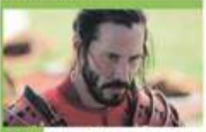
19:55 47 roninów - sens., USA, Wik. Bryt., Jap., 2013. Keanu Reeves jako Kai, wyrzutek, który dołącza do przywódcy 47 roninów - zdegradowanych samurajów. Razem szukają zemsty na zdrańskim władcy, który doprowadził do śmierci ich pana, a ich skazał na wygranie.

06:00 Nowy dzień 08:30 Malanowski i Partnerzy - serial kryminalny 09:30 Trudne sprawy - program obyczajowy 11:35 Gliniarze - serial paradokumentalny 14:40 Dlaczego ja? - serial paradokumentalny 15:50 Wydarzenia - program informacyjny 16:15 Pogoda 16:20 Interwencja - magazyn reporterów 16:30 Na ratunek 112 - serial obyczajowy 17:00 Gliniarze - serial paradokumentalny 18:00 Pierwsza miłość - serial obyczajowy 18:50 Wydarzenia - program informacyjny 19:15 Gość Wydarzeń - rozmowa dnia 19:30 Sport 19:40 Pogoda