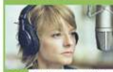
20:00 Odważna - sens., USA, Australia, 2007. Dziennikarka radiowa, Erica wieździe szczęśliwe życie w Nowym Jorku. Pewnego wieczoru oboje z narzeczoną padają ofiarami napadu. Chłopak ginie. Ona cudem przeżywa.

05:20 Ten moment - program obycz. Nikt jednak nie wie, kiedy się wydarzy: ten decydujący moment, który może zmienić całe życie. 05:55 Szkoła - program obycz. 08:45 Ukryta prawda - program obyczajowy 11:55 W-11 Wydział Śledczy - program kryminalny 14:00 Detektywi - program kryminalny. 67-latkę prosi detektywów o pomoc, kobieta została okradzona metodą na wnuczka. 15:00 Sędzia Anna Maria Wesołowska - serial sądowy 16:00 Sąd rodzinny - program sądowy 17:00 Tajemnice miłości - serial paradokumentalny 18:00 Zagadki losu - program obycz. 19:00 Ukryta prawda - program obyczajowy