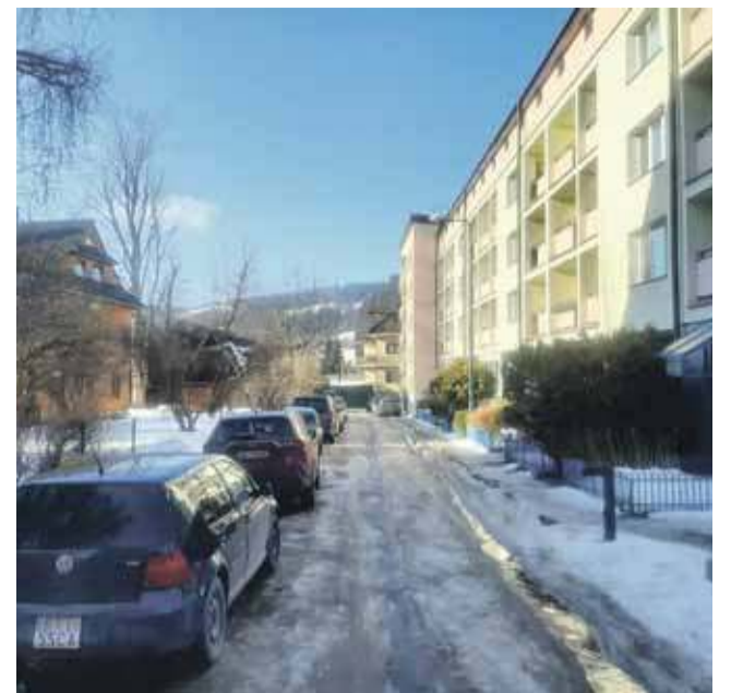
Dziś pod blok nr 5 przy Alejach 3-go Maja wjechać może każdy, od czerwca to się zmieni.

Radni bardzo długo dyskutowali nad propozycją Zbigniewa Szczerby, by udzielić służebność przejazdu do działki z kwaterami, ale zmniejszyć szerokość przejazdu z 4,5 do trzech metrów. Radny sugerował, że z działką graniczy działka, na której stoi kawiarnia „Europejska”. - Wystarczy, że właściciel