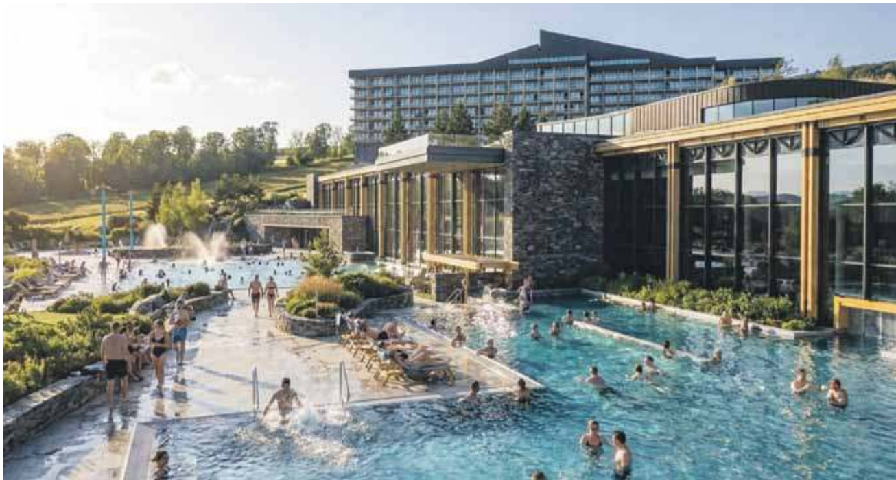
Wizualizacja term na Polanie Szymoszkowej.

- Termy Kasprowy. Budujemy w najbliższym sąsiedztwie naszego hotelu, co też wpływa na to, że bardzo się staramy, żeby to było jak najmniej uciążliwe zarówno dla miasta, jak i dla naszych gości. Na pewno wyróżnikiem będzie to, że będą to termy