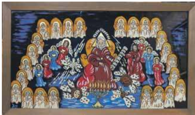
Są też sceny biblijne jak „Apokalipsa wg Św. Jana”

ry. Obserwowała rzeczywistość i bolała nad nią. Stąd między innymi dwa ostatnie, niedokończone obrazy, które pokazujemy na naszej wystawie, zatytułowane: „Spór o Polskę”. I przykazanie piąte: „Nie zabijaj!”. A także wcześniejsze obrazy: „Przecią-