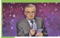
18:50 Jeden z dziesięciu - telet.