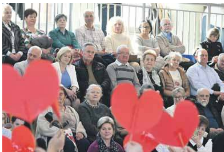
Dziadkowie ze wzruszeniem oglądali występy swoich wnuków.