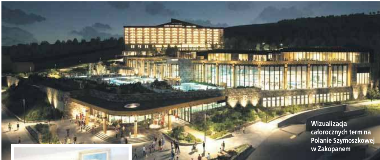
Wizualizacja całorocznych term na Polanie Szymoszkowej w Zakopanem

UKAZUJE SIĘ NA PODHALU, ORAWIE, SPISZU, W PIENINACH, W CHICAGO I TORONTO