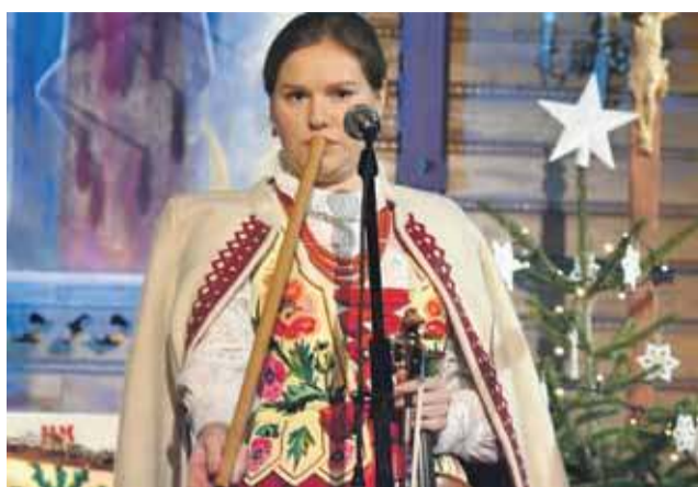
Muzycy nie tylko zaśpiewali, ale i zagrali na tradycyjnych podhalańskich instrumentach.