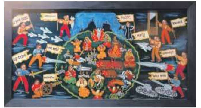
Obraz „Nasze ideały”