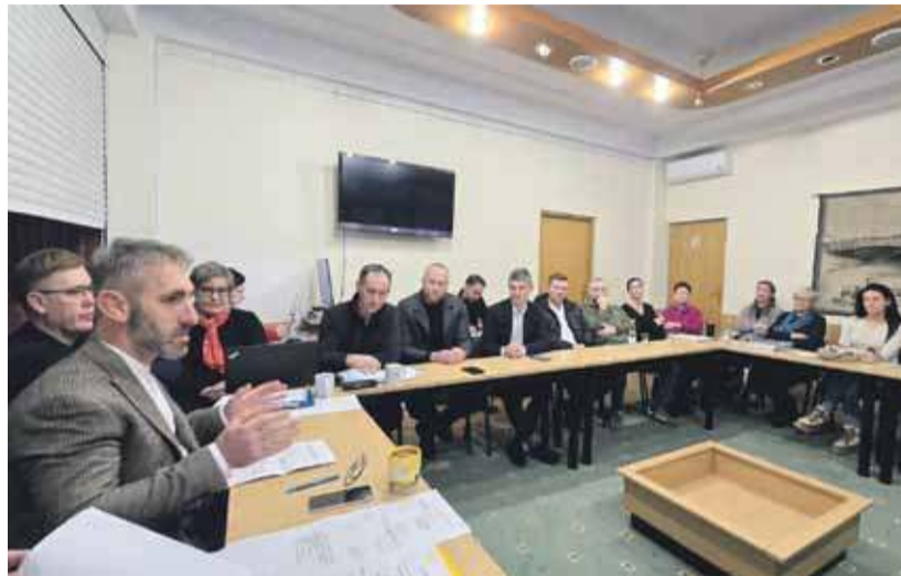
Na obrady komisji urbanistyki przyszło kilkunastu mieszkańców Zakopanego.