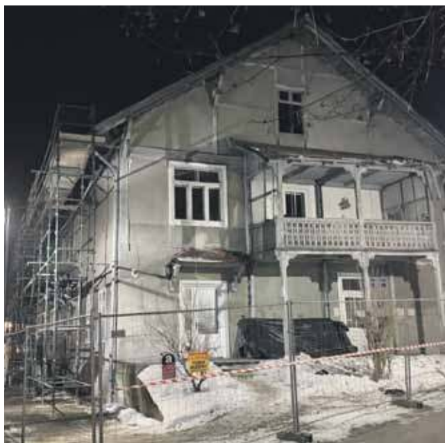
Remont Krzywonia już ruszył.