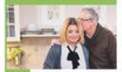
18:10 Klan - telenowela TVP

04:30 Na dobre i na złe - serial 05:30 M jak miłość - serial, 2022 06:20 Mam dobry los - reportaż 06:50 Dla niesłyszących - Barwy szczęścia - serial obycz., 2025 07:30 Pytanie na śniadanie - w tym: Serwis Info i Pogoda Flesz 11:40 Słowa od serca 11:55 Rosół polski - magazyn kulinarny 12:30 Kolo fortuny - teleturniej 13:15 Panna młoda - serial 14:05 Va Banque - teleturniej 14:35 Na sygnale - serial fabularny 15:05 La Promesa - pałac tajemnic - serial, Hiszp. 16:00 Kolo fortuny - teleturniej 16:35 Familiada - teleturniej 17:20 Panna młoda - serial obycz., Turcja, 2024 18:15 Va Banque - teleturniej