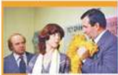
15:15 Miś - kom., Polska, 1980

06:05 Afisz kulturalny ekstra 06:10 Muzyczne poranki 07:05 Tamte lata, tamte dni - Janusz Olejniczak - magazyn 07:40 Podróże z historią - Dwie twarze Galicji - dok., Polska, 2016 08:25 Wydarzenie aktualne 09:00 Przygody psa Cywila - serial przygodowy 09:35 Pograbek - obycz., Polska, 1992 11:05 Mistrz tańca - film TVP, 1968 11:50 Van Gogh. Prawdziwa historia. Odkrycie kolorów - serial dok., Wik. Bryt., 2024 12:45 Od ucha do ucha - Niczego się nie boję - Luce i Skała 13:10 Tamte lata, tamte dni - magazyn 13:50 Krótki dzień pracy - film TVP, 1981