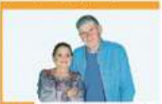
18:00 Pierwsza miłość - serial obyczajowy

06:00 Nowy dzień 08:30 Malanowski i Partnerzy - serial kryminalny. Dreccy poznali się za pośrednictwem biura matrymonialnego. Klient nie dopuszcza myśli, że Marija mogła go opuścić. 09:30 Trudne sprawy - program obyczajowy 11:35 Gliniarze - serial paradokumentalny 14:40 Dlaczego ja? - serial paradokumentalny 15:50 Wydarzenia - program informacyjny 16:15 Pogoda 16:20 Interwencja - magazyn reporterów 16:30 Na ratunek 112 - serial obyczajowy 17:00 Gliniarze - serial paradokumentalny. Policjanci wpadają na trop ośrodnika, w którym przebywają porywacze.