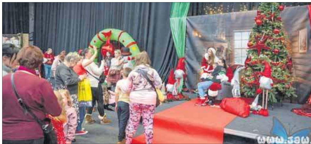
Mikołaj fotografował się z milusińskimi

Początek grudnia to fantastyczny czas, w którym setki Mikołajów wkraczają do akcji, a każdy oczywista najprawdziwszy i święty. Zgodnie z tą niepisaną regułą Mikołaj, święty oczywista, pojawił się w Hali MCKiS-u w sobotnie popołudnie 6 grudnia. Milusińscy zachwyceni i podekscytowani, dorosli w nie mniej świetnych nastrojach. I choć zdaje się, że było podobnie jak rok temu, milusińscy, jakby zapomnieli, że to już widzieli, bawili się doskonale. Mikołaj, święty oczywista, miał trudne zadanie – rozdawał prezenty i fotografował się z maluchami, które wgapiły się w niego niczym nomen omen w święty obrazek.