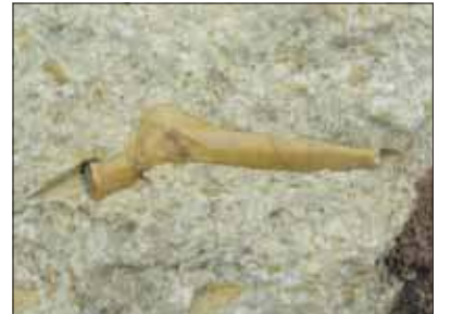
Kość gada w wapieniu krynowidowym

Już wkrótce, bo w piątek 12 grudnia w Muzeum w Chrzanowie odbędzie się kolejna sesja naukowa. Będę tam opowiadał o okazach geologicznych pozyskanych podczas budowy osiedla pomiędzy ulicami Chełmońskiego i Obrońców Poczty Gdańskiej na wschód od ulicy Szpitalnej po przecinającą obszar linię wysokiego napięcia. Teraz trochę się zmieniło, ponieważ pojawiła się nowa, jeszcze wyraźniejsza granica. To ulica księdza Piotra Grocholickiego.