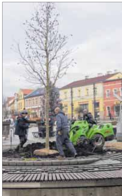
Ambrowiec już na swoim miejscu