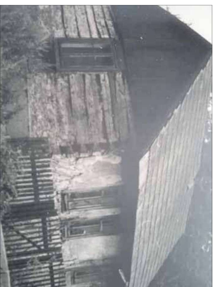
Jedna ze starych jaworznińskich chatup (MMU)

Zacząć wypada od tytułowego „Górnego Jaworzna”. Stormuowanie to należy traktować z pewnym przyzwyczajeniem oka. Nie jest to bowiem nazwa oficjalna czy nawet potoczna. Użyta zostało przede wszystkim po to, by umiejscowić obszar, o którym jest tutaj mowa. Jako „Górne Jaworzno” rozumiany tutaj bowiem teren ścisłego centrum naszego miasta, usytuowany powyżej górnej pierzei jaworznińskiego rynku. A dla czego koncentrujemy się na tym właśnie obszarze? A no dlatego, że właśnie w tamtym rejonie przetrwało najwięcej reliktów starej zabudowy Jaworzna, pochodzącej z przełomu XIX i XX wieku.