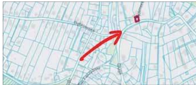
Działka, na której miałby stanąć maszt telefonii komórkowej w dzielnicy Dąbrowa Narodowa.

Wniosek o pozwolenie na budowę wpłynął do urzędu w Jaworznie 7 listopada. Inwestor, oprócz wybudowania masztu, przewiduje także wykonanie zasilania oraz infrastruktury pod prowadzenie przewodów. Budowa stacji bazowej telefonii komórkowej Play numer JAW7102C wraz z kablówką linią zasilającą oraz kanalizacją kablową – tak brzmi zamierzenie