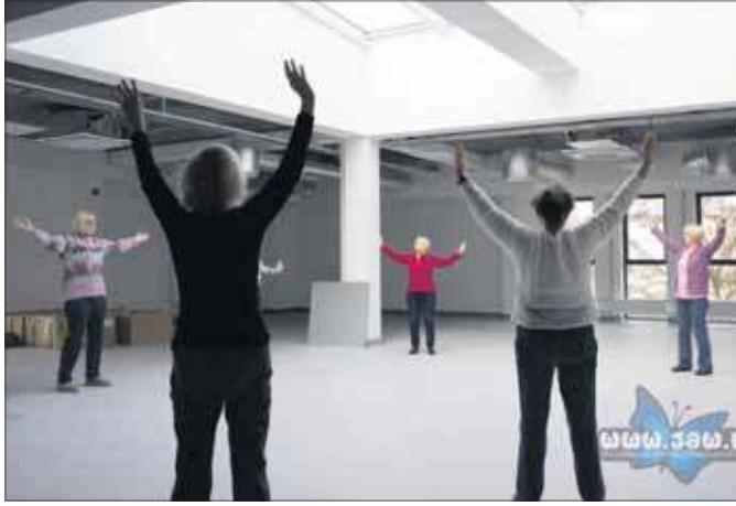
Cotygodniowe ćwiczenia Tai Chi w klubie To i Owo w Jaworznie

Uczestniczki skupiają się na wyciszeniu, by poprawić samopoczucie zarówno ciała, jak i umysłu. Spotkanie rozpoczynają od rozgrzewki, która ma przygotować sta-