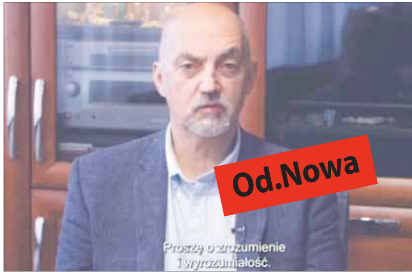
Screen z ożędzia na temat podwyżki opłat z dnia 29 listopada

Mieszkańcy bloków i budynków wielorodzinnych mieli być rozliczani