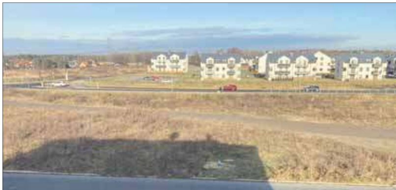
Miejsce, gdzie ma powstać sklep Dino przy ulicy Wachlowskiego w Jaworznie.

Spółka Dino Polska złożyła wnioski o pozwolenie na budowę dwóch sklepów na terenie Jaworzna. Jedna z lokalizacji to działka przy ulicy Wachlowskiego, a druga to teren w Byszynie w pobliżu ulicy Pietrusowej.