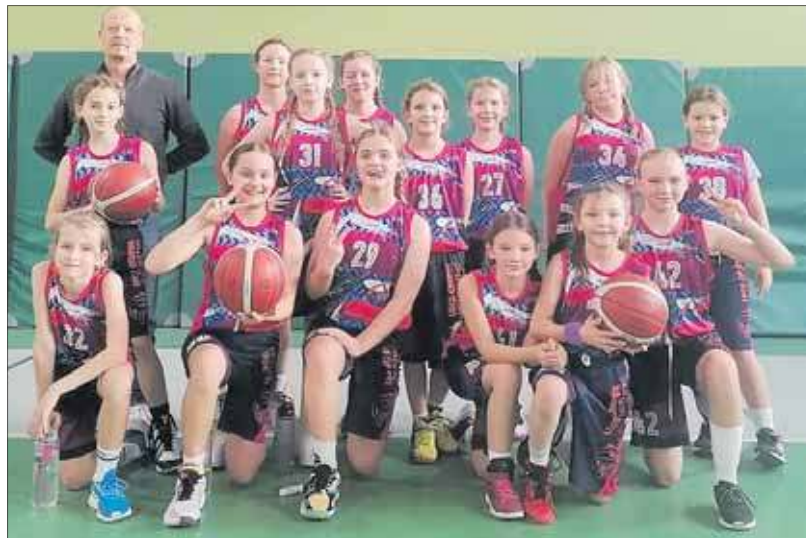
Koszykarki UKS Orzeł Jaworzno

UKS Orzeł Jaworzno – TRS Siła Ustroń 39:26 (14:2; 0:9; 10:11; 15:4) UKS Orzeł Jaworzno – STELA Cieszyn 59:31 (28:2; 12:0; 10:14; 9:15)