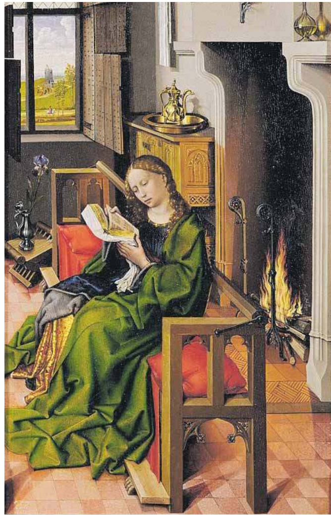
Św. Barbara

Otóż św. Barbara, a właściwie jej historyczność jest podawana w wątpliwość. I chociaż jej kult w społecznościach lokalnych jest rozpowszechniony i utwierdzony, to jednak św. Barbara najprawdopodobniej nie istniała w ogóle. Dlaczego pojawiła się w późnych, średniowiecznych przekazach i jaki był tego cel? Trudno to jednoznacz-