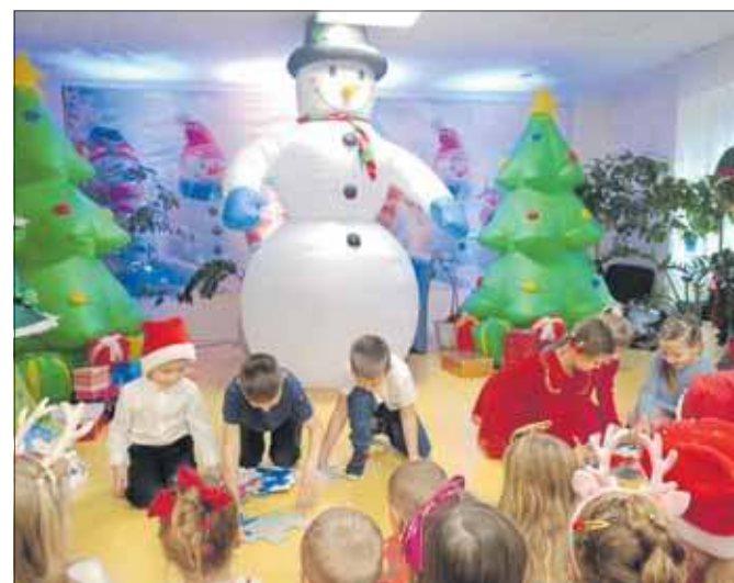
Dzieci chętnie brały udział w konkursach

Oczywiście św. Mikołaj nie zapomniał o dzieciach. Z każdym z nich zrobił sobie pamiątkową fotografię. Wszystkie przedszkolaki przez cały rok były grzecz-