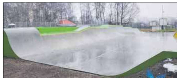
Stan prac przy budowie skateparku w parku na Podłężu na 2 grudnia 2025 roku

– To nie tylko nowe miejsca do aktywnego spędzania czasu, ale także ogromna szansa dla młodzieży i dzieci na rozwija-