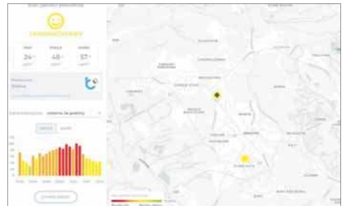
Jaka jest jakość powietrza w Jaworznie? W jednej z aplikacji widoczne są dwa czujniki, które mają zbierać informacje o zanieczyszczeniu powietrza w mieście. Zrzut ekranu wykonany 5 grudnia 2025 roku

Szanowni Państwo, Od wielu miesięcy mieszkańcy Jaworzna oddychają powietrzem, które regularnie i drastycznie przekracza dopuszczalne normy pyłów zawieszonych (PM10, PM2.5). To nie jest tylko dyskomfort – to cicha trucizna, która każdego dnia wnika do naszych płuc i krwiobiegu. Badania naukowe jednoznacznie pokazują, że smog to nie tylko kaszel czy podrażnienie gardła. Pyły PM2.5 są tak drobne, że przenikają