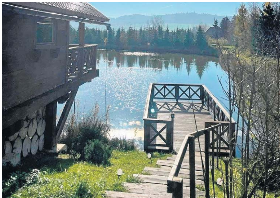
Przystań dwukrotnie sięgała po laury plebiscytu Wielkie Odkrywanie Dolnego Śląska.

„Agroturystyka Misiówka powstała w 2014 roku i od początku głównym zamysłem gospodarzy była chęć pokazania i podzielenia się z innymi pięknem tej uroczo położonej wsi. Gospodarze wybudowali w pełni funkcjonalny dom z 5 dwuosobowymi pokojami, każdy wyposażony w łazienkę i telewizor. Istnieje łącznie 10-12 miejsc noclegowych. W obiekcie jest również możliwość zorganizowania imprezy, spotkania na 30 osób” - czytamy na archiwalnej stronie staro-