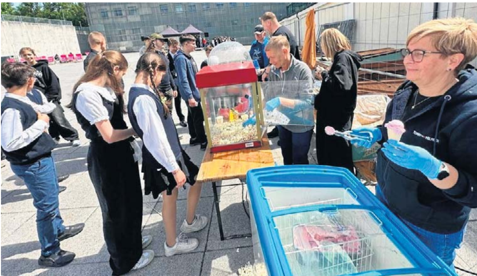
Wolontaryjne zaangażowane na rzecz potrzebujących miało tego dnia... słodki smak.