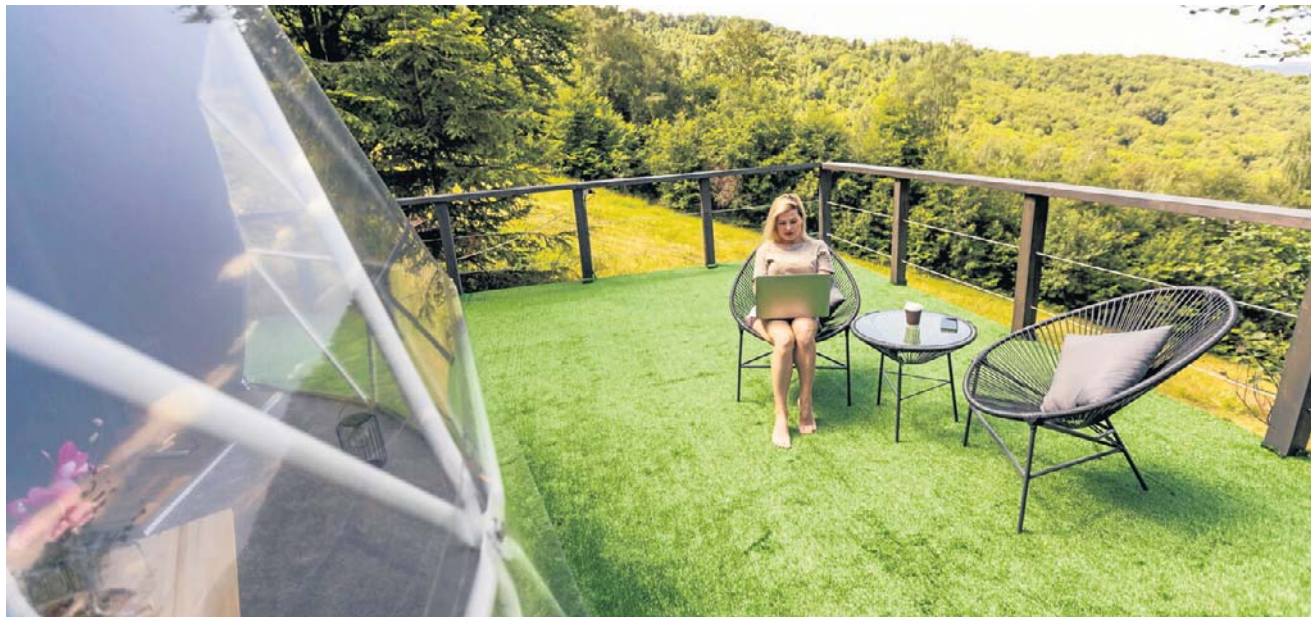
Całkowite porzucenie cywilizacji i komfortu dla wielu urlopowiczów bywa trudne. Szukają więc miejsc, gdzie jest kontakt z naturą, ale także z cyfrowym światem.

- Kto do nas przyjeżdża? Przede wszystkim mieszkańcy dużych miast. Mamy gości z Warszawy, Łodzi, Poznania, Torunia, Gdańska. Wiekowo? Jest różnie. Glampy dla par wybierają najczęściej osoby ma-