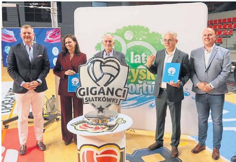
20. edycja Gigantów Siatkówki została zapowiedziana w wałbrzyskim Aqua Zdroju.

- Ten turniej będziemy sturali się umiejscowić w kalendarzu rozwoju siatkówki zarówno męskiej, jak i żeńskiej w Wałbrzychu. Na poziomie, do którego chcielibyśmy wrócić - mó-