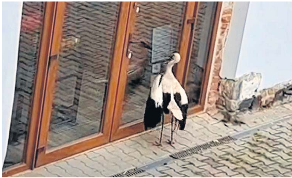
Bocian od miesiąca przylatuje do Dyniowego Zakątka i stuka dziobem w szklane drzwi.

Bocian od miesiąca przylatuje do Dyniowego Zakątka