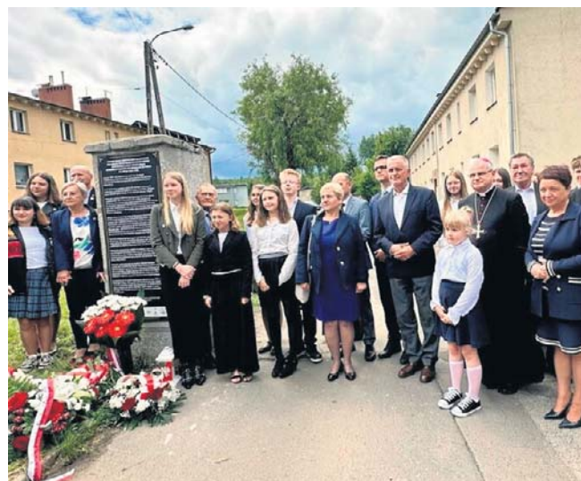
Odślonienie tablicy, upamiętniającej więźniów podobozu Gross-Rosen przy ul. Królewieckiej w Wałbrzychu.

Po wojnie, w latach 1945-1959, na terenie obozu znajdowały się koszary Wojska Polskiego dla środowisk represjonowanych przez władze komunistyczne i pracujących przymusowo w kopalniach. Od 1959 roku obiekty były przeznaczone na cele mieszkaniowe. ©©