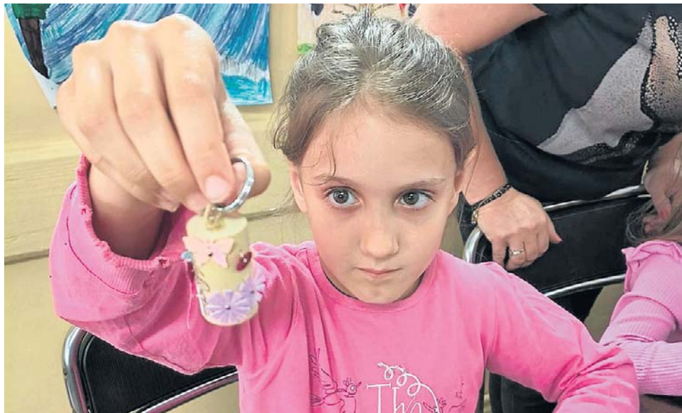
Podczas zajęć w RWS Biały Kamień uczono dzieci tworzenia ekologicznych breloczków.