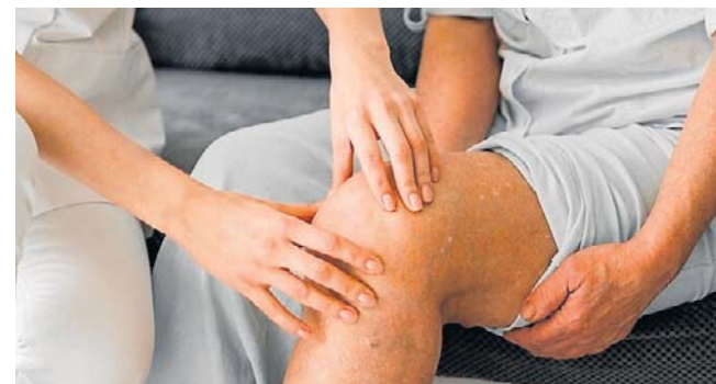
Na uciążliwy ból kolana skarżą się także osoby, uprawiające niektóre dyscypliny sportowe.

Narażone są także kobiety intensywnie wykonujące prace domowe oraz osoby aktywne fizycznie. Zwłaszcza sportowcy, m.in. tenisisci i piłkarze, u których stawy kolonowe są stale poddawane dużym obciążeniami. ©