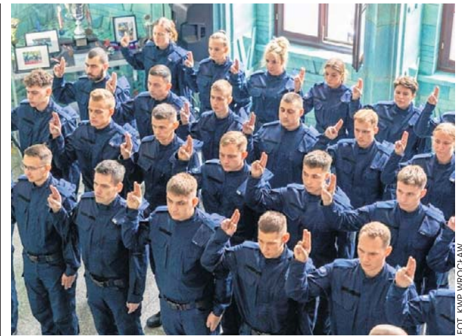
FOT. KMP WROCLAW

Policja ukarała mężczyznę za zakłócanie porządku publicznego. Za taki wybryk sprawcy nieobyczajnego zachowania grozi kara aresztu, ograniczenia wolności albo grzywny w wysokości od 20 zł do 5 tys. zł. Chuligański wybryk sparaliżował pracę poczty na około godzinę. ©©