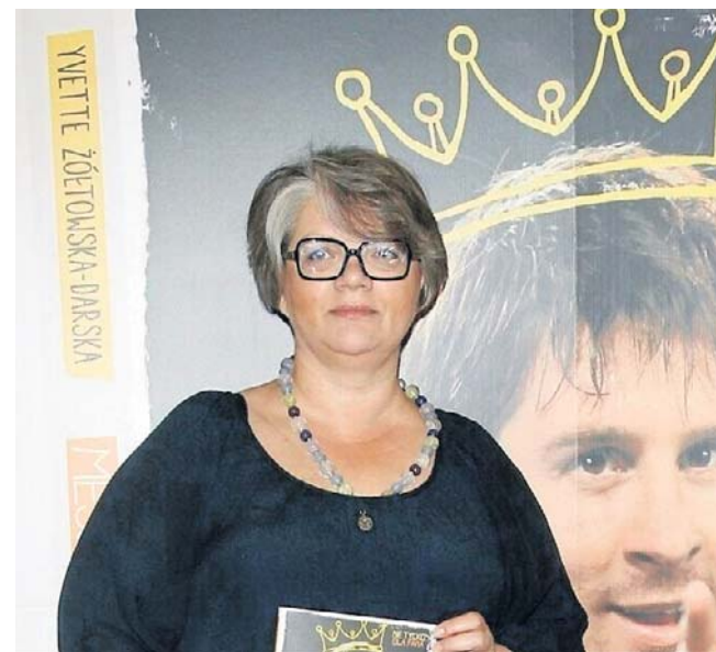
Popularna w mediach psycholożka przyznała, że cierpi na dolegliwość, która często występuje u działkowców.

Najważniejsze jest dopasowanie miejsca do konkretnej diagnozy i możliwości organizmu, a nie tylko jego popularności czy lokalizacji.