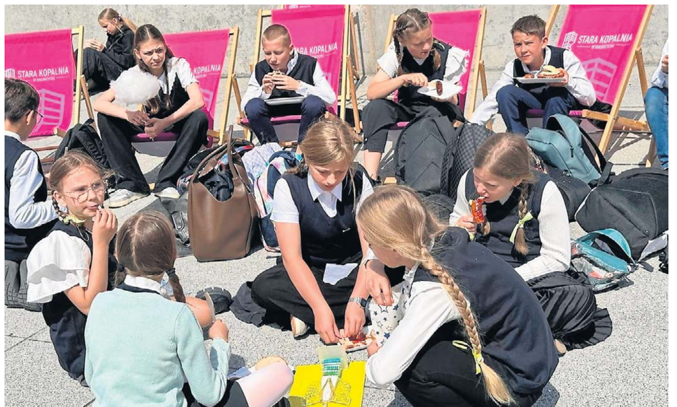
W Starej Kopalni spotkali się uczniowie - reprezentanci szkół, którzy mocno angażują się w wolontariat w mieście.