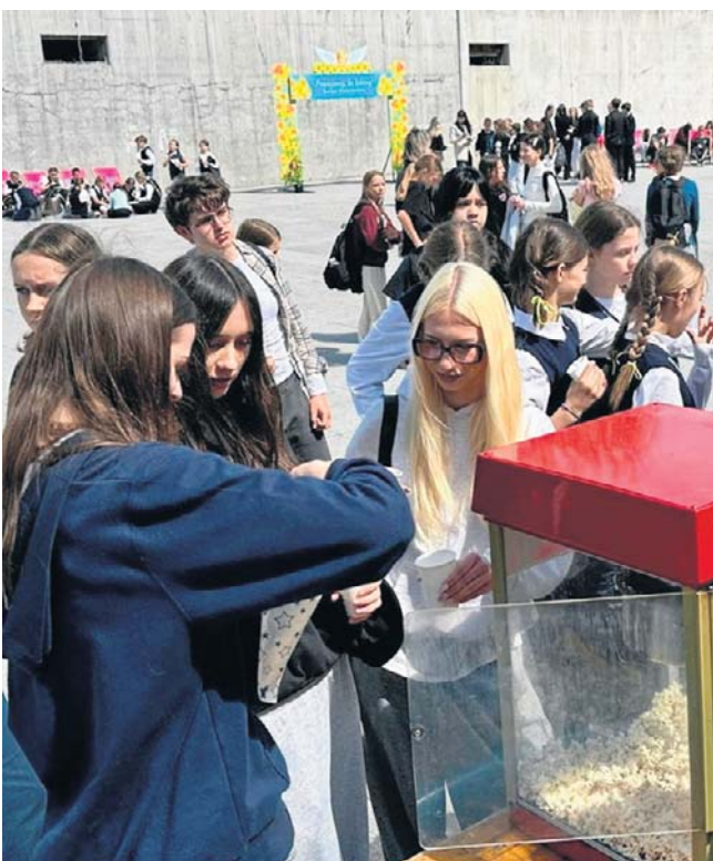
Wielu wolontariuszom bliskie są żonkilowe, „żółte koszulki”, w których kwestują na rzecz hospicjum w Wałbrzychu.