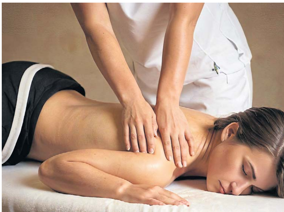
Przy wyborze sanatorium warto sprawdzić, jaką bazą zabiegową dysponuje.

rzeń ortopedycznych i reumatologicznych oraz bogatą bazą zabiegową.