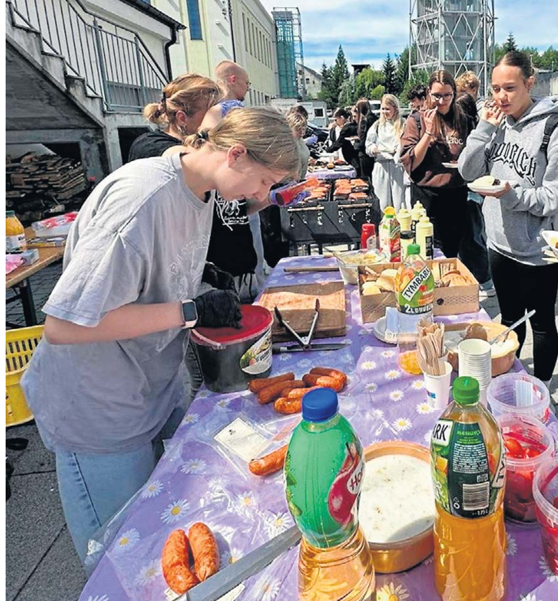
Opiekunowie Klubów „Ośmiu” Młodzieżowego Wolontariatu oraz Urząd Miasta Wałbrzyska po