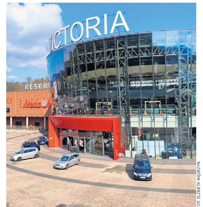
Tak prezentuje się obecnie rotunda Galerii Victoria. Nowy proces oznakowania zakończy się latem bieżącego roku.

Po 15 latach od otwarcia pora na małe poprawki, by - personalizując - „nastoletnia” galeria weszła do dorosłości w dobrej formie. Oczywiście prace konserwacyjne i bieżące naprawy są prowadzone regularnie. Trwa też ciągła praca - działania, skierowane przeciwko wandalom i graffitiarzom, a także uświadamianie młodzieży dobrych praktyk zachowania w przestrzeni publicznej. Przypominają o tym spoty, emitowanie na terenie centrum.