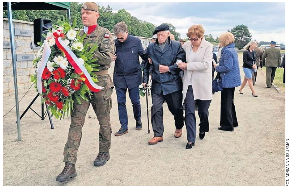
Obchody Dnia Pamięci Ofiar w Gross-Rosen (Rogoźnicy) połączyły wiele środowisk.