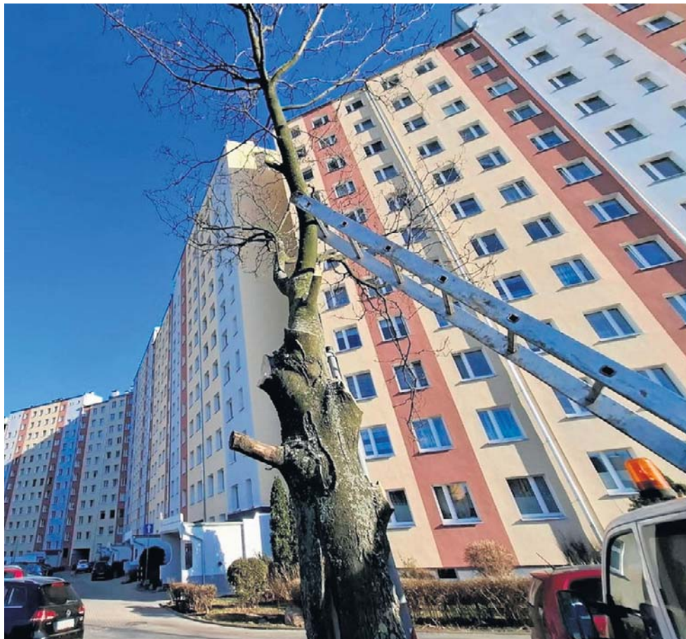
Członkowie SM Podzamcze cieszą się z zakończonych robót, ale martwią ich rozliczeniem.

Ograniczenie konkurencji nastąpiło poprzez sformułowanie warunku udziału w postępowaniu, zawężającego możliwość złożenia oferty do wykonawców, u których procentowy wskaźnik zatrudnienia osób, należących do jednej lub więcej kategorii osób społecznie marginalizowanych jest nie mniejszy niż 30 procent. Sam fakt wprowadzenia takiego warunku nie był zabroniony. Niemniej zostały wybrane oferty wykonawców, którzy nie speł-