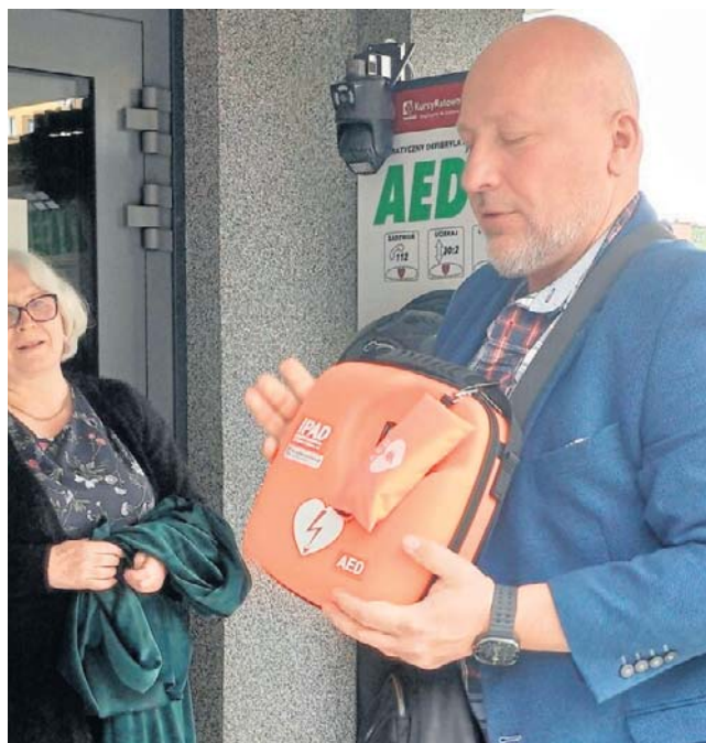
Stacja ratownicza przy Publicznej Szkole Podstawowej nr 26 w Wałbrzychu już działa. Oby służyła potrzebującym!

Jak zaznaczył, celem przedsięwzięcia było połączenie edu-