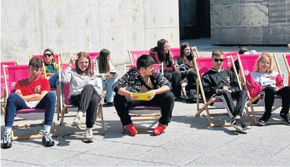
Spotkali się w Starej Kopalni, aby uhonorować dzieci i młodzież za ich społeczną pracę.