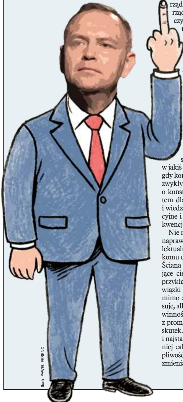
ILUSTRACJA: PAVEL FERENC