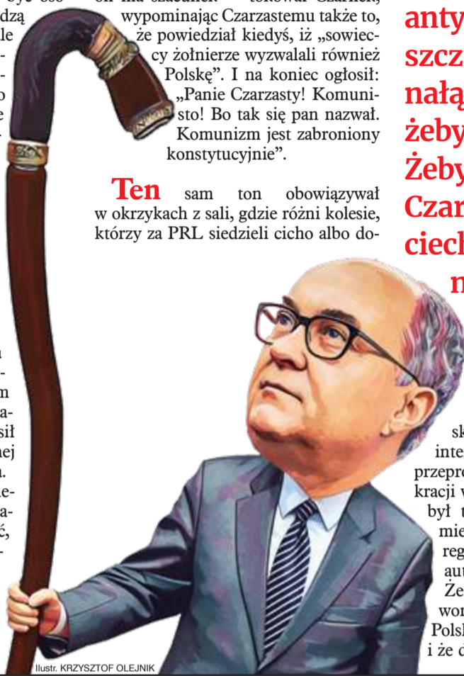
Ilustr. KRZYSZTOF OLEJNIK

– który nie tylko ocalił Polskę przed hekatombą radzieckiej interwencji w 1981 r., ale także przeprowadził ją pokojowo do demokracji w 1989. Ze „czterech śpiących” był to odłany ze zdobycznej niemieckiej amunicji pomnik, do którego pozowali żołnierze frontowi, autentyczni zdobywcy Berlina. Ze 600 tys. żołnierzy Armii Czerwonej zginęło na terenach obecnej Polski w walkach z hitlerowcami – i że dzięki nim powstał kraj, w któ-