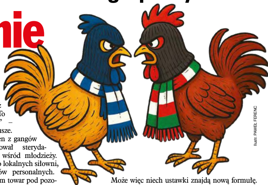
ILLUSTRACJA: PAWEŁ FERENC

Mierząc poziom cywilizacji liczbą ustawionych bójek, Polsce bliżej byłoby dziś do Somalii niż Szwajcarii. Choć na pierwszy rzut oka wszystko wygląda jak kibicowska tradycja – szalik, barwy, zakaz stadionowy – w rzeczywistości mamy do czynienia z gangreną, która w dziwny sposób jest pielęgnowana przez państwo. Bo ustawki pseudokibiców to nie wybrzek sfrustrowanych nastolatków, tylko forma rekrutacji do zorganizowanej przestępczości. A policja, zamiast coś z tym fantem zrobić, wciąż stosuje uniki, jakby miała nadzieję, że to samo się rozwiąże.