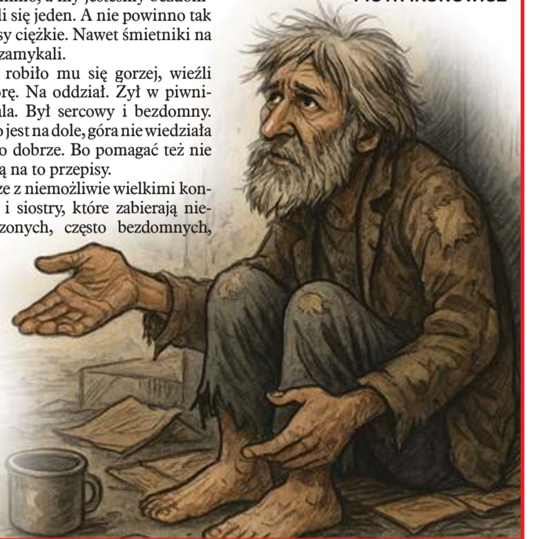
ILUSTR. PAWEŁ FERENC