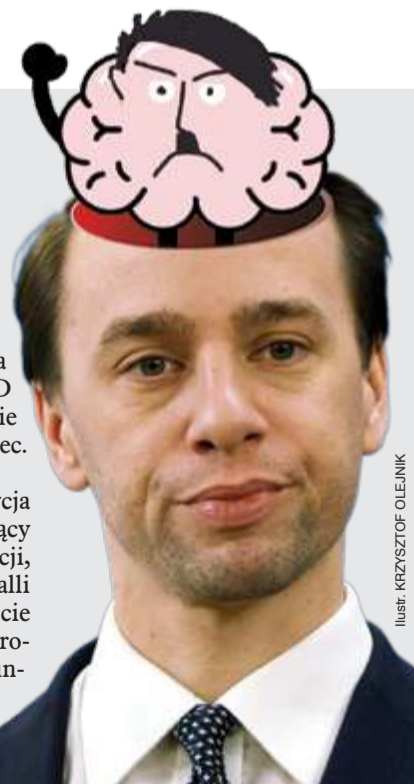
ILUSTRACJA: KRZYSZTOF OLEJNIK

Nie wiemy, które zjawisko jest gorsze: antypolski neofaszysta z Niemiec czy durny narodowiec z Polski.