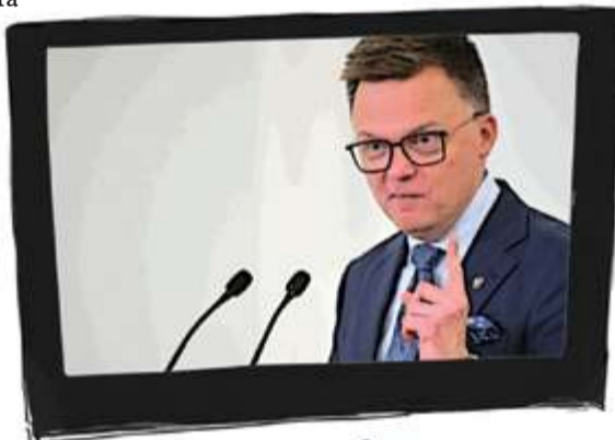
Ilustr. PAWEŁ FERENC

„Dołożyłem wszelkich starań, aby deeskalować sytuację w Sejmie i sprawić, by stał się on miejscem merytorycznych sporów, debat i rozmów na poważne tematy. Bardziej agorą, na której rozstrzygamy istotne dla naszej wspólnoty kwestie, niż areną walki czy teatrem politycznym” – pisze eksmarszałek we wstępnym esej „Sejmu bez barierek”. To chyba najmniej wiarygodna przechwałka, choć niekoniecznie jest to zarzut.