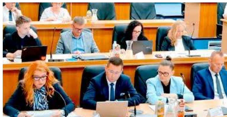
Sesja odbyła się w środę

Jako ciekawostkę można również dodać, że w trakcie sesji poruszony został temat goleniowskiego spichlerza. Ów zabytek już od wielu lat znajduje się w rękach prywatnych. Wielu mieszkańców miasta wskazywało na to, że on niszczeje, jest niewykorzystany i zwyczajnie szkoda tak cenne-