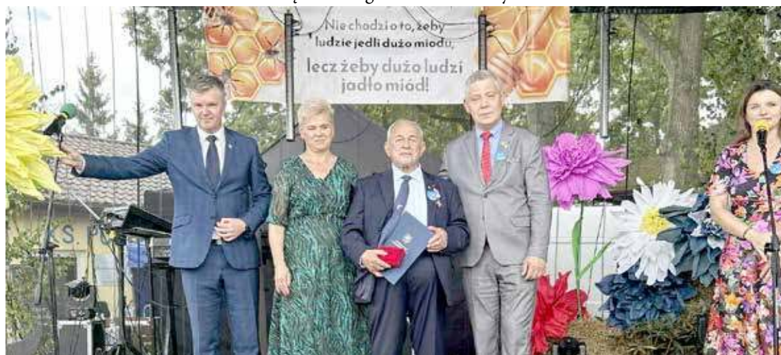
Wręczenie odznaczenia odbyło się podczas dożynek