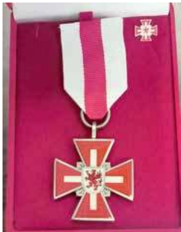
Srebrna odznaka Gryfa Zachodniopomorskiego

łączyć pokolenia, pokazując jak ważna jest troska o nasz mały zakątek Polski.