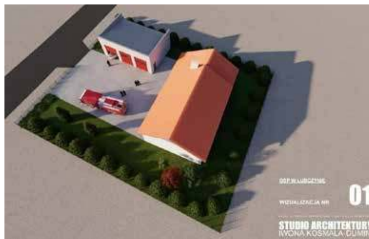
Wizualizacja projektu - rzut z góry