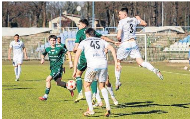
Hutnik w pięknym stylu pokonał u siebie ekipę z Kalisza