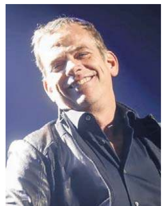
Garou wystąpi we wrześniu w Krakowie

To z tego przedstawienia pochodzi duet z Celine Dion, który zaowocował debiutancką płytą w 2000 roku, na której znalazły się takie hity jak „Gitan”. Od tego czasu kanadyjski piosenkarz cieszy się niesłabnącą sympatią fanów na całym świecie.