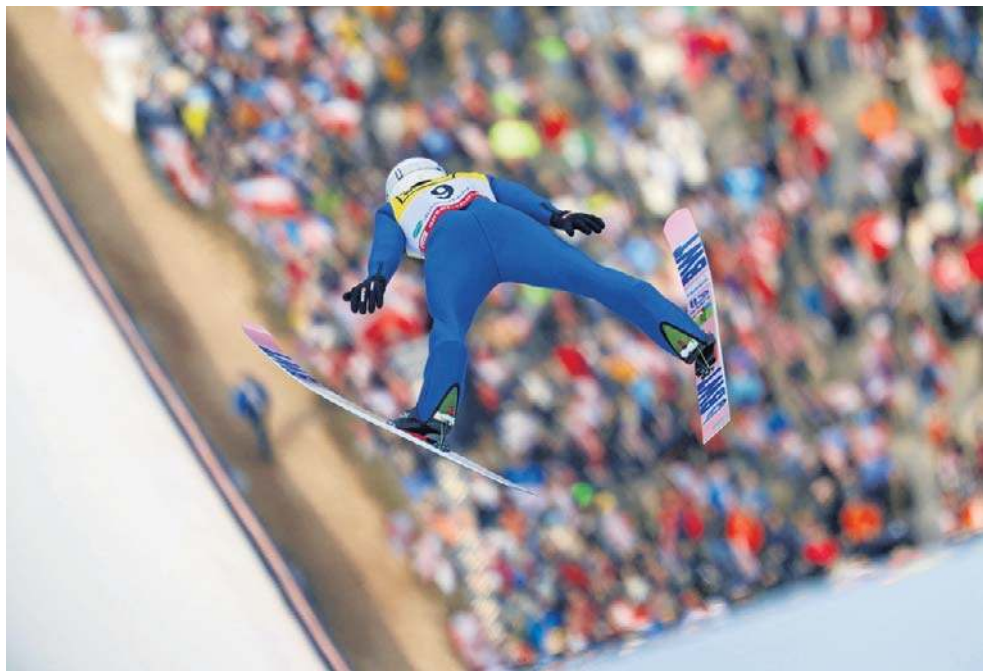
Piotr Żyła próbował ratować honor polskich skoczków na mamucim obiekcie Kulm

Występujący w konkursie Piotr Żyła po słabszym pierwszym skoku miał nikłe szanse na awans do drugiej serii (ostatnie miejsce było 36.). Lepiej spisali się