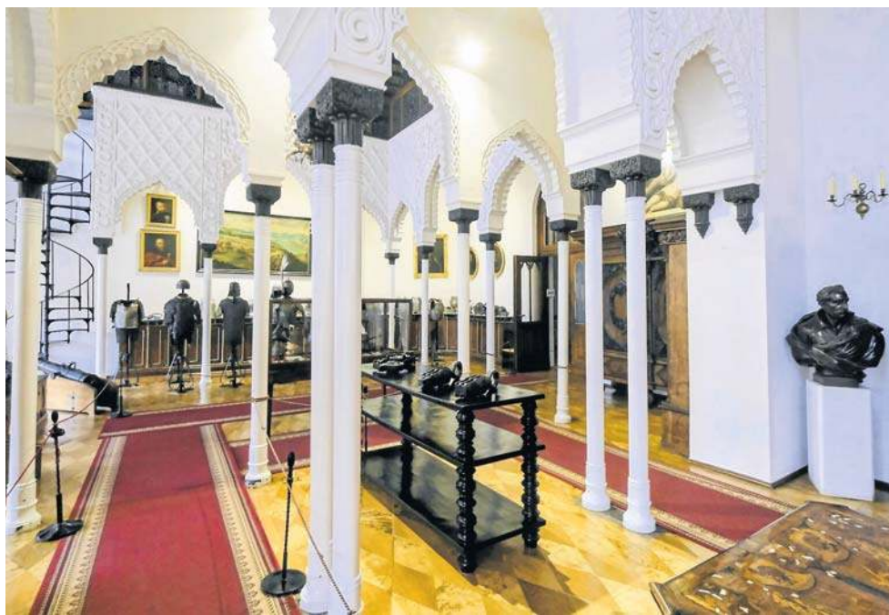
Sala Mauretańska pełni dziś funkcję biblioteczno-muzealną. Tu znaleźć można XVII-wieczną zbroję husarską z jednym skrzydłem

Była pionierką reform społecznych. Gdy objęła dobra kórnickie, miasteczko liczyło około 200 mieszkańców. Sprowadziła osadników z Niemiec, czyli oledrów, zamieniła pańszczyznę na czynsz i zapewniła swobodę wyznaniową protestantom, ka-