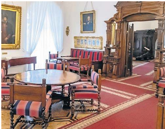
W salonie głównym uwagę przykuwa stół, który zamówił Tytus Działyński. Powstał z szesnastu różnych gatunków drewna

tolikom i Żydom. W XVIII-wiecznym Kórniku obok siebie żyły więc społeczności różnych kultur i religii. Założyła również straż ogniową oraz stanowczo sprzeciwiała się procesom o czary. Zapowiadała, że każdy, kto bezpodstawnie oskarży kogoś o czary, najpierw zapłaci karę, a jeśli to nie pomoże - trafi do aresztu. Było to podejście niezwykle nowoczesne jak na owe czasy - chwali nasza rozmówczyni.