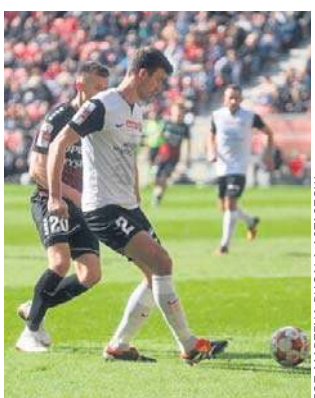
Piłkarze Puszczy zagraли bardzo dobre spotkanie

Bramki: 1:0 Krawczyk 24, 1:1 Gjoni 40, 1:2 Mroziński 85. GKS: Mądryk - Teclaw, Łasicki (64), Da Silva - Lipkowski, Bieroriński, Szpakowski (71 Stefansson), Jankowski (71 Barański) - Krawczyk (71 Listkowski), Rumin (81 Łysiak) - Welniak (71 Keiblinger). Puszcza: Perchel - Barczak, Piekarski, Kasollik, Mroziński - Iwao (80 Simon), Hajda (90+4 Stec), Nascimento, Walski (80 Korczakowski), Cholewiak (90+4 M. Stępień) - Gjoni (89 Śmigłowski). Sędziował: Damian Krumplewski (Miragowo).