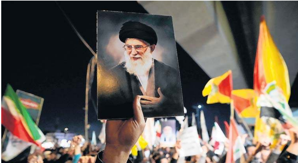
Tysiące osób wyszły na ulice po ogłoszeniu informacji o śmierci najwyższego przywódcy duchowo-politycznego Iranu, ajatollaha Alego Chameneia

Proces przekazania władzy w Iranie po śmierci ajatollaha Alego Chameneia rozpoczął się wczoraj. - Wkrótce zostanie sformowana tymczasowa rada przywódcza. Do czasu wyboru przyszłego przywódcy kraju odpowiedzialność przejmą prezydent Masoud Pezeshkian, szef władzy sądowej Golamhosejn Mohseni Edżei oraz jeden z prawników Rady Strażników - oznajmił sekretarz irańskiej Najwyższej Rady Bezpieczeń-