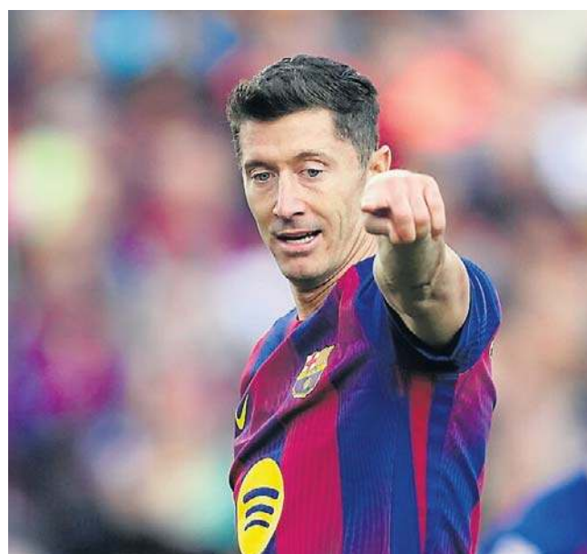
Kapitan reprezentacji Polski Robert Lewandowski zdobył jedenastą bramkę w obecnym sezonie La Ligi

Napastnik Liverpoolu Mohamed Salah nie strzelił gola w żadnych z ostatnich 10 meczów w Premier League.