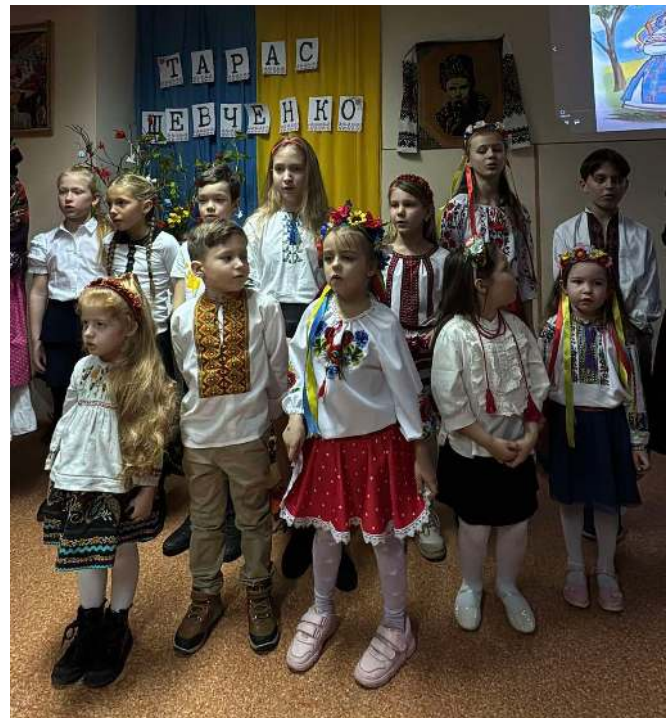
Діти з Ельблонга під час виступу.