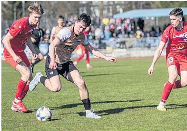
Piłkarze Gwardii (czerwone stroje) na swoim boisku przegrali z Bałtykiem 0:1, a w rewanżu 1:2

Po przerwie znów ataki Bałtyku, udokumentowane w 59. minucie bramką Miłosa Stępnika. Od tego momentu - Gwardia naciskała, by wyrównać, ale Bałtyk utrzymał skromne pro-