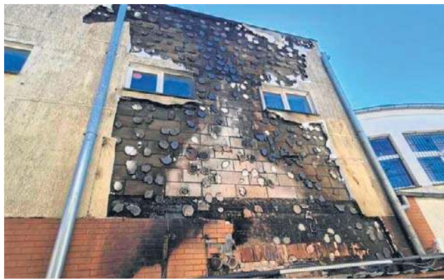
Spalona elewacja budynku przy ul. 1 Maja w Białogardzie

Policjanci z Białogardu zatrzymali 15-latka, który w nocy z 1 na 2 kwietnia podpałił elewację budynku oraz wiatę śmietnikową przy ul. 1 Maja w Białogardzie. Straty materialne powstałe w wyniku tego zdarzenia wyniosły 266 tys. złotych.