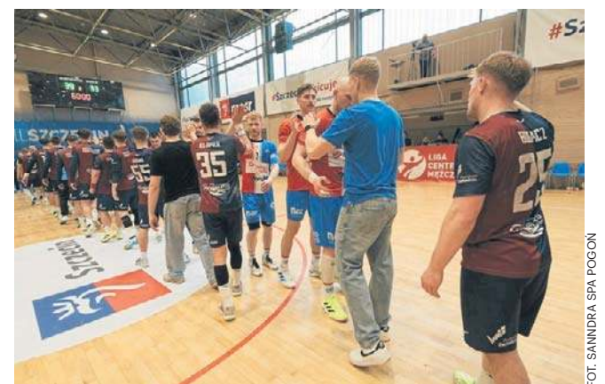
Po zakończeniu sportowej rywalizacji w derbach zespoły podziękowały sobie za walkę