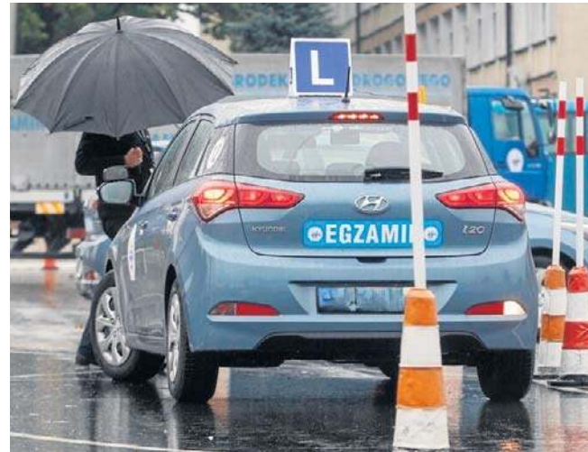
Resort infrastruktury chce, by zmiany w systemie egzaminowania weszły w życie jeszcze w tym roku.

Zdawalność liczona wśród zdających we wszystkich kategoriach (przy pierwszym podej-