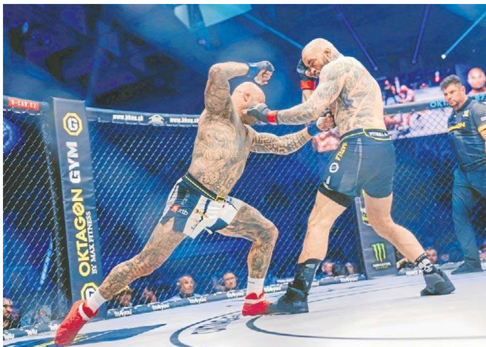
Czeska organizacja mieszanych sztuk walki Oktagon zaliczyła w Szczecinie udany debiut na polskiej ziemi

Po ogłoszeniu werdyktu i opuszczeniu klatki Gamrot skomentował swoje efektowne zwycięstwo: