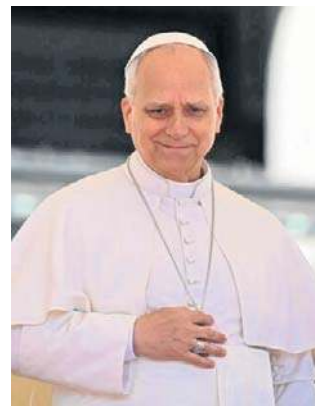
Papież odwiedzi 11 miast i miejscowości w Afryce

Papież będzie przemawiał po angielsku, francusku, portugalsku i hiszpańsku - zapowiedziano w Watykanie. W progra-