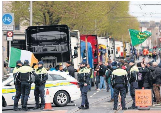
Protesty spowodowały poważne zakłócenia w ruchu w Dublinie i pozbawiły paliwa około jednej trzeciej stacji