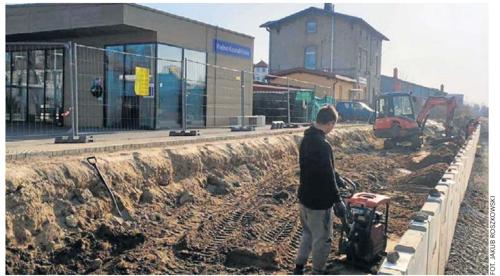
Inwestycja obejmuje wydłużenie peronu dla szynobusu relacji Koszalin - Mielno

Rozbudowa Mieleńskiego Centrum Przesiadkowego jest projektem realizowanym w ramach programu Fundusze Europejskie na Infrastrukturę, Kli-