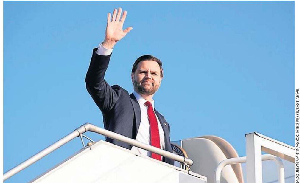
Wiceprezydent USA J.D. Vance opuścił w niedzielę Islamabad po fiasku rozmów z Iranem na temat pokoju na Bliskim Wschodzie

- Zła wiadomość jest taka, że nie osiągnęliśmy porozumienia. I myślę, że to zła wiadomość dla Iranu znacznie bardziej niż dla Stanów Zjednoczonych - powiedział Vance. - Jasno określiliśmy nasze czerwone linie, w jakich kwestiach jesteśmy gotowi im się przychylić, a w ja-