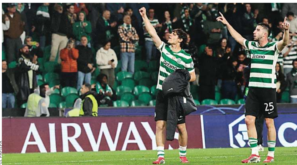
Pomeczowa radość piłkarzy Sportingu Lizbona

Pierwszy przypadek odrobienia trzybramkowej straty miał miejsce w sezonie 2003/04, gdy AC Milan pokonał Deportivo La Coruna 4:1, a później przegrał 0:4. Rekordzistą jest jednak Barcelona, bo jako jedyna awansowała do kolejnej rundy mimo czterobramkowej straty na półmetku rywalizacji. W sezonie 2016/17 prze-