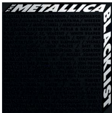
Metallica, THE METALLICA BLACKLIST, Universal

W utworze „The God That Failed” znakomicie odnalazł się lider IDLES Joe Talbot, zamieniając pomysły Metalliki w punkrockową ucztę. Ukojenie wrażeń przyjdzie w świetnej wersji akustycznej „Of Wolf And Man” oraz w „My Friend of Misery”, na którym skupił się jazzband Kamasiego Washingtona. Trzeba przyznać, że tu, przy pierwszym odsłuchu, znalezienie punktów wspólnych z oryginałami nie było proste. Większość utworów Metallici doczekała się zresztą na albumie co najmniej kilku wersji, przez co czteropłytowy box najlepiej smakować z przerwami. ■