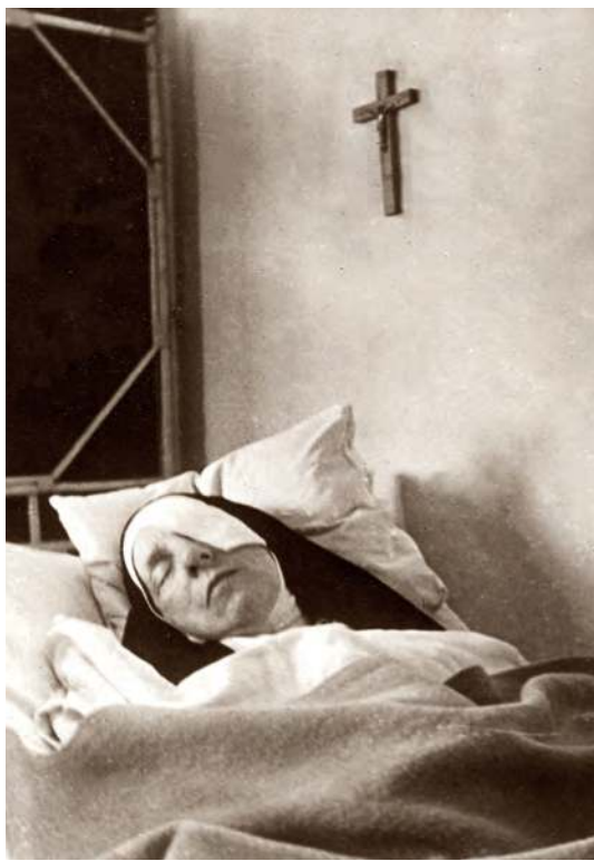
To jedno z jej ostatnich zdjęć. Zmorzona chorobą Matka Róża Czacka umiera w maju 1961 roku