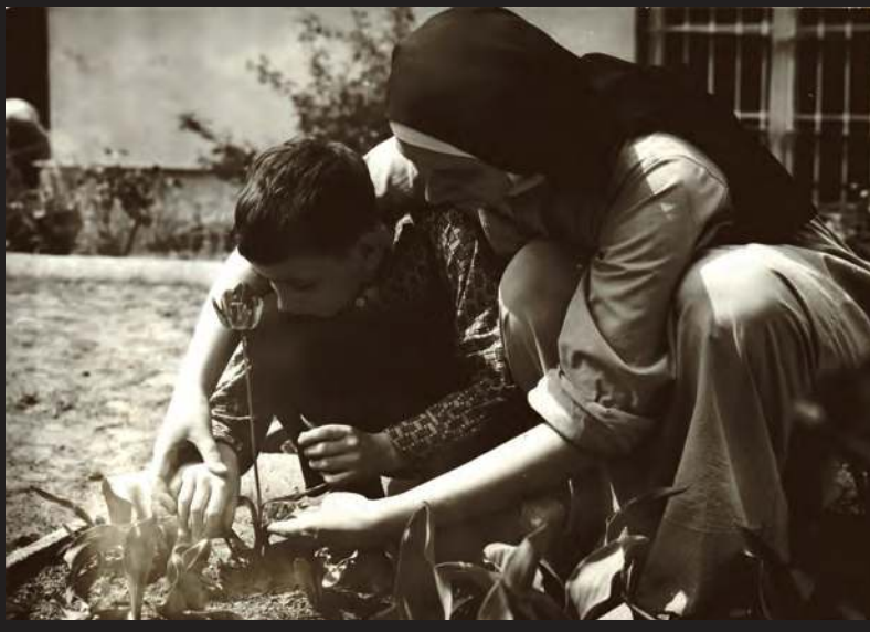
Podopieczni siostr rozpoczynają edukację w przedszkolu, ucząc się niezależności oraz samodzielności