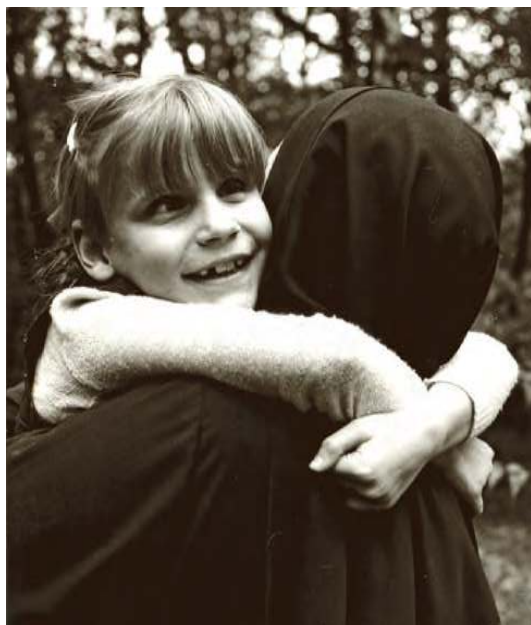
Marzeniem Matki Elżbiety było, by niewidomi stali się żywą tkanką społeczną