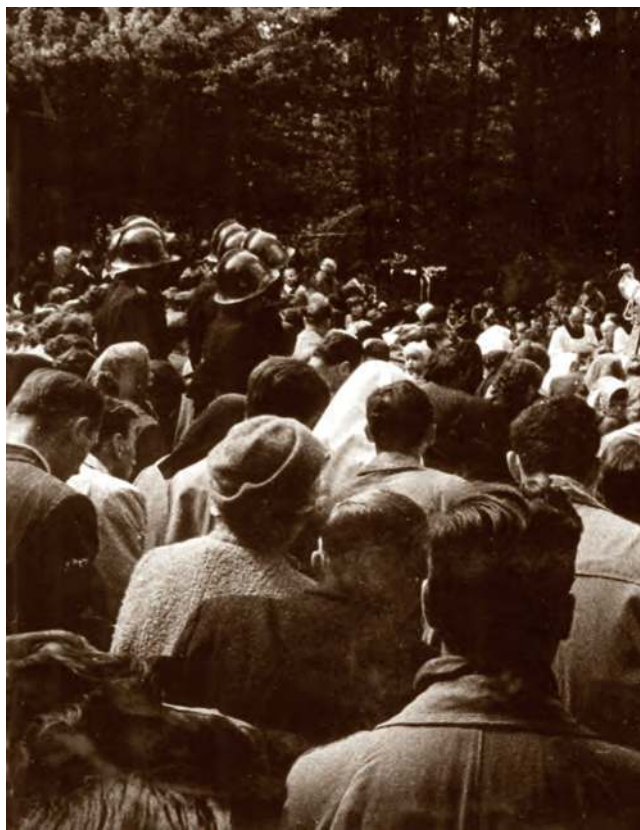
Tak wielu tak wiele jej zawdzięczało. Pogrzeb Matki Elżbiety był wydarzeniem ogólnokrajowym

Przez chwilę wspólnie oglądamy kolejne karty przyniesionej przez siostrę książki. Gruby brajlowski papier jest konieczny, aby „w drukowywane” dziurki