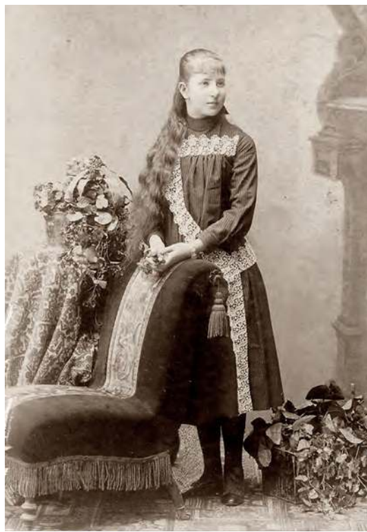
Jedynie Opatrzność wiedziała, jak wielkie dzieło czeka tę szesnastoletnią dziewczynę