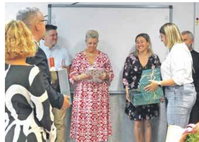
W Szkole Podstawowej w Nakle Śląskim otwarto świetlicę, która w wakacje przeszła remont