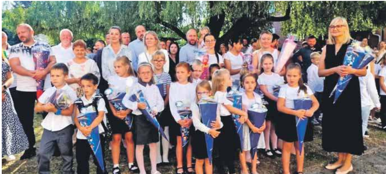
Tegoroczna inauguracja była wyjątkowa – po raz pierwszy władze Kalet ufundowały wszystkim pierwszoklasistom tradycyjne śląskie tyty

57 uczniów rozpoczęło naukę w klasach pierwszych w Kaletach. Do Publicznej Szkoły Podstawowej nr 1 trafiło 40 nowych uczniów, natomiast w ławach Publicznej Szkoły Podstawowej w Miotku zasiadło 17 pierwszoklasistów.