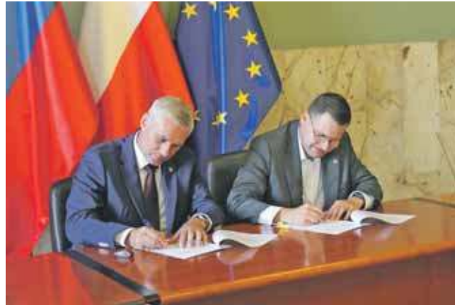
Samorządowcy podpisali umowę o przekazaniu historycznej bramy