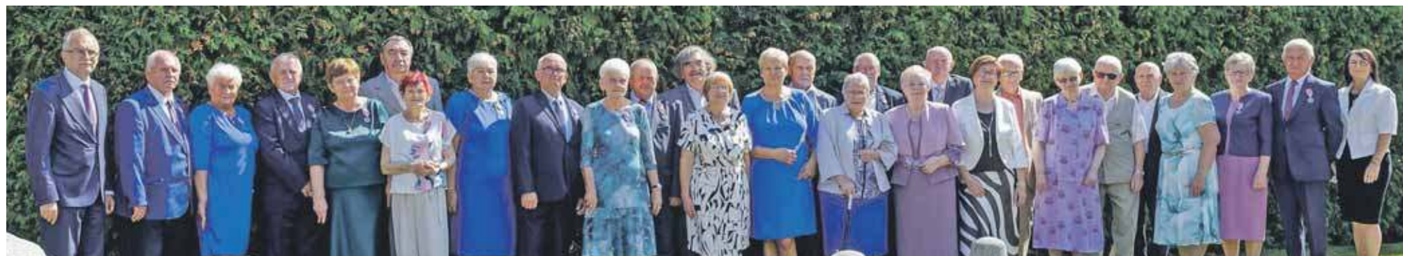
Złote i diamentowe pary z Radzionkowa