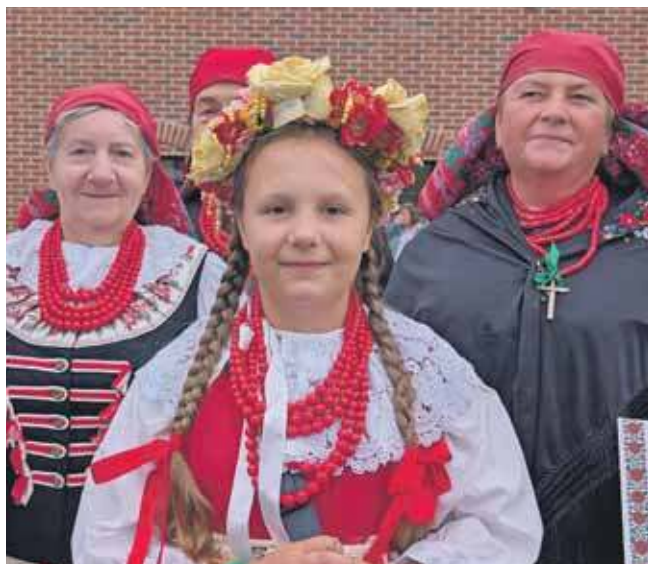
Na Rozbarku spotkaliśmy członków Zespołu Brynica

Do wydarzenia włączyły się także reprezentacje z naszego powiatu. Wśród bijących rekord można było dostrzec