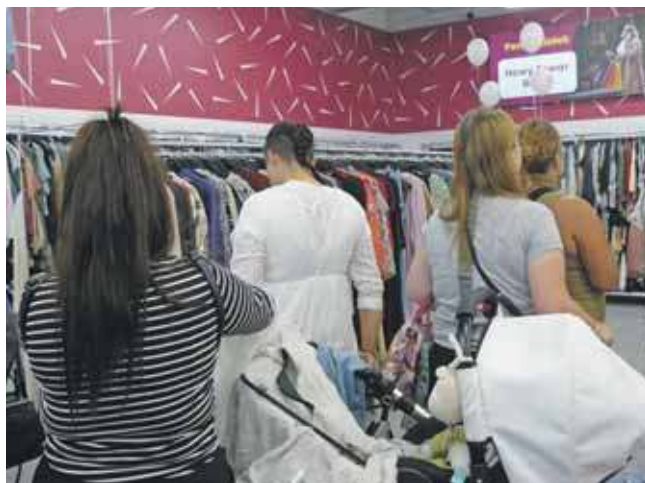
Najwięcej klientów było w sklepie z odzieżą używaną z wyższej półki Moda For Less