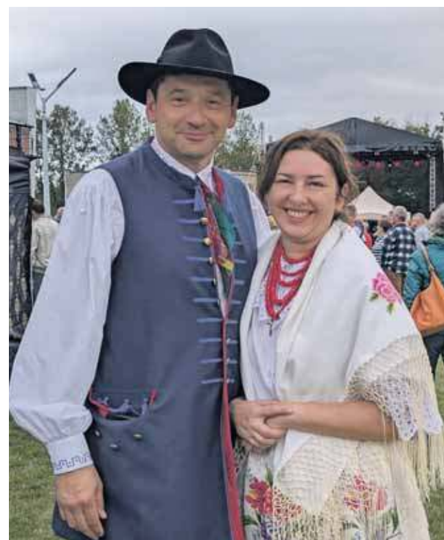
Silna reprezentacja Radzionkowa