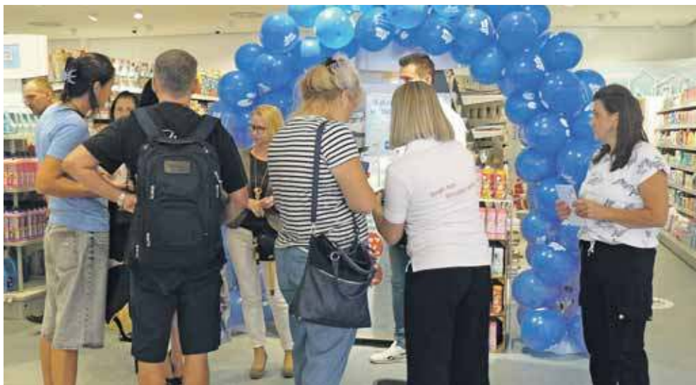
Sporym zainteresowaniem cieszyła się również drogeria DM