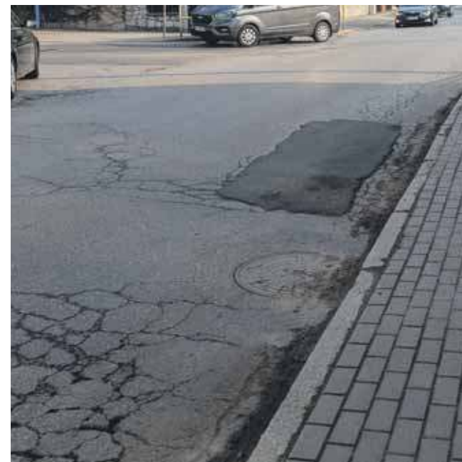
Powiat dostał pieniądze na remont ul. św. Wojciecha