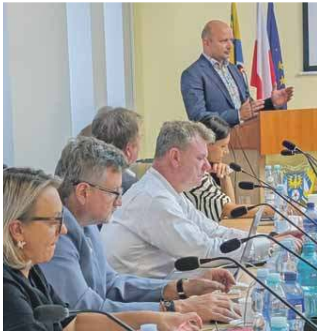
Pod koniec sierpnia odbyła się debata o trudnej sytuacji szpitala

Powiatowy szpital w Tarnowskich Górach zakończył 2024 rok z wynikiem finansowym na dużym minusie. Strata spółki wyniosła ponad 15 mln zł, czyli ponad dwukrotnie więcej niż rok wcześniej , kiedy deficyt zamknął się kwotą niecałych 6,7 mln zł.