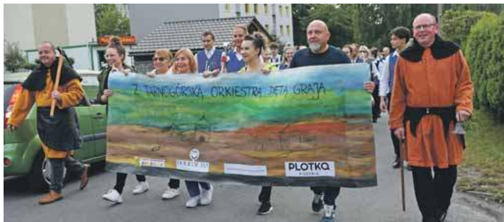
Na wydarzenie zaprosiła rada dzielnicy w Starych Tarnowicach