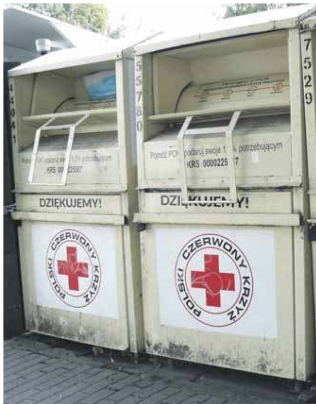
Kontener PCK przy ul. Kościuszki w Tarnowskich Górach. Jest porządek, ale czy wkrótce mieszkańcy nie będą tu podrzucać tekstyliów, które powinny trafić do PSZOK-u?

- Akurat jechałam do Miedar, więc tylko nadłożyłam trochę drogi. Była sobota, trafiłam na kolejkę. Zajęło mi to więc trochę czasu. Co z oso-