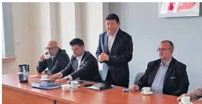
Podczas obrad podsumowano wyniki przetargu na zakup energii elektrycznej na 2026 rok

– oświetlenie przestrzeni publicznej – 447,01 zł/MWh (dla porównania w poprzed-