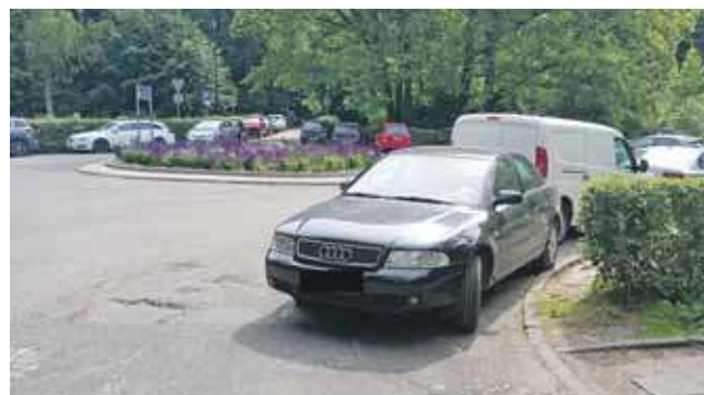
Kierowcy pozostawiają samochody, gdzie się tylko da, także na rondzie

Wezwany pod koniec lipca patrol nie potwierdził utrudnień, o których była mowa w zgłoszeniu. Prawdopodobnie samochody