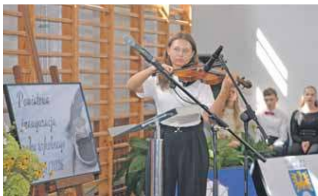
Nie zabrakło i części artystycznej – zaprezentowali się uczniowie I LO