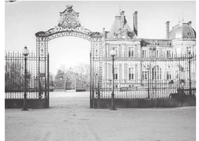
Boczna brama pałacowa w Świerklańcu

Słynny pałac Donnersmarcków tzw. Mały Wersal został zniszczony w wyniku grabieży i powojennych decyzji politycznych. W rozproszeniu przetrwały po nim pamiątki i pojedyncze elementy. Najbardziej roz-