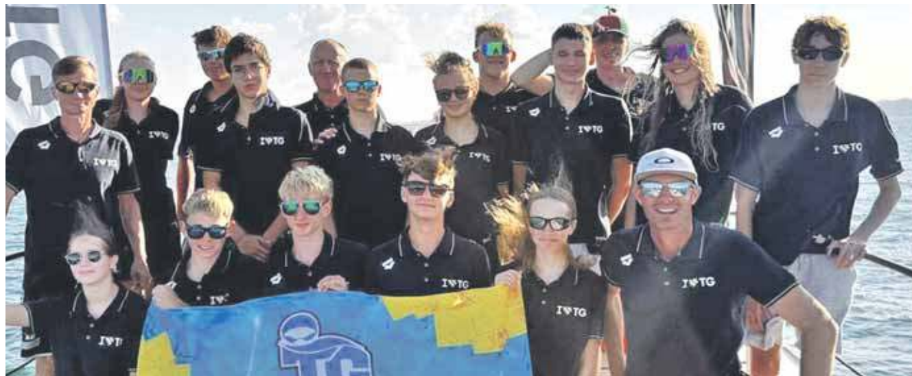
Młodzi pływacy z MKS Park Wodny Tarnowskie Góry przepłynęli jezioro Garda we Włoszech