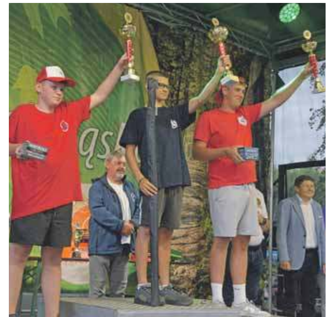
To oni triumfowali w kategorii U-16