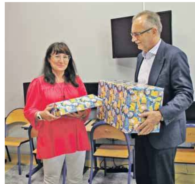
Prezent na dobry początek