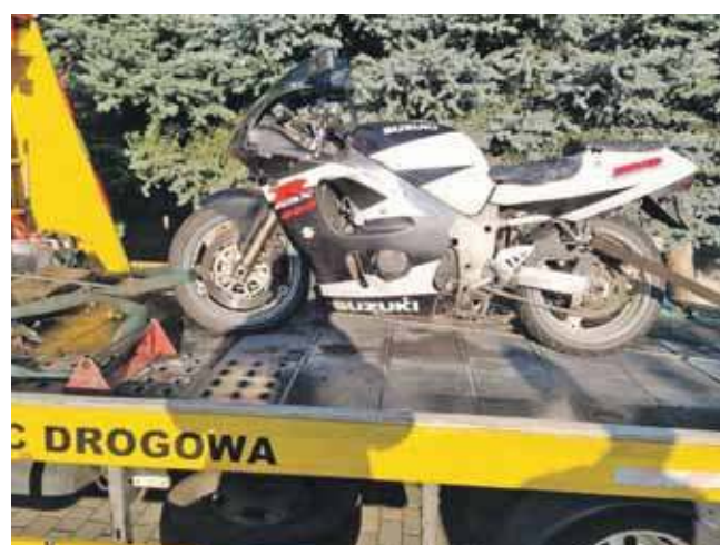
Stan techniczny jego suzuki pozostawiał wiele do życzenia, dlatego prosto z miejsca kontroli motor trafił na policyjny parking

We wtorek przed godziną 6 na ulicy Tarnogórskiej