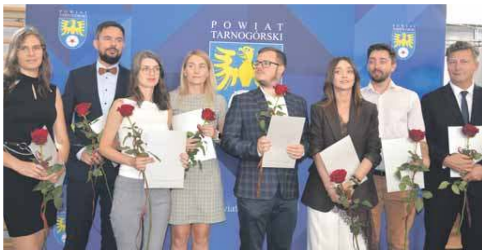
Wręczono akty nadania stopnia nauczyciela mianowanego

Inauguracja roku szkolnego była okazją do uhono-