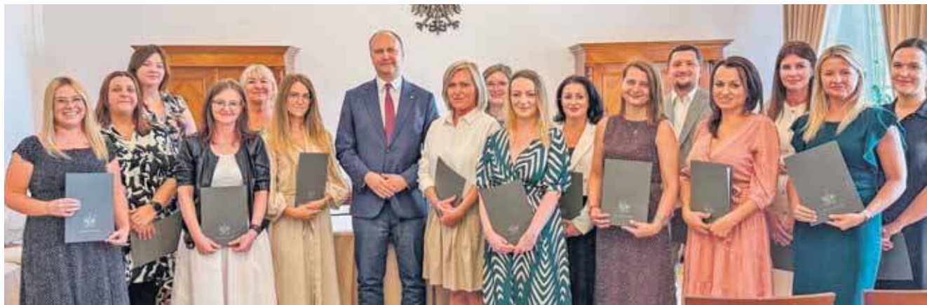
Awanse otrzymało 16 nauczycieli uczących w placówkach w Tarnowskich Górach

Cztery awansowane nauczycielki zdobyły wymagane kwalifikacje, odbyły staż zakończony pozytywną oceną dorobku zawodowego i uzyskały pozytywny wynik egzaminowania przed komisją egzaminacyjną. Do grona