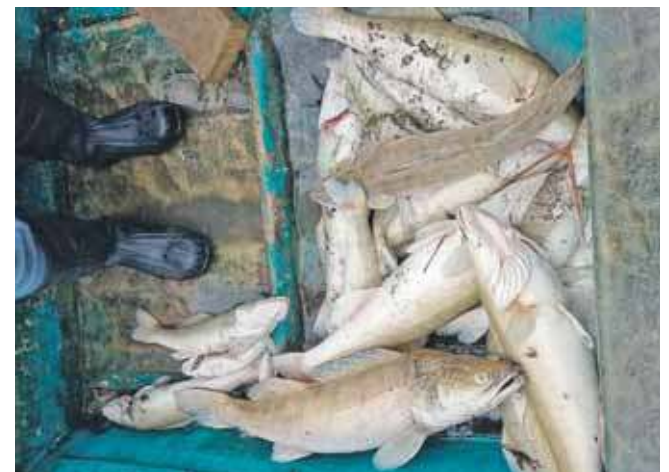
Kilka ton cennych ryb padło w wyniku braku tlenu w wodzie

Śnięcie sandaczy na taką skalę to poważna strata dla lokalnego środowiska wędkarskiego. – To jest najszla-