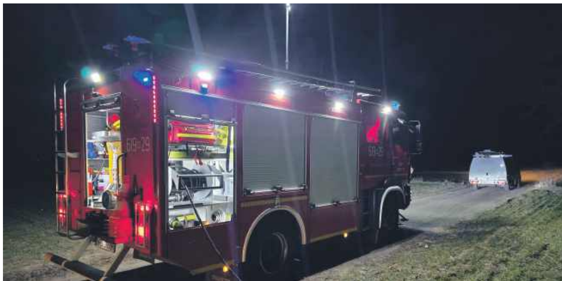
fol. FB OSP Obryte

■ Kamila Rud-Koluch reporter@pultusk24.pl