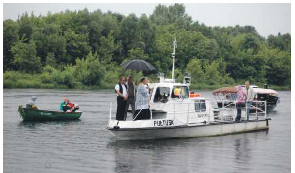
Kuter „Pułtusk” dzielnie służył podczas pułtuskich Wianków

Oczywiste jest, że obiekt – podobnie jak kuter – nie należy do samorządu, więc władze miejskie nie mogą bezpośrednio nim zarządzać. Mając jednak w pamięci