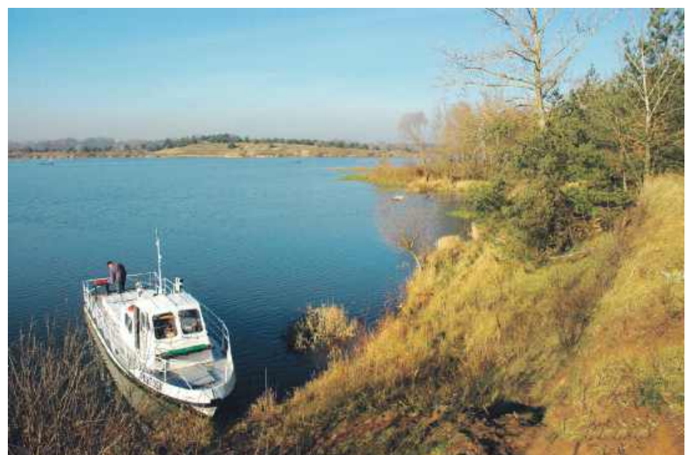
Dawno temu gdzieś na Gnojnie

to, co stało się z naszymi koszarami, wydaje się jasne, że gospodarz miasta dysponuje narzędziami i możliwościami perswazji, by skłonić właściciela do zadbania o obiekt znajdujący się w samym centrum miasta.