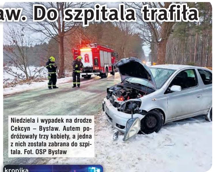
Niedziela i wypadek na drodze Cekcyn – Bysław. Autem podróżowały trzy kobiety, a jedna z nich została zabrana do szpitala.