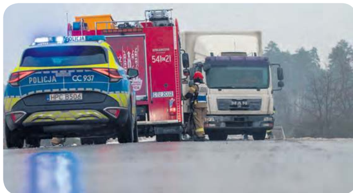
Obłędzenie drogi Tuchola – Czersk, godziny przedpołudniowe, 14 stycznia.

Generalnie jednak tego poranka kierowcy poruszali się po naszych drogach z wielką ostrożnością. Mniej więcej