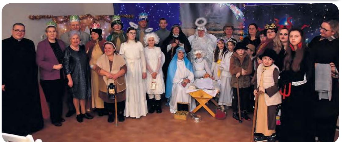
Orszak i jasełka to wydarzenia, które gromadzą mieszkańców i wzmacniają więzi.