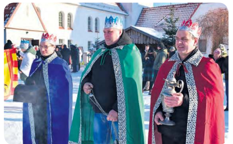
W postaci Mędrców ze Wschodu wcielili się członkowie KGW „Bractwo Mężczyzn”.

Przy źłóbku wierni wraz z Trzema Królami oddali pokłon Nowonarodzonemu, a monarchowie złożyli symboliczne dary: