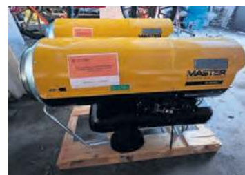
Wśród zakupionych przedmiotów znalazły się nagrzewnice.