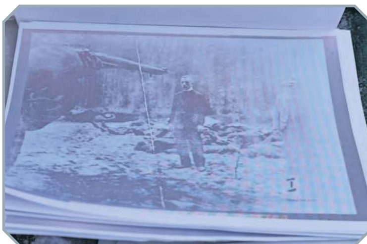
Realizatorzy filmu zapoznają się z aktami prokuratorskimi i przesłuchaniami świadków wydarzeń w Tucholi i Rudzkim Moście z początku II wojny światowej. Między innymi na ich podstawie tworzą scenariusz filmu.