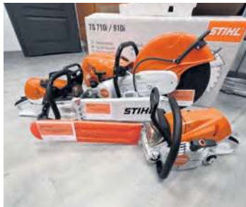
Pilarki otrzymały jednostki OSP.

Dużo mówi się o tym, że w trwającym już 2026 roku ma być ponowna okazja