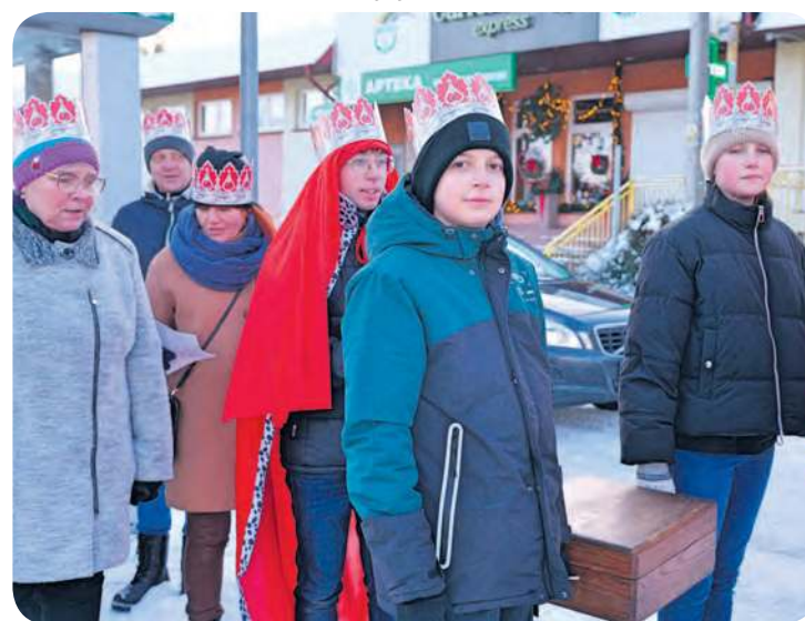
Trzy marsze wyruszyły z różnych stron Gostycyna, by spotkać się u wspólnego celu: przy stajence naprzeciwko kościoła.