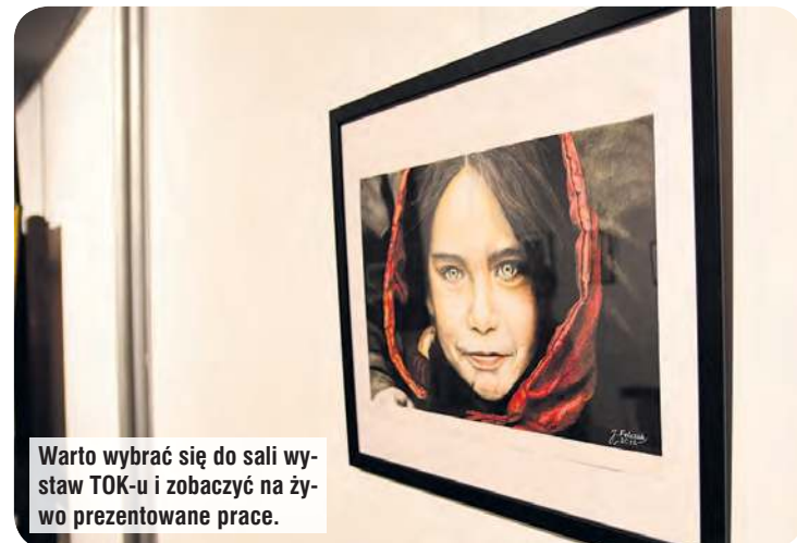
Warto wybrać się do sali wystaw TOK-u i zobaczyć na żywo prezentowane prace.

– Konie fascynowały mnie od dziecka. Miałem też mały