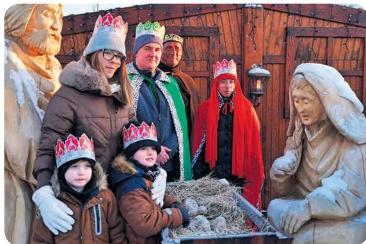
Sesja zdjęciowa z trzema królami? W XXI wieku to możliwe.

Miejscem docelowym miała być stajenka znajdująca się na placu księdza Nagórskiego. Tam dotarło już wspólnie Trzech Króli z potężną proce-