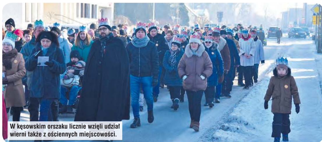
W kęsowskim orszaku licznie wzięli udział wierni także z ościennych miejscowości.