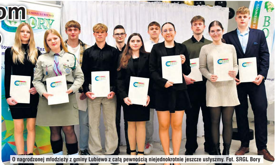
O nagrodzonej młodzieży z gminy Lubiewo z całą pewnością niejednokrotnie jeszcze usłyszymy.