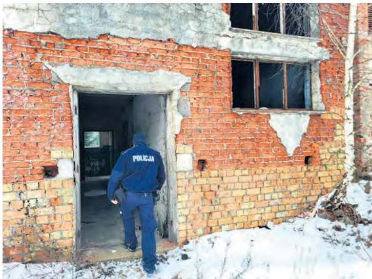
W ramach prowadzonych działań policjanci sprawdzają m.in. pustostany.

– Mundurowi każdego roku monitorują sytuację tych osób oraz sami oferują pomoc każdemu, kto jej potrzebuje. Funkcjonariusze oraz pracownicy socjalni, odnajdując takie osoby, zawsze proponują przewiezienie ich do ośrodków, w których jest ciepło, gdzie mogą zjeść ciepły