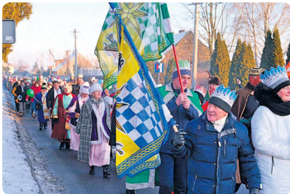
Okazał tłum na drodze wojewódzkiej w Gostycynie.

sją za plecami. Przy stajence z dużą dozą radości, spontaniczności i pozytywnej energii – bo właśnie nią charakteryzowało się wydarzenie w Gostycynie – królowie przekazali symboliczne dary, a potem... pozowali do wspólnych zdjęć albo selfie z uczestnikami orszaku. Na finał wszyscy mogli