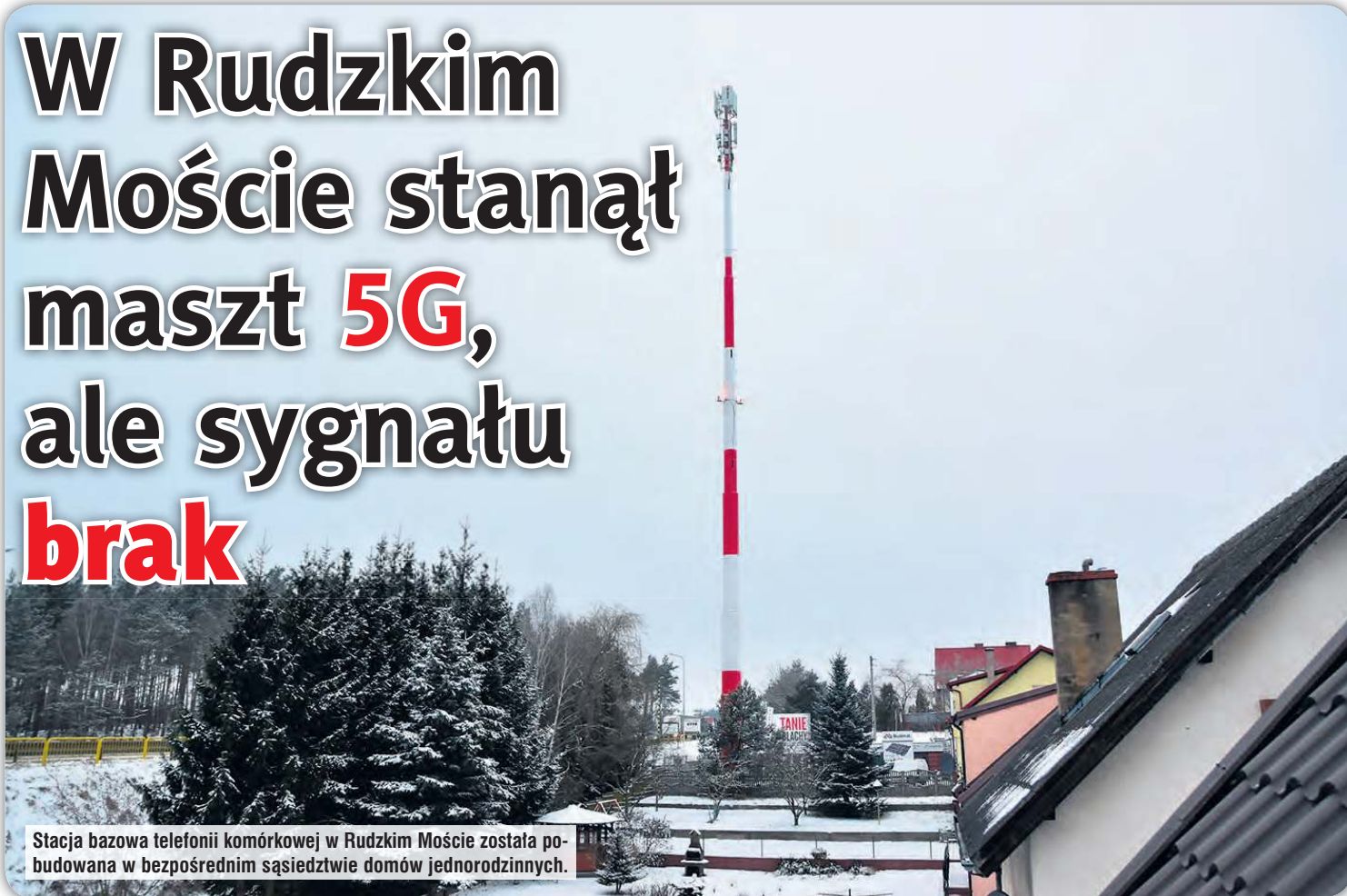
Stacja bazowa telefonii komórkowej w Rudzkim Moście została pobudowana w bezpośrednim sąsiedztwie domów jednorodzinnych.

Po półtora roku od publikacji naszego pierwszego artykułu – na temat planów budowy stacji bazowej telefonii komórkowej na osiedlu Rudzki Most w Tucholi – inwestycja doczekała się realizacji. Nadal jednak budzi skrajne emocje wśród mieszkańców. Jedni czekają na poprawę zasięgu, inni sprzeciwiają się inwestycji i oczekują rozstrzygnięcia skarg w WSA i NSA.