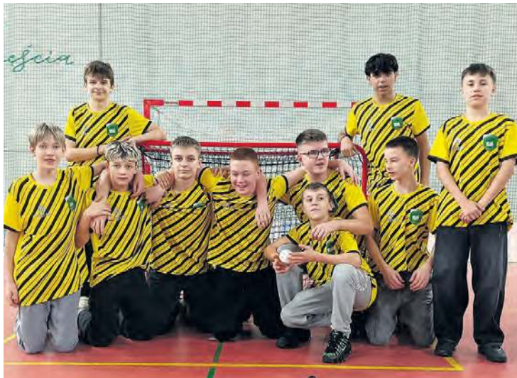
Mistrzowie województwa kujawsko-pomorskiego w unihokeju – uczniowie z Lubiewa.

Było to dość kameralne wydarzenie, ponieważ w ścisłym, kujawsko-pomorskim finale zaprezentowały się cztery szkoły z naszego województwa. Chłopcy z Lubiewa wygrali