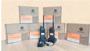
Dzięki pozyskanym środkom z Kujawsko-Pomorskiego Urzędu Wojewódzkiego w Bydgoszczy gmina Lubiewo zrealizowała zakupy za 444.817,14 zł.

do otrzymania dodatkowej kasy z zakresu ochrony ludności i obrony cywilnej. Dopytujemy stojącą na czele gminy Lubiewo, na co mogłoby trafić kolejne dofinansowanie.