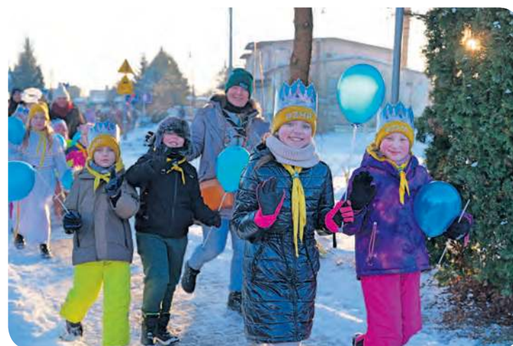
Harcerska młodzież na ulicach Gostycyna.