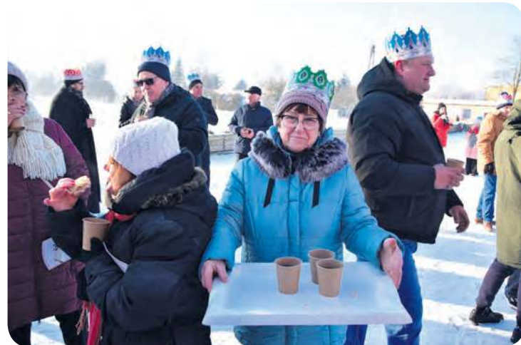
Po orszaku panie z KGW w Kęsowie częstowały świąteczną herbatą.

Formowanie orszaku miało miejsce na placu przed Kościołem pw. św. Bernarda po mszy