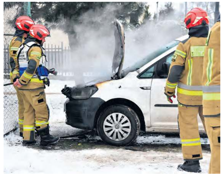
Strażacy podali jeden prąd wody w natarciu na palącą się komorę silnika.

Czynnościami lokalnych służb na ul. Kościuszki w Tucholi przyglądaliśmy się w środy (7 stycznia) poranek. Jaką przypuszczalną przyczynę pożaru samochodu wskazują przedstawiciele mundurowych?