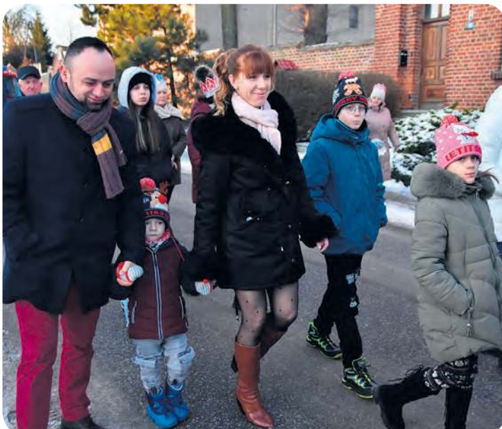
Wydarzenie cieszyło się zainteresowaniem całych rodzin.

Orszak ulicami Bysławka przeszedł do świetlicy wiejskiej. Na jego czele szli... dwaj królowie i królowa, anioły, nawet zwierzęta – alpaki. Wszystko przy akompaniamencie Orkiestry Dętej Ochotniczej Straży Pożarnej w Bysławiu. W świetlicy mieszkańcy Bysławka zagrali w jaseł-