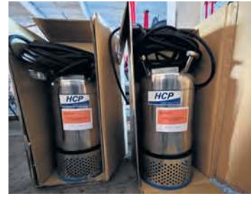
Pompy do zanieczyszczonej wody wydają się być bardzo dobrym zakupem.

– Tym razem chcielibyśmy pójść w projektowanie magazynu obronności cywilnej i stwo-