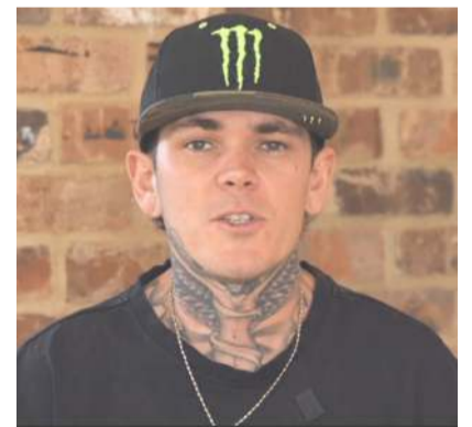
Nie wiem, kto to zaczął, ale to kompletne bzdury - reaguje Tai Woffinden.

mają pojęcia. Dzwonią do klubów i pytają, czy Tai będzie jeździł w tym roku, a przecież nikt wcześniej nie dostał ode mnie żadnego sygnału, że miałoby być inaczej - dodał.