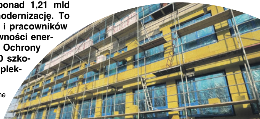
Zespół Szkół Ogólnokształcących nr 3 w Olsztynie, fot. NFOŚiGW

Istotną kwestią w ramach programu jest przeprowadzenie działań edukacyjnych i prozdrowotnych, które podniosą świadomość dzieci i nauczycieli w zakresie poprawy jakości powietrza, przeciwdziałania trendom zmian klimatycznych i wykorzystania OZE. W szkołach prowadzone będą również inicjatywy promujące aktywność fizyczną na świeżym powietrzu. Jest to dodatkowe wsparcie, które pozwala nauczycielom rozwijać u uczniów świadomość klimatyczną i ekologiczną. W efekcie nauczyciele zyskują lepsze warunki pracy, a szkoły stają się miejscem, w którym edukacja idzie w parze z troską o zdrowie, bezpieczeństwo i przyszłość młodego pokolenia. Już 330 placówek ze 141 miejscowości skorzysta z bezzwrotnych dotacji. W programie zawarto umowy na łączną kwotę 1 miliarda 221 milionów złotych.