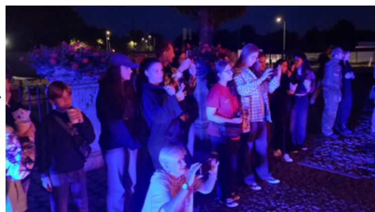
Fot. Młodzieżowa Rada Powiatu Wołowskiego