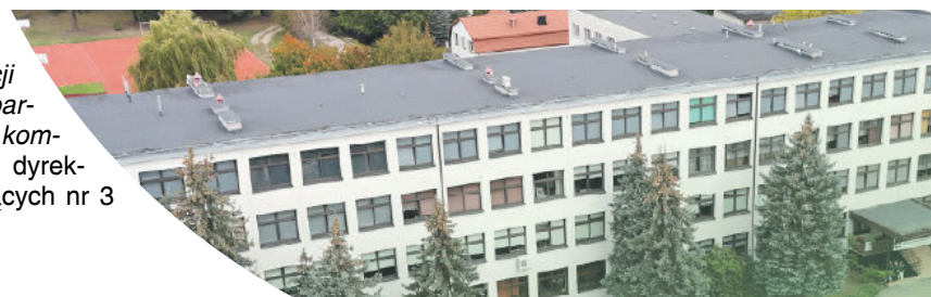
Zespół Szkół nr 1 w Koziencach

Program „Wymiana źródeł ciepła i poprawa efektywności energetycznej szkół” nastawiony jest na wysoką efektywność, bo plany inwestycyjne samorządów muszą wynikać z audytów energetycznych, a zapotrzebowanie na energię pierwotną budynku powinno spaść, co najmniej o 30%. Działania podlegające finansowaniu muszą być zgodne z zasadą „niewyrządzania znaczącej szkody środowisku” (DNSH – „do no significant harm”).