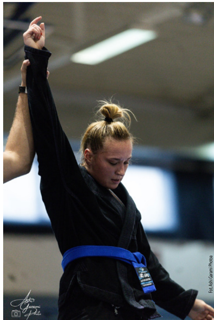
Medalistka i zawodniczka Checkmat Wołów.