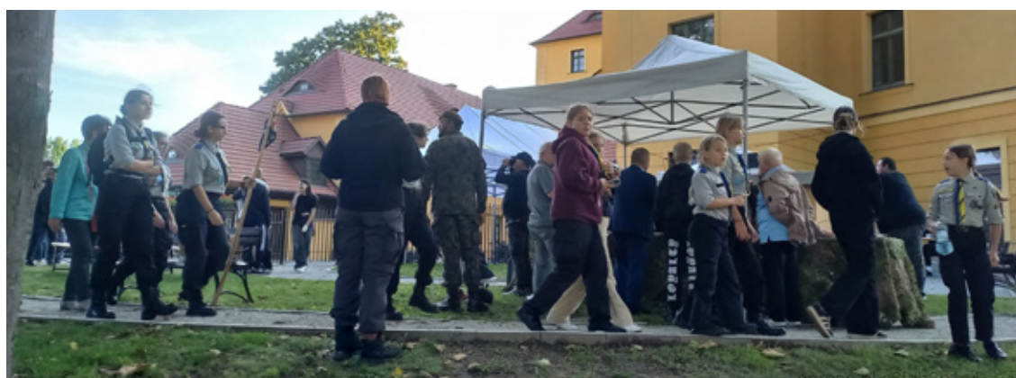
Fot. Młodzieżowa Rada Powiatu Wołowskiego