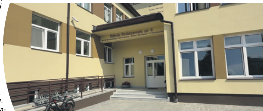
Szkoła Podstawowa nr 4 w Ciechanowie