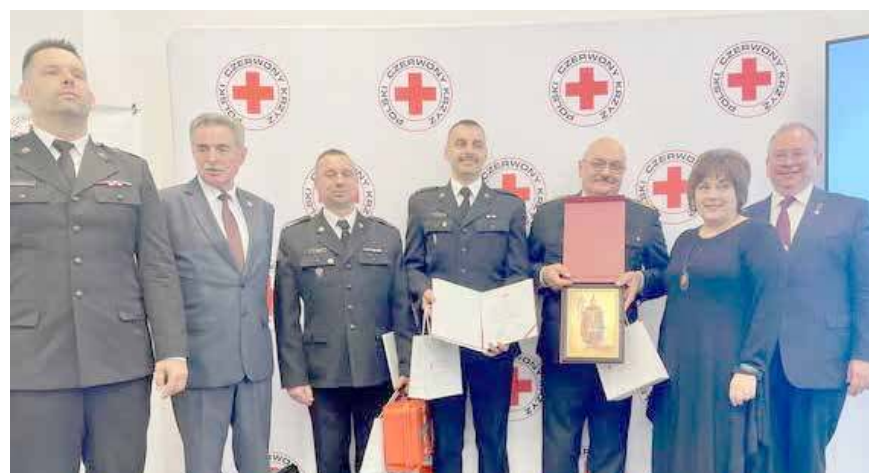
Goleniowska jednostka PSP została wyróżniona

Goleniowska Komenda Państwowej Straży Pożarnej została zwycięzcą dziewiętnastej edycji ogólnopolskiego programu „Ognisty Ratownik – Gorąca Krew”. Wyróżnia on jednostki, które systematycznie angażują się w działania na rzecz krwiodawstwa.