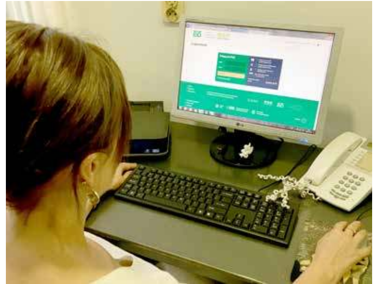
Zdjęcie stanowiska pracy