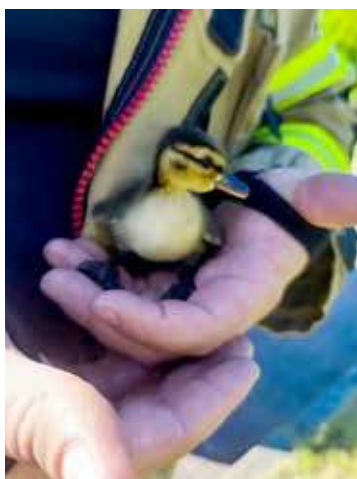
Jedna z małych bohaterów całej tej opowieści

Po przybyciu na miejsce treść zgłoszenia potwierdziła się. Na dnie studzienki znajdowały się małe kaczki, które nie mogły się wydostać. Koniecznie trzeba było więc im pomóc. Studzienka została oświetlona. Przy pomocy podbieraka do ryb oraz podręcznego bosaka udało się zagonić pechowe kaczuchy do siatki. Po tej bez wątpienia stre-