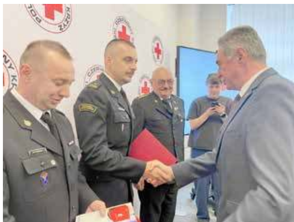
To efekt aktywnej pracy na rzecz krwiodawstwa

W piątek, 16 maja, w Warszawie odbyła się uroczysta gala dziewiętnastej edycji ogólnopolskiego programu „Ognisty Ratownik – Gorąca Krew”. Było to wydarzenie bardzo wyjątkowe dla goleniowskich strażaków. Komenda Powiatowa Państwowej Straży Pożarnej w Goleniowie została bowiem jego zwycięzcą.