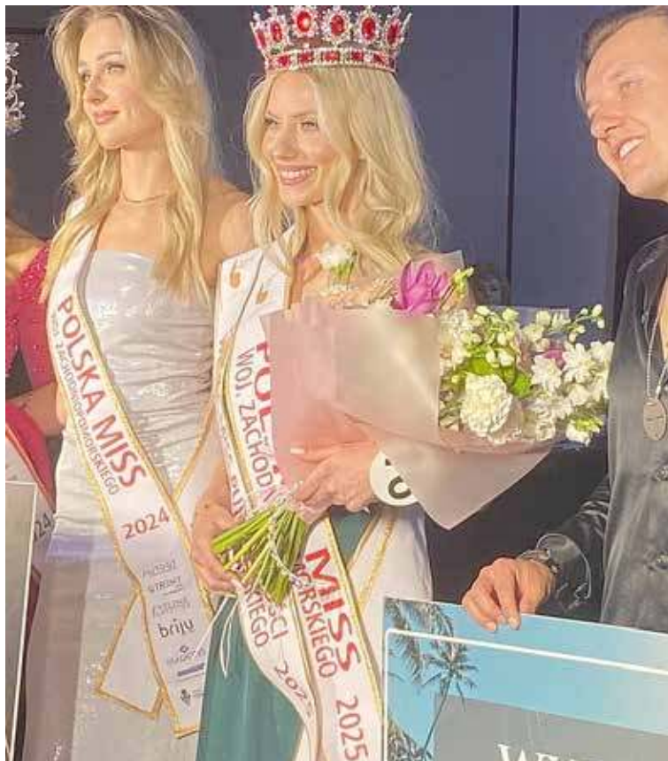
Miss Województwa Zachodniopomorskiego