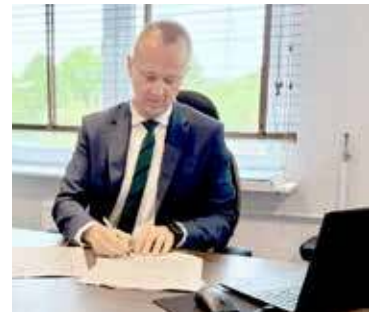
Umowa została podpisana

Władze Gminy Goleniów podpisały umowę na dofinansowanie projektu realizowanego przez Centrum Usług Społecznych w Goleniowie. Pozwoli ona na stworzenie miejsca odpoczynku i wytchnienia dla opiekunów, rodziców osób znajdujących się w ciężkim stanie, które tej opieki potrzebują.