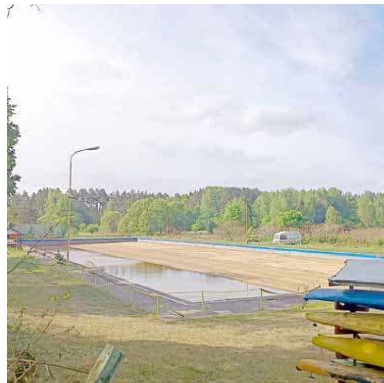
Basen od lat nie spełnia oczekiwań mieszkańców

- Wiemy, że ten obiekt nie funkcjonuje z oczekiwaniami mieszkańców. Da się wyczuć ten nastrój społeczny. My też uważamy, że on powinien funkcjonować w inny sposób. Natomiast to co się z nim wydarzy w najbliższych tygodniach i miesiącach ciężko jest mi powiedzieć. Jesteśmy uzależnieni