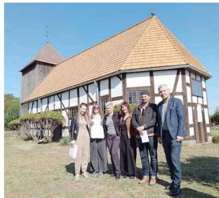
Remont kościoła dobiegł końca