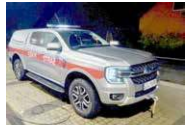
Nowy samochód trafił do jednostki

Został on zakupiony w ramach projektu dofinansowanego ze