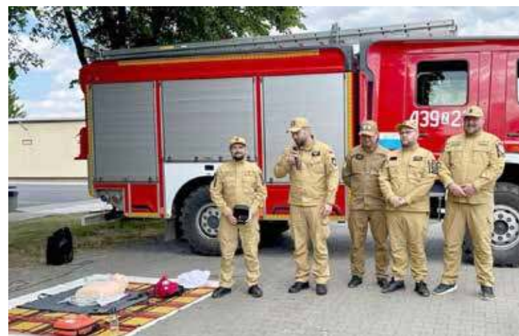
W Mostach odbył się Dzień BHP

przez cały czas, nawet gdy nie trzeba defibrylować. Podaje ono wyraźne komunikaty obrazowe i tekstowe na kolorowym ekranie. Pokazuje głębokość ucisków klatki piersiowej, zaś głosowe komendy informują o kolejnych czynnościach. Urządzenie monitoruje i analizuje rytm serca.