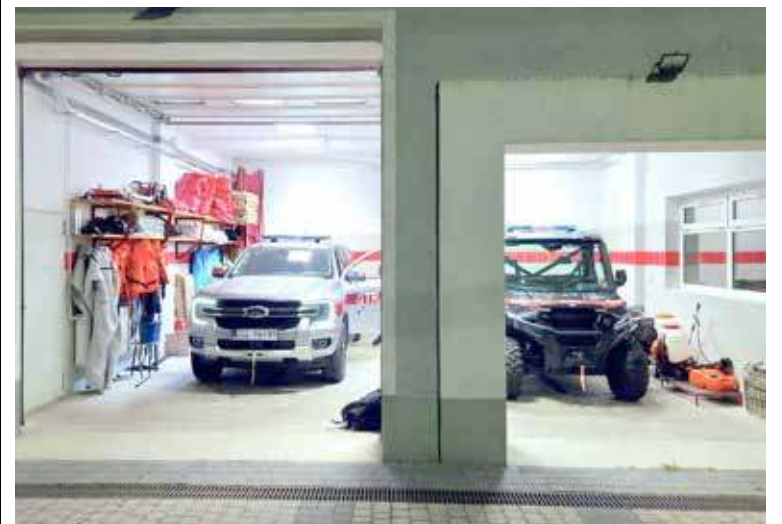
Pick-up i quad zakupione w ramach projektu