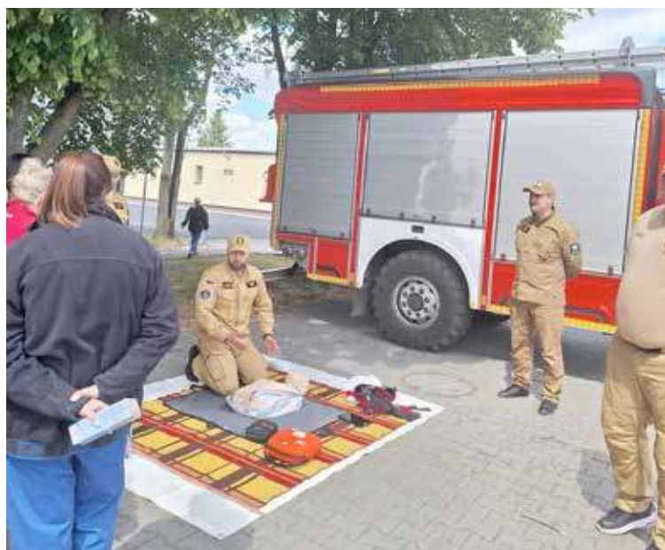
Prowadzone było szkolenie z obsługi AED

urządzenie zostało zaprojektowane w taki sposób, aby każdy był w stanie z niego skorzystać. Urządzenie automatycznie instruuje i prowadzi ratownika