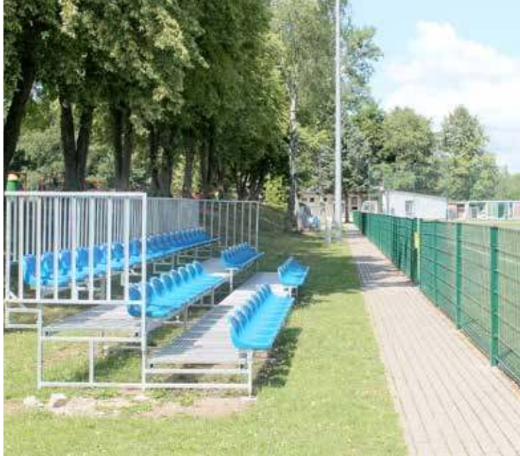
Siedziska zainstalowane przez Wiatra i jego ekipę na stadionie miejskim