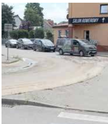
Spore ilości piachu i ziemi wraz z wodą dotarły aż w okolice postoju taksówek