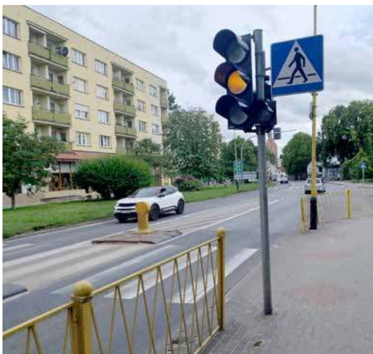
Od kilku dni sygnalizacja działa w trybie awaryjnym.jpg

Z niecodzienną sytuacją mają do czynienia kierowcy pojazdami i piesi, którzy korzystają z przejścia w obrębie skrzyżowania ulic Armii Krajowej, Warszawskiej i Kościuszki. Wszystko przez awarię sygnalizacji świetlnej, przez co urządzenia działają wyłącznie w trybie awaryjnym. Oznacza to, ni mniej, ni więcej, że kierowcy w przypadku tego skrzyżowania muszą kierować się ogólnymi zasadami ruchu drogowego. O ile zasady powinny być jasne, szczególnie dla tych posiadających prawo jazdy, to w praktyce bywa z tym różnie. O różnych zachowaniach mówią sami mieszkańcy, którzy skontaktowali się z DN.