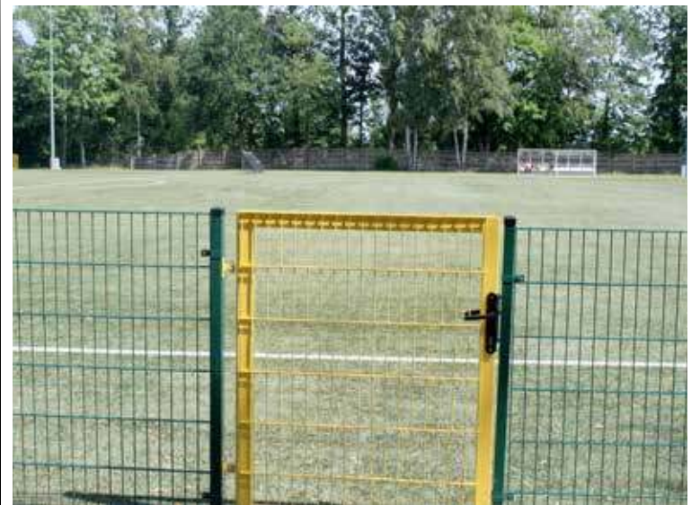
Taki widok ma przed oczyma kibic siedzący na trzecim (ostatnim) rzędzie siedzisk