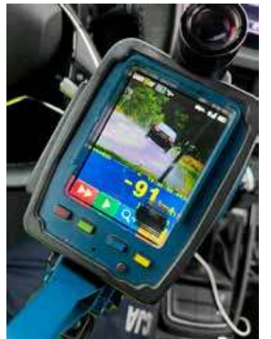
Kierujący stracił już uprawnienia do kierowania pojazdami

Policja za każdym razem apeluje do wszystkich kierowców o rozważę i stosowanie się do obowiązujących przepisów, aby wspólnie zadbać o bezpieczeństwo uczestników ruchu drogowego.