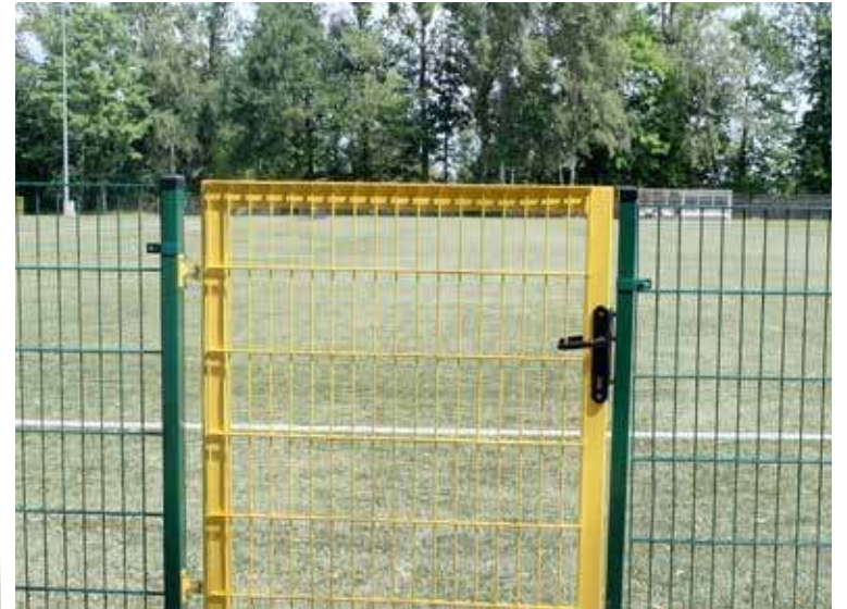
Taki widok ma przed oczyma kibic siedzący na drugim rzędzie siedzisk