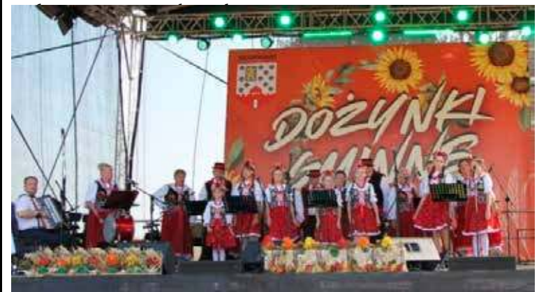
W ubiegłym roku gospodarzem dożynek była Ostrzyca