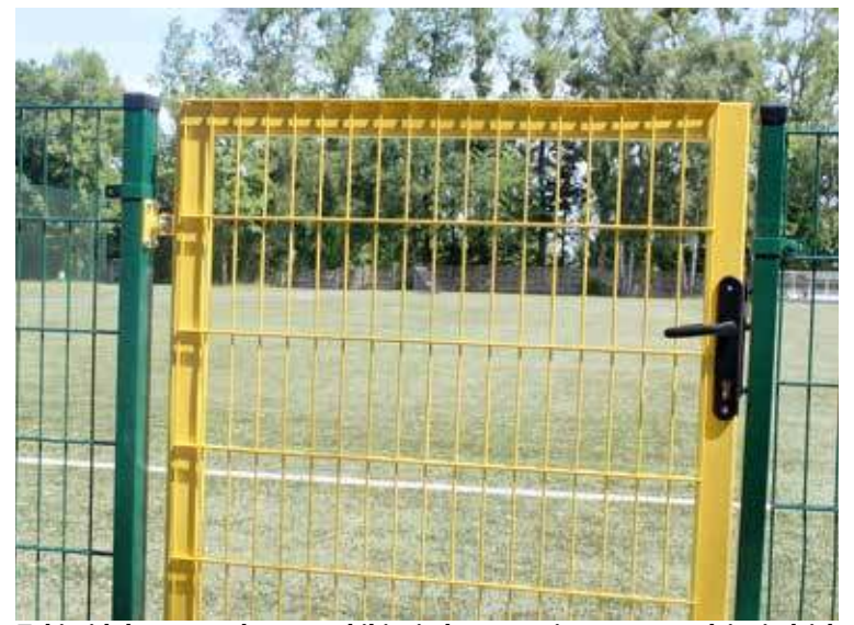
Taki widok ma przed oczyma kibic siedzący na pierwszym rzędzie siedzisk