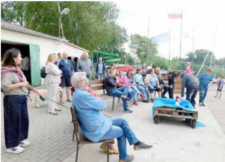
Obserwujący regaty z przystani żeglarskiej