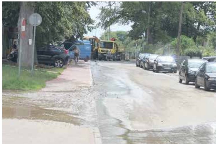
Źródło problemu zlokalizowano w okolicy wjazdu na teren placówki Poczty

- Przedsiębiorstwo Usług Wodnych i Sanitarnych” Spółka z o.o. w Nowogardzie informuje, że w związku z awarią sieci wodociągowej fi 300 na ul. Rzeszowskiego w miejscowości Nowogard, w obrębie ulic: Zielona, Bohaterów Warszawy, Mickiewicza, Kochanowskiego, Reymonta oraz w m. Kulice, Ostrzyca nastąpi przerwa w dostawie wody przeznaczonej do