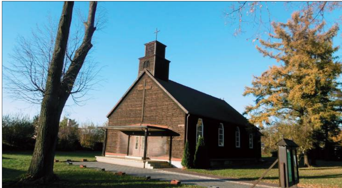
Ewangelicka świątynia w Mikulczycach.