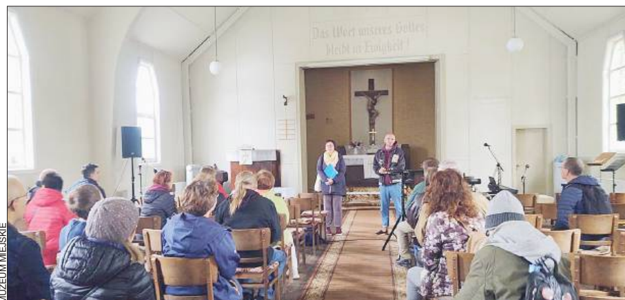
Wnętrze mikulczyckiej świątyni.