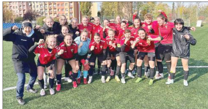
KKS GÓRNIK – MITECH (5-2). Wielka radość zabrzańskich piłkarzy po drugim w tym sezonie zwycięstwie.