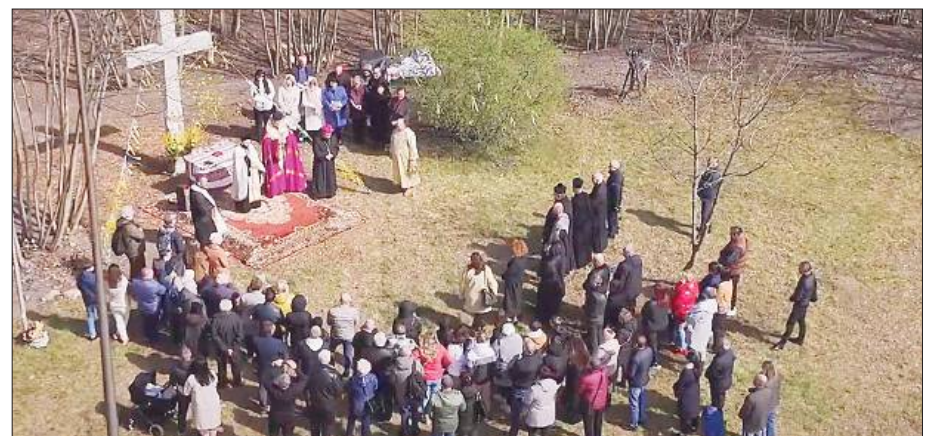
Teren pod cerkiew w Opolu.