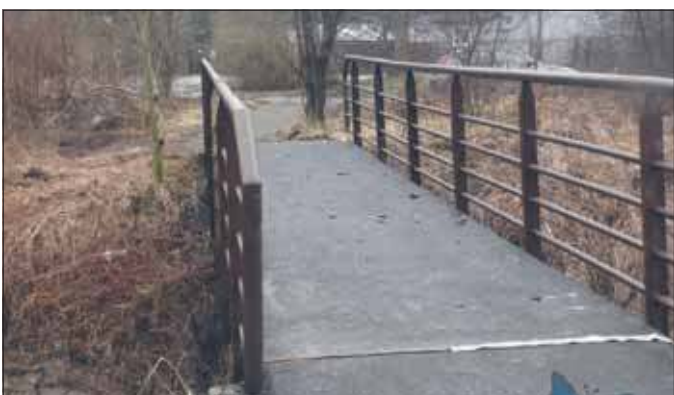
Kładka nad Kozim Brodem

Zarastała trawą, a teraz już utwardzona. Kładka nad Kozim Brodem przy ul. Pasternik doczekała się prac remontowych.