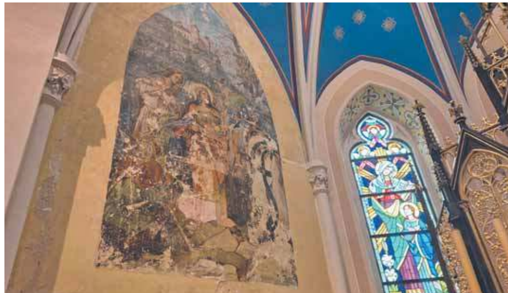
Fresk ze sceną rodzajową przedstawiającą św. Elżbietę

Prowadzenie prac konserwatorskich w tak szerokim zakresie wymaga wielkich funduszy. Projekt renowacji wnętrza kościoła, oraz renowacja grotty polowej i muru wokół kościoła w znacznej części są finansowane z Rządowego Programu Odbudowy Zabytków. Jednak w trakcie