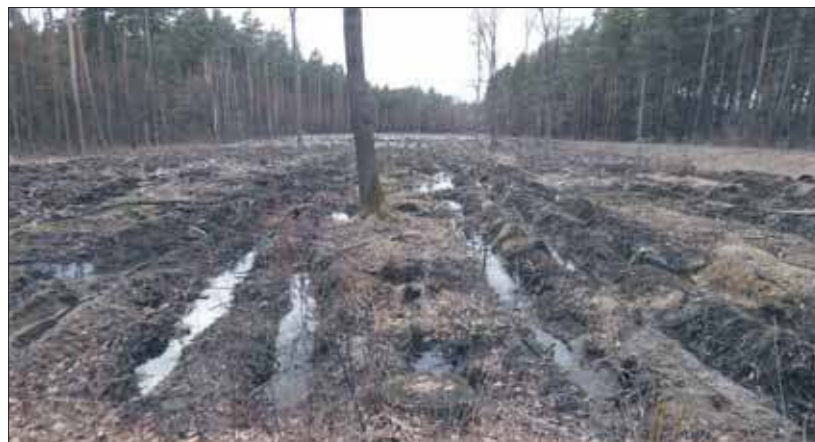
Był sobie las

Nie tak dawno rząd wdrożył nowe zasady prowadzenia gospodarki leśnej. Między innymi obszarem specjalnej troski mają być drzewostany