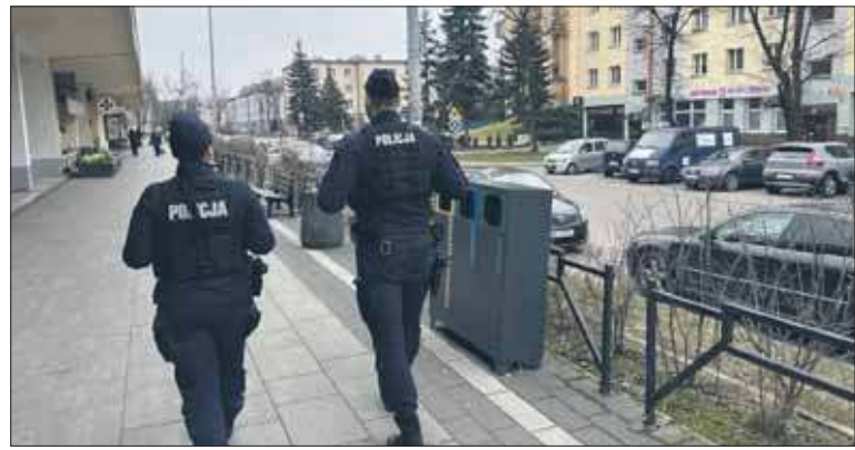
Patrole na Osiedlu Stałym

Policjanci z Komendy Miejskiej Policji w Jaworznie wspólnie z policjantami z Oddzia-