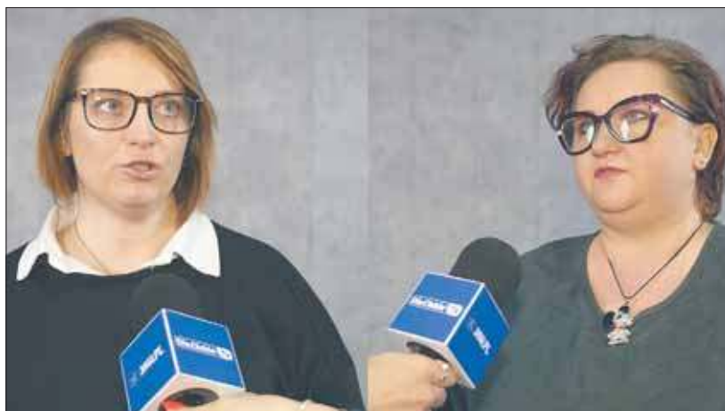
Rodzice walczą o przyszłość swoich dzieci

Mamy liczyły, że ich apel zo- stanie wysłuchany, a miasto po- dejmie konkretne działania. Za-