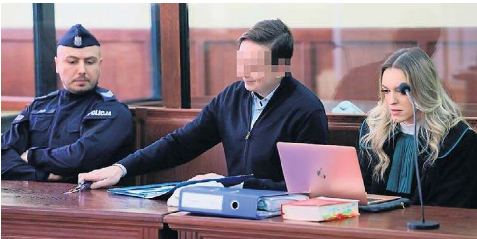
Oskarżonemu grozi do 8 lat więzienia. Proces przed sądem w Piotrkowie Trybunalskim zbliża się do końca

W reportażu pojawia się również głos ojca Patryka, który zgi-