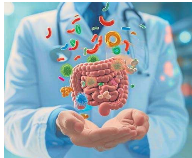
Mikrobiota jelitowa może być ważnym elementem układanki w leczeniu otyłości

Poprzez popularyzację badań, szkolenia i działania medialne Instytut zachęca do refleksji nad wpływem leków na mikrobiom, promując przy tym podejście One Health oraz globalną współpracę w przeciwdziałaniu oporności na antybiotyki.