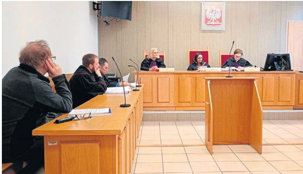
W drugiej instancji sprawa toczy się przed Sądem Okręgowym w Rybniku

- Syn był zdziwiony. Podszedł do okienka i powiedział, że go boli, wskazując na klatkę