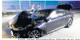
FOT. KMP PIOTRKÓW TRYBUNALSKI

W wypadku na A1 zginęła rodzina z Myszkowa. Bliscy ofiar przerywają milczenie str. 5