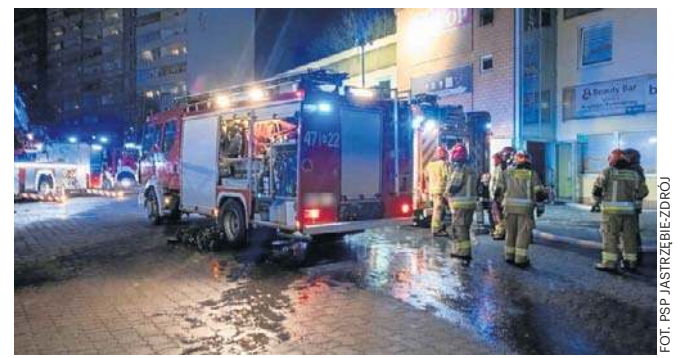
Strażacy gasili pożar w budynku usługowym przy ulicy Harcerskiej w Jastrzębiu-Zdroju

Po przybyciu pierwszych zastępów straży pożarnej na miejsce zdarzenia potwierdzono zadymienie wydobywające się z okien oraz z dachu obiektu. Pożar rozwijał się w pomieszczeniu solarium zlokalizowanym na pierwszym