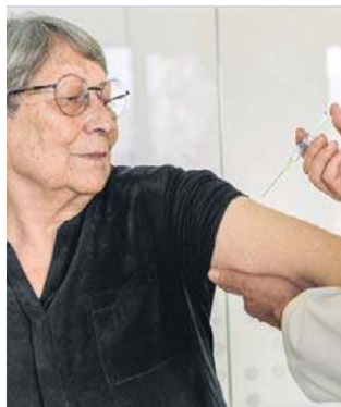
Seniorzy też zyskują dzięki szczepieniu przeciw HPV

– Dane te bezpośrednio podważają przestarzałe wytyczne, że szczepionka „działa tylko przed ekspozycją”. Dowody wskazują, że może być skutecznym narzędziem w walce z istniejącymi zakażeniami HPV i zapobieganiu nawrotom raka, nawet po diagnozie – tłumaczy specjalistka.