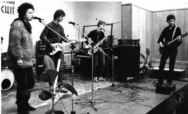
«Оселедць» (Ольштин, 1986)