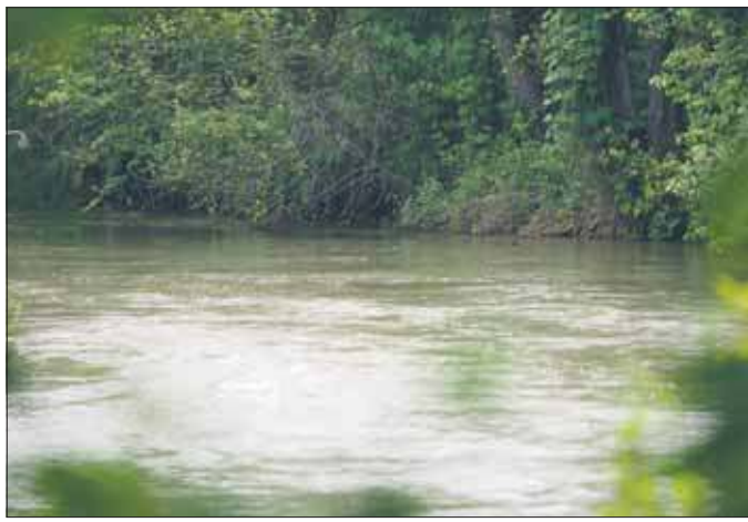
Biała Przemsza

Rzeka ta swoje źródła ma w okolicach Wolbromia, ujście swoje znajduje natomiast w miejscu, które do historii przeszło pod nazwą Trójkąta Trzech Cesarzy. To w tym właśnie miejscu Biała Przemsza styka się z Przemszą Czarną, tworząc Przemszę. W połowie swego biegu interesująca nas rzeka przecina na niemal dwie równe części Pustynię Błędną. Warto przypomnieć w tym miejscu, że pustynia ta jest jedyną w Europie, jest poza tym tworem o pochodzeniu antropogenicznym. Oznacza to, że pustynię tę stworzył...człowiek. Piaszczyste gleby, pod wpływem górniczej eksploatacji człowieka, która spowodowała obniżenie się poziomu wód gruntowych, wysychały, roślin-