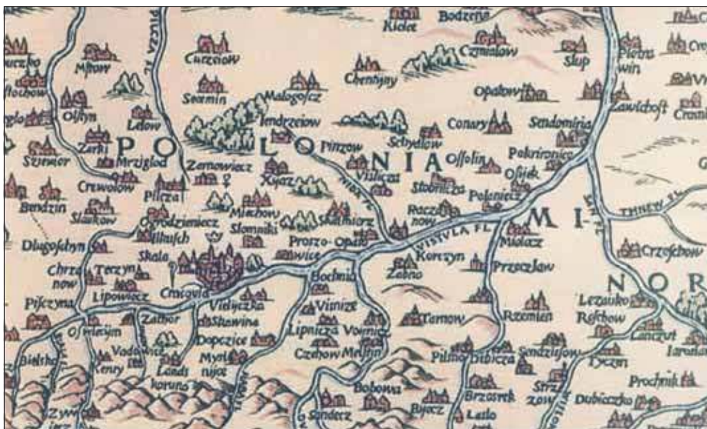
Długoszyn na mapach Polski i Europy wydanych w XVI-XVIII w.

Powodem powstania tego pierwszego przedsiębiorstwa kapitalistycznego (co ciekawe w państwie feudalnym) były złoża galeny (rud ołowiu i srebra), które występowały w Długoszynie. Właśnie to bogactwo naturalne i płynące z jego wydobywania zyski były powodem podziału wsi na część królewską i biskupią. Do dzisiaj starzy mieszkańcy Długoszyńska nazywają tereny w południowej części dzielnicy, jako „królewskie”. Również inne lokalne nazwy mają swój wielowiekowy rodowód. Np. część dzielnicy o nazwie „Srebr-